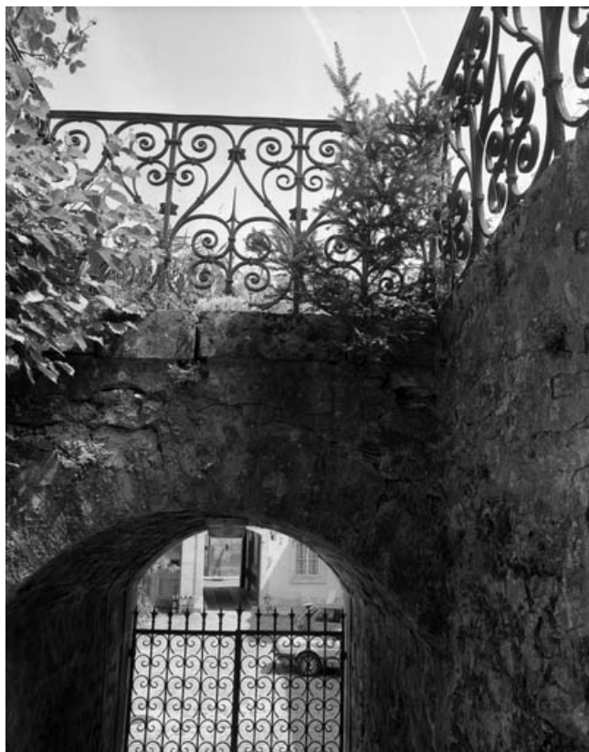
Détail du parapet de l'escalier du jardin.