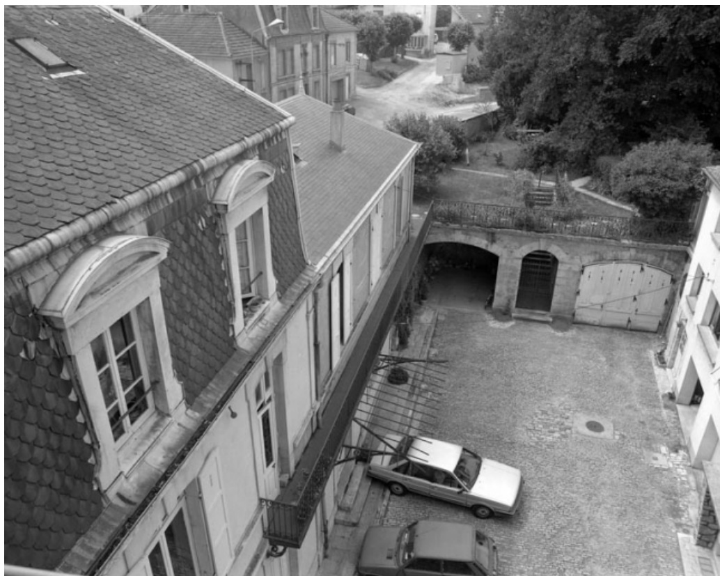
La cour et le jardin depuis le deuxième étage du corps de bâtiment sur rue. 70, Gray Grande Rue 19, 19 bis, 21