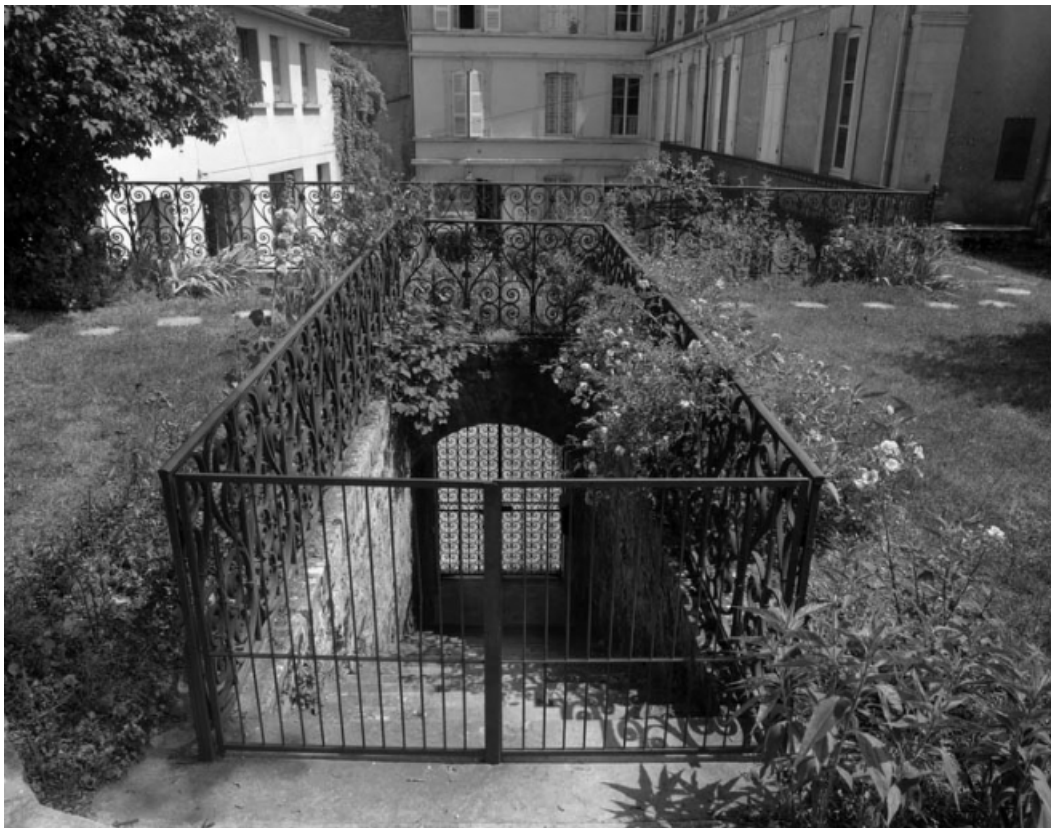
Vue d'ensemble de l'escalier donnant accès au jardin, grille fermée.