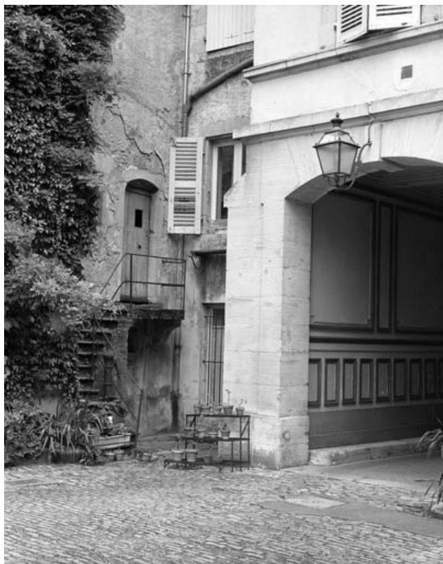
Angle de la cour à droite du passage couvert.