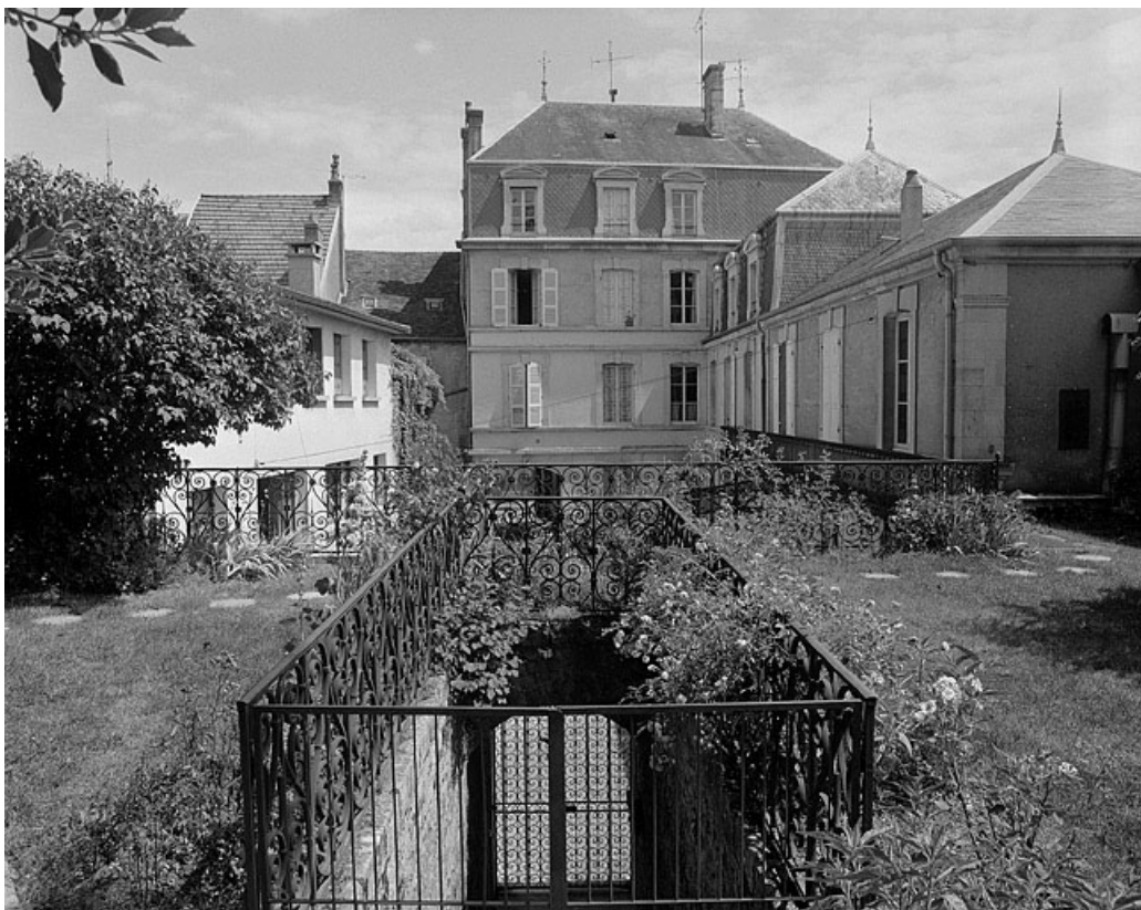
Vue d'ensemble de l'édifice depuis le parapet de l'escalier du jardin.