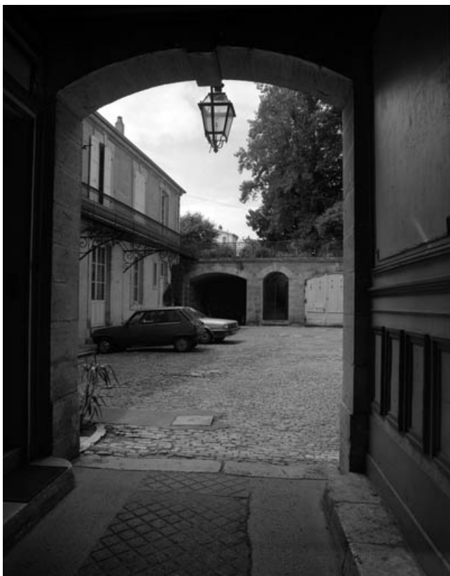
La cour, les remises et l'aile gauche depuis le passage couvert. 70, Gray Grande Rue 19, 19 bis, 21