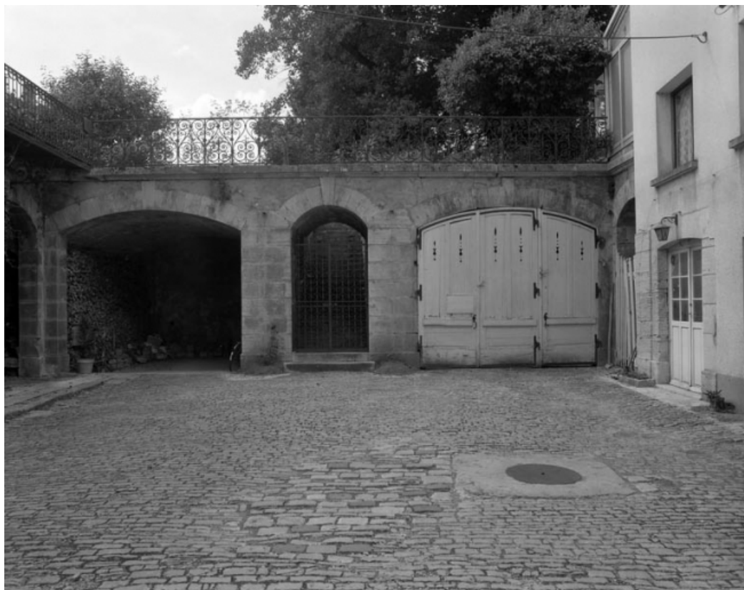
Les remises encadrant la porte d'accès au jardin.