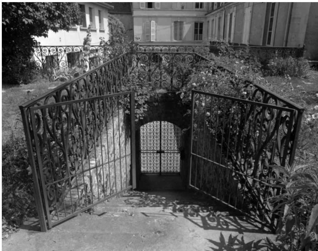
Vue d'ensemble de l'escalier donnant accès au jardin : grille ouverte.