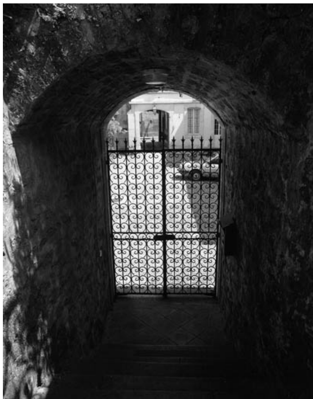
Détail de la grille donnant accès à l'escalier du jardin.