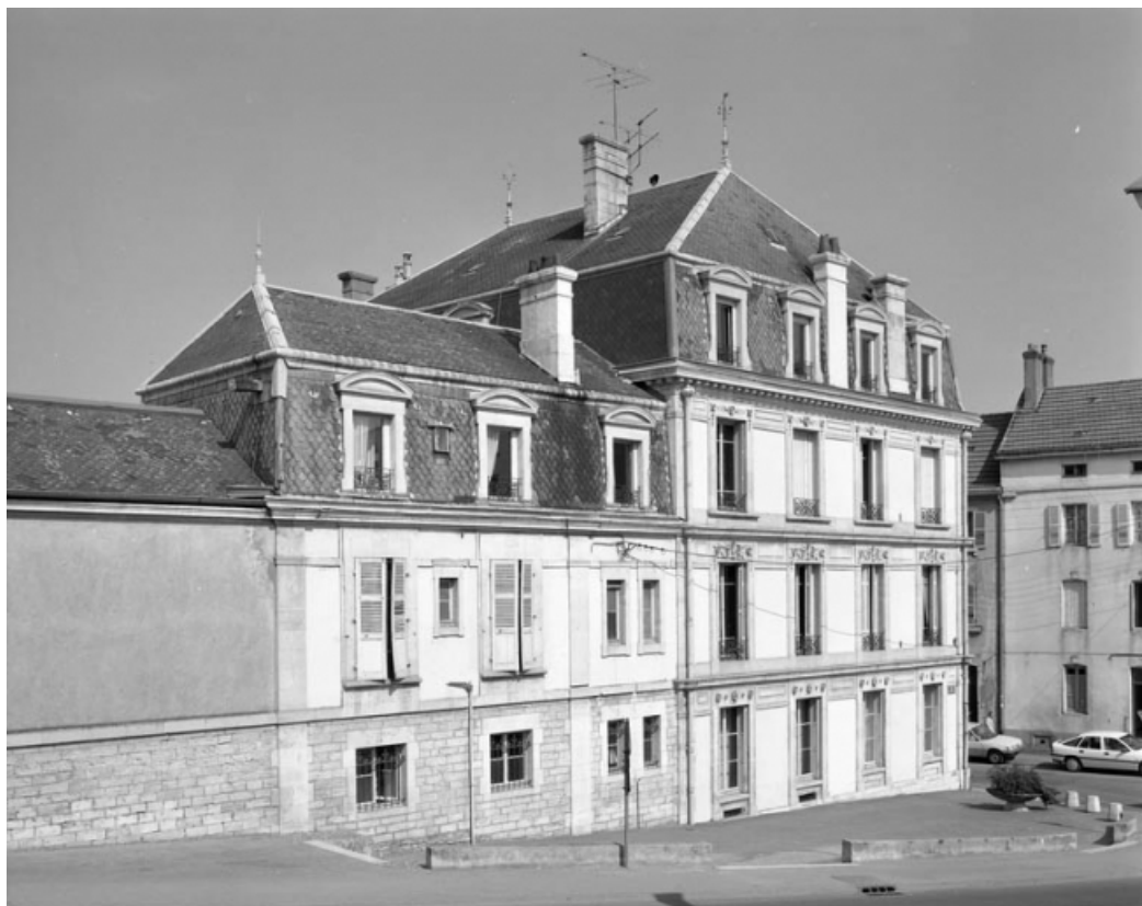
façade latérale, de trois quarts gauche.