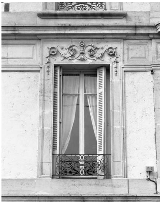
Façade latérale droite, détail : baie du premier étage.