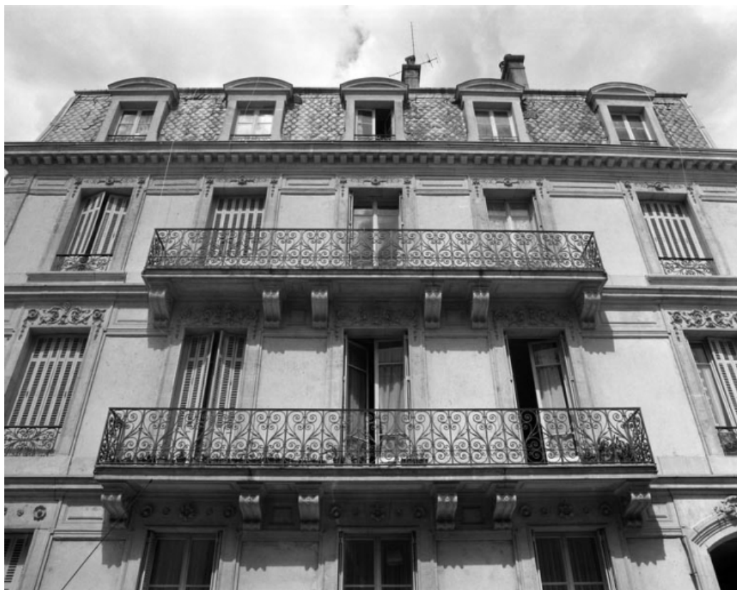
Façade antérieure à partir du premier étage, de face.