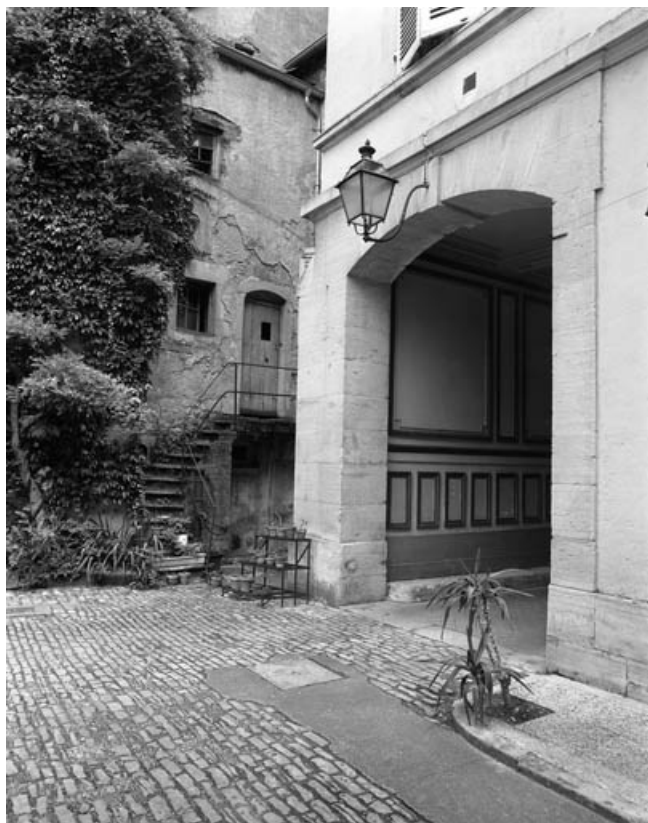
Le passage couvert, côté cour.