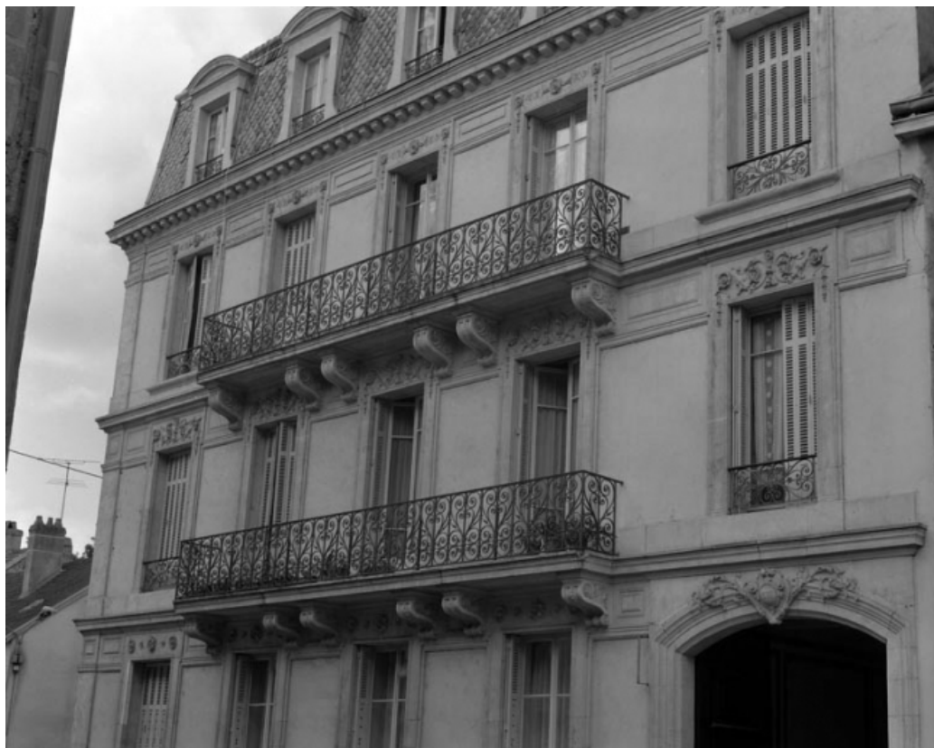
Façade antérieure à partir du premier étage : de trois quarts droit.