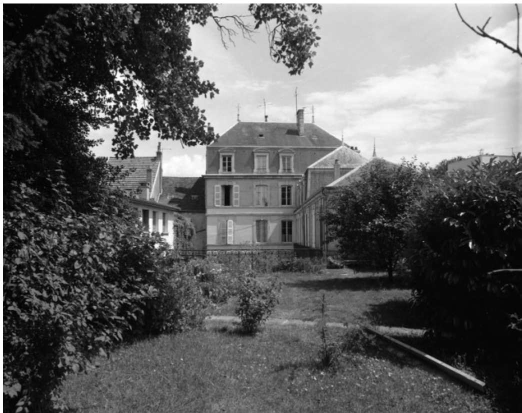
Façade postérieure de l'édifice depuis le fond du jardin.