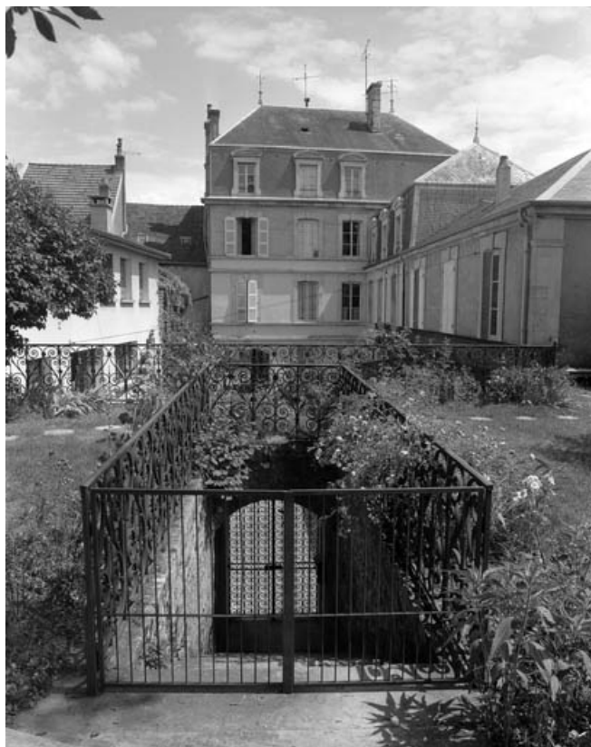
Vue d'ensemble de l'édifice depuis le parapet de l'escalier du jardin.