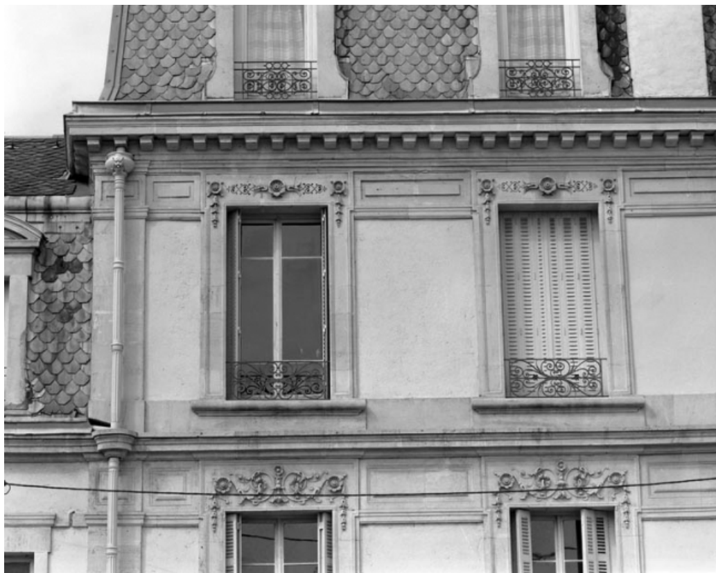
Façade latérale droite : détail du décor des baies.