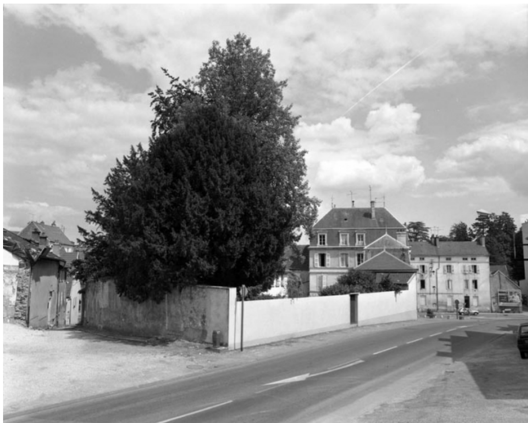
Jardin et façade postérieure de l'édifice depuis la rue Legros.