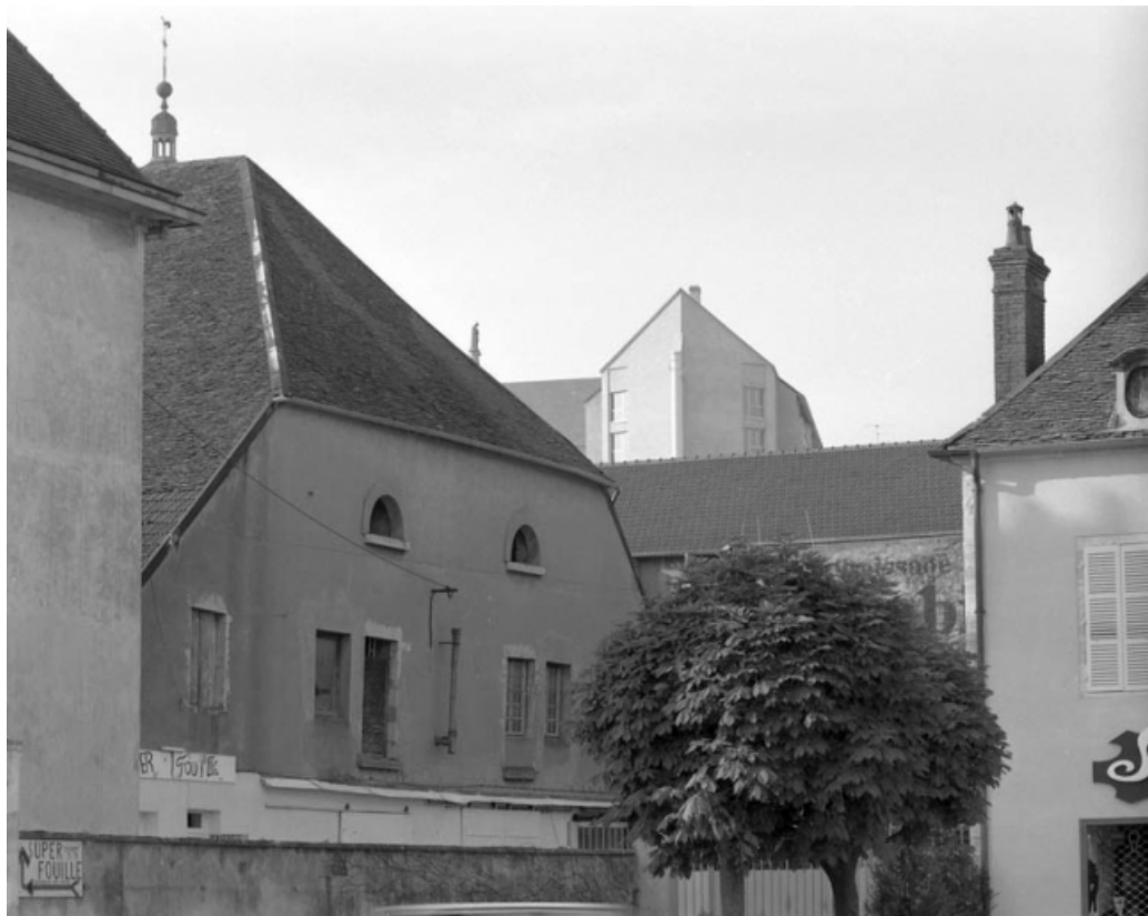
Détail du premier étage de la façade antérieure de l'entrepôt commercial. 70, Gray rue Gambetta