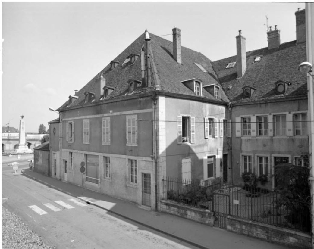
Façade latérale droite de trois quarts droit, avant restauration.