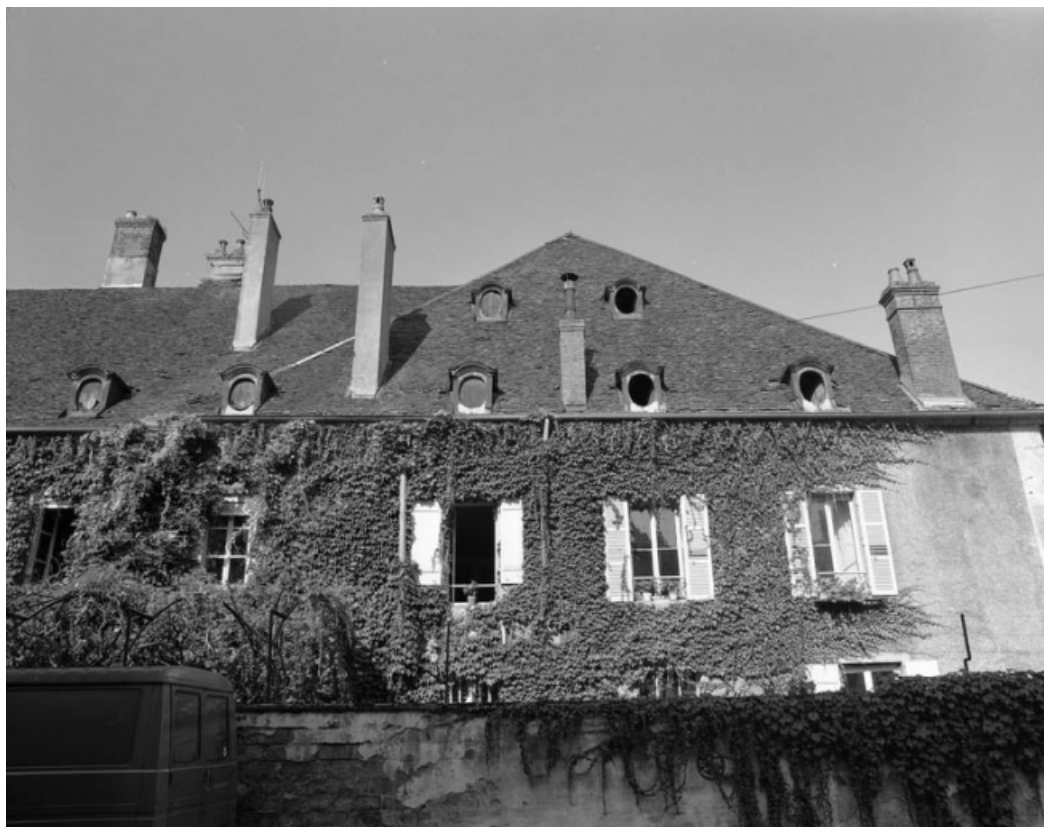
Façade latérale gauche de la maison : détail du premier étage et de la toiture, avant restauration. 70, Gray rue Gambetta