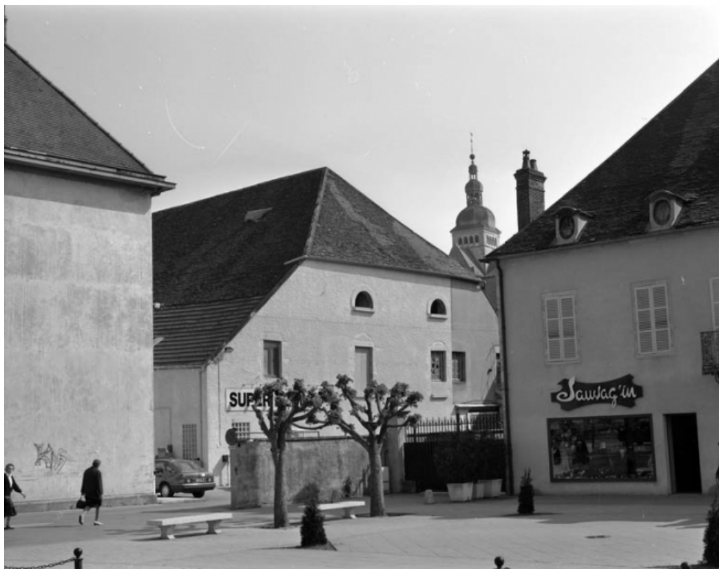
Vue des parties commerciales à gauche de la maison. 70, Gray rue Gambetta