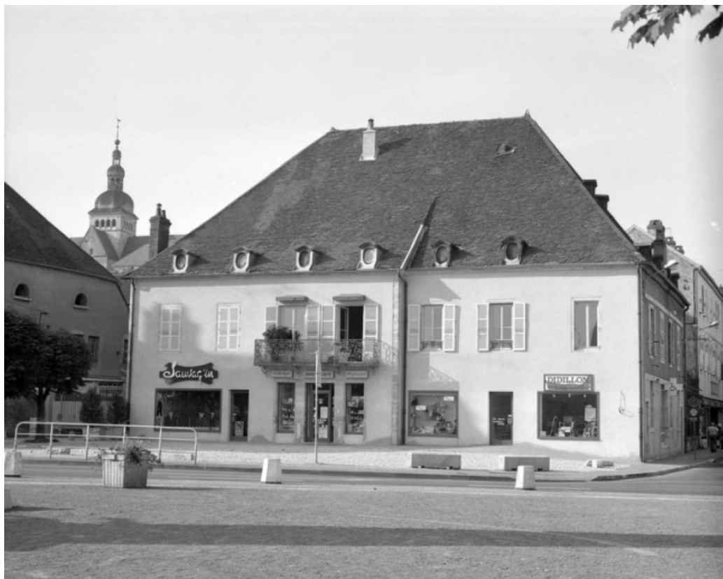
Façade antérieure de la maison, de trois quarts droit.