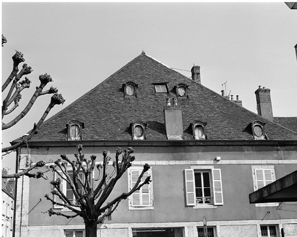
Toiture et façade latérale droite de la maison donnant rue Gambetta.