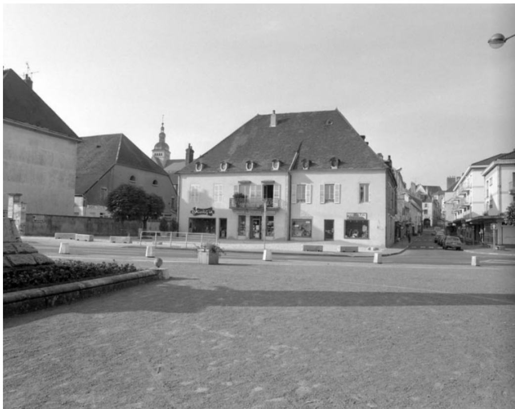
Vue d'ensemble de la maison.