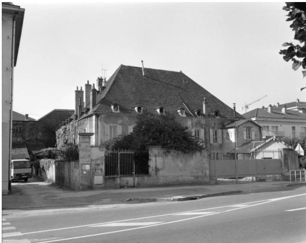
Vue d'ensemble de la maison depuis la rue, avant restauration.