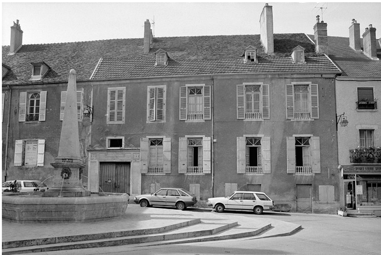
Façade antérieure de l'immeuble construit après la destruction de la chapelle du couvent au début du XIX e siècle (21 rue du Marché).