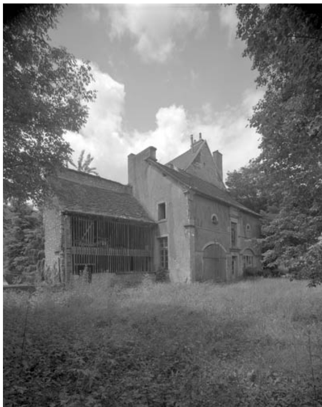
Vue d'ensemble des dépendances dans le jardin de l'immeuble 21 rue du Marché. 70, Gray, 5 rue de la Petite Fontaine