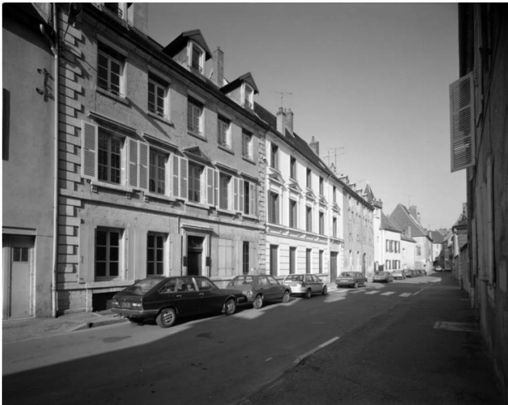
Vue de trois quarts gauche des bâtiments situés à l'emplacement de l'ancien couvent (6 et 8 rue Victor Hugo). 70, Gray, 5 rue de la Petite Fontaine