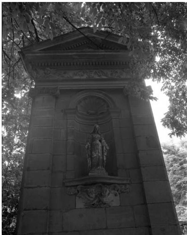
Niche située au fond du parc (21 rue du Marché), de face. 70, Gray, 5 rue de la Petite Fontaine