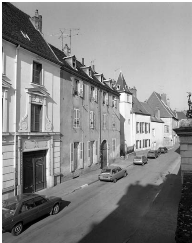
Façade antérieure du bâtiment 6 rue Victor Hugo : vue de trois quarts gauche. 70, Gray, 5 rue de la Petite Fontaine