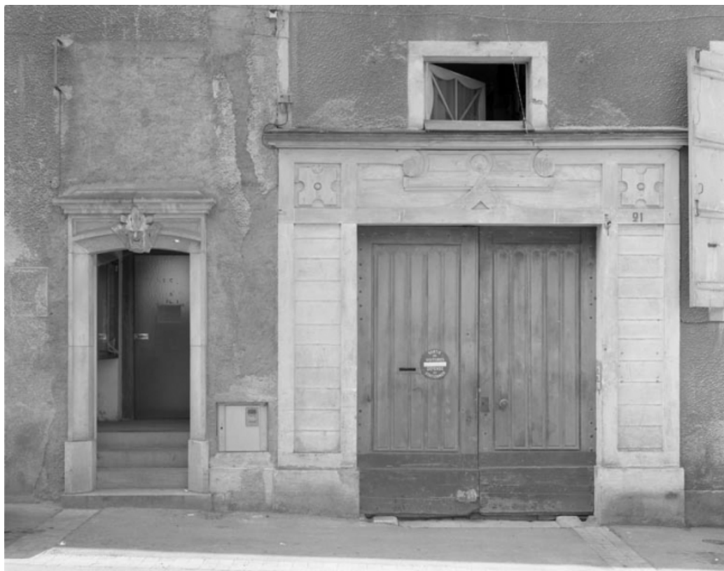
Détail de la façade antérieure située rues du Marché et de la Petite Fontaine : portes cochère et piétonne. 70, Gray, 5 rue de la Petite Fontaine