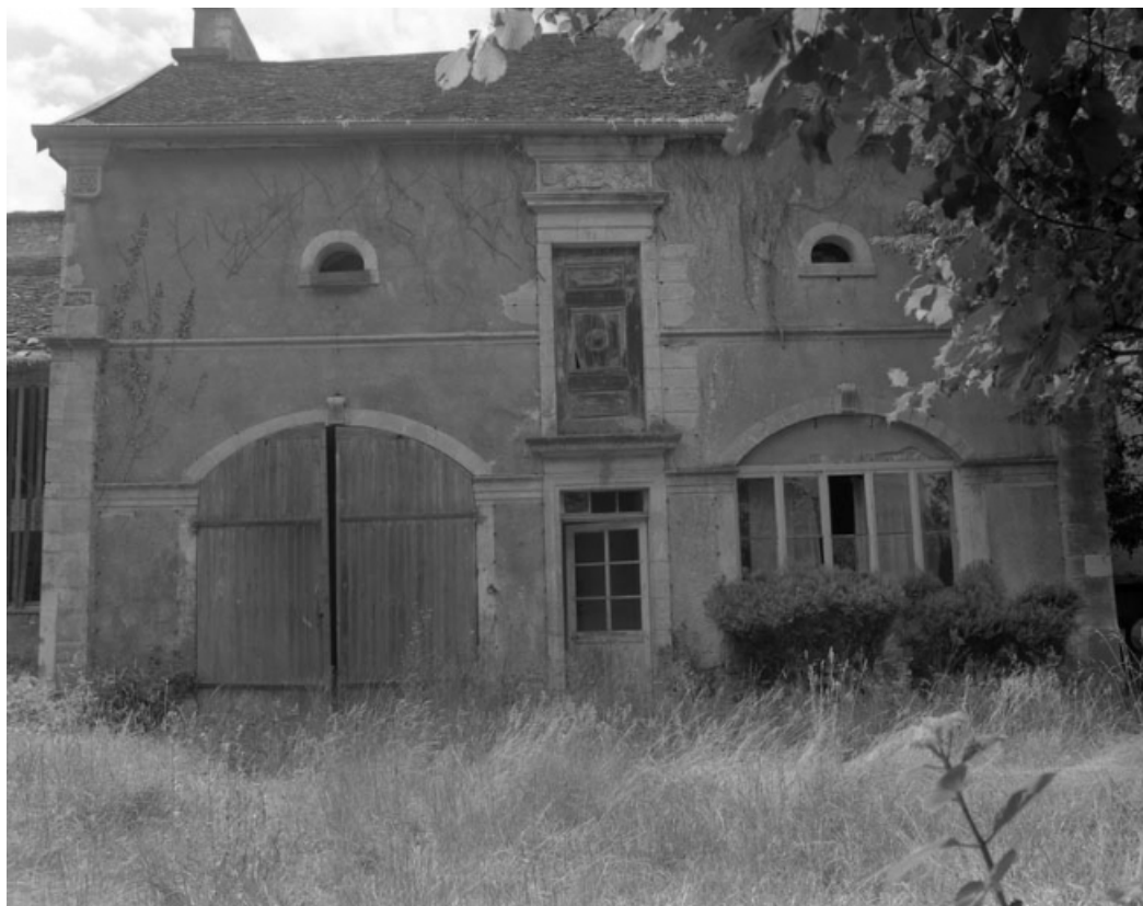
Façade antérieure des remises, de face, dans le jardin de l'immeuble 21 rue du Marché. 70, Gray, 5 rue de la Petite Fontaine