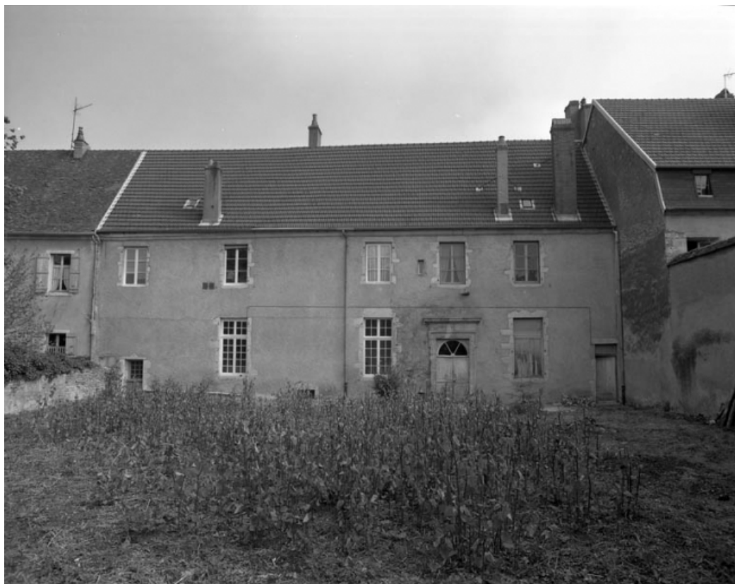
Façade postérieure du bâtiment 5 rue de la Petite Fontaine : de face.