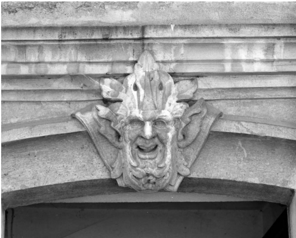
Façade antérieure du bâtiment 5 rue de la Petite Fontaine : détail de l'agrafe de la porte piétonne. 70, Gray, 5 rue de la Petite Fontaine