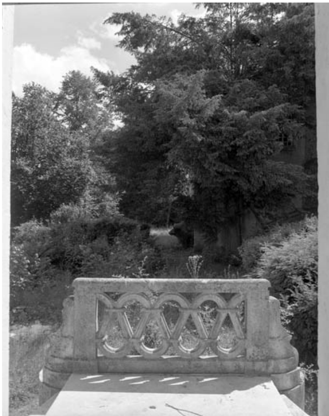
Vue de la balustrade du perron sur la façade postérieure de l'immeuble 21 rue du Marché. 70, Gray, 5 rue de la Petite Fontaine