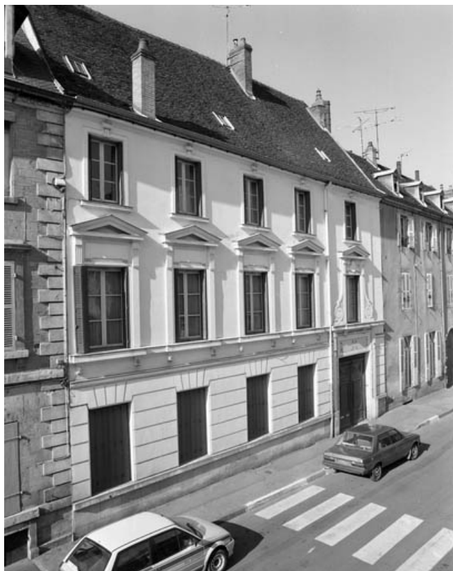
Façade antérieure du bâtiment 8 rue Victor Hugo : vue de trois quarts gauche. 70, Gray, 5 rue de la Petite Fontaine