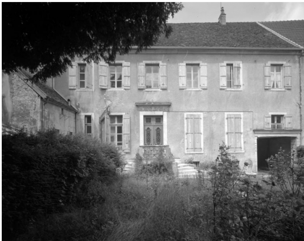
Façade postérieure de l'immeuble construit après la destruction de la chapelle au début du XIXe siècle (21 rue du Marché) : vue de face.