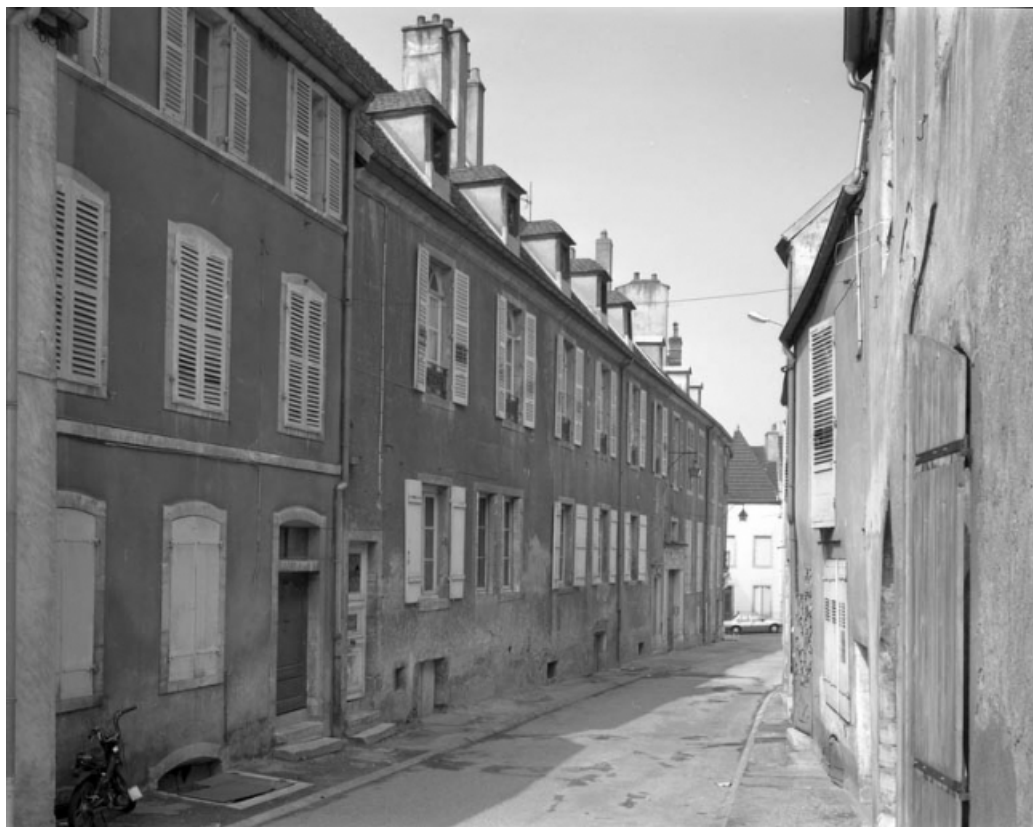
Façade antérieure du bâtiment 5 rue de la Petite Fontaine, de trois quarts gauche. 70, Gray, 5 rue de la Petite Fontaine