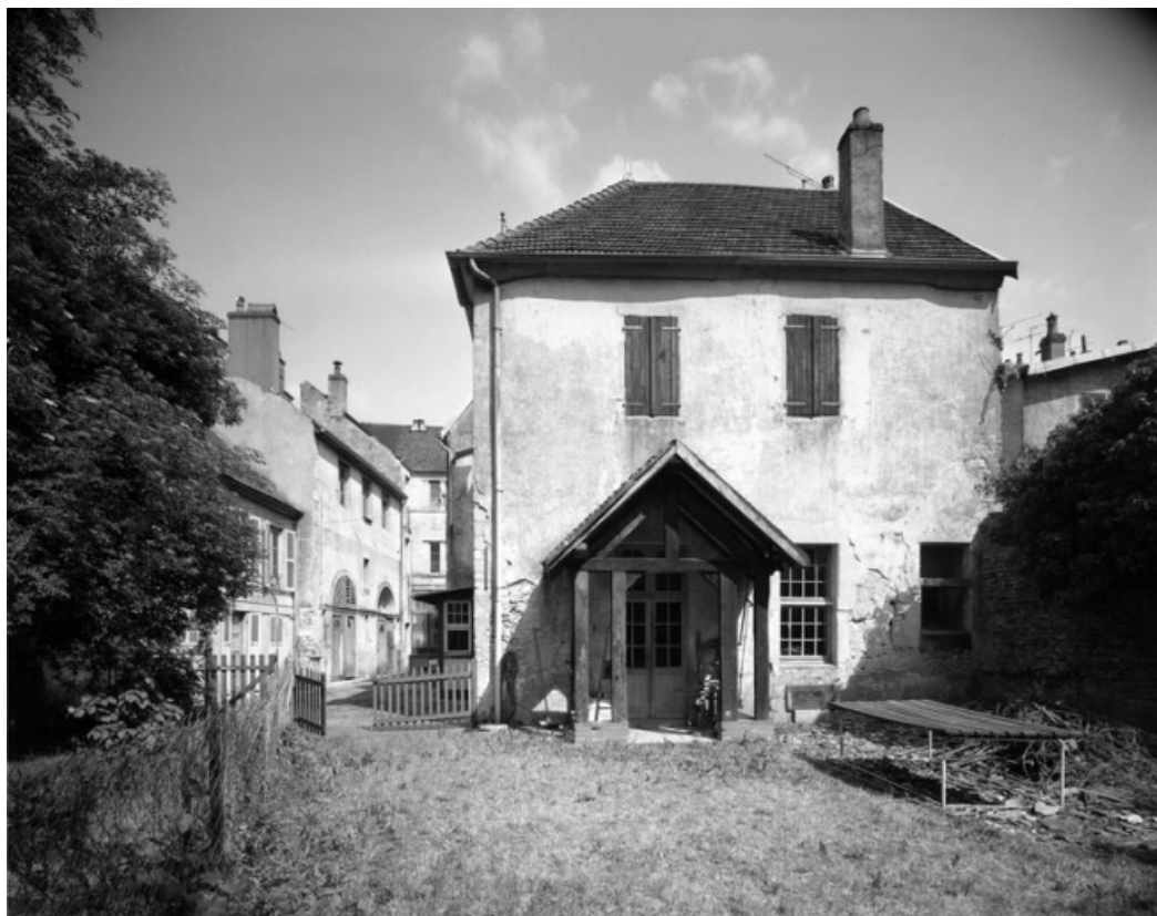
Détail : logement à gauche de la cour depuis le jardin (6 rue Victor Hugo). 70, Gray, 5 rue de la Petite Fontaine