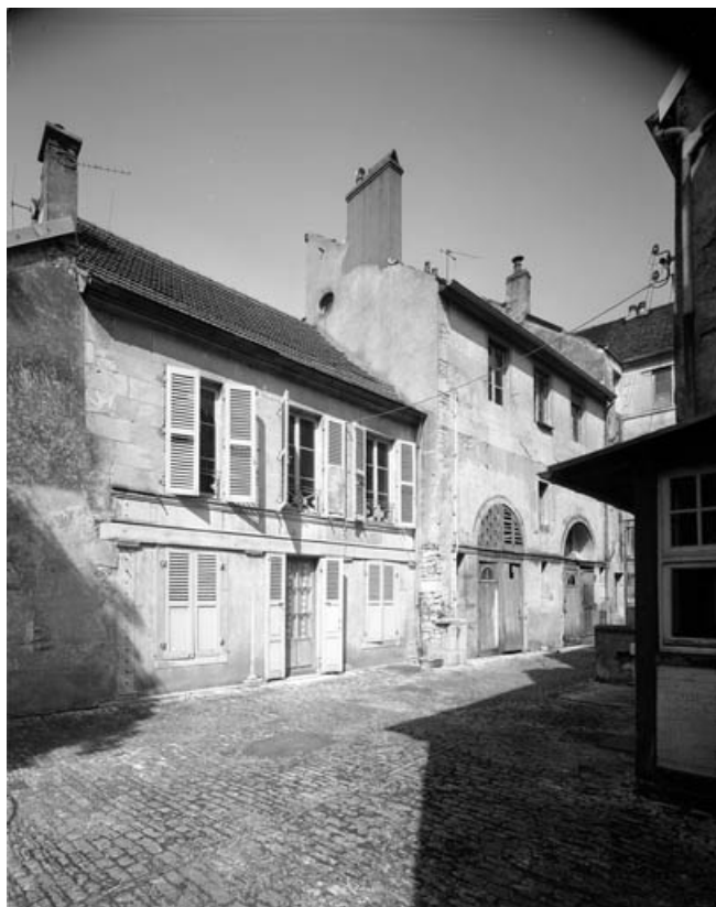
Façades antérieures des remise et logement à droite de la cour (6 rue Victor Hugo). 70, Gray, 5 rue de la Petite Fontaine