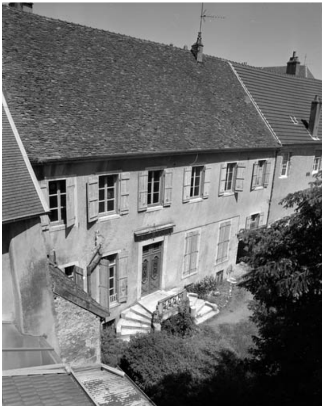
Façade postérieure de l'immeuble construit à l'emplacement de la chapelle (21 rue du Marché) : vue plongeante de trois quarts gauche.