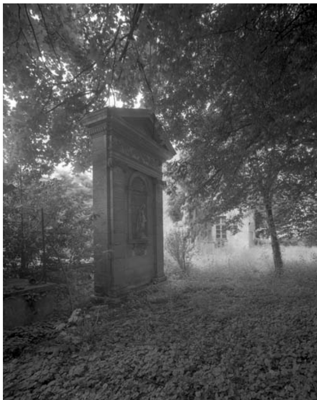
Niche située au fond du parc (21 rue du Marché), de trois quarts gauche. 70, Gray, 5 rue de la Petite Fontaine