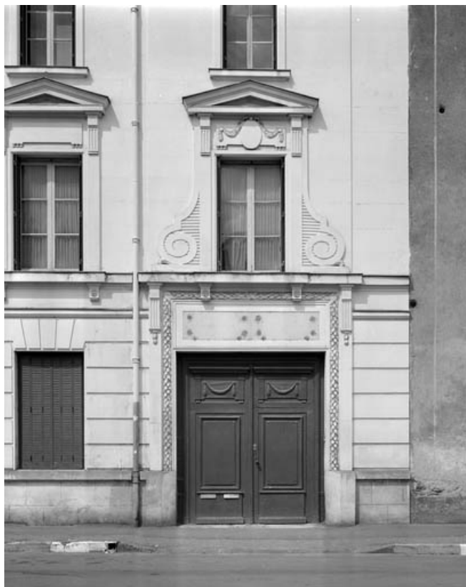
Façade antérieure du bâtiment 8 rue Victor Hugo : détail du portail d'entrée et d'une baie du premier étage. 70, Gray, 5 rue de la Petite Fontaine