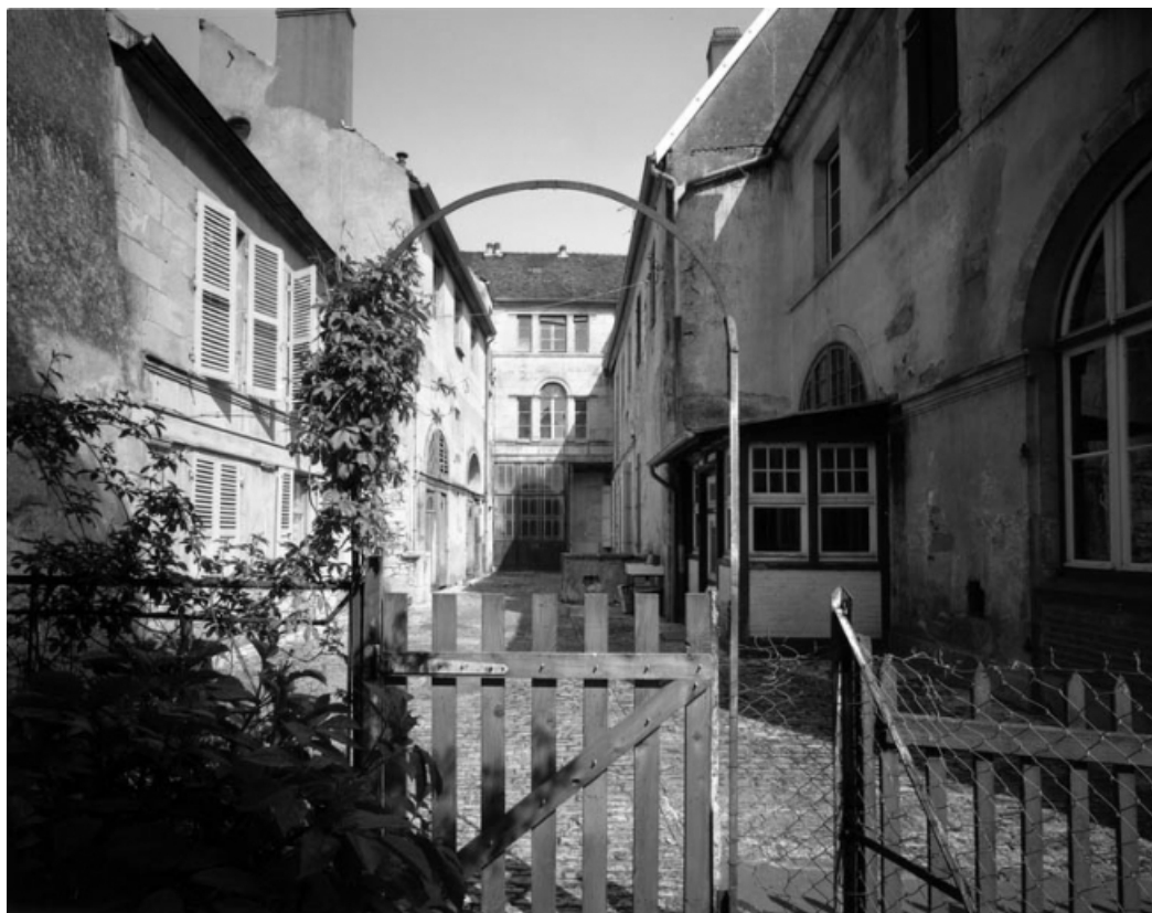
Vue d'ensemble de la façade postérieure du bâtiment sur rue au 6 rue Victor Hugo et des ailes sur cour. 70, Gray, 5 rue de la Petite Fontaine