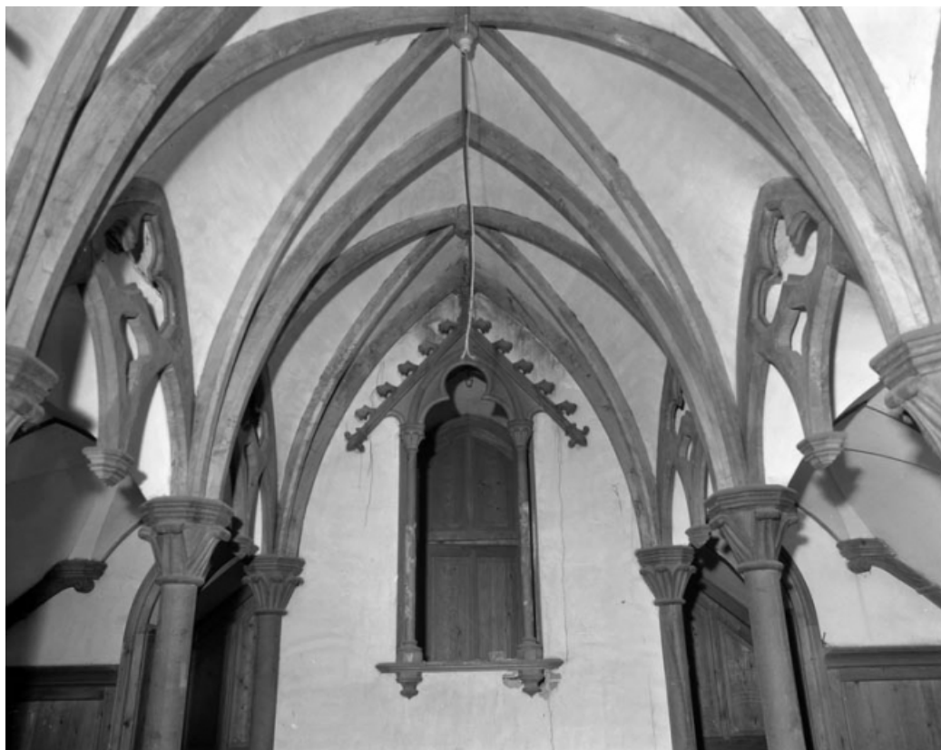
Intérieur de l'oratoire : vue du chœur de face.