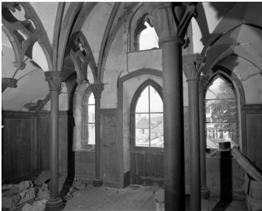
Intérieur de l'oratoire : vue de la nef depuis le chœur.