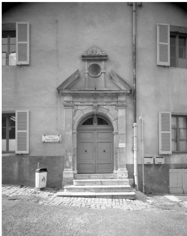
Portail d'entrée : de face.