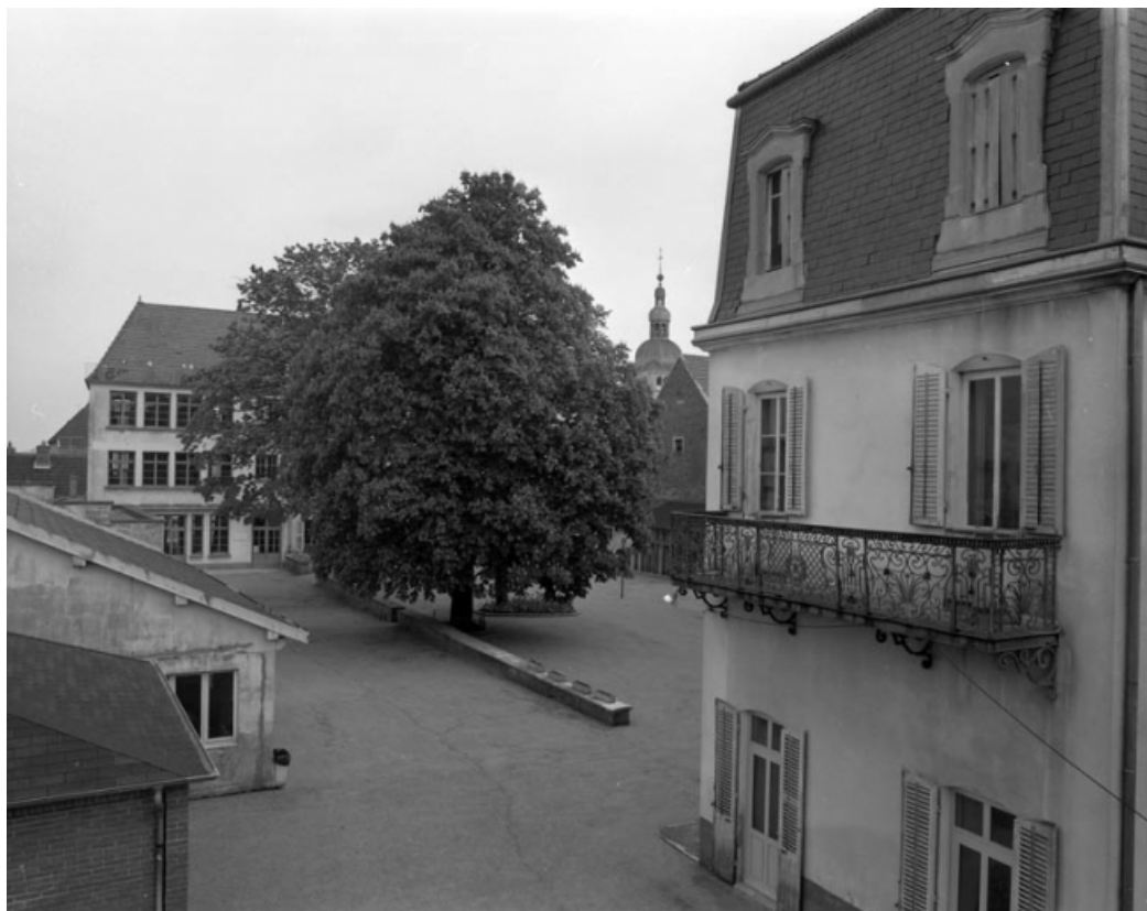
Vue d'ensemble de la cour depuis le fond de la parcelle.