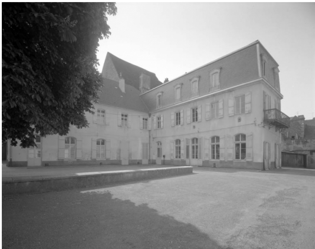
Façades sur cour : de trois quarts gauche.