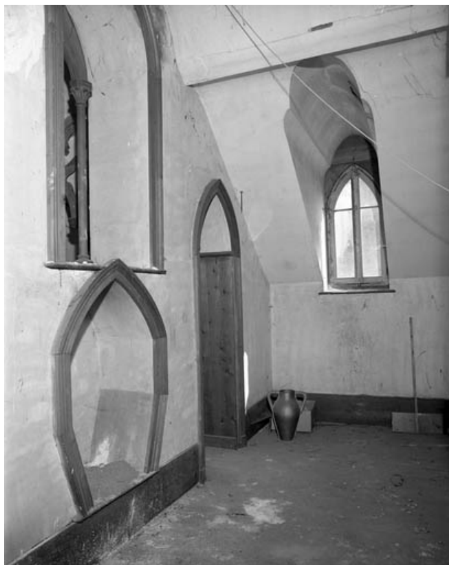
Vue du réduit situé derrière le chœur.