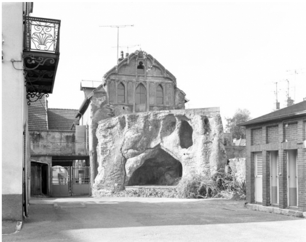
Grotte de Lourdes et oratoire : vue d'ensemble.