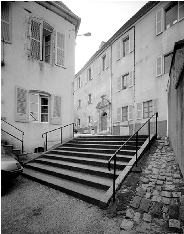
Façade antérieure du bâtiment principal : de trois quarts droit. 70, Gray rue des Ursules