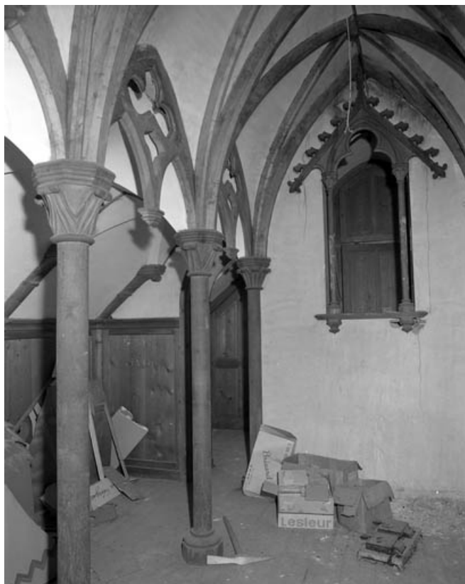
Intérieur de l'oratoire : vue du chœur de trois quarts gauche. 70, Gray rue des Ursules