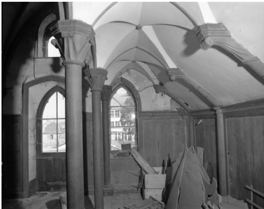
Intérieur de l'oratoire : vue de la nef de trois quarts droit.