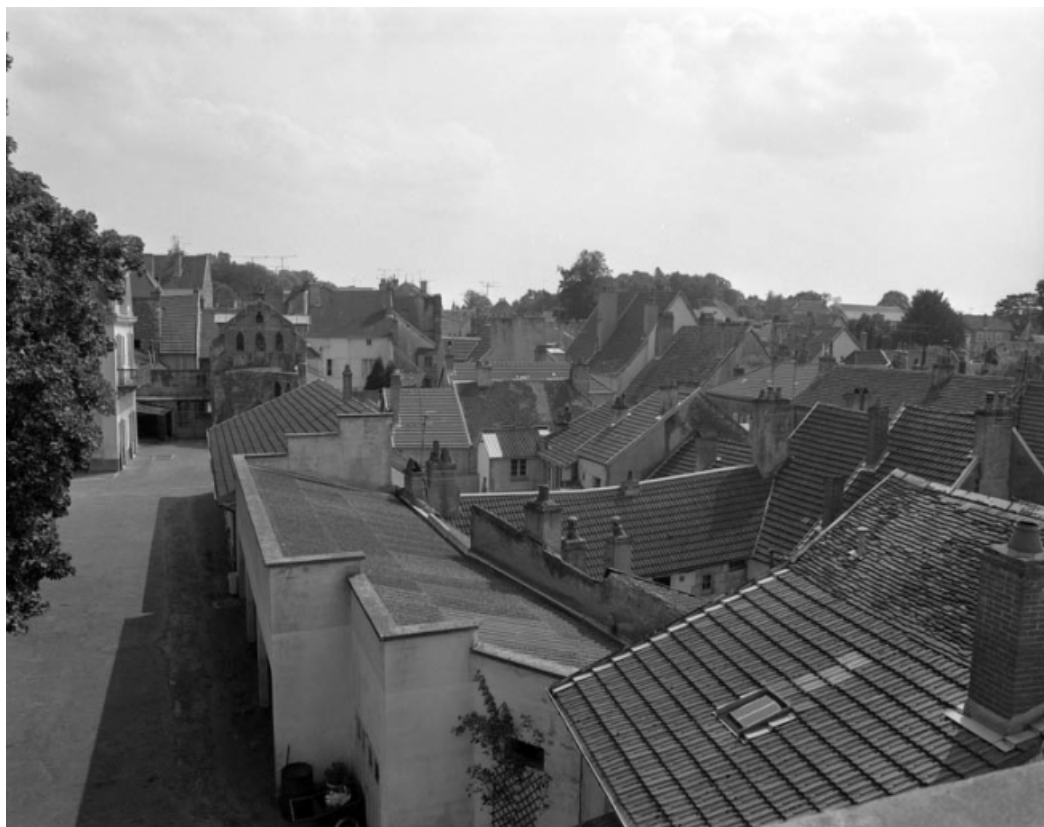
Oratoire : vue éloignée.