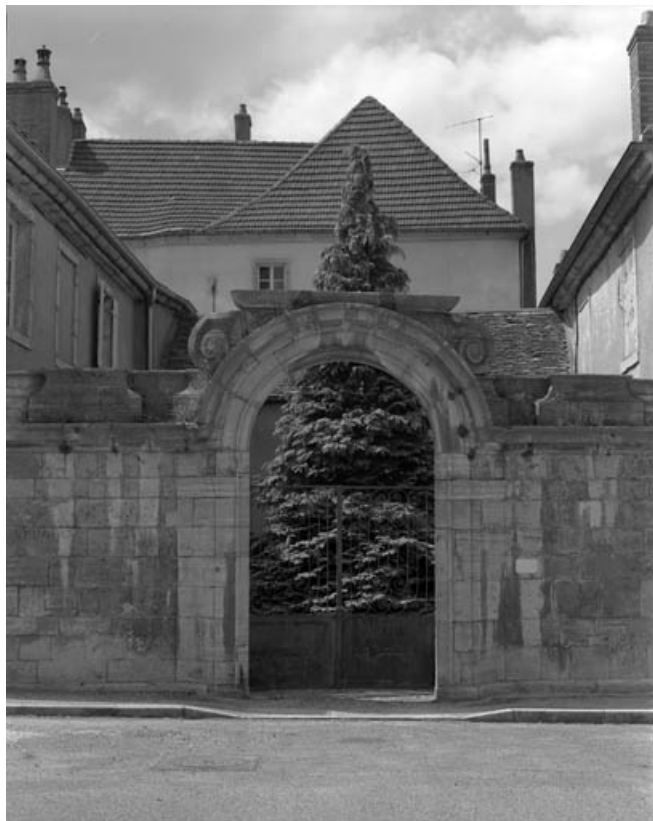
Portail d'entrée droit, depuis la place.