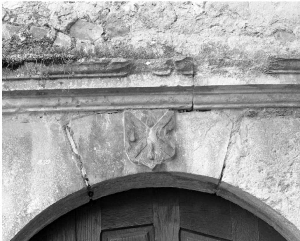
Partie gauche du couvent : détail du blason sur la porte d'entrée de l'escalier du bâtiment en fond de cour. 70, Gray place de la Sous-Préfecture