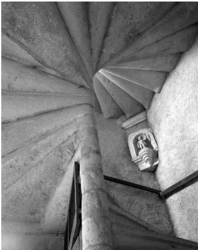
Partie gauche du couvent : détail de l'escalier en vis desservant le bâtiment en fond de cour. 70, Gray place de la Sous-Préfecture