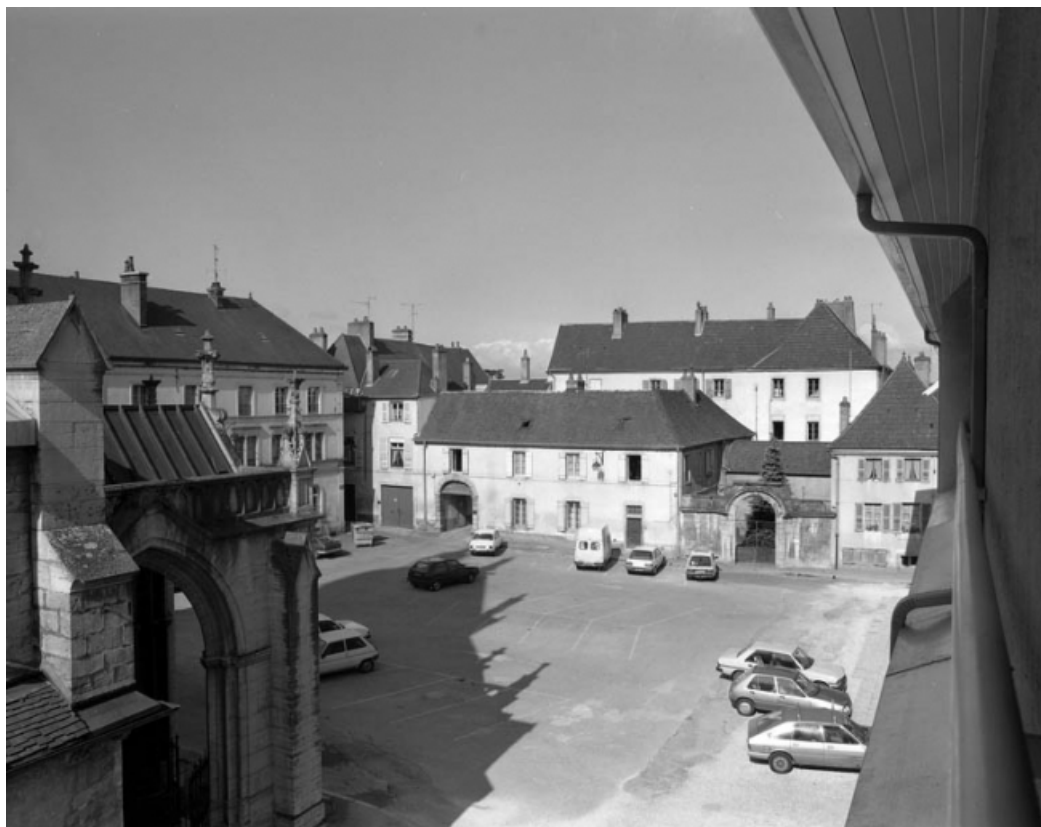
Façade antérieure sur rue : vue d'ensemble.