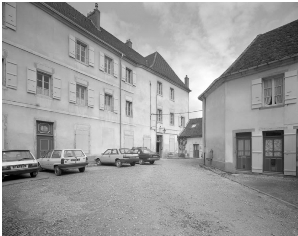
Façade antérieure du bâtiment principal : de trois quarts gauche.