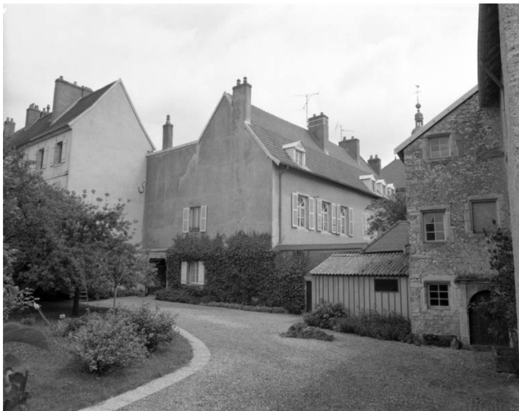
Partie gauche du couvent depuis le fond de la cour.