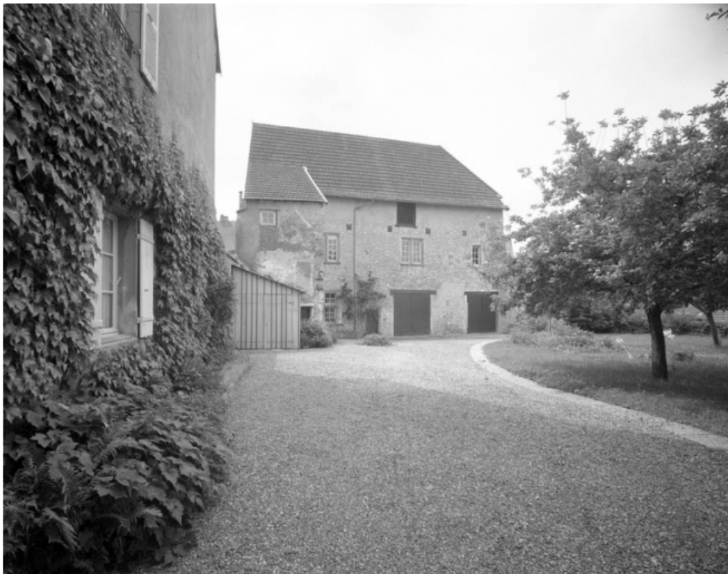
Partie gauche du couvent : bâtiment en fond de cour, de face.