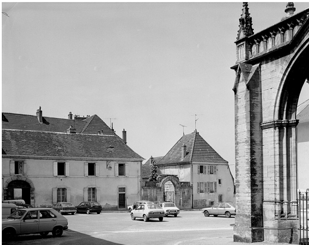
Façade antérieure : partie droite sur rue. 70, Gray place de la Sous-Préfecture