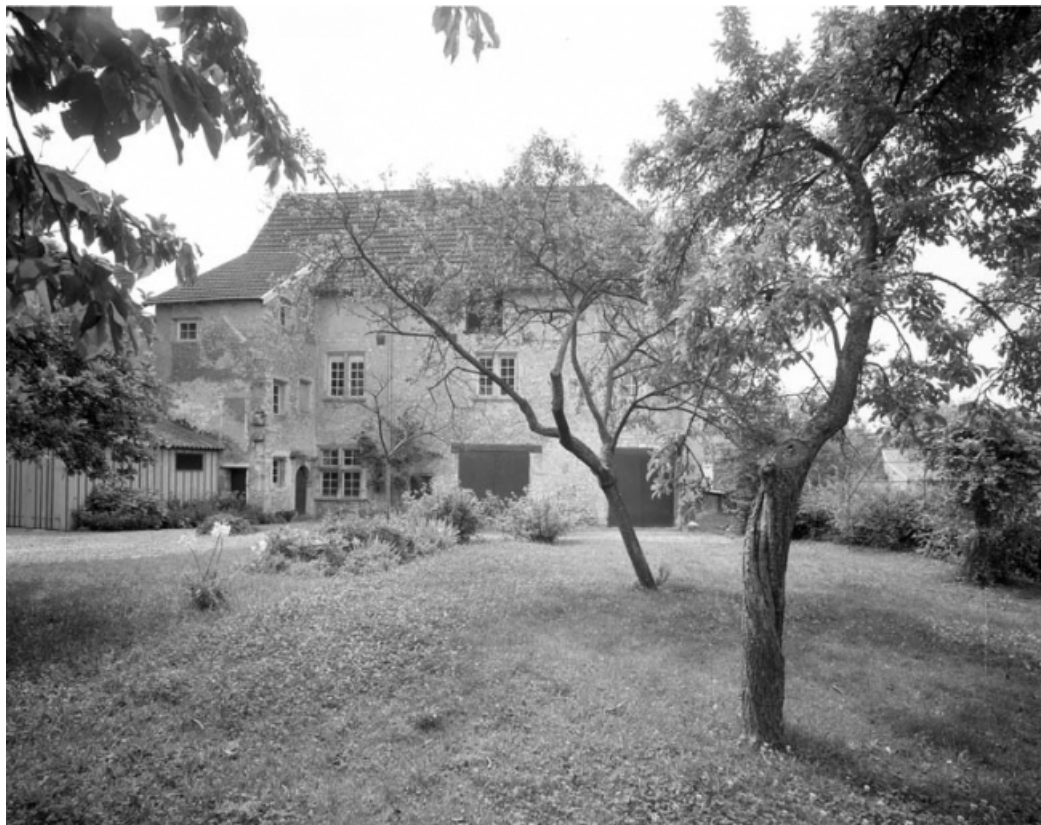
Partie gauche du couvent : bâtiment en fond de cour, de trois quarts droit. 70, Gray place de la Sous-Préfecture