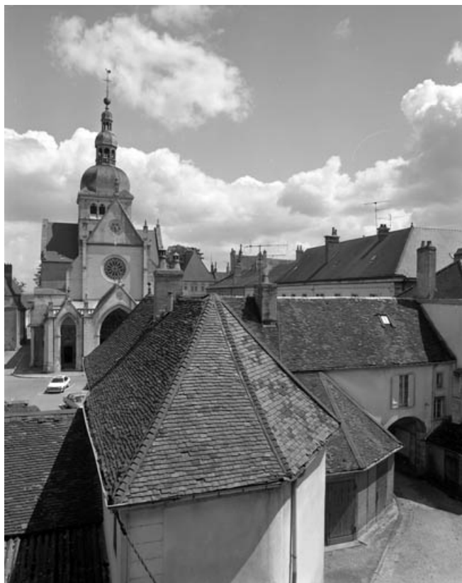
Vue des bâtiments bordant la place, depuis le premier étage du bâtiment principal. 70, Gray place de la Sous-Préfecture