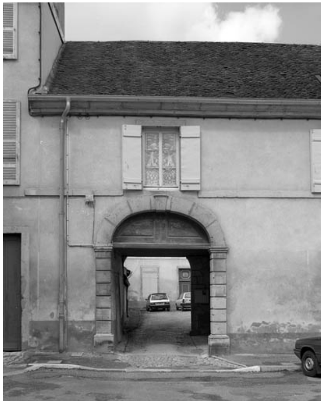
Passage couvert à gauche des bâtiments sur rue, depuis la place. 70, Gray place de la Sous-Préfecture