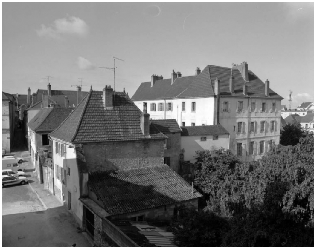
Partie droite : vue plongeante de trois quarts droit.