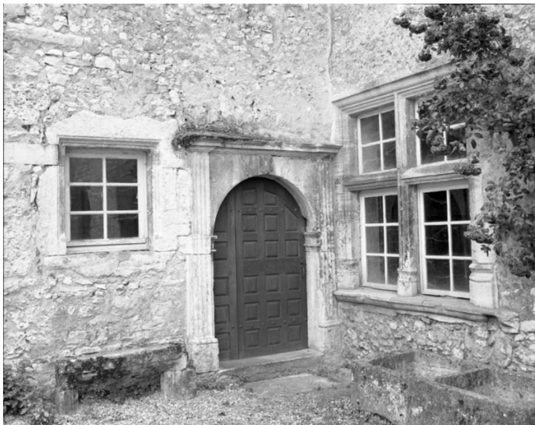
Partie gauche du couvent : bâtiment en fond de cour, détail de la porte d'entrée de l'escalier. 70, Gray place de la Sous-Préfecture