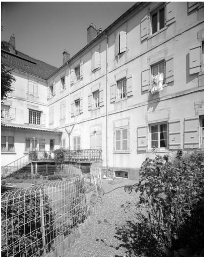
Façade postérieure du bâtiment principal : de trois quarts gauche. 70, Gray place de la Sous-Préfecture