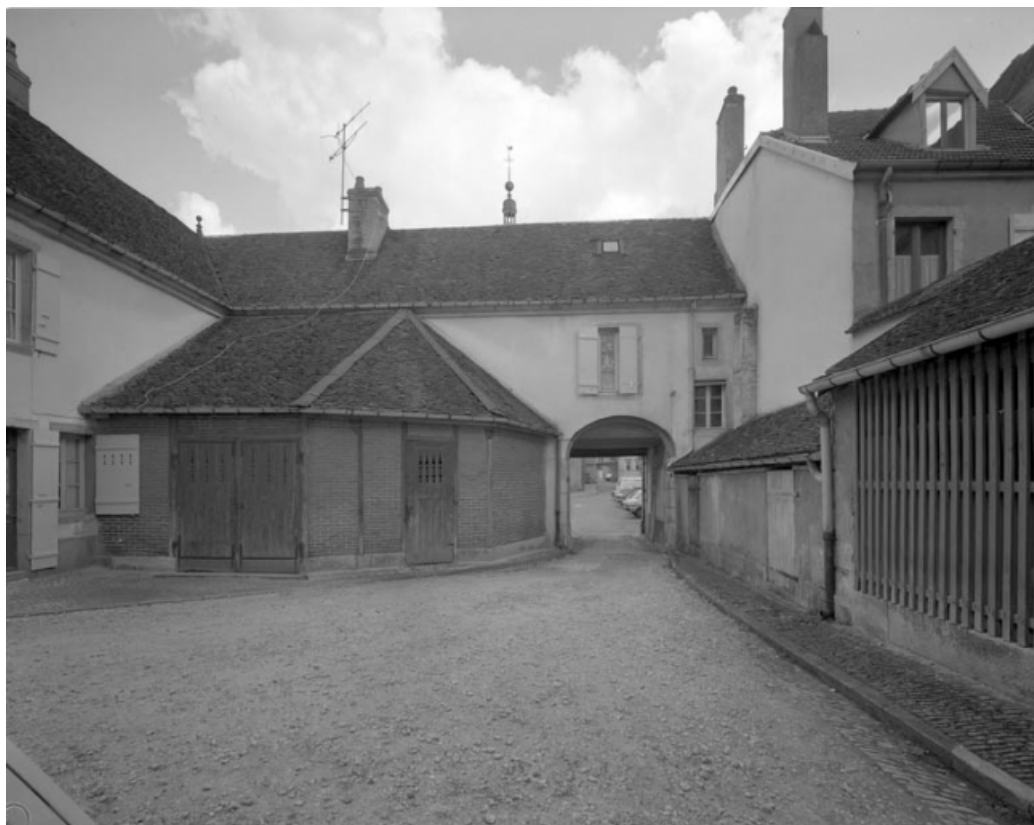
Vue du passage couvert, de face depuis la cour.