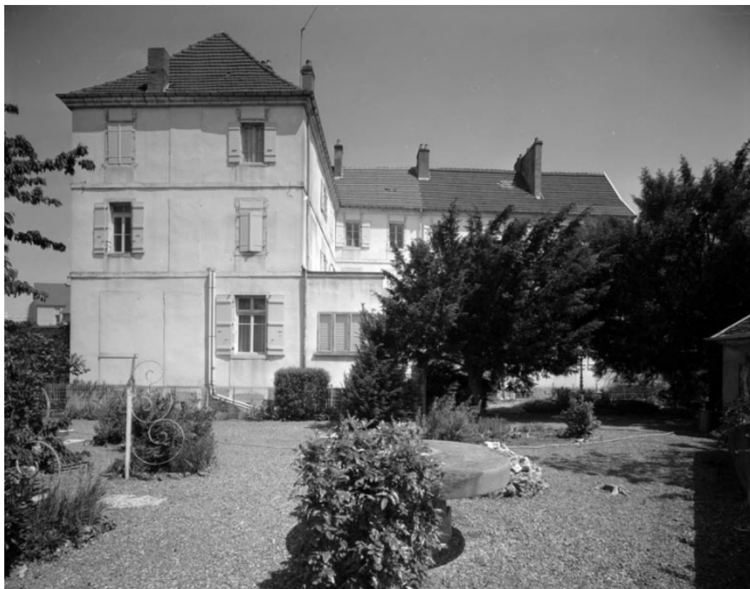
Façade postérieure du bâtiment principal : de face.