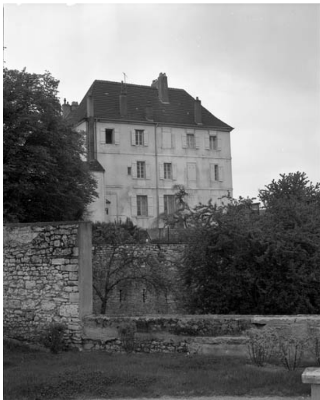
Façade latérale du bâtiment principal.