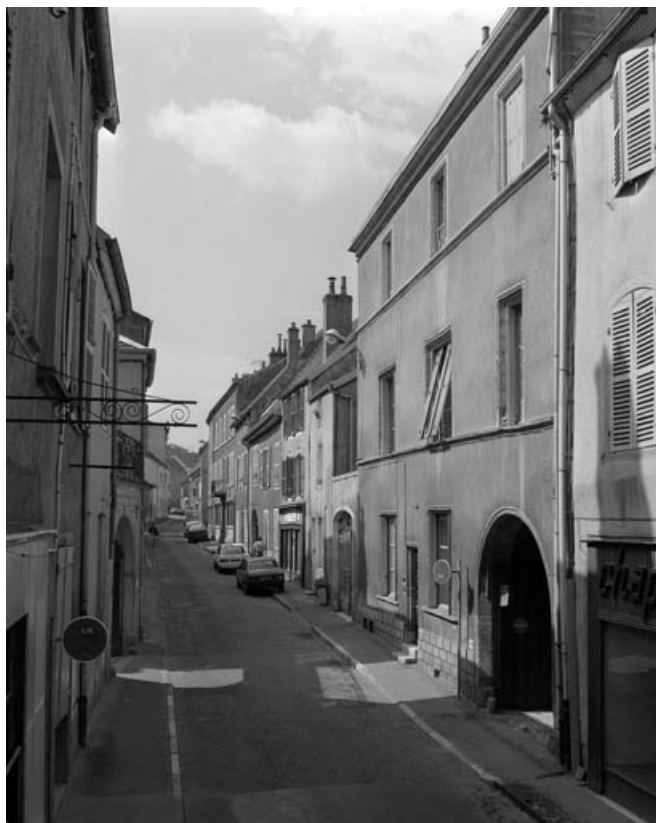
Façade antérieure, de trois quarts droit.