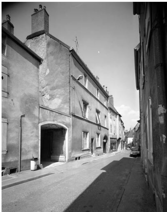
Façade antérieure de trois quarts gauche.