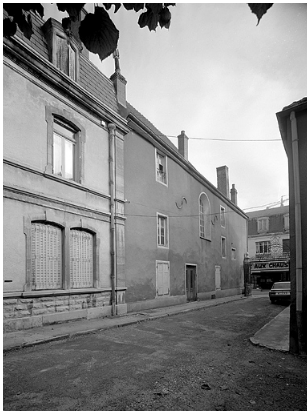
Façade latérale gauche avec une baie d'origine en plein cintre. 70, Gray Grande Rue 89