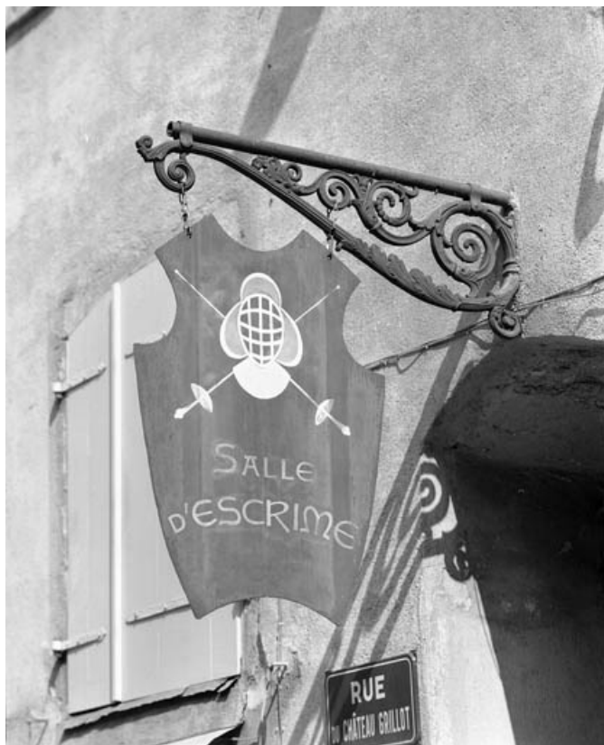
Bec de gaz situé rue des Terreaux, réutilisé en porte-enseigne. 70, Gray, 29 quai Mavia