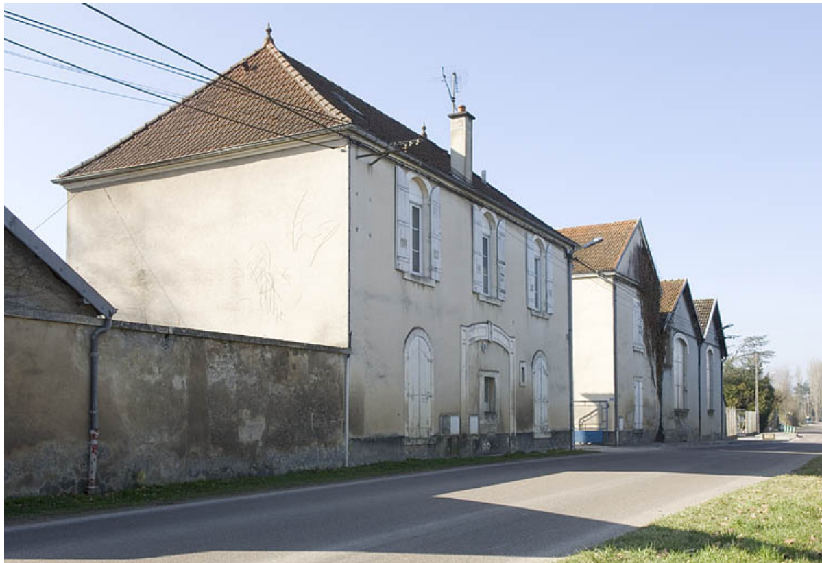
Vue d'ensemble depuis le quai Mavia.