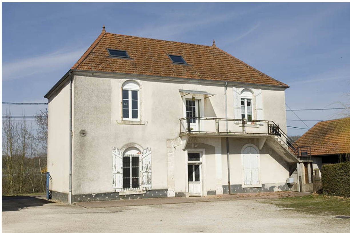
Logement patronal et bureau. Façade sud.