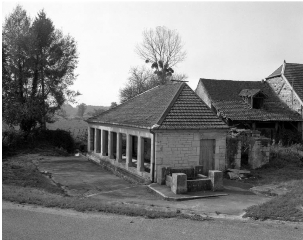
Façades postérieures depuis la cour en 1988.