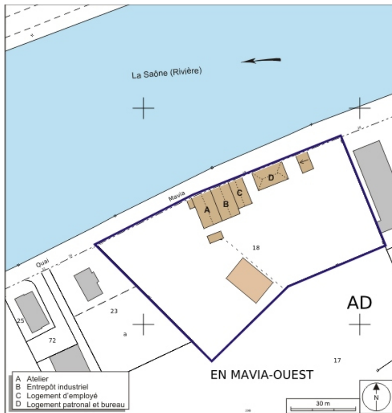
Plan-masse et de situation. Extrait du plan cadastral numérisé, 2008, section AD, 1:1000. Source : Direction générale des Finances Publiques - Cadastre ; mise à jour : 2008.