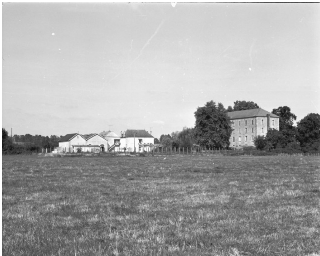
L'usine à gaz située quai Mavia : vue éloignée.