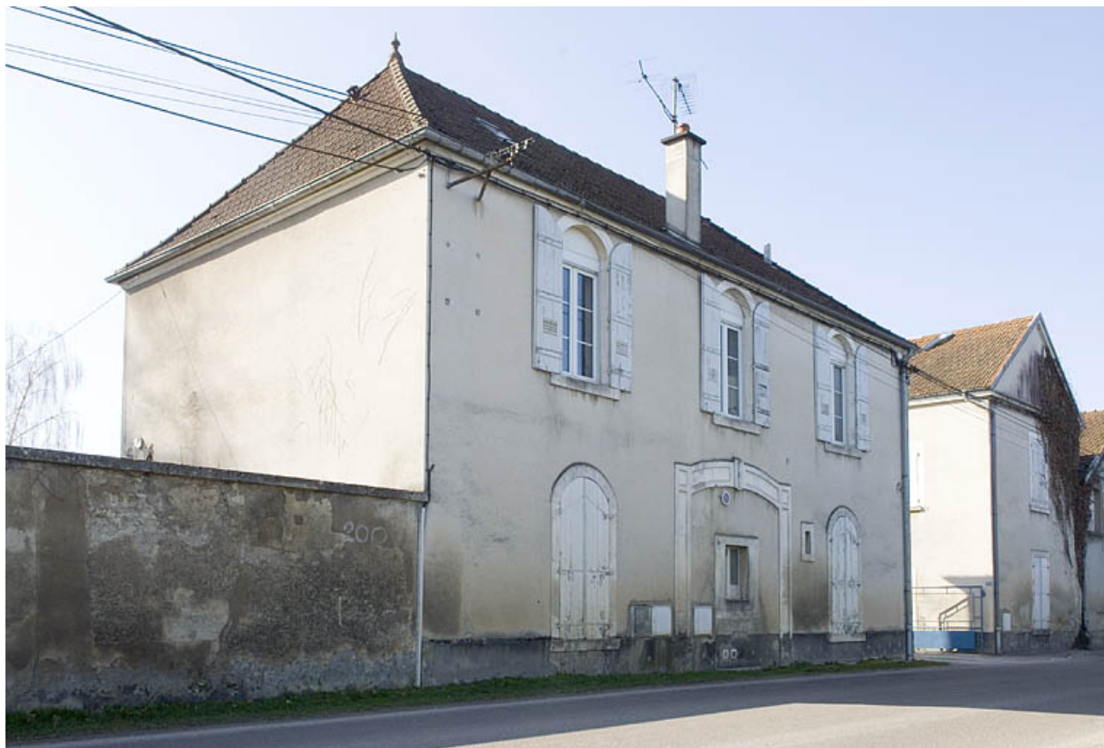
Logement patronal et bureau. Façade sur rue depuis l'est.