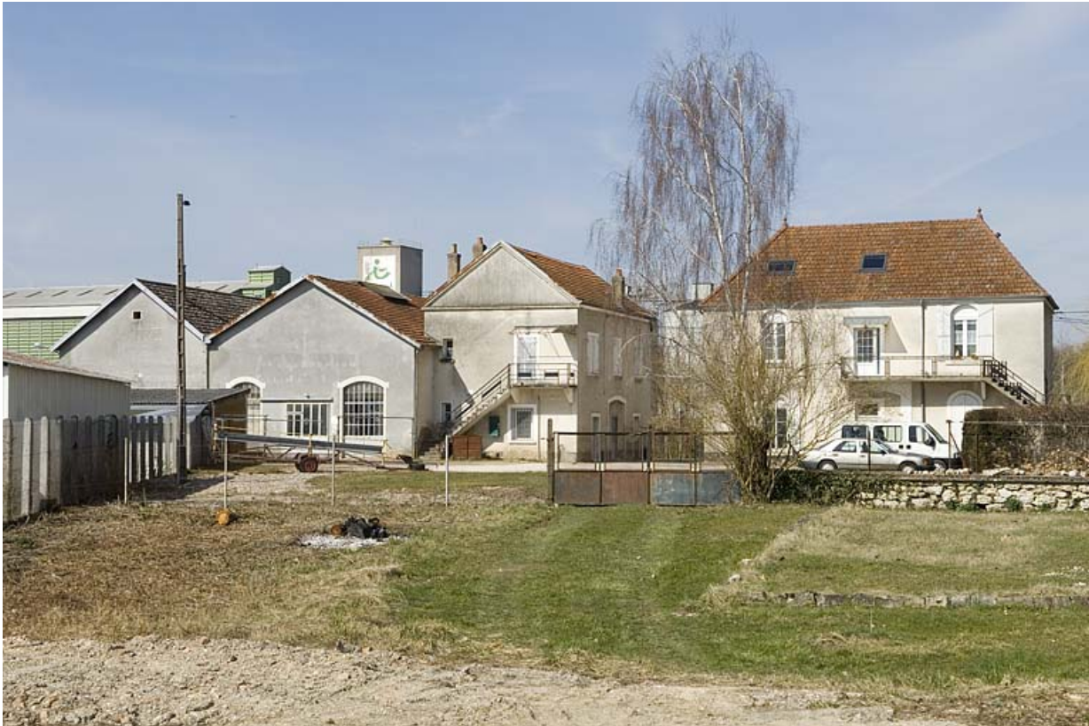
Vue rapprochée depuis le sud.