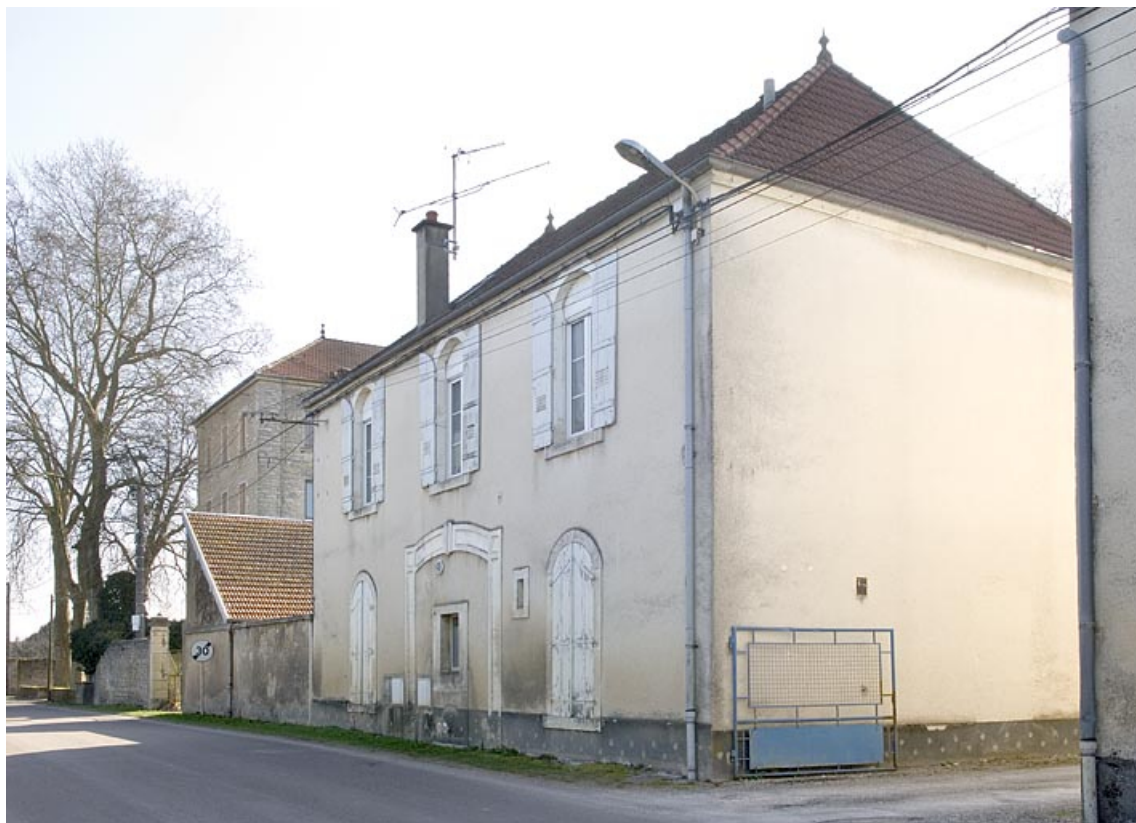
Logement patronal et bureau. Façade sur rue depuis l'ouest.