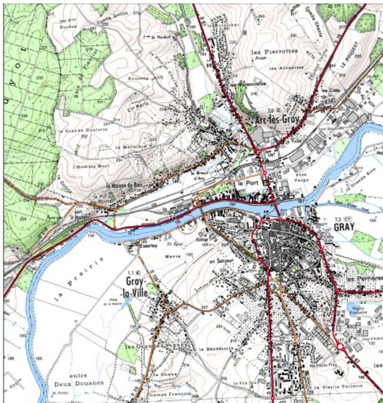
Carte de localisation. Carte topographique au 1:25000, I.G.N., Gray, 3222 E. 70, Gray, 29 quai Mavia