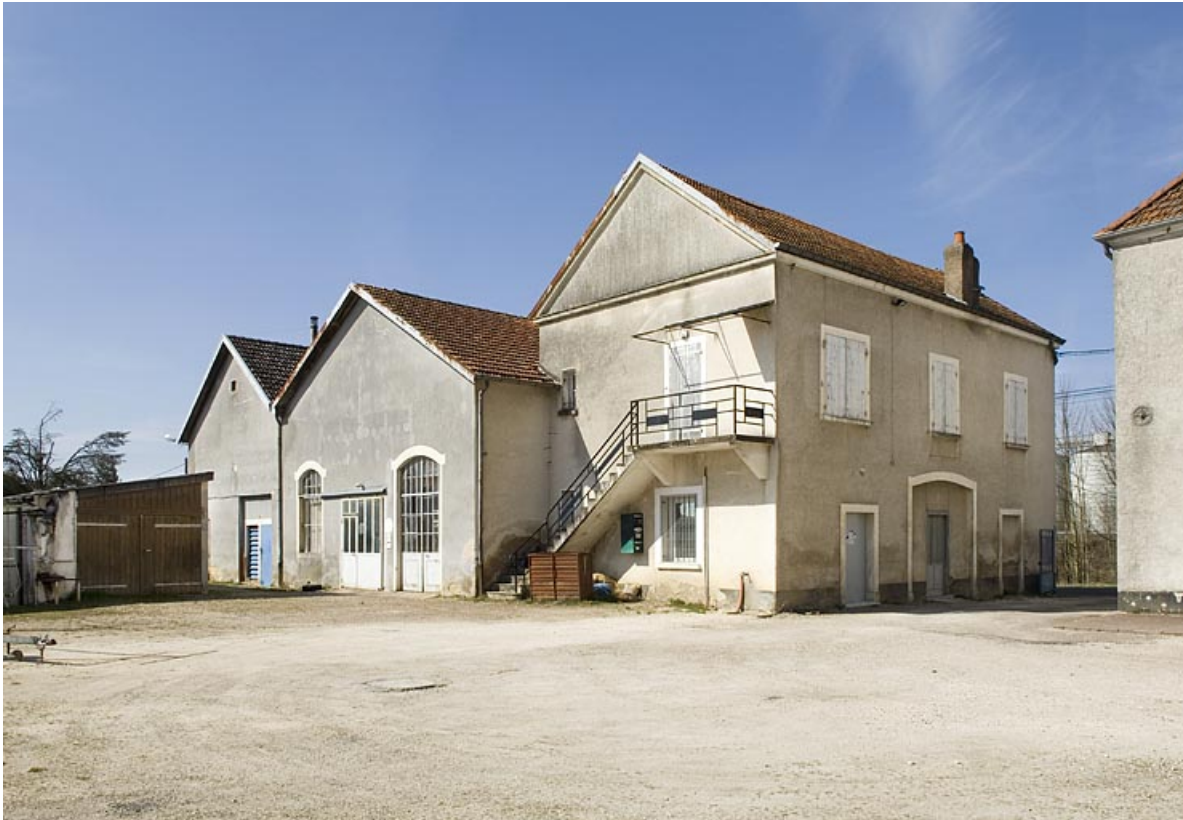
Bâtiments industriels. Atelier et entrepôt depuis la cour.