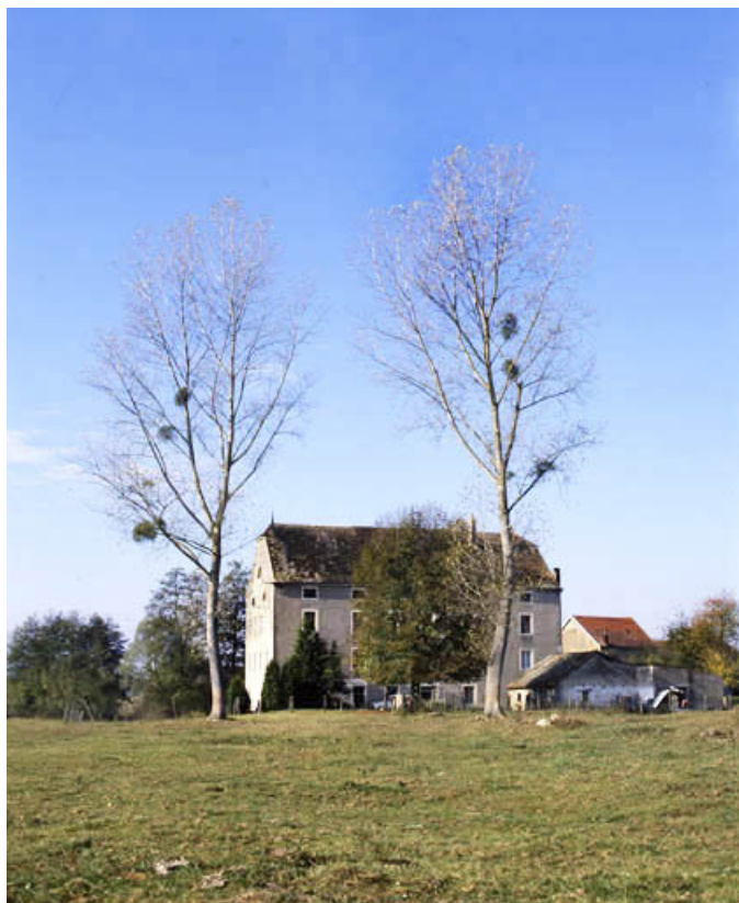
Vue d'ensemble depuis le sud en 1988.