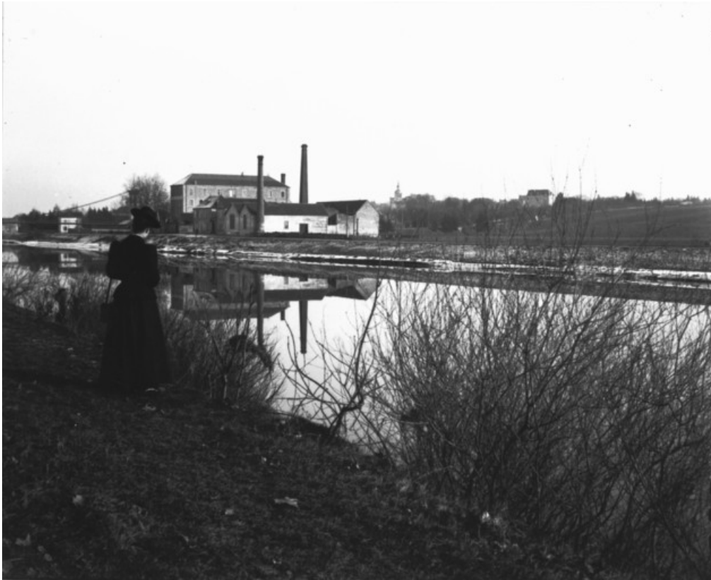
L'usine à gaz depuis la rive droite de la Saône.