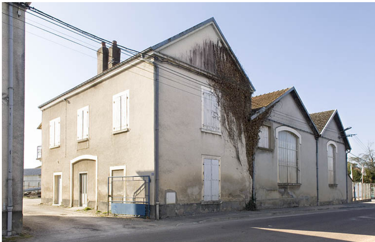
Bâtiments industriels. Logement, entrepôt et atelier.