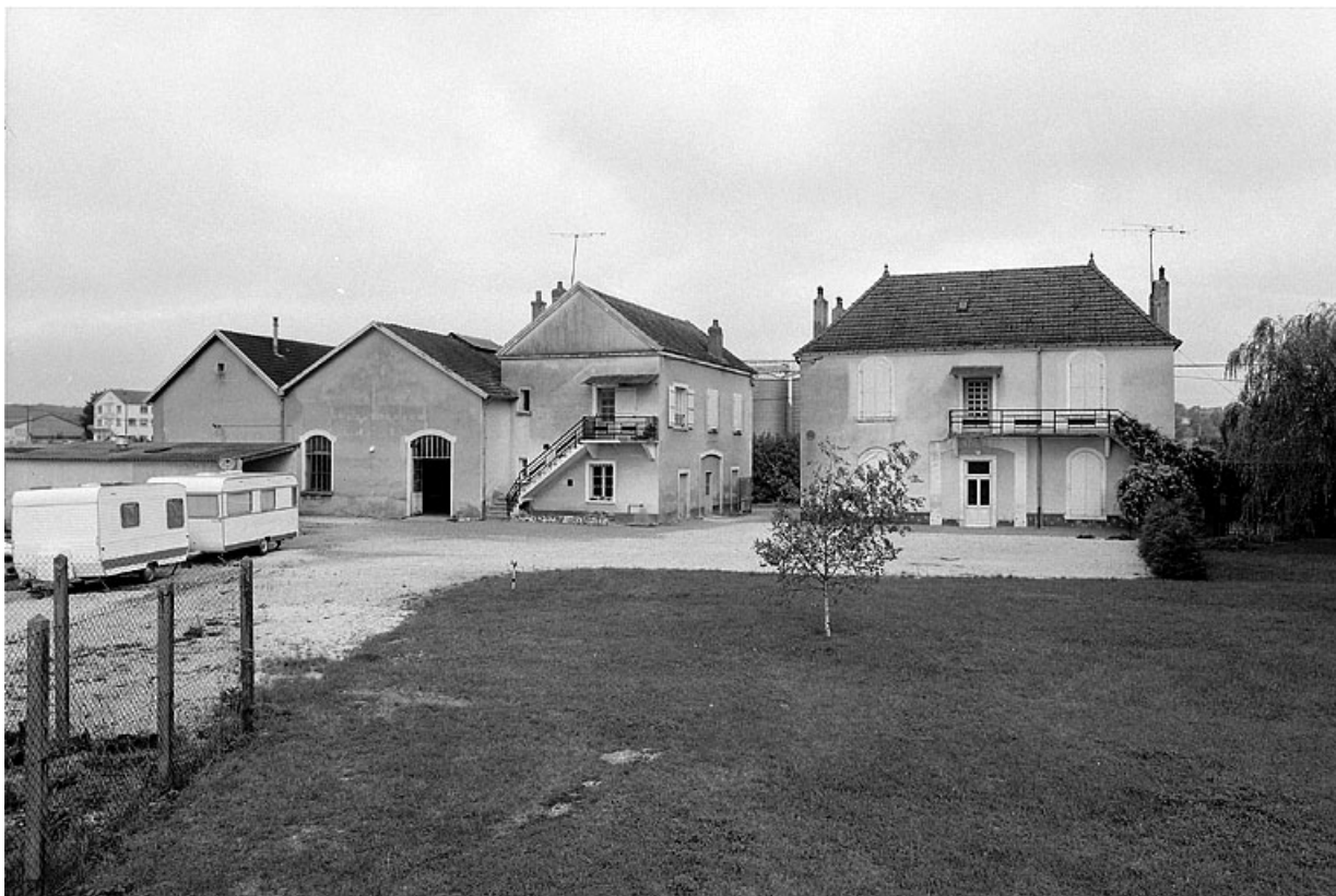
L'usine à gaz : façades postérieures.