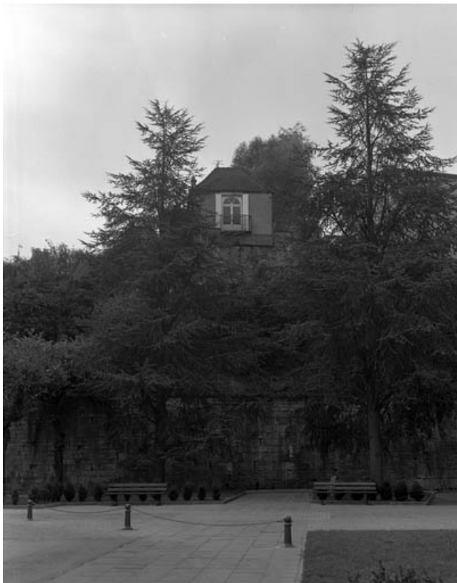
Restes du rempart du bastion du Boulevard dans la cour de l'hotel-dieu : de face. 70, Gray