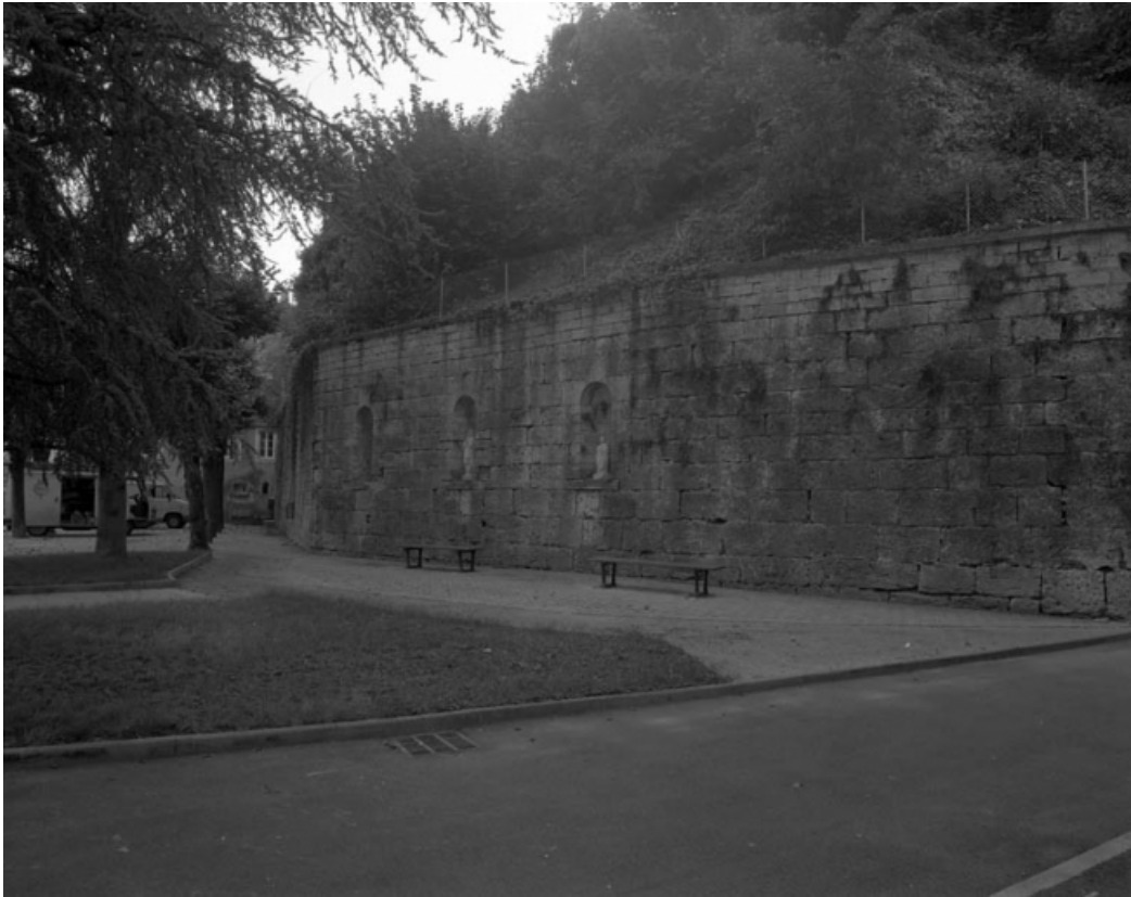
Restes du rempart du bastion du Boulevard dans la cour de l'hotel-dieu : partie inférieure de trois quarts droit. 70, Gray