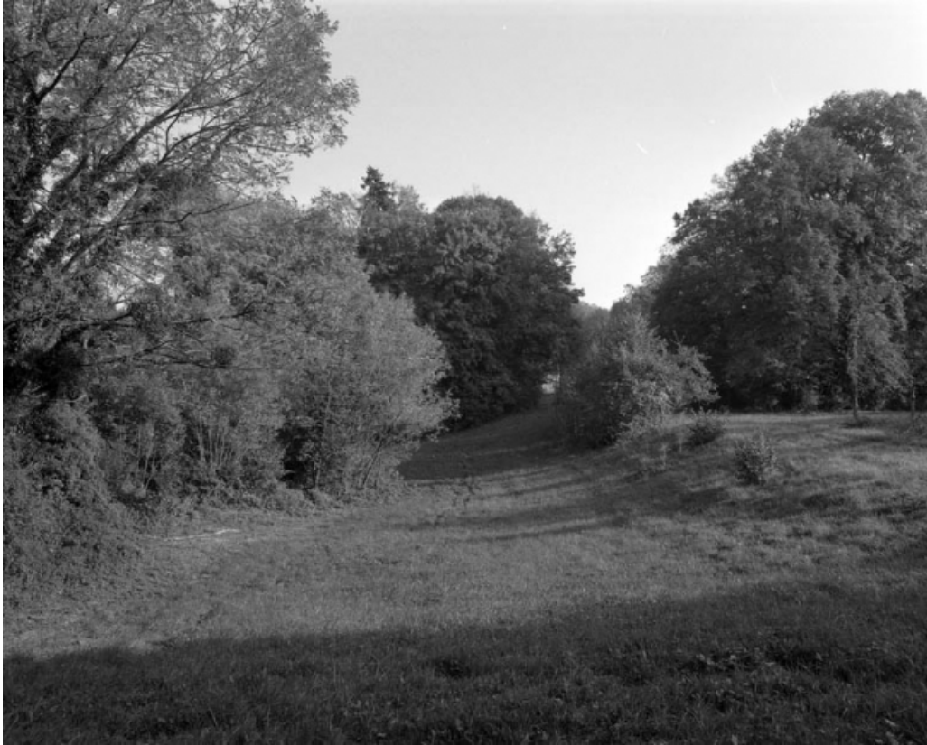
Restes de fossé du bastion de l'Arsenal (derrière l'actuelle chambre de commerce). 70, Gray