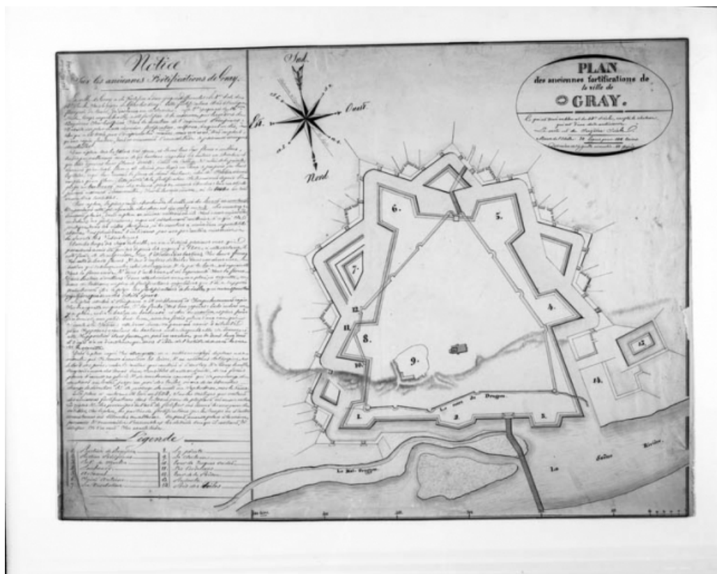
Dessin des anciennes fortifications.