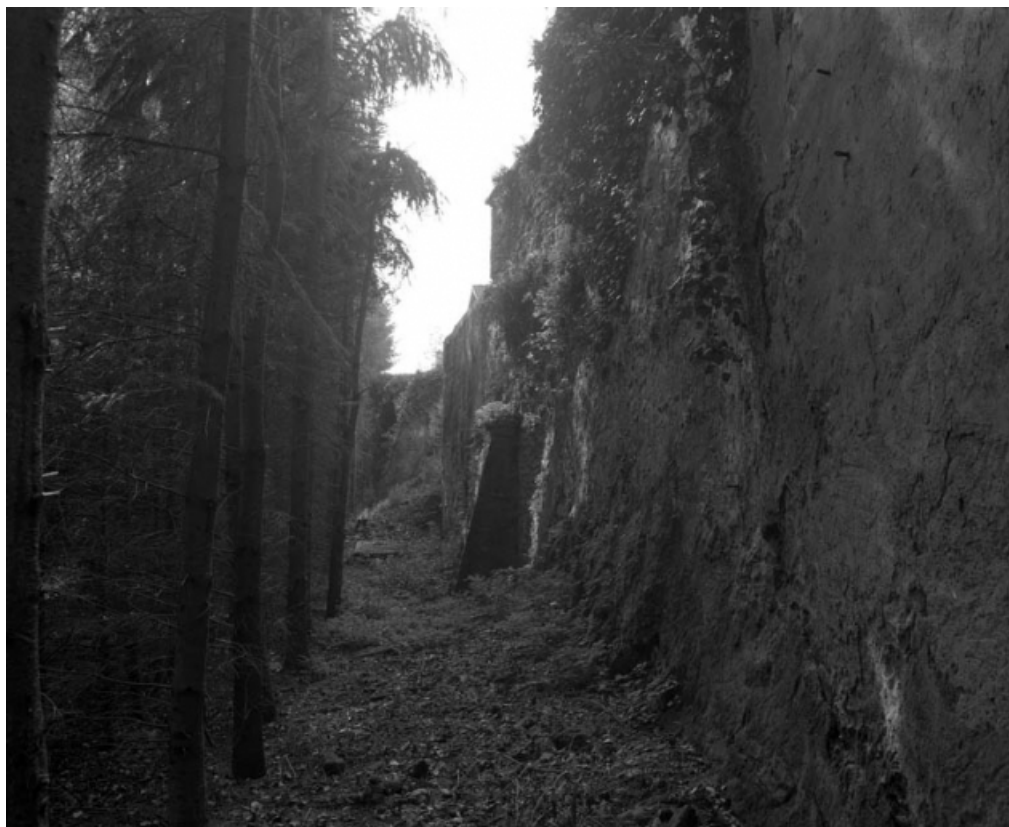
Restes du rempart du bastion de la Visitation (derrière la rue Cécile) : vue d'ensemble de trois quarts droit. 70, Gray