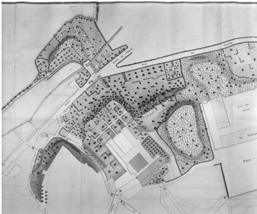
Plan de la porte Taclet avant sa disparition complète dans la première moitié du 19e siècle. 70, Gray

Dessin. Extrait du plan général de la ville de Gray en 1812. Lieu de conservation : Archives départementales de la Haute-Saône, Vesoul