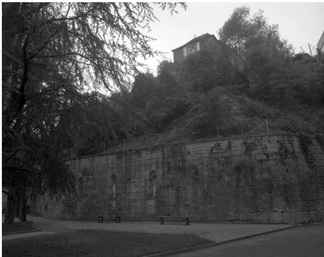
Restes du rempart du bastion du Boulevard dans la cour de l'hotel-dieu : angle de la partie inférieure. 70, Gray