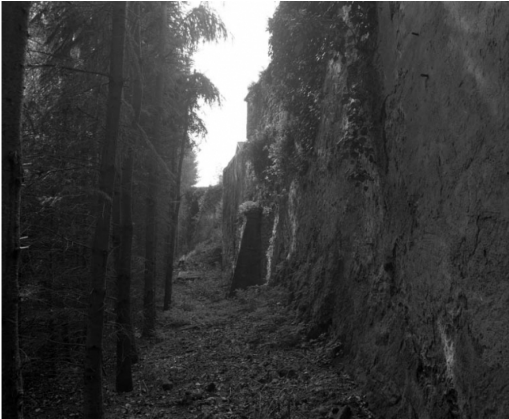
Restes du rempart du bastion de la Visitation (derrière la rue Cécile) : vue d'ensemble de trois quarts droit. 70, Gray