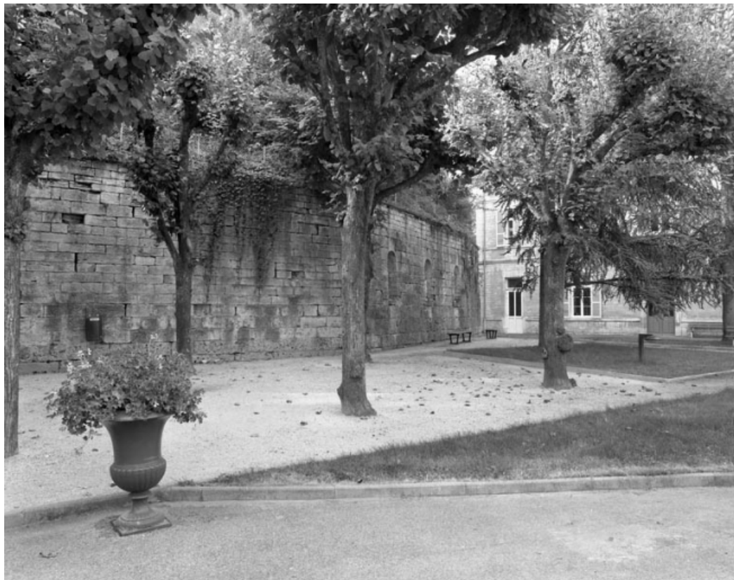
Restes du rempart du bastion du Boulevard dans la cour de l'hotel-dieu : partie inférieure de trois quarts gauche. 70, Gray