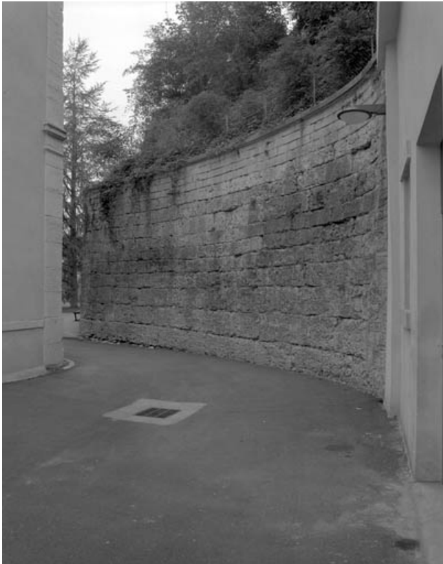
Restes du rempart du bastion du Boulevard dans la cour de l'hotel-dieu, à gauche de la façade antérieure de l'hotel-dieu. 70, Gray