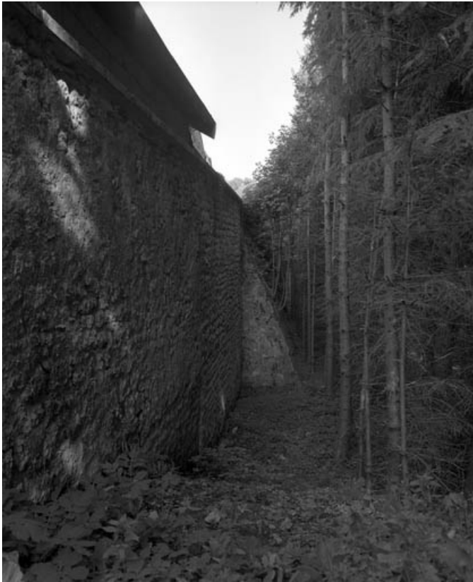
Restes de rempart du bastion de la Visitation (derrière la rue Cécile) : de trois quarts gauche. 70, Gray