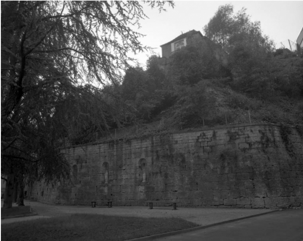
Restes du rempart du bastion du Boulevard dans la cour de l'hotel-dieu : angle de la partie inférieure. 70, Gray