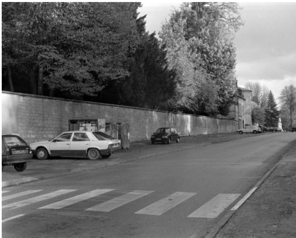
Restes de rempart le long de l'avenue Revon (vers l'ancien bastion de l'Arsenal). 70, Gray