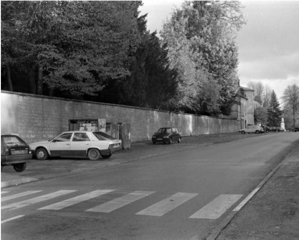
Restes de rempart le long de l'avenue Revon (vers l'ancien bastion de l'Arsenal). 70, Gray