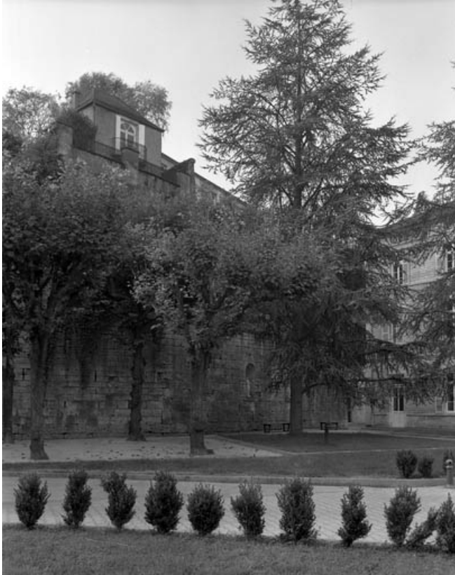
Restes du rempart du bastion du Boulevard dans la cour de l'hotel-dieu : de trois quarts gauche. 70, Gray