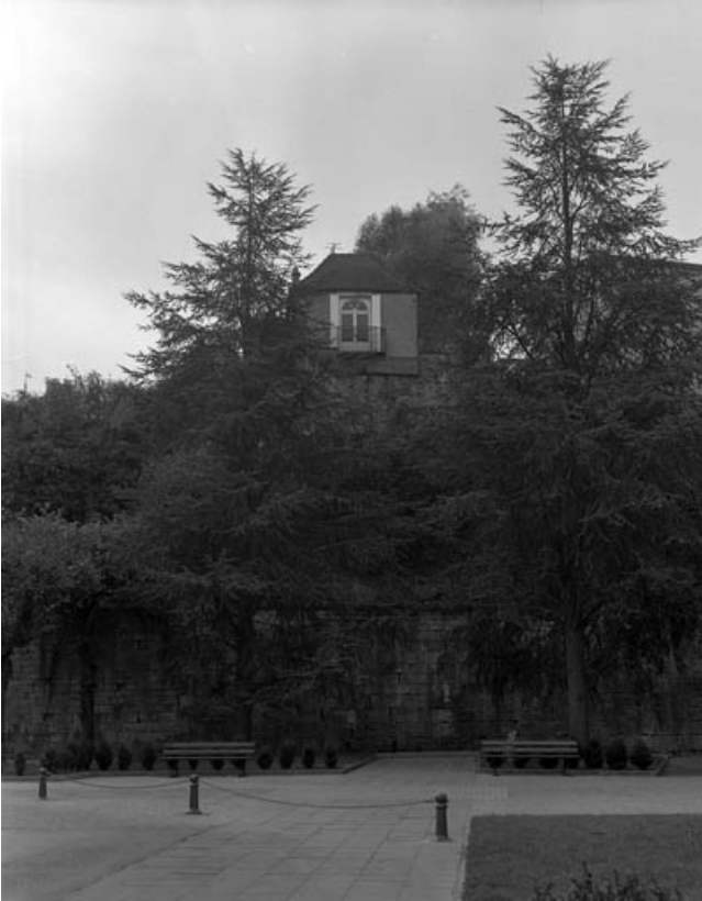
Restes du rempart du bastion du Boulevard dans la cour de l'hotel-dieu : de face. 70, Gray