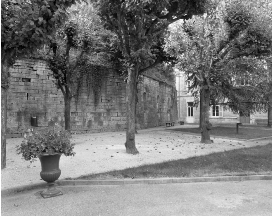
Restes du rempart du bastion du Boulevard dans la cour de l'hotel-dieu : partie inférieure de trois quarts gauche. 70, Gray