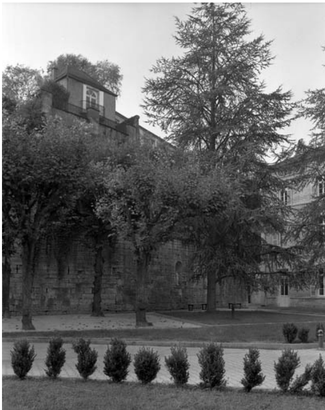
Restes du rempart du bastion du Boulevard dans la cour de l'hotel-dieu : de trois quarts gauche. 70, Gray