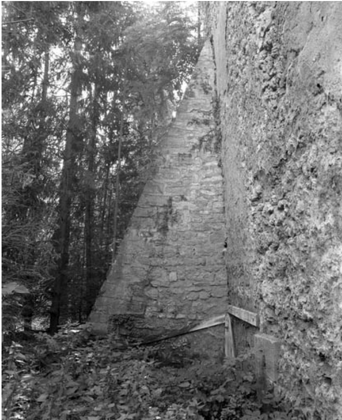
Restes de rempart du bastion de la Visitation (derrière la rue Cécile) : détail d'un contrefort. 70, Gray