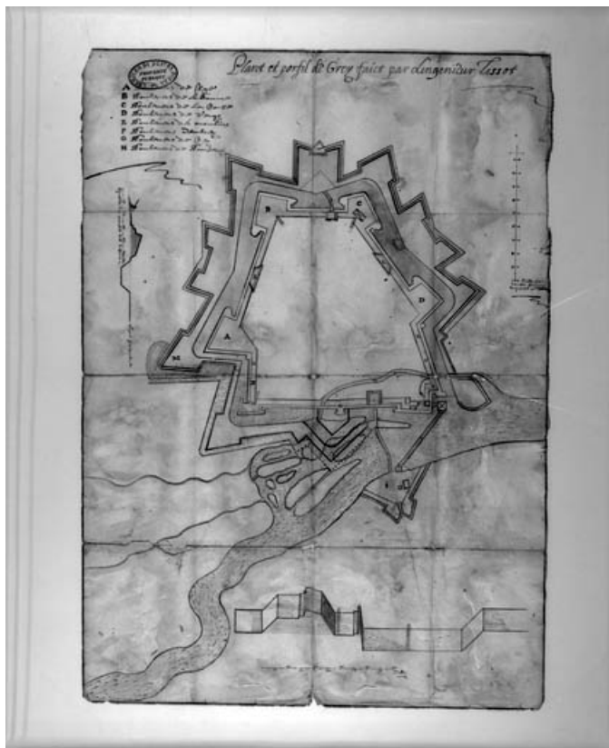
Plan des fortifications en 1632.