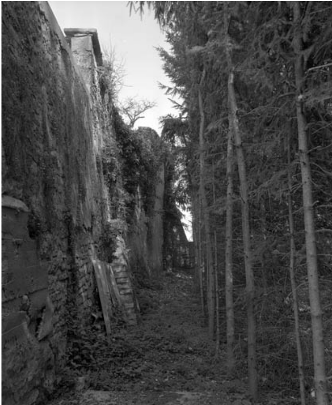
Restes de rempart du bastion de la Visitation (derrière la rue Cécile) : extrémité droite, de trois quarts gauche. 70, Gray