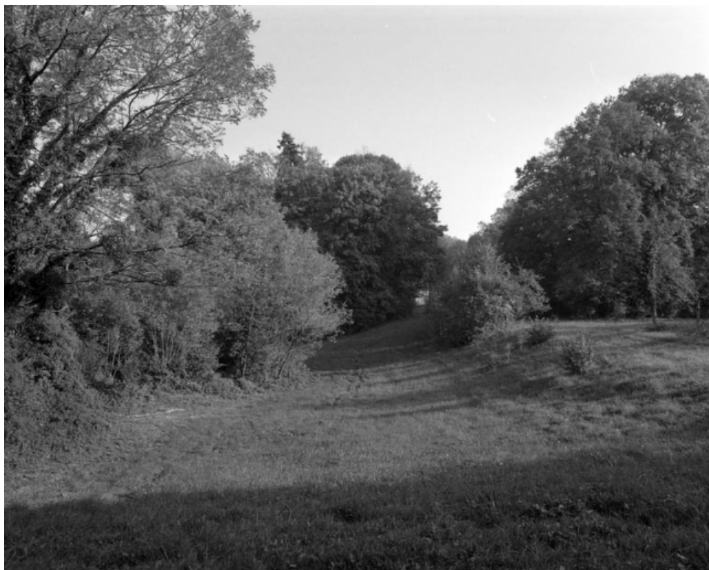
Restes de fossé du bastion de l'Arsenal (derrière l'actuelle chambre de commerce). 70, Gray