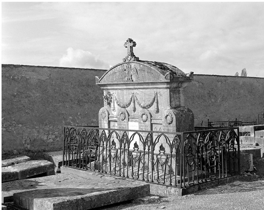
Tombeau des familles Petiet et Petitguyot, de trois quarts droit.