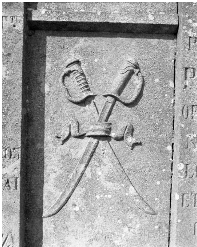
Détail : épées entrecroisées.