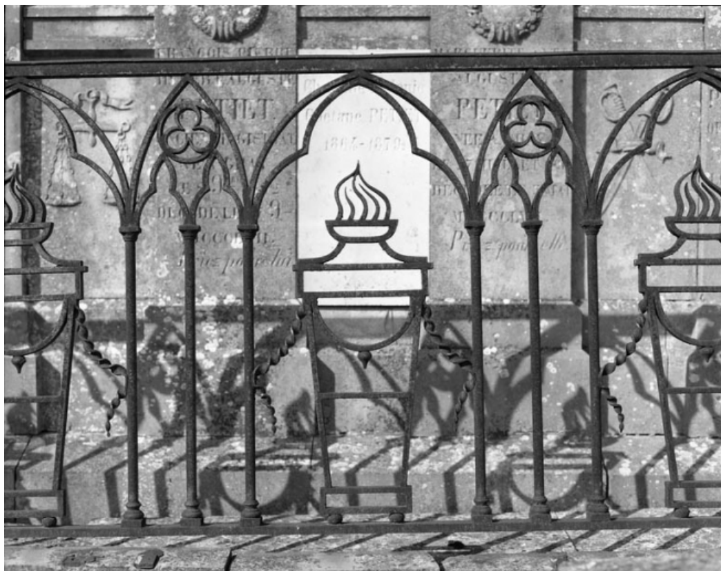
Détail de la clôture.