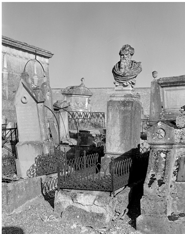
Tombeau du docteur Signard : de trois quarts gauche.