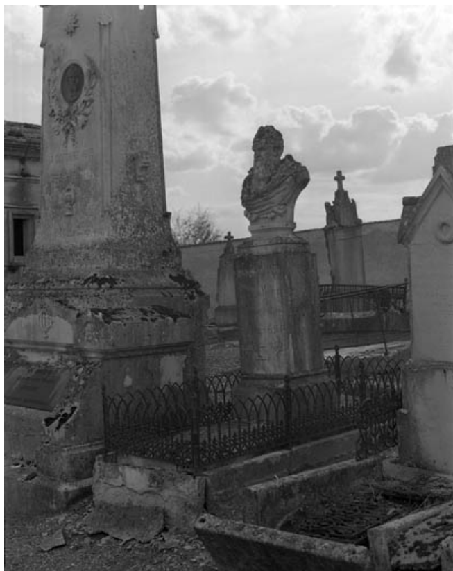
Vue de trois quarts droit.