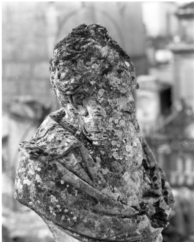
Détail de l'altération de la pierre sur le buste.