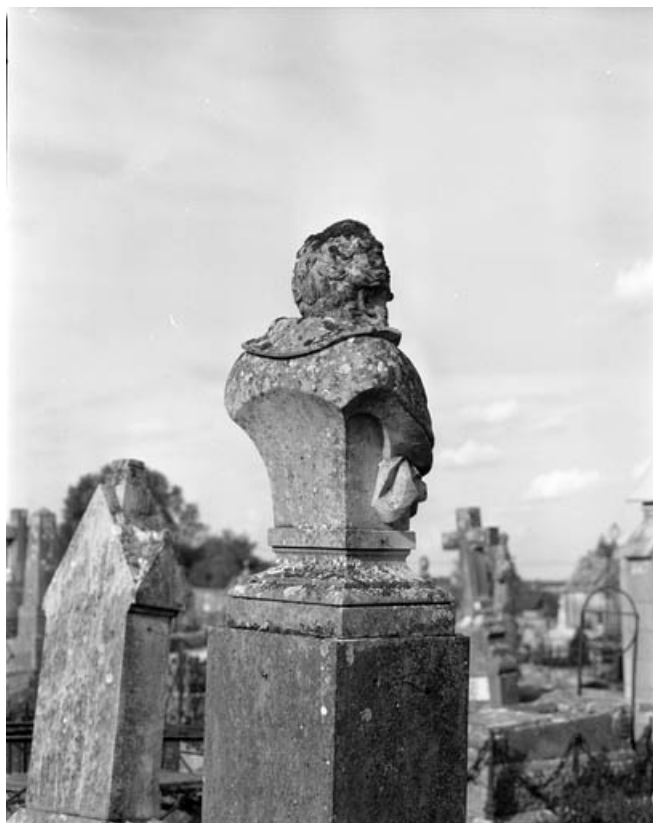
Revers du buste de trois quart droit.