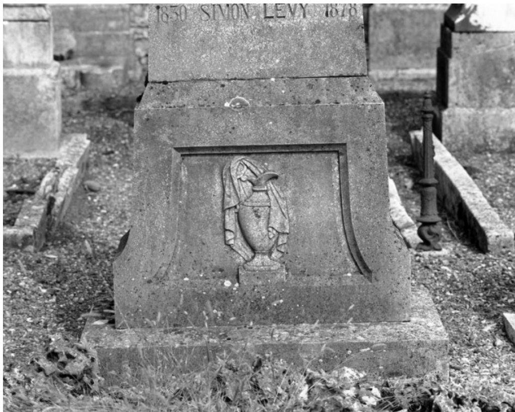
Détail de la base de la stèle.