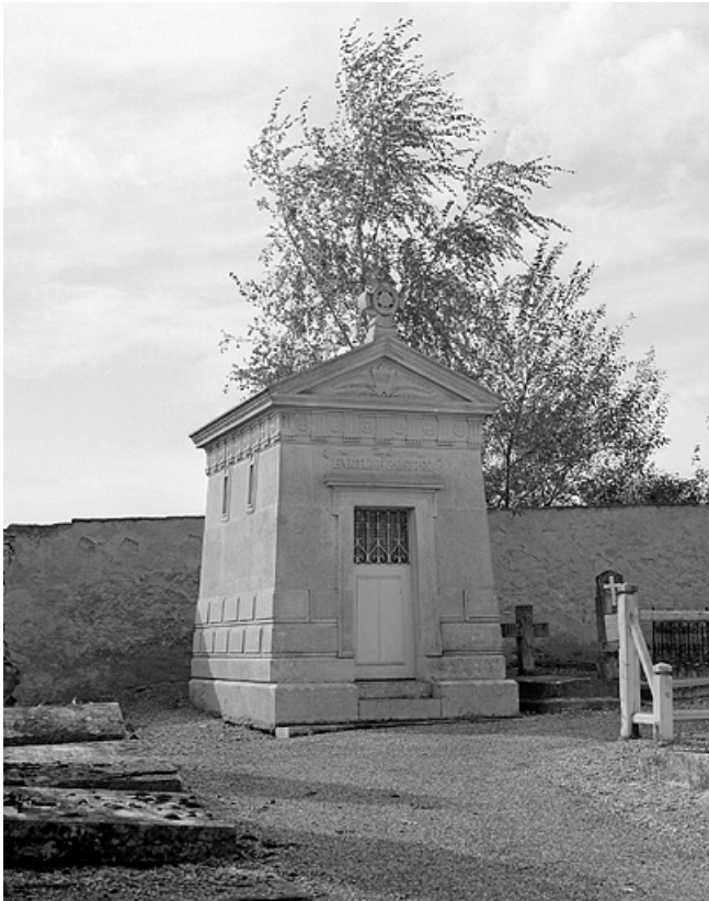
Chapelle funéraire de la famille Rossen : de trois quarts gauche.