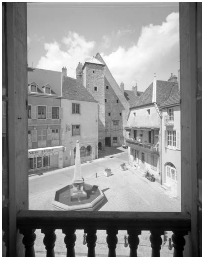
Place de la Petite Fontaine depuis l'immeuble situé 21 rue du Marché, avec l'encadrement de la fenêtre. 70, Gray