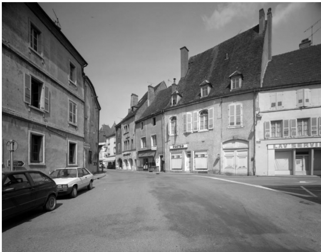
Rue du Marché en direction de l'hôtel de ville.