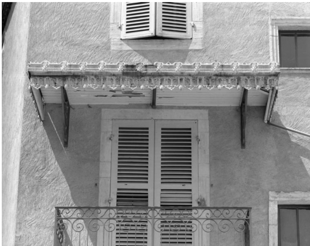
Place de la Petite Fontaine : détail de l'auvent du balcon de l'édifice droit. 70, Gray