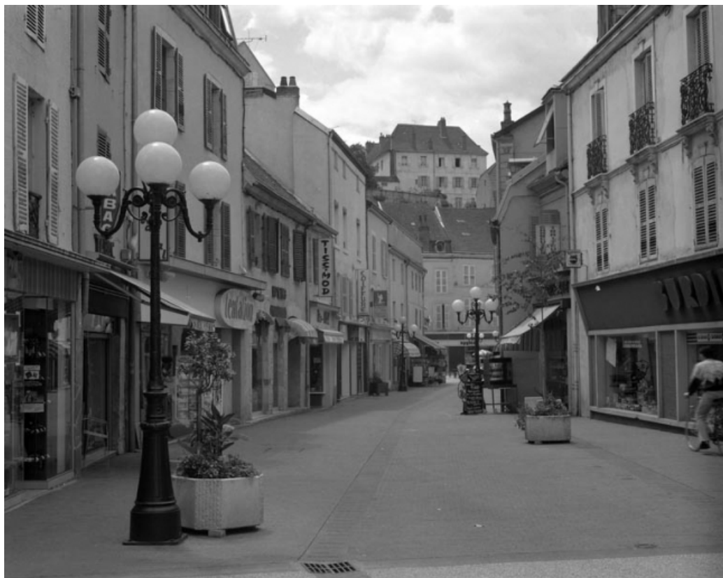
Vue de la rue Thiers en direction de la rue Vanoise. 70, Gray