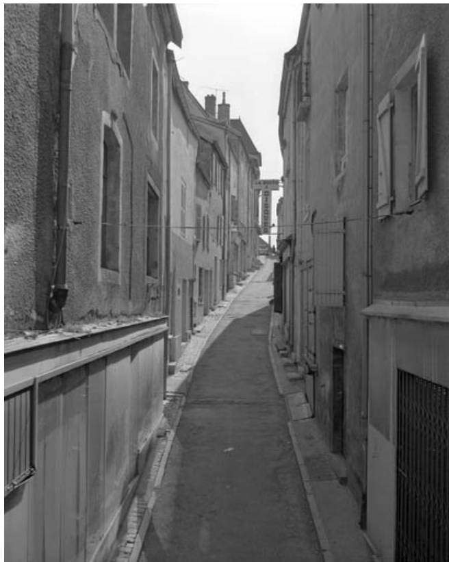
Vue de la rue des Terreaux.