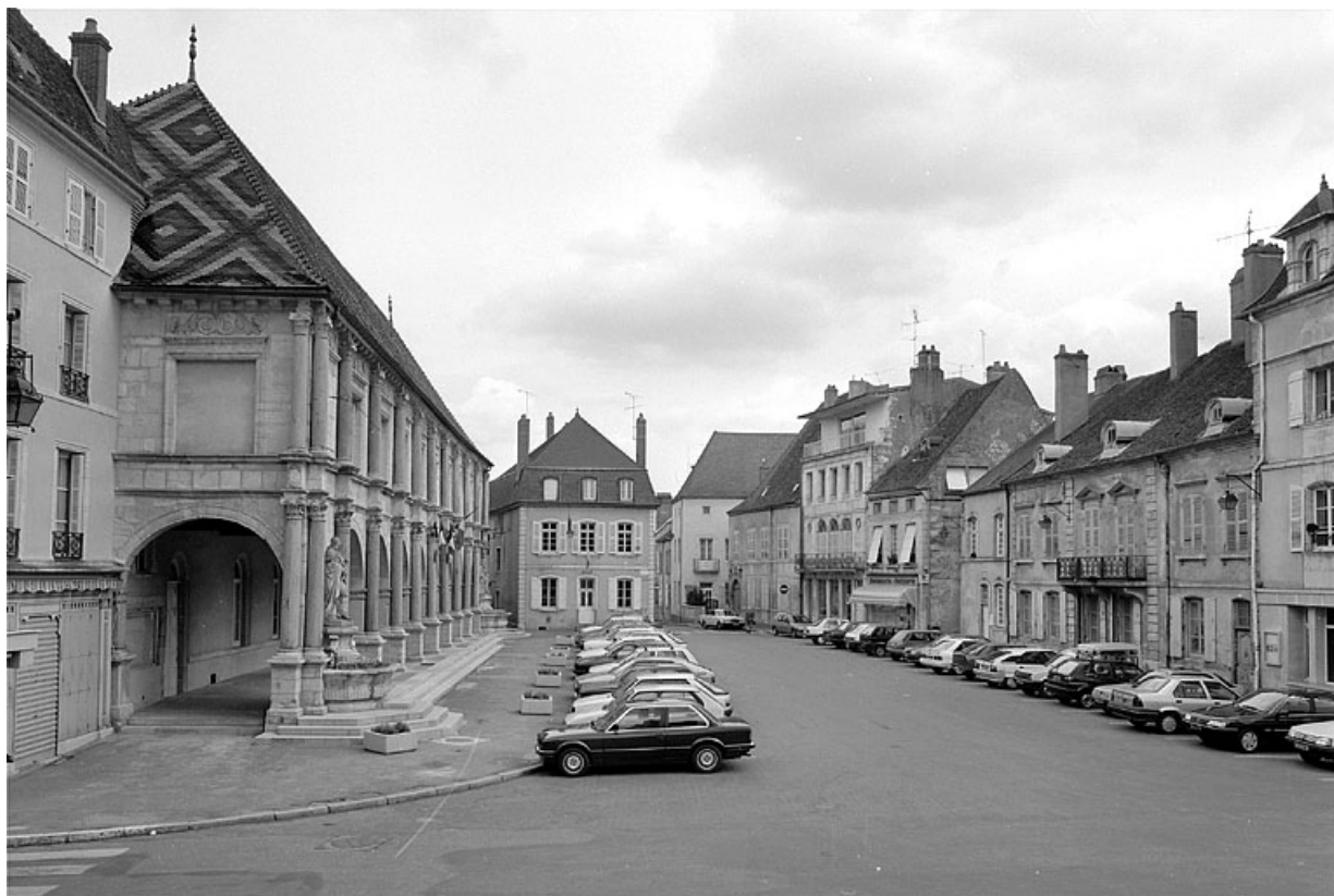
Place de Gaulle : vue d'ensemble.