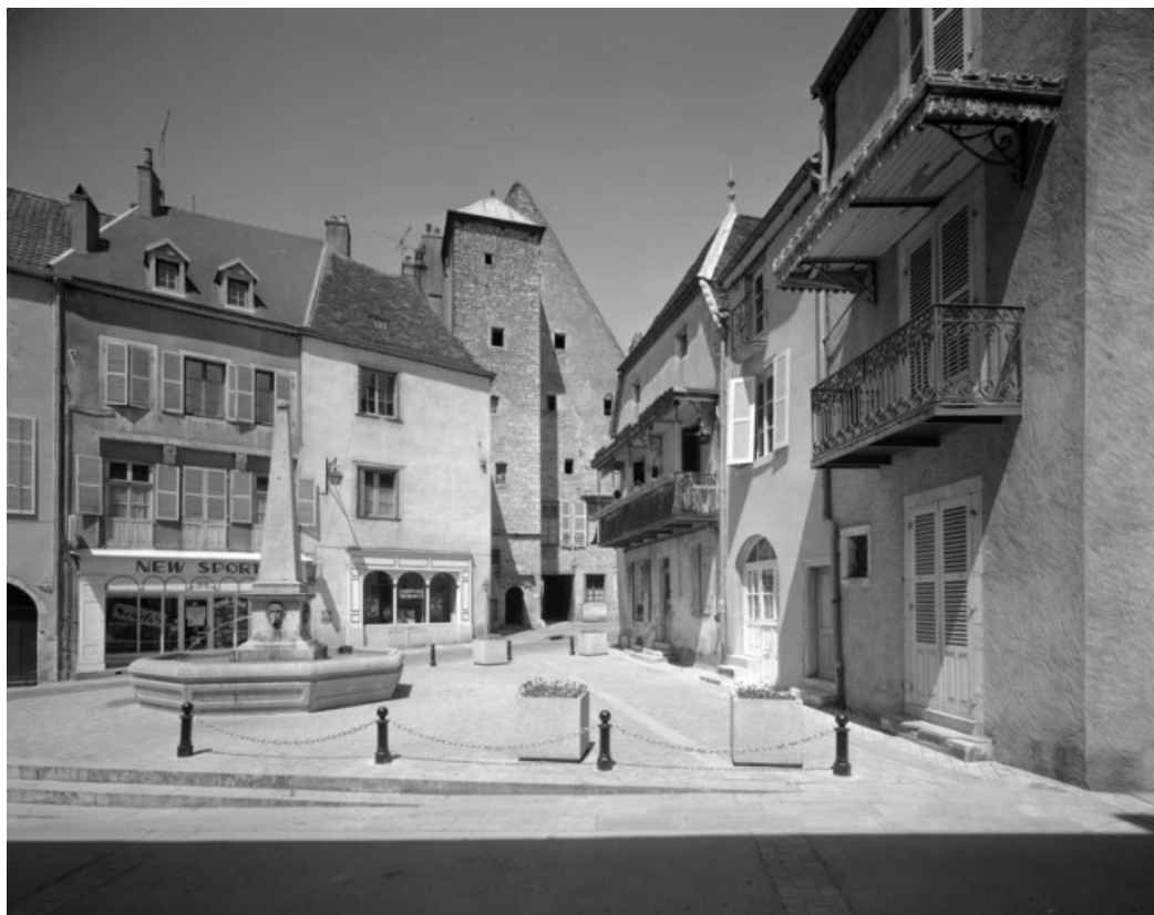
Place de la Petite Fontaine depuis la rue de la Petite Fontaine. 70, Gray