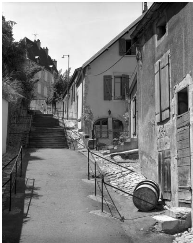
Rue du Tertre du Château.