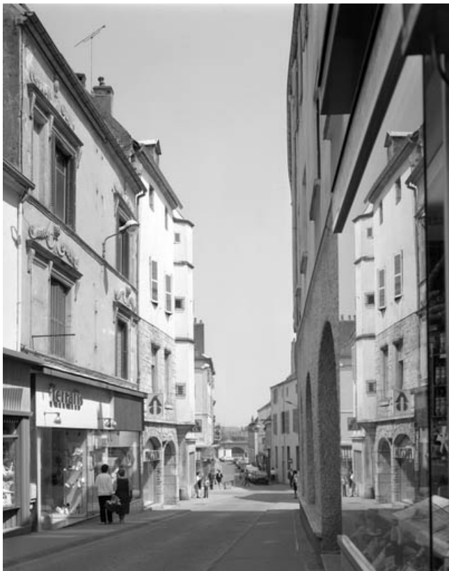
Vue de la Grande rue au niveau du n° 99. 70, Gray