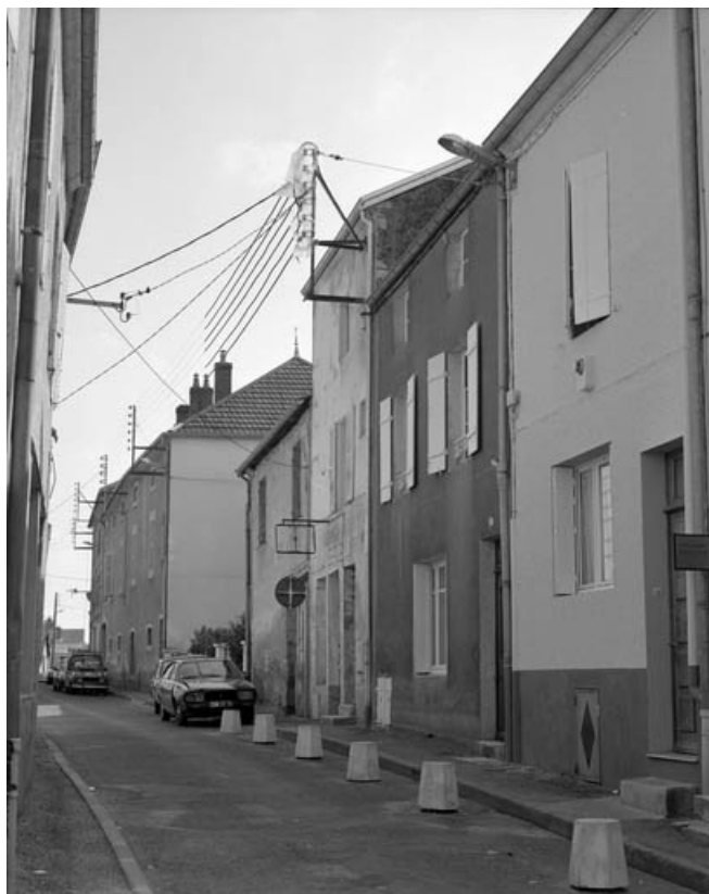
Vue de la rue de Belfort.