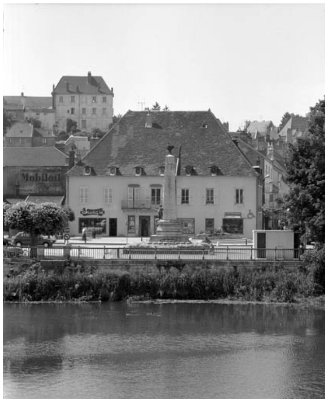
Place du Quatre Septembre aménagée en 1846, vue éloignée. 70, Gray