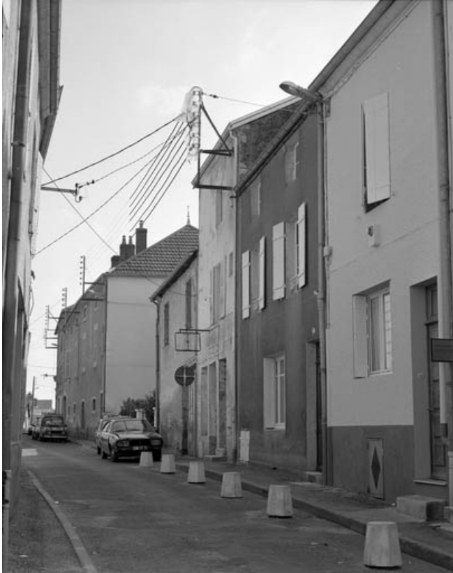
Vue de la rue de Belfort. 70, Gray