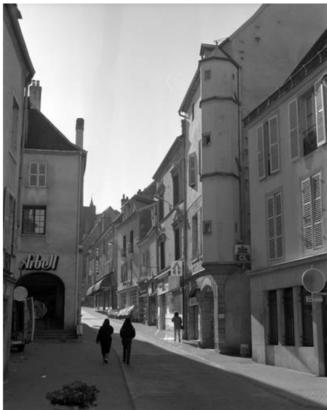
Vue de la Grande rue depuis le carrefour de la rue de l'Abreuvoir. 70, Gray