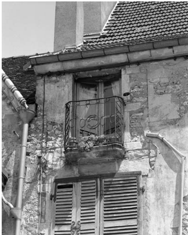
Place de la Petite Fontaine : détail du balcon d'un des édifices formant le fond de la place. 70, Gray