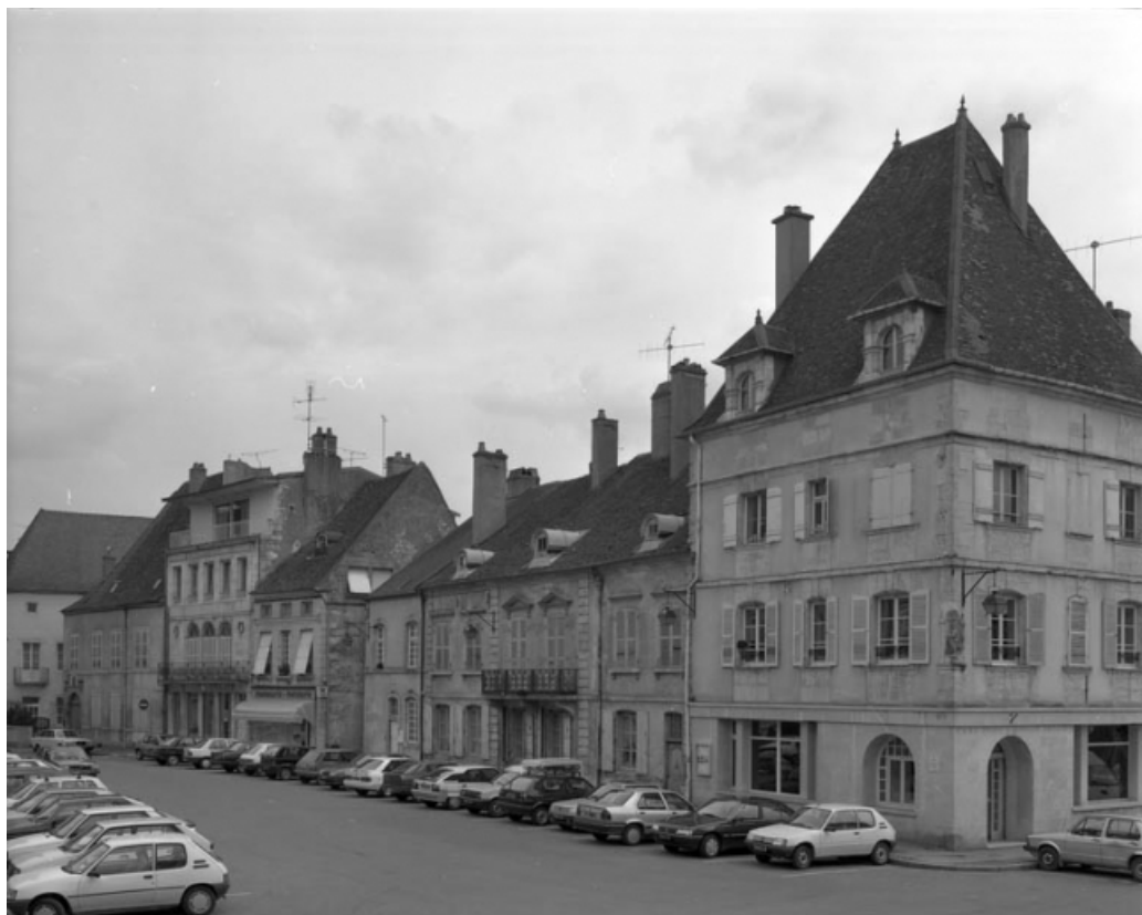
Place de Gaulle : édifices situés en face de l'hôtel de ville.