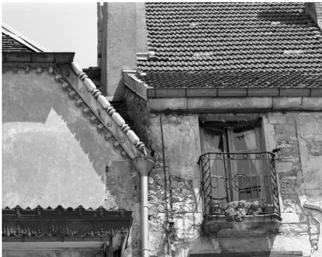
Place de la Petite Fontaine : détail des toitures et balcon des édifices formant le fond de la place. 70, Gray