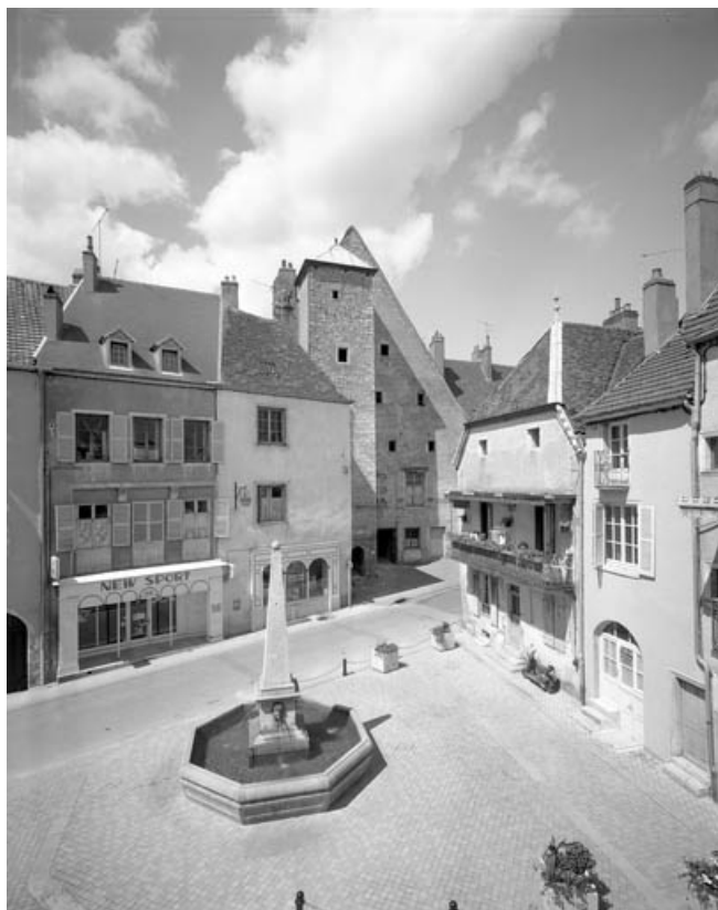
Place de la Petite Fontaine depuis l'immeuble situé 21 rue du Marché. 70, Gray