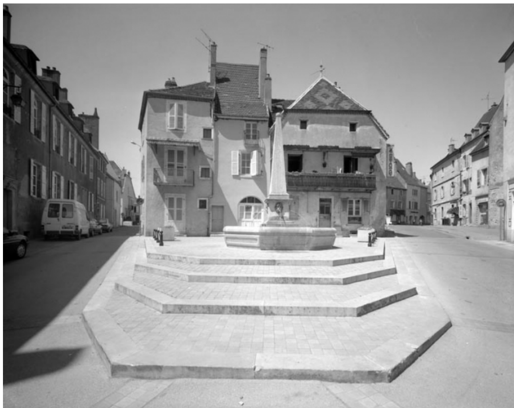
Place de la Petite Fontaine depuis le bas de la rue du Marché. 70, Gray