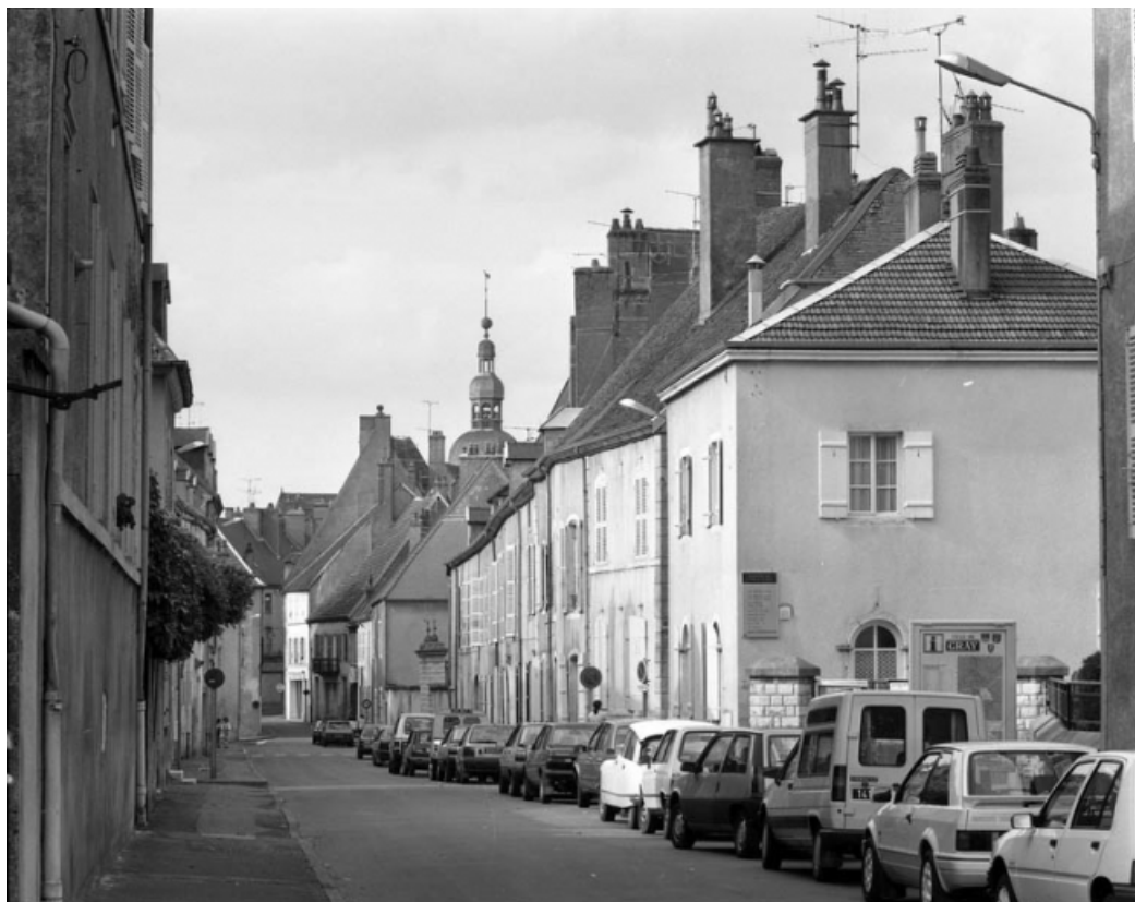
Rue Victor Hugo. 70, Gray