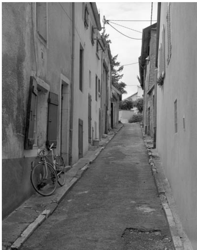
Rue de l'Ancienne Comédie.