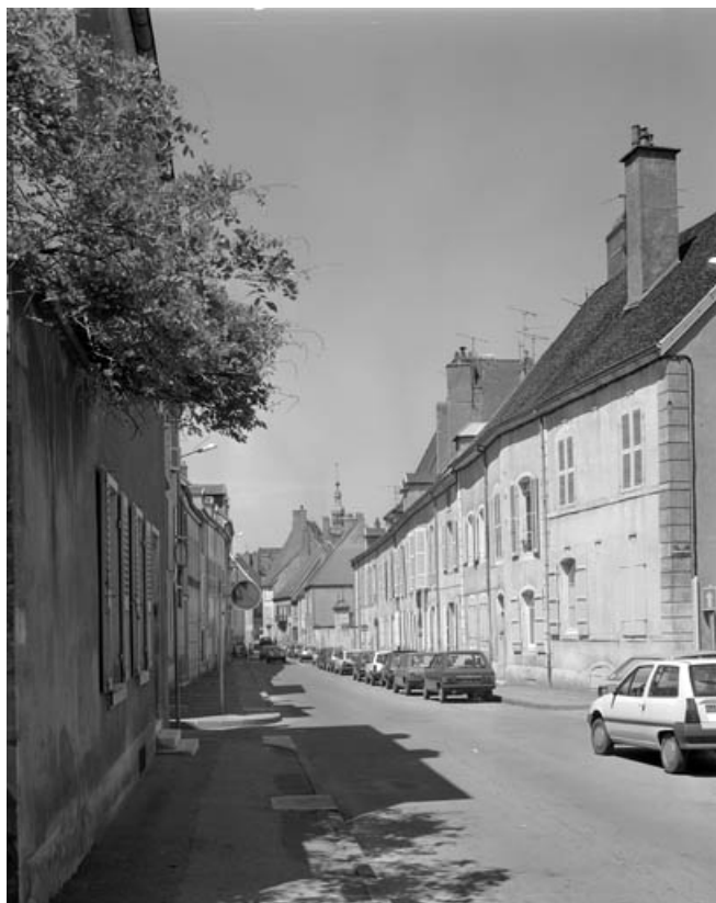
Vue de la rue Victor Hugo depuis l'emplacement de l'ancien couvent des Carmes. 70, Gray