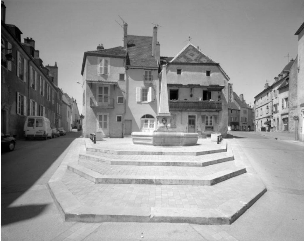
Place de la Petite Fontaine depuis le bas de la rue du Marché. 70, Gray