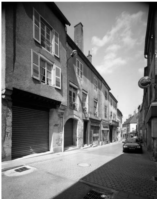
Vue de la Grande rue à la hauteur de la rue des Terreaux. 70, Gray