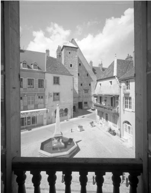
Place de la Petite Fontaine depuis l'immeuble situé 21 rue du Marché, avec l'encadrement de la fenêtre. 70, Gray