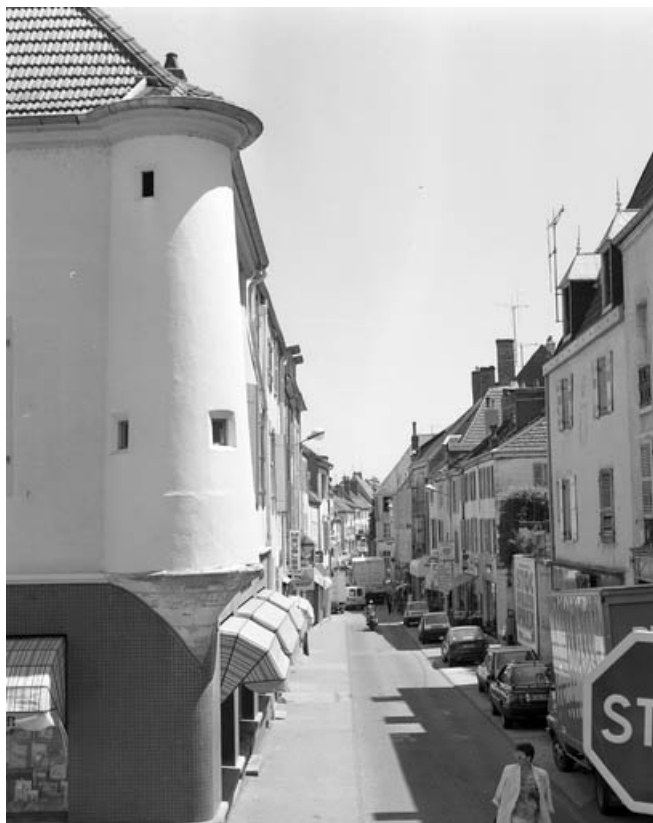
Vue de la rue Vanoise.