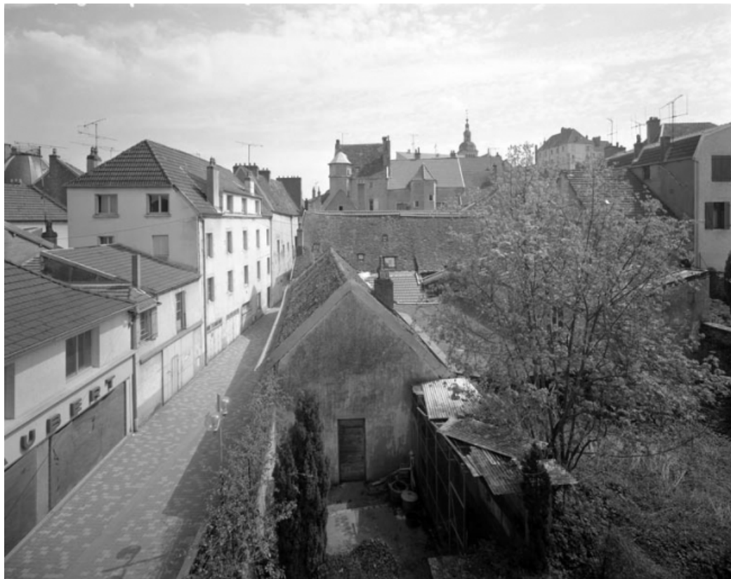
Rue de l'Abreuvoir.