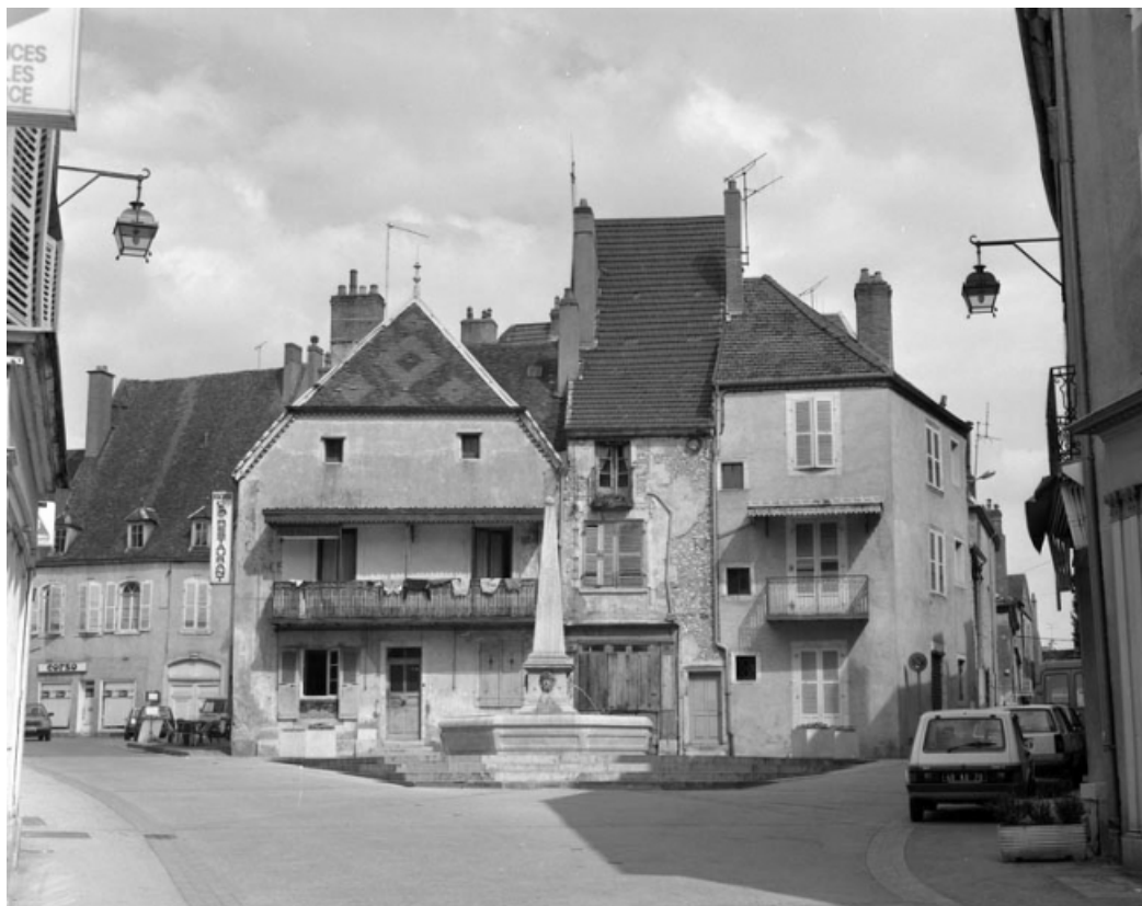
Place de la Petite Fontaine.