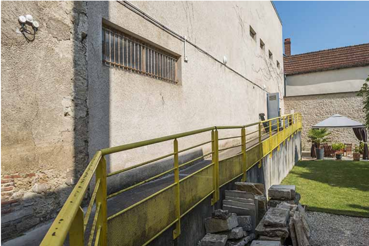
Façade est et organe de circulation extérieure de la cantine.