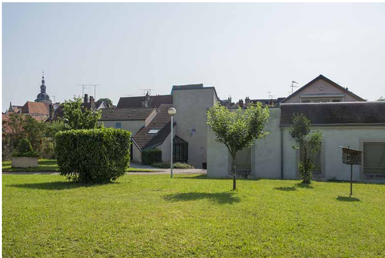
Vue d'ensemble des façades postérieures nord-ouest de la cantine. 70, Gray, 4 rue Rossen