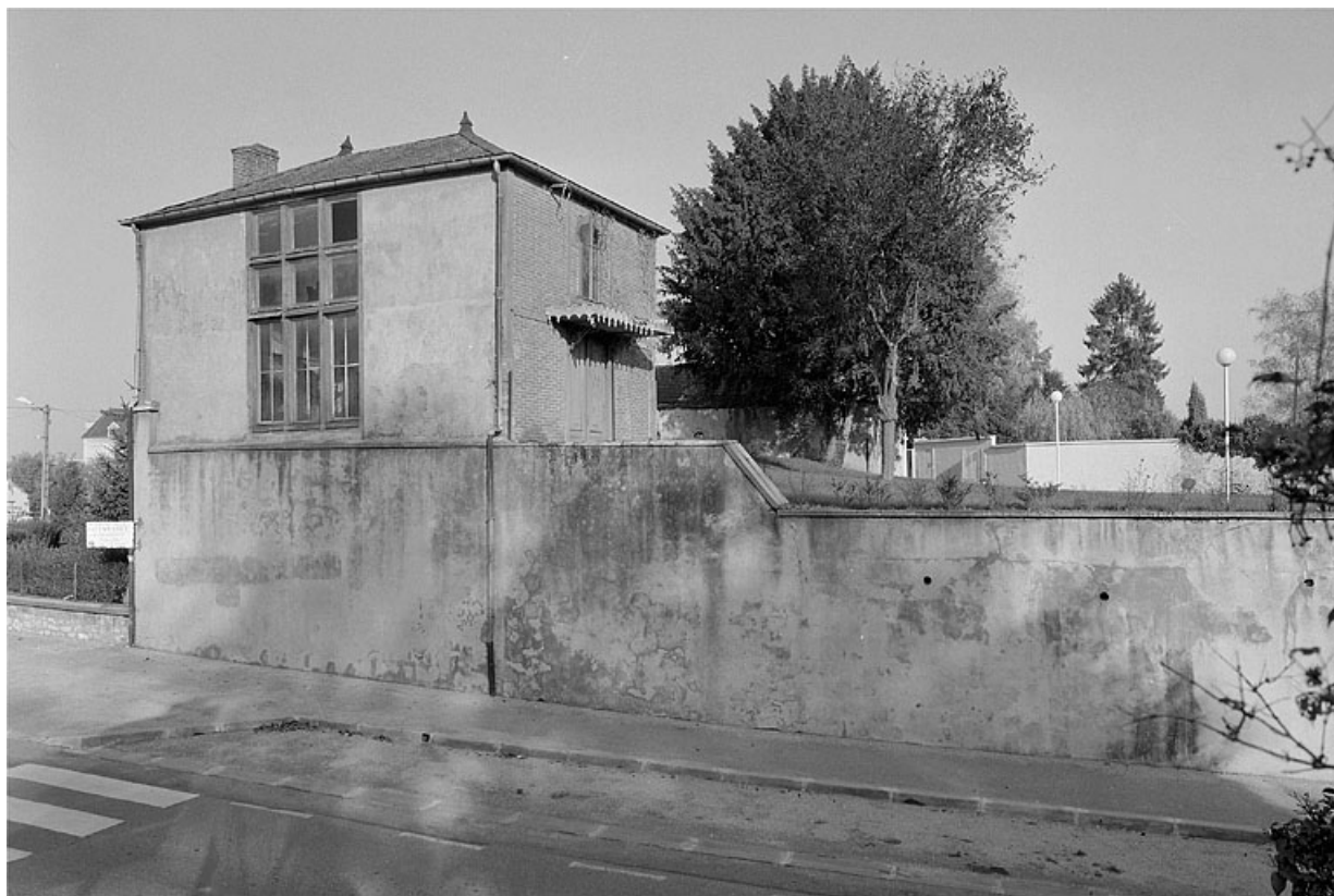
Fabrique de jardin : de trois quarts gauche.