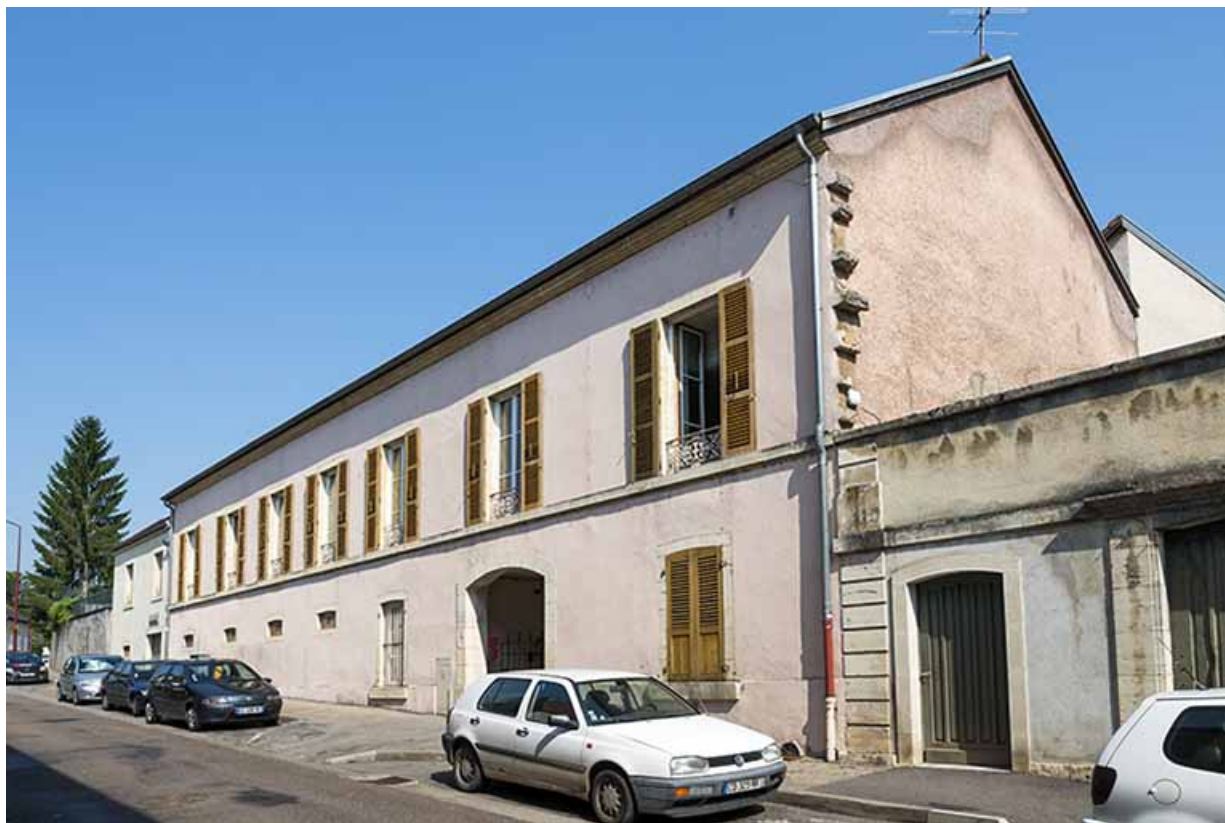
Angle sud-est de la cantine, 4 rue Rossen.