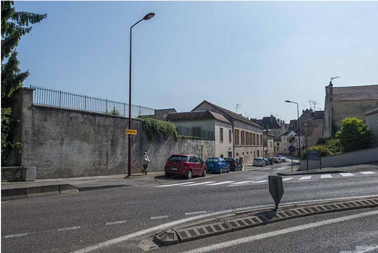
Vue d'ensemble depuis l'ouest sur la façade antérieure de la cantine, rue Rossen.