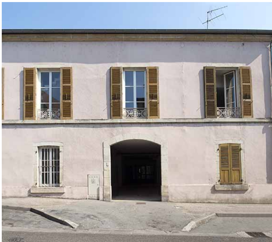
Entrée de la cantine 4 rue Rossen.