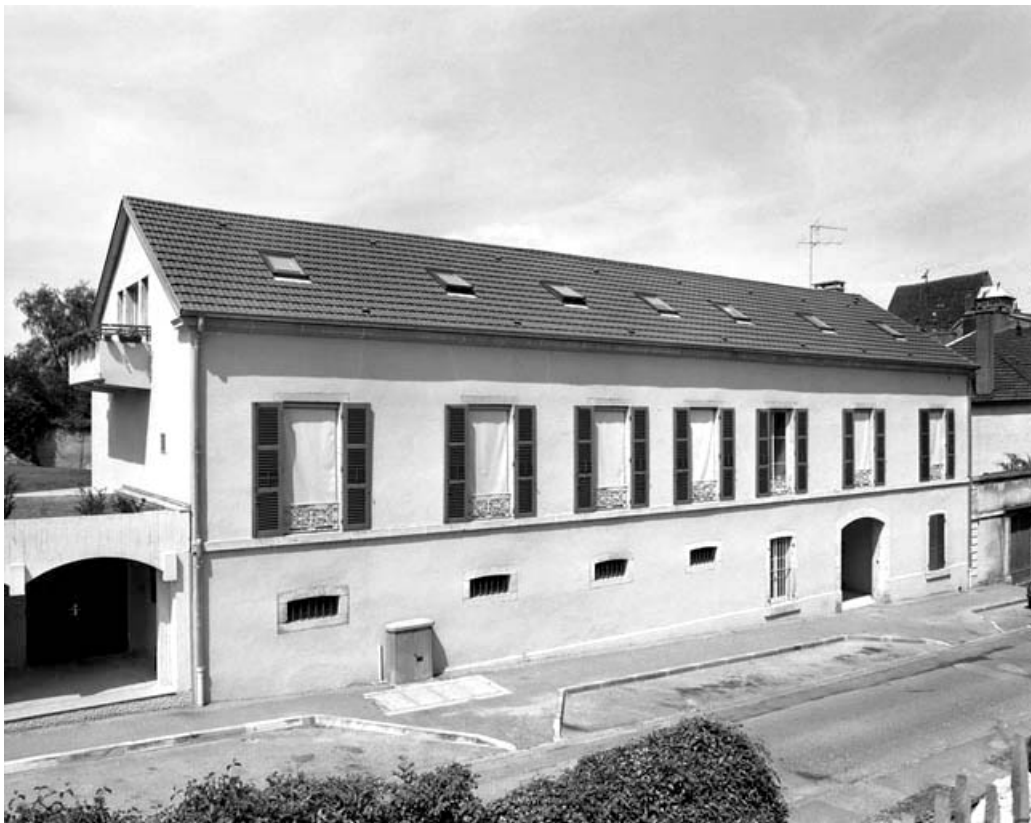
Façades antérieure et latérale gauche.