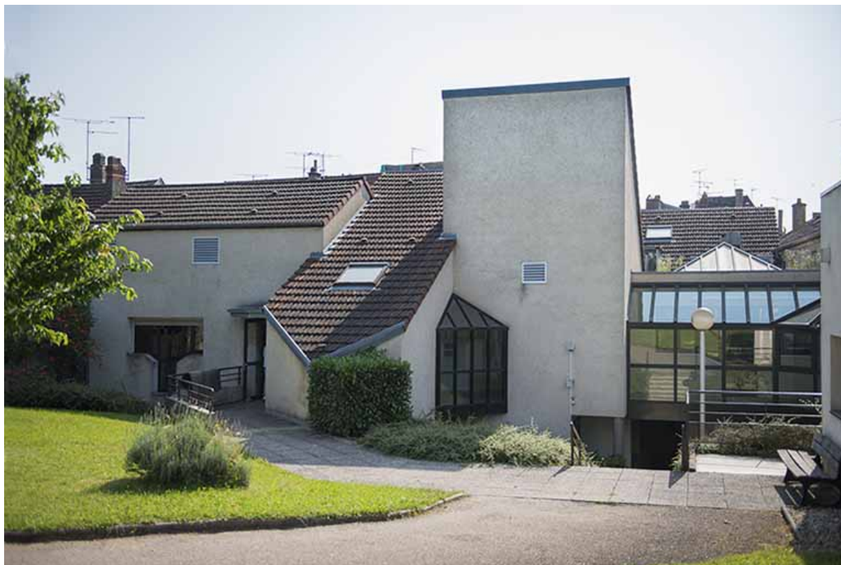
Façade ouest des cuisines.