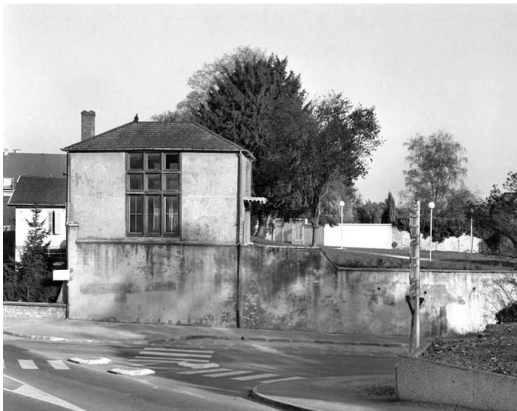
Fabrique de jardin : façade latérale gauche.