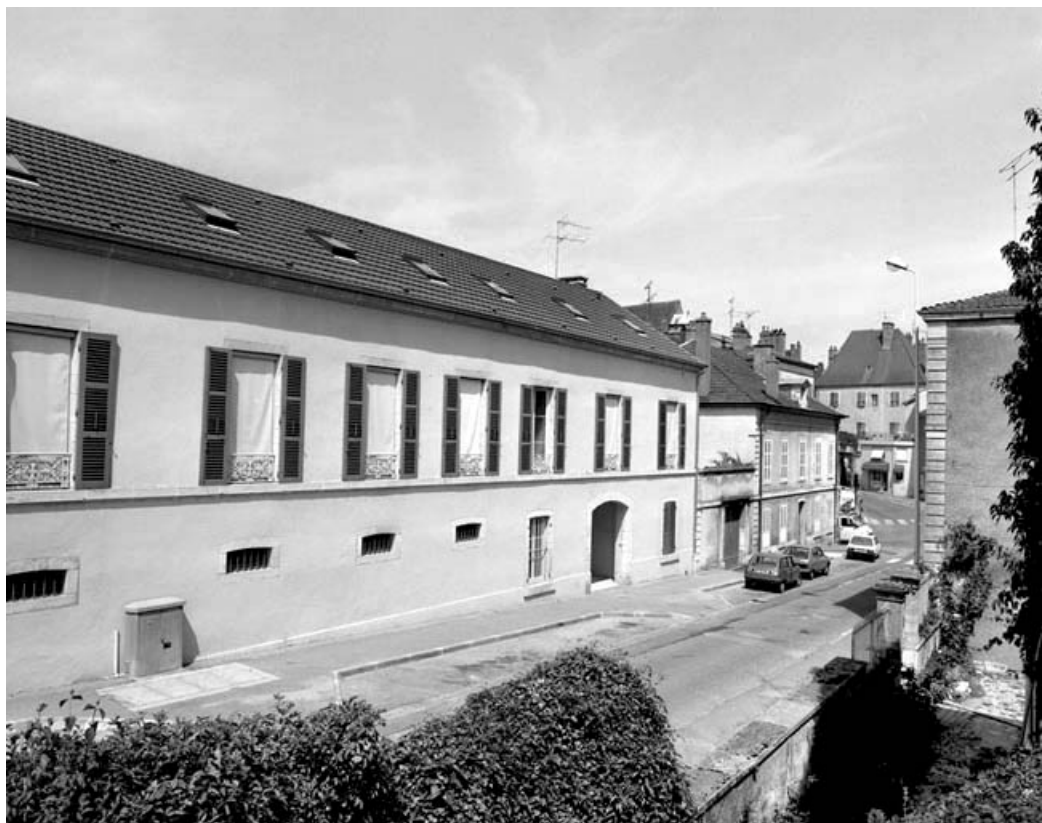
Façade antérieure de trois quarts gauche.