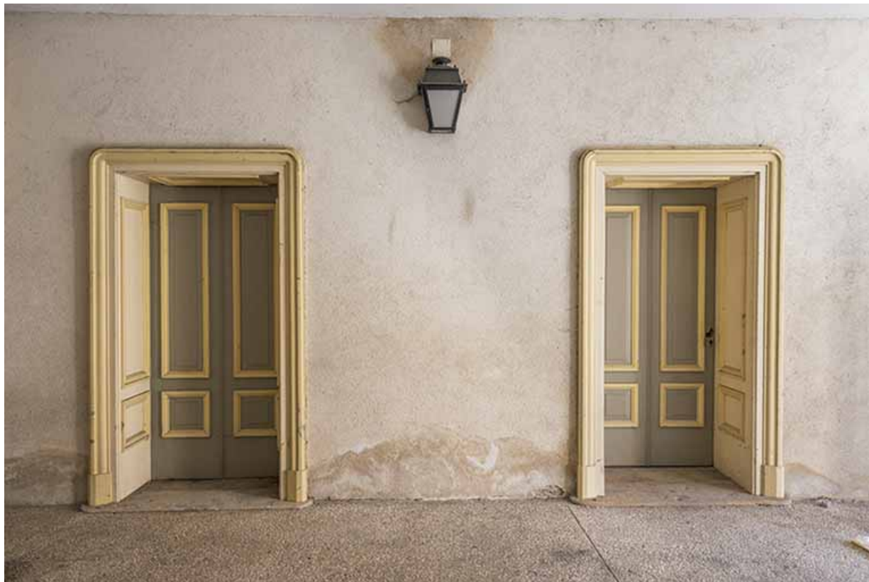
Dans l'entrée de la cantine.