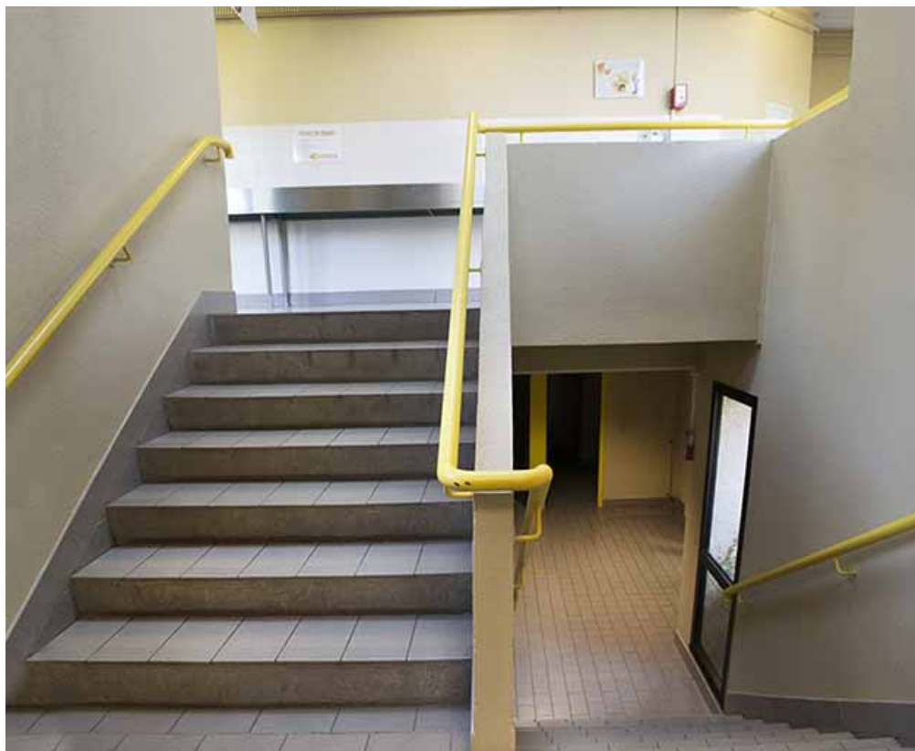
Escalier dans la cantine.