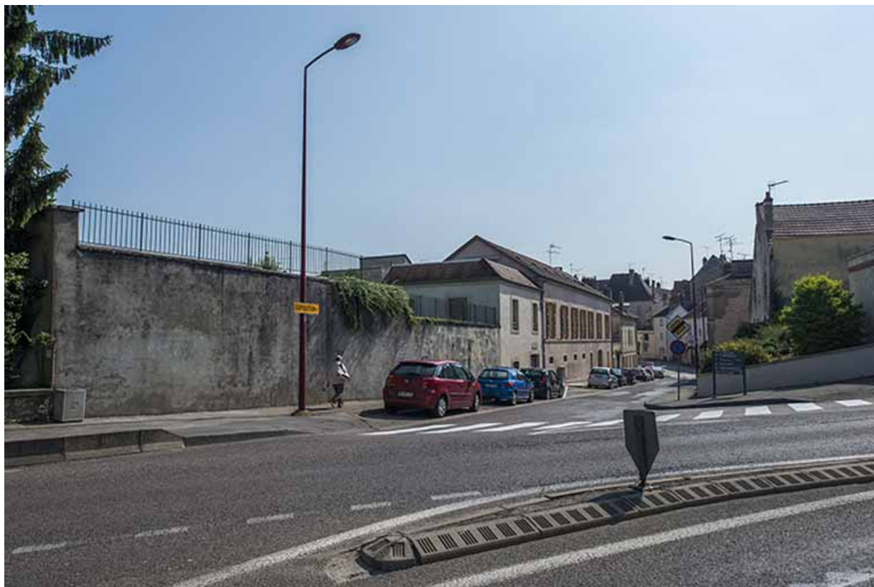
Vue d'ensemble depuis l'ouest sur la façade antérieure de la cantine, rue Rossen. 70, Gray, 4 rue Rossen