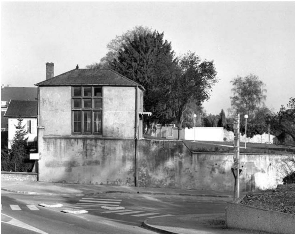
Fabrique de jardin : façade latérale gauche.