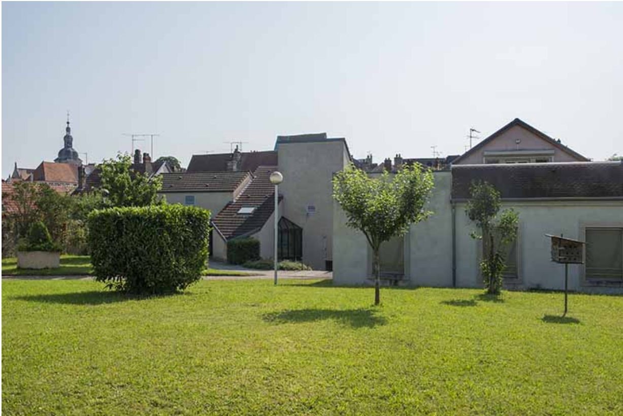
Vue d'ensemble des façades postérieures nord-ouest de la cantine.