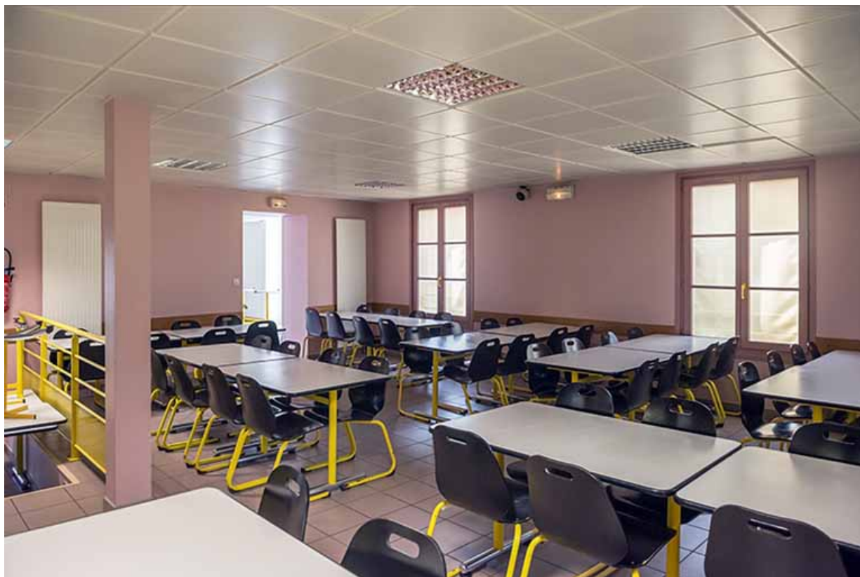
Dans la cantine.