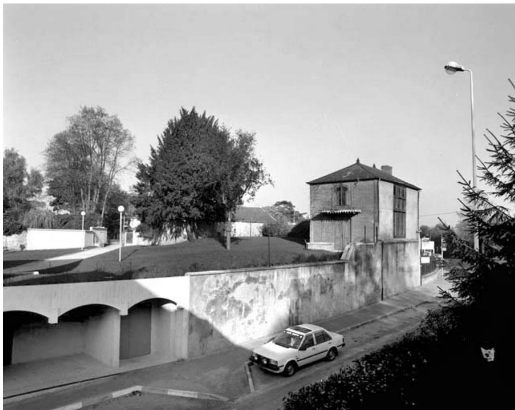
Fabrique de jardin depuis la rue Rossen : vue éloignée.