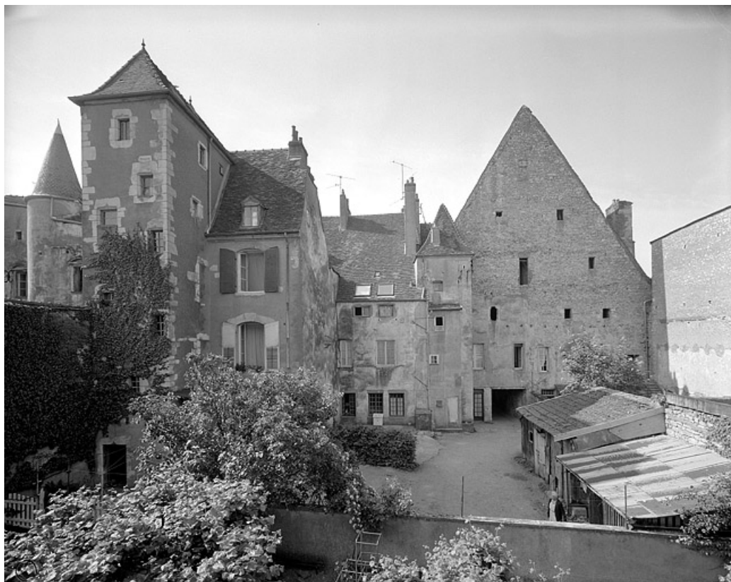
Façade postérieure, vue éloignée, avec la tour Saint Pierre Fourier à gauche. 70, Gray, 10, 12 rue du Marché