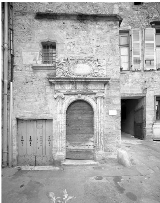
Détail de la porte d'entrée de l'escalier demi hors-oeuvre. 70, Gray, 10, 12 rue du Marché