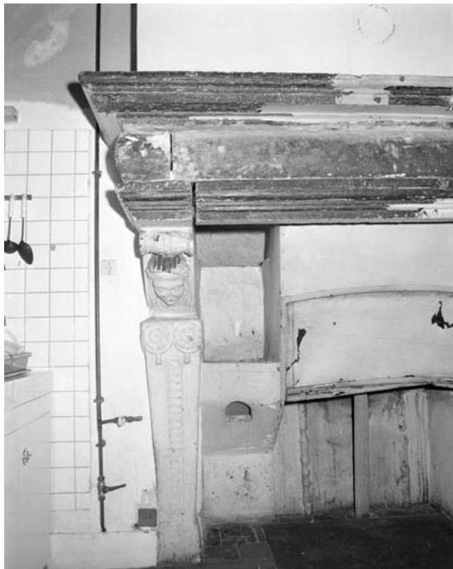
Détail de la partie gauche de la cheminée.