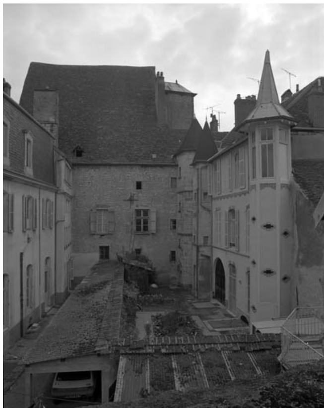
Façade latérale gauche : vue éloignée.