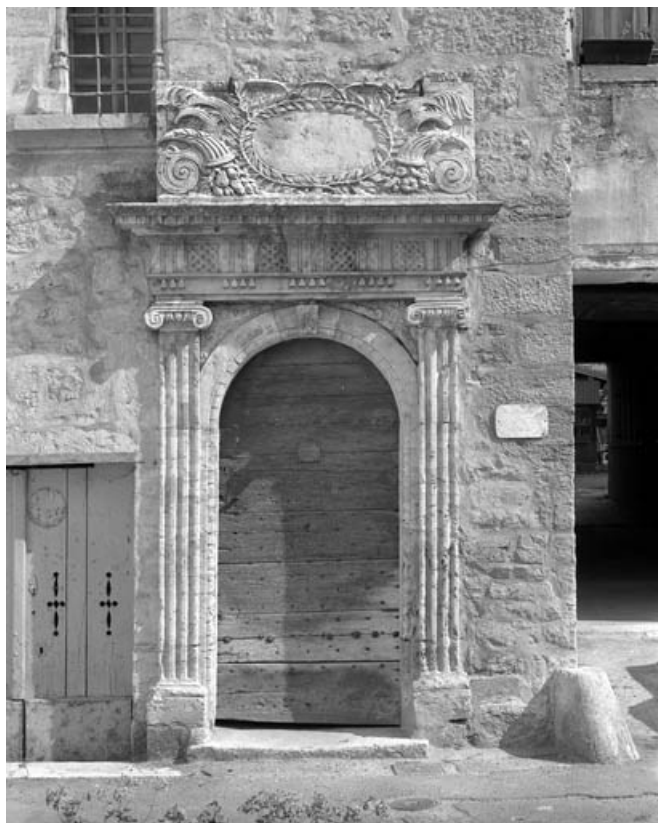
Détail de la porte d'entrée de l'escalier demi hors-oeuvre sur rue : vue rapprochée. 70, Gray, 10, 12 rue du Marché