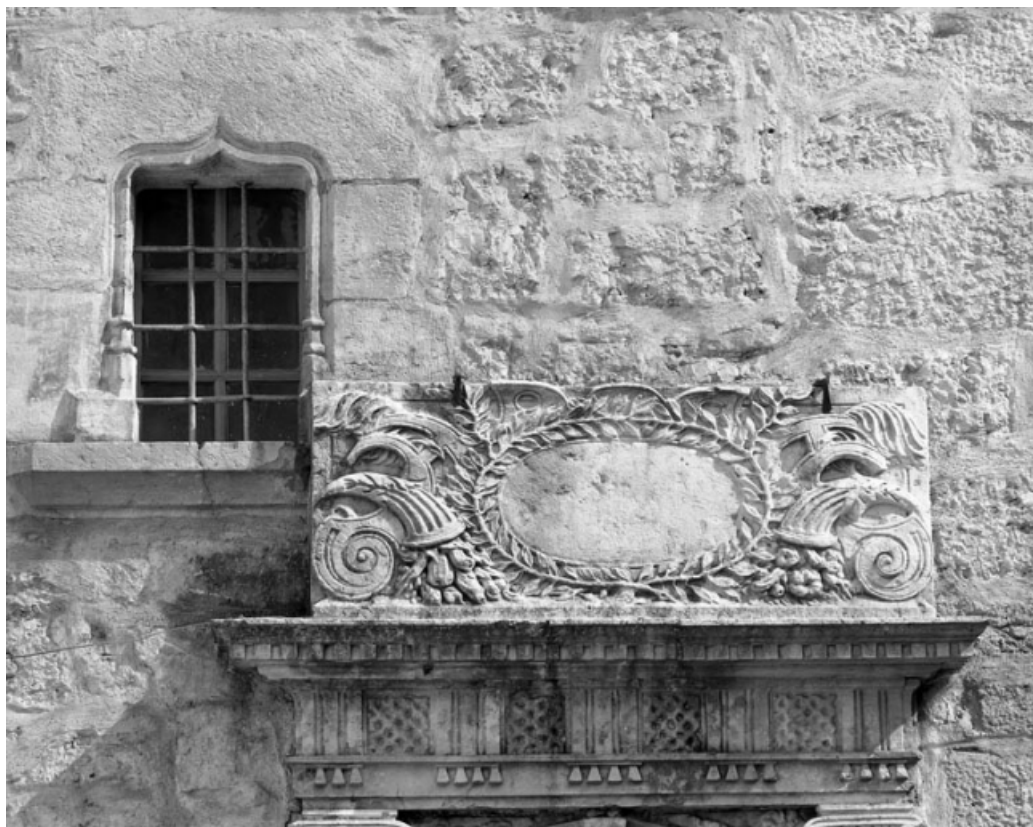
Détail : entablement de la porte d'entrée de l'escalier demi hors-oeuvre sur rue. 70, Gray, 10, 12 rue du Marché