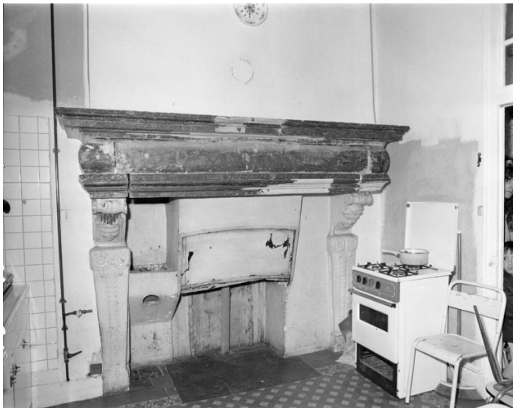
Détail d'une cheminée au premier étage de l'habitation, située 12 rue du Marché. 70, Gray, 10, 12 rue du Marché