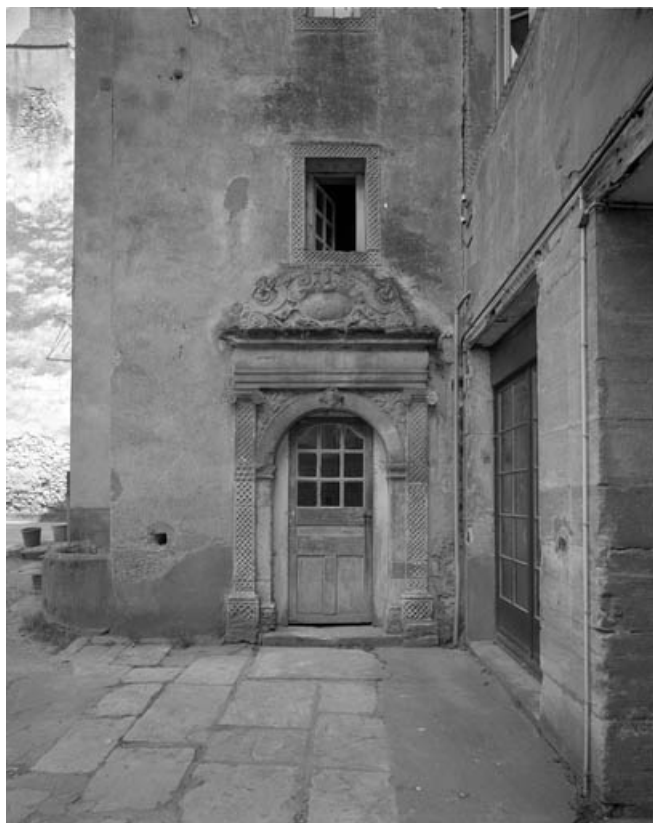
Détail : porte d'entrée de l'escalier demi hors-oeuvre sur cour. 70, Gray, 10, 12 rue du Marché