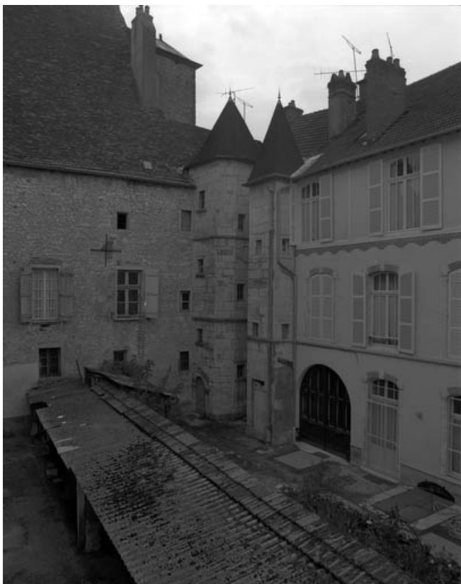
Façade latérale gauche : partie droite.