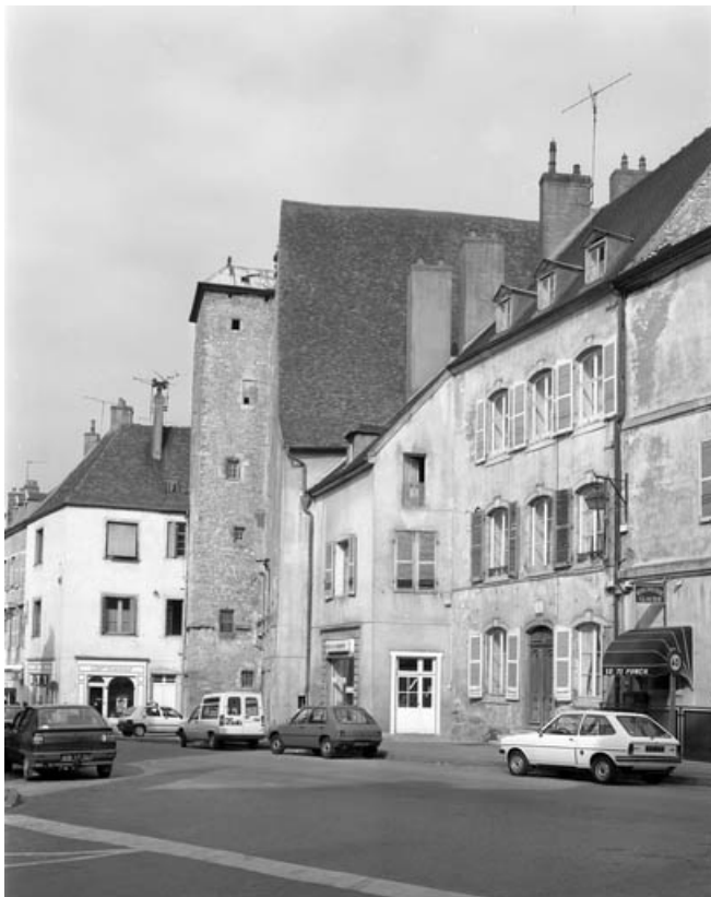
Vue d'ensemble, de trois quarts droit.