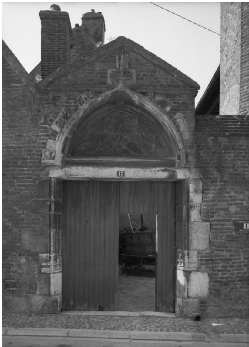
Portail de la cour intérieure.