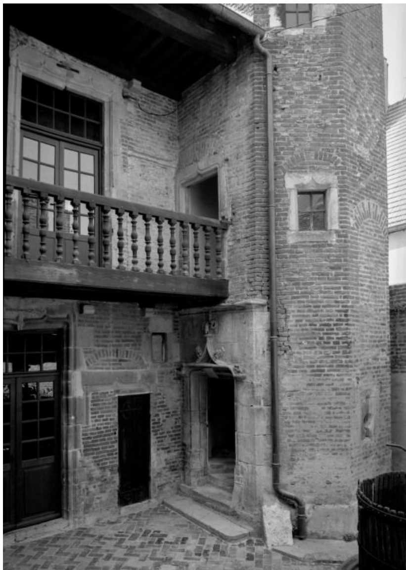
Corps principal, façade sur cour et tour d'escalier.