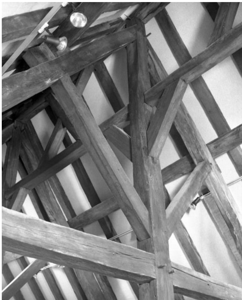
Charpente du niveau supérieur du comble.