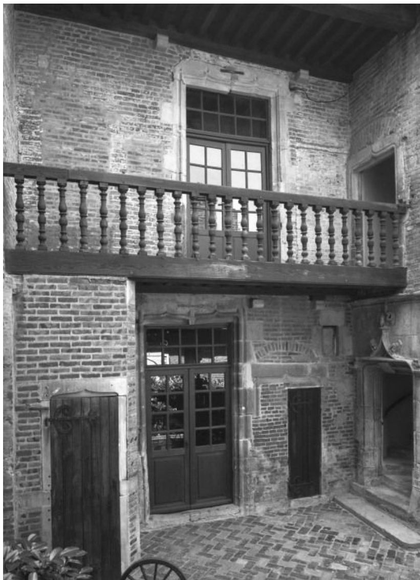
Corps principal, façade sur cour.