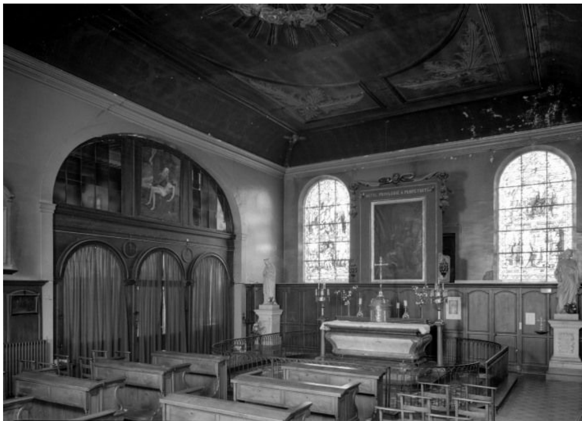
Chapelle, vue prise depuis l'angle antérieur droit

21, Seurre, 14 Grande rue du Faubourg-Saint-Georges