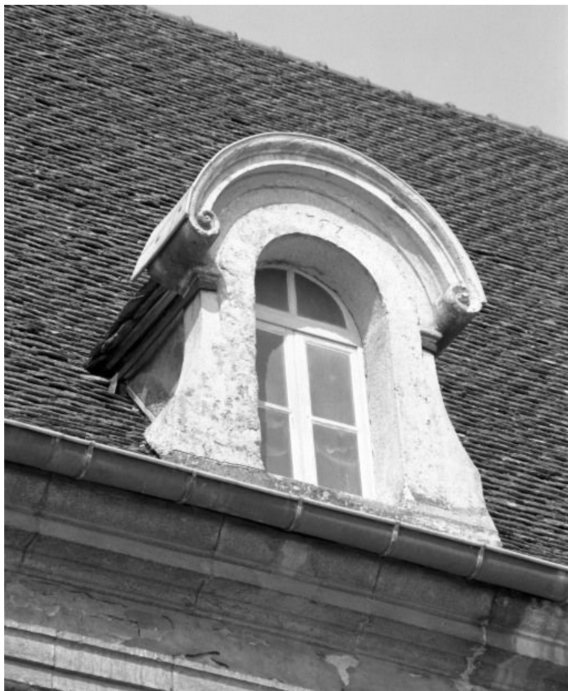
Lucarne de l'aile ouest située à droite de la façade de la chapelle 21, Seurre, 14 Grande rue du Faubourg-Saint-Georges