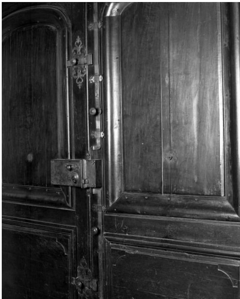
Chapelle, porte d'entrée, détail des serrures intérieures 21, Seurre, 14 Grande rue du Faubourg-Saint-Georges