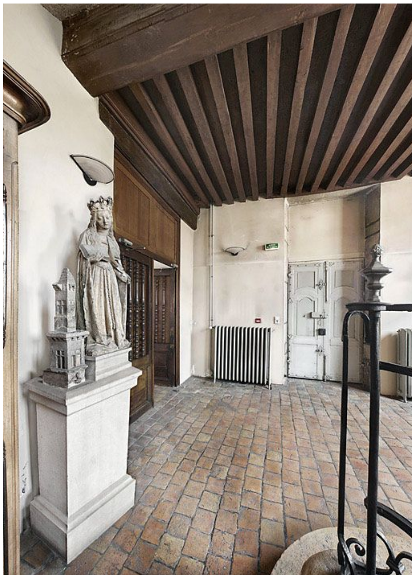
Aile gauche : vestibule.

21, Seurre, 14 Grande rue du Faubourg-Saint-Georges