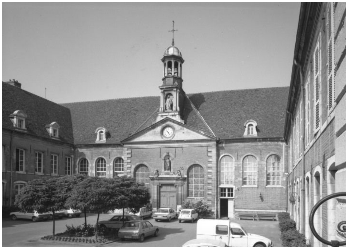
Aile ouest vue depuis la cour

21, Seurre, 14 Grande rue du Faubourg-Saint-Georges