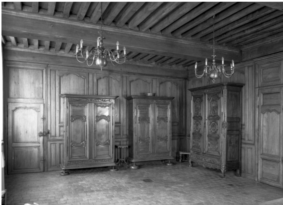
Aile gauche, rez-de-chaussée, bureau du directeur 21, Seurre, 14 Grande rue du Faubourg-Saint-Georges