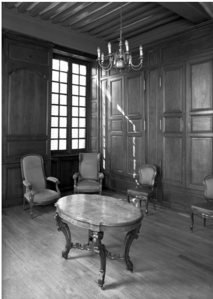
Aile gauche, étage, salle de repos, vue prise de l'entrée 21, Seurre, 14 Grande rue du Faubourg-Saint-Georges