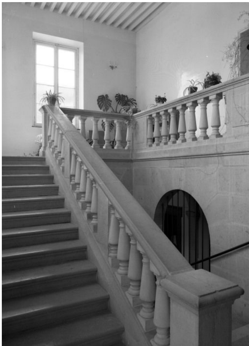
Aile droite, volée supérieure de l'escalier

21, Seurre, 14 Grande rue du Faubourg-Saint-Georges