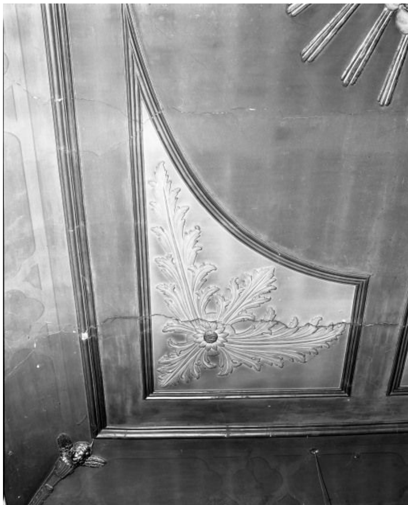
Chapelle, plafond, détail d'un écoinçon

21, Seurre, 14 Grande rue du Faubourg-Saint-Georges