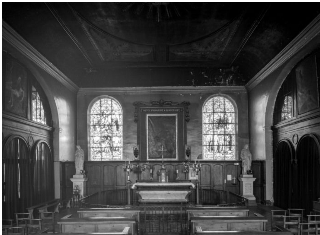
Chapelle, vue prise depuis l'entrée.

21, Seurre, 14 Grande rue du Faubourg-Saint-Georges