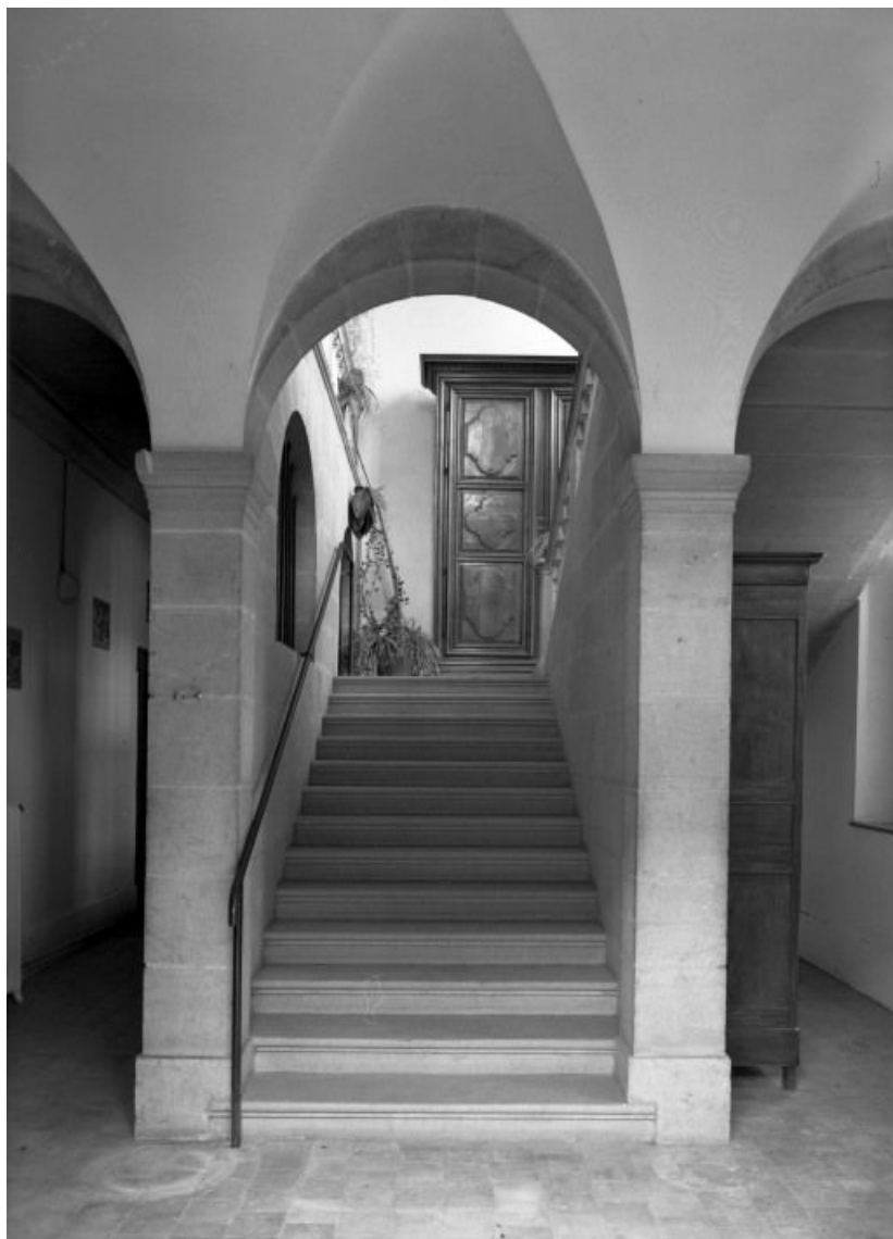
Aile droite, volée inférieure de l'escalier

21, Seurre, 14 Grande rue du Faubourg-Saint-Georges