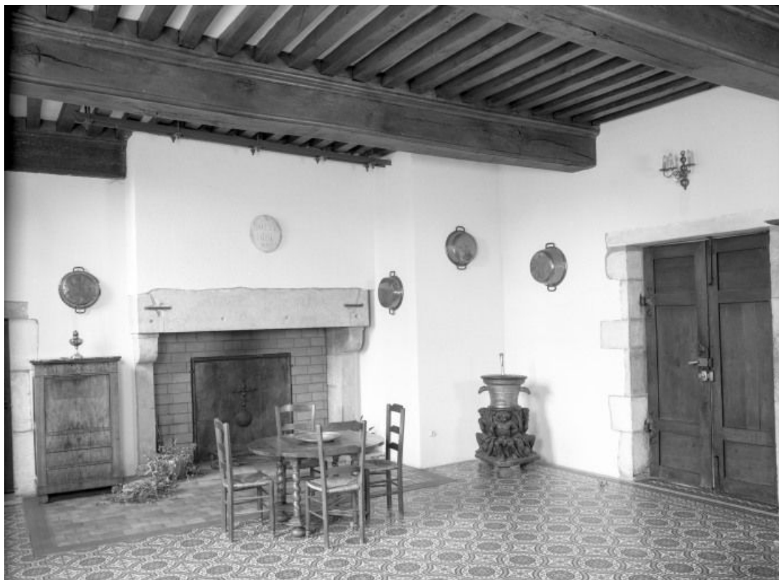
Aile gauche, rez-de-chaussée, salle du mortier, vue prise de l'angle antérieur gauche 21, Seurre, 14 Grande rue du Faubourg-Saint-Georges