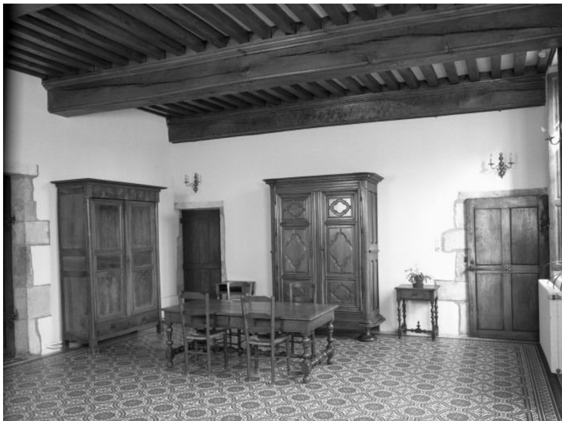
Aile gauche, rez-de-chaussée, salle du mortier, vue prise de l'angle postérieur gauche 21, Seurre, 14 Grande rue du Faubourg-Saint-Georges