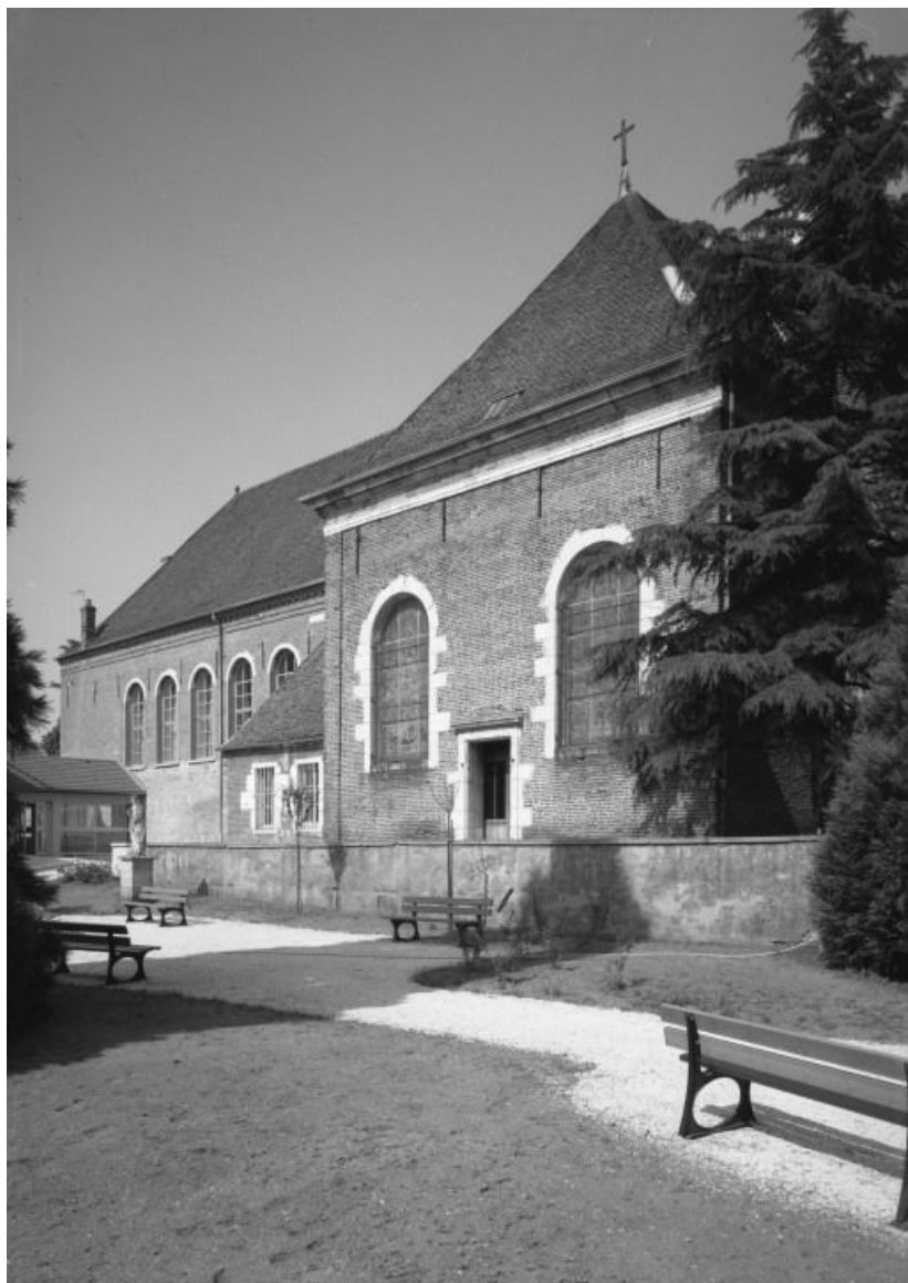
Ailes ouest, façade postérieure : chapelle et ancienne salle des hommes 21, Seurre, 14 Grande rue du Faubourg-Saint-Georges