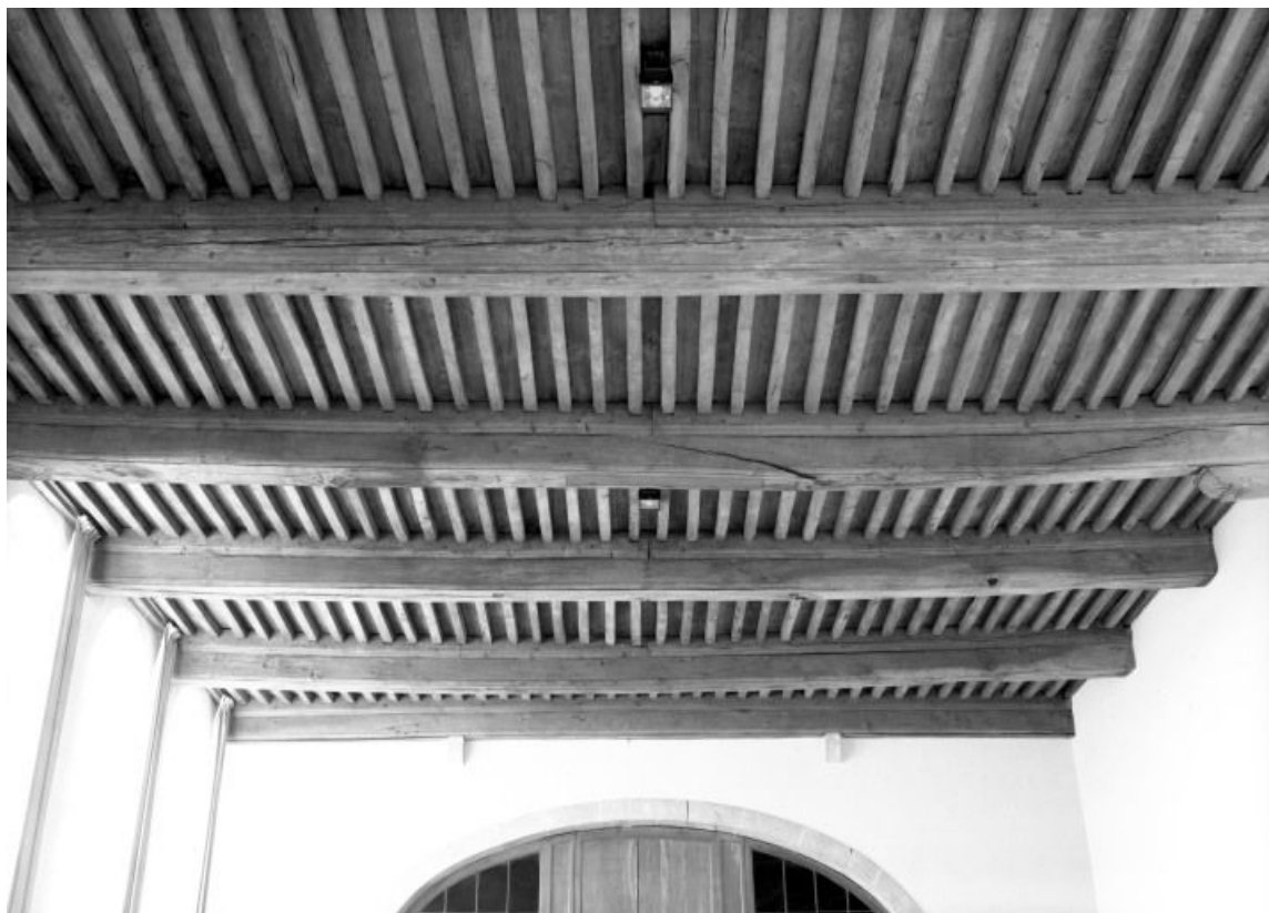
Salle des malades, plafond, vue prise depuis le mur antérieur

21, Seurre, 14 Grande rue du Faubourg-Saint-Georges