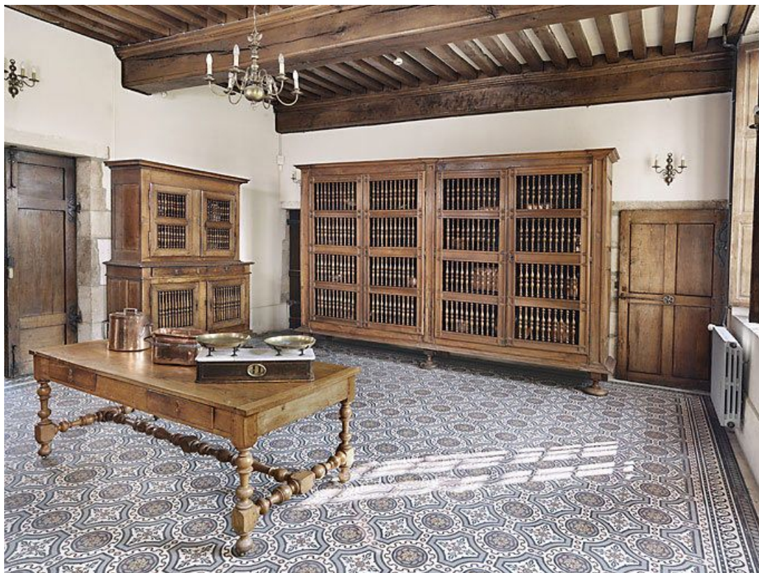
Aile gauche : ancienne cuisine.

21, Seurre, 14 Grande rue du Faubourg-Saint-Georges