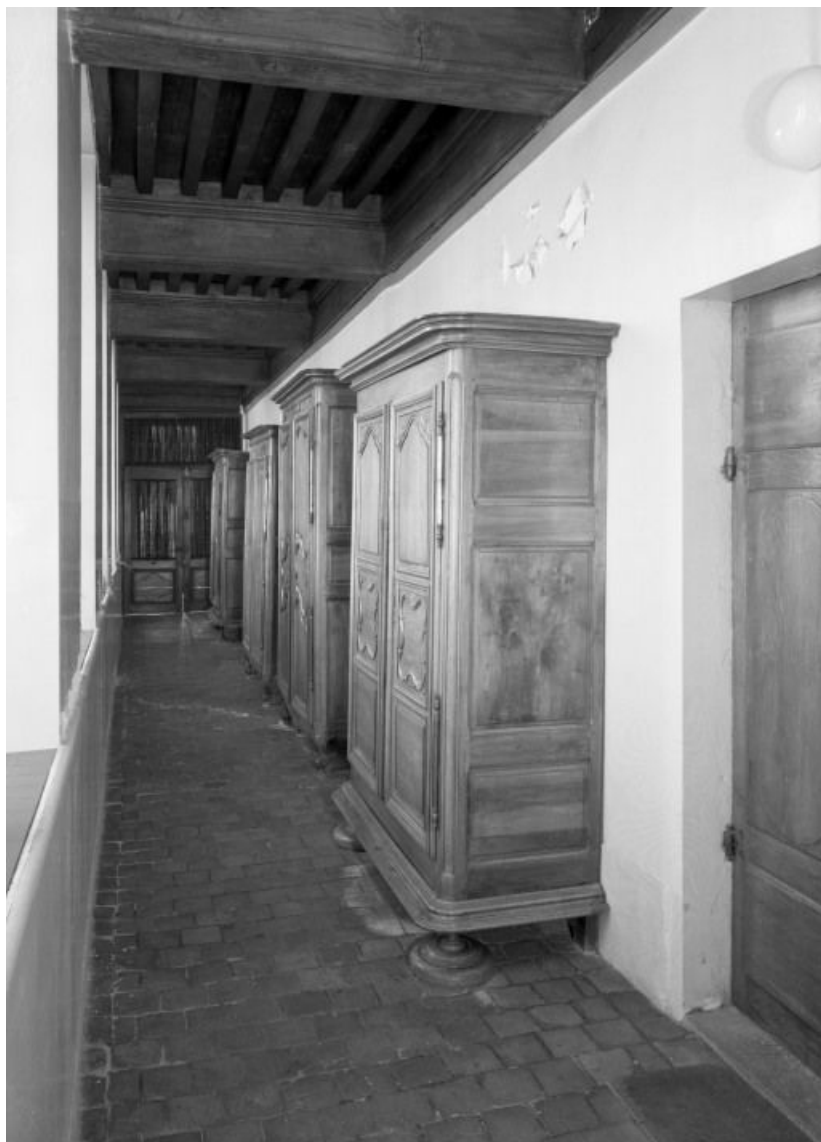
Aile gauche, couloir du rez-de-chaussée, vue d'ensemble 21, Seurre, 14 Grande rue du Faubourg-Saint-Georges