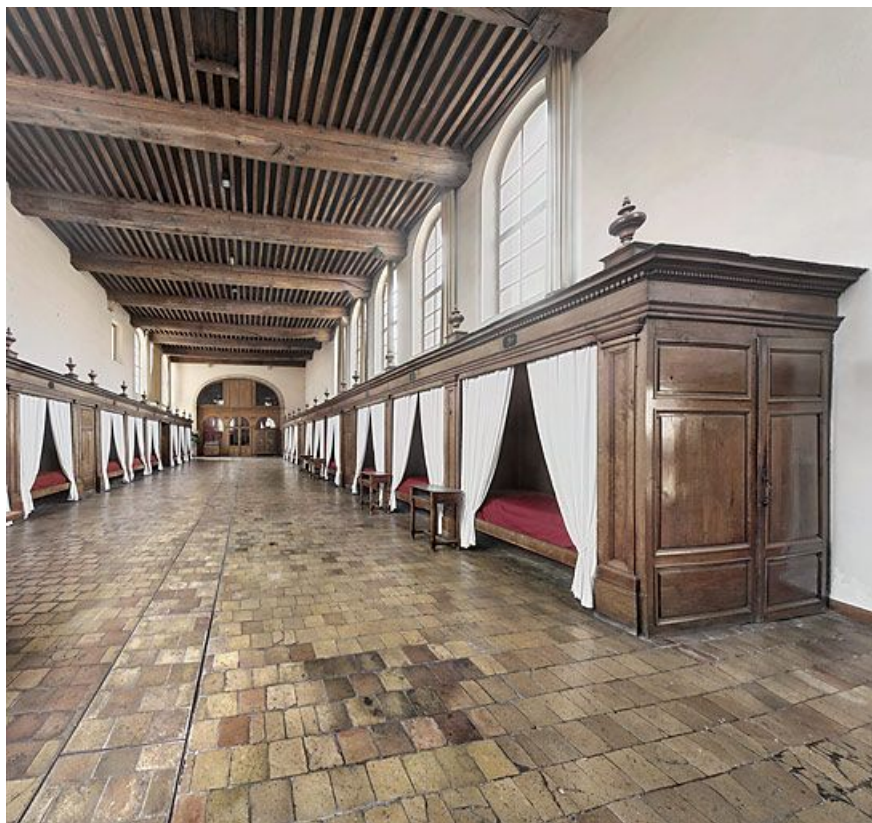
Salle des malades, ancienne salle des hommes.

21, Seurre, 14 Grande rue du Faubourg-Saint-Georges