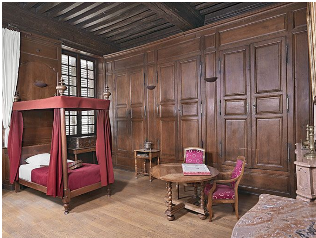
Aile gauche : chambre à l'étage.

21, Seurre, 14 Grande rue du Faubourg-Saint-Georges