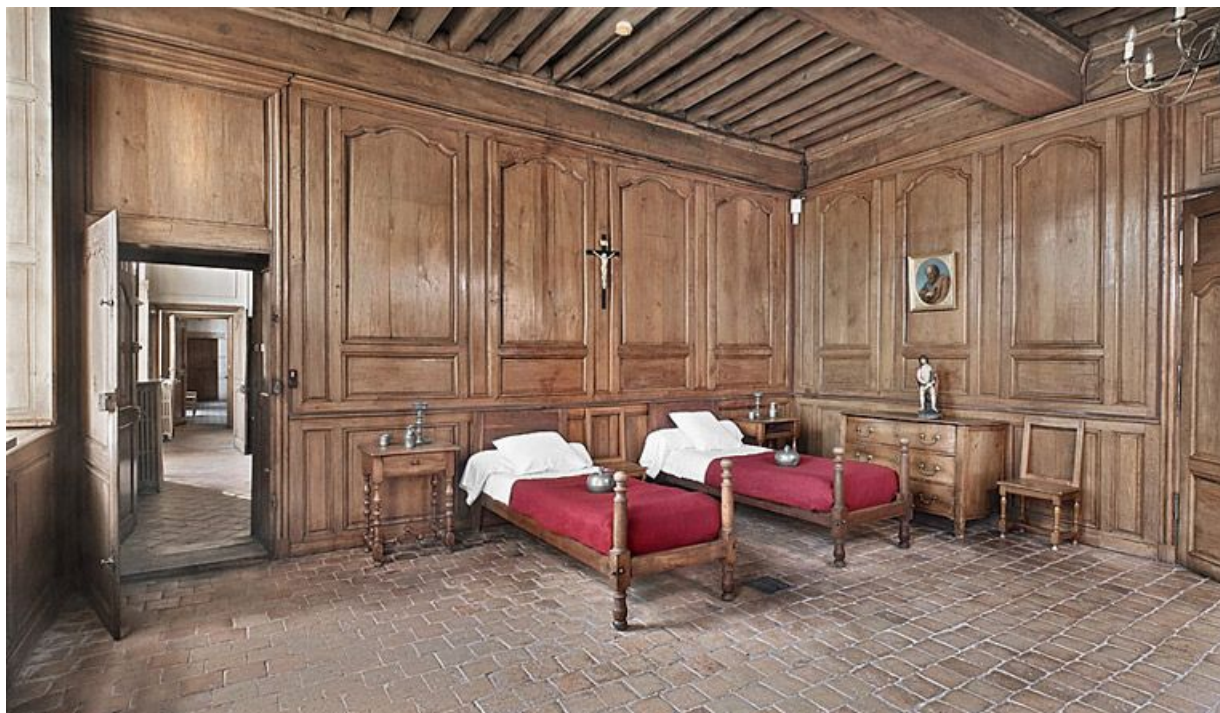
Aile gauche, rez-de-chaussée : infirmerie des sœurs.

21, Seurre, 14 Grande rue du Faubourg-Saint-Georges