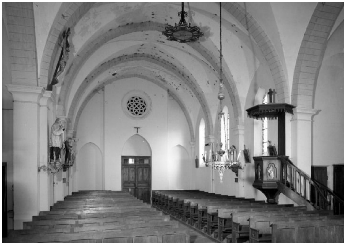
Vue intérieure prise du choeur