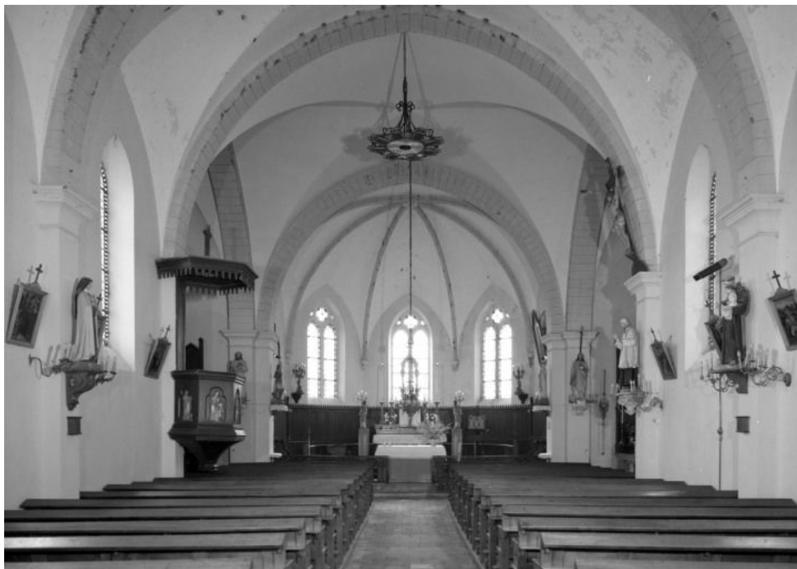
Vue intérieure prise de l'entrée