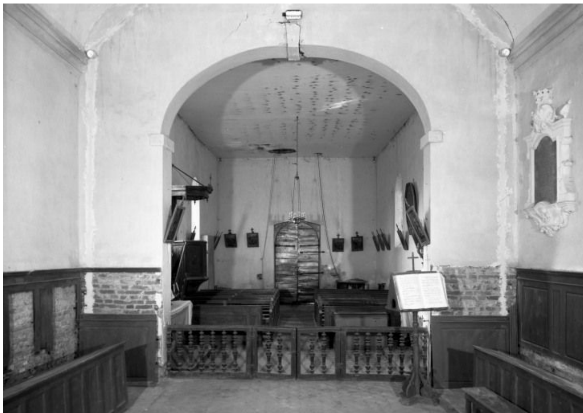
Vue de la nef prise du chœur 21, Montmain