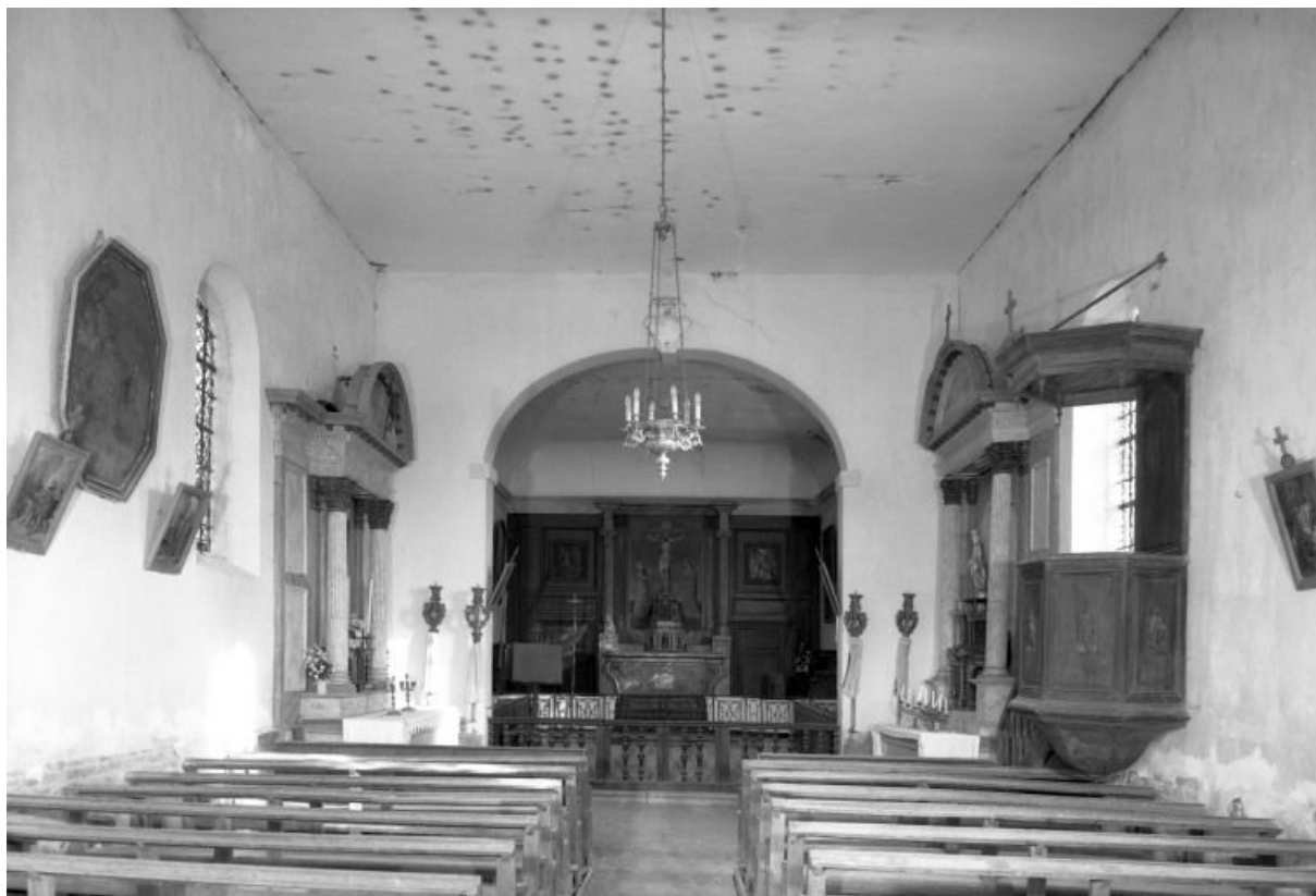
Vue intérieure prise de l'entrée 21, Montmain