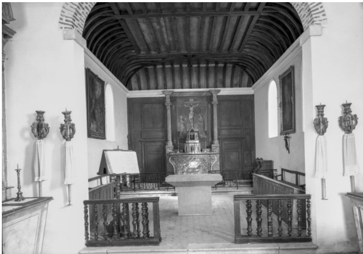
Vue du chœur prise de la nef 21, Montmain