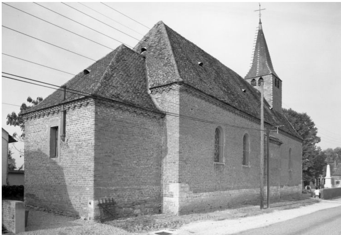
Chevet et élévation gauche 21, Montmain