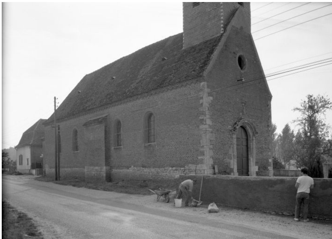
Élévations antérieure et gauche 21, Montmain