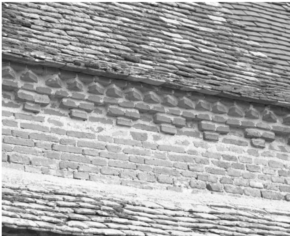
Détail de la corniche