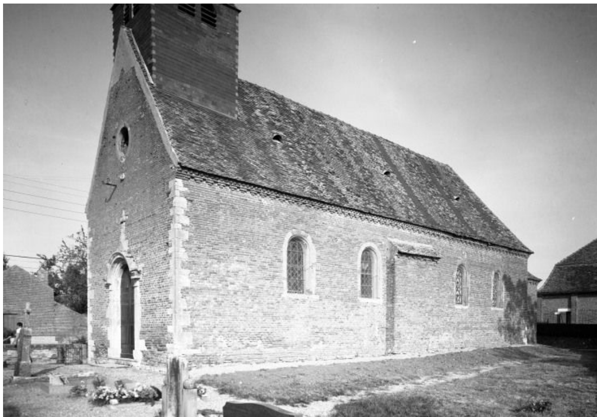
Élévations antérieure et droite 21, Montmain