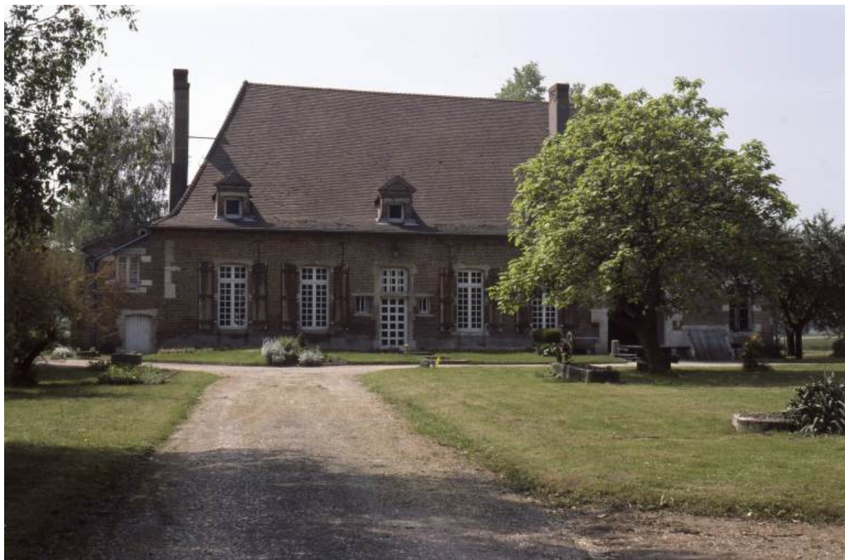
Vue d'ensemble prise du nord.