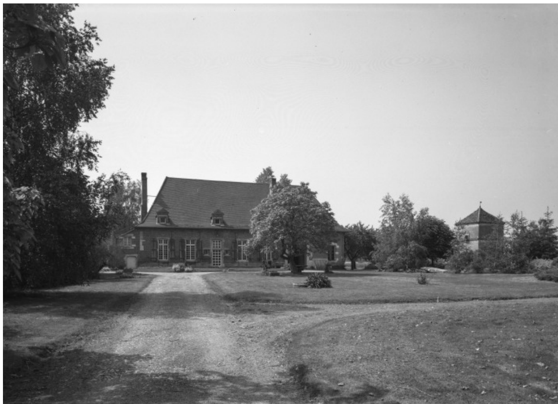
Vue d'ensemble prise du nord.