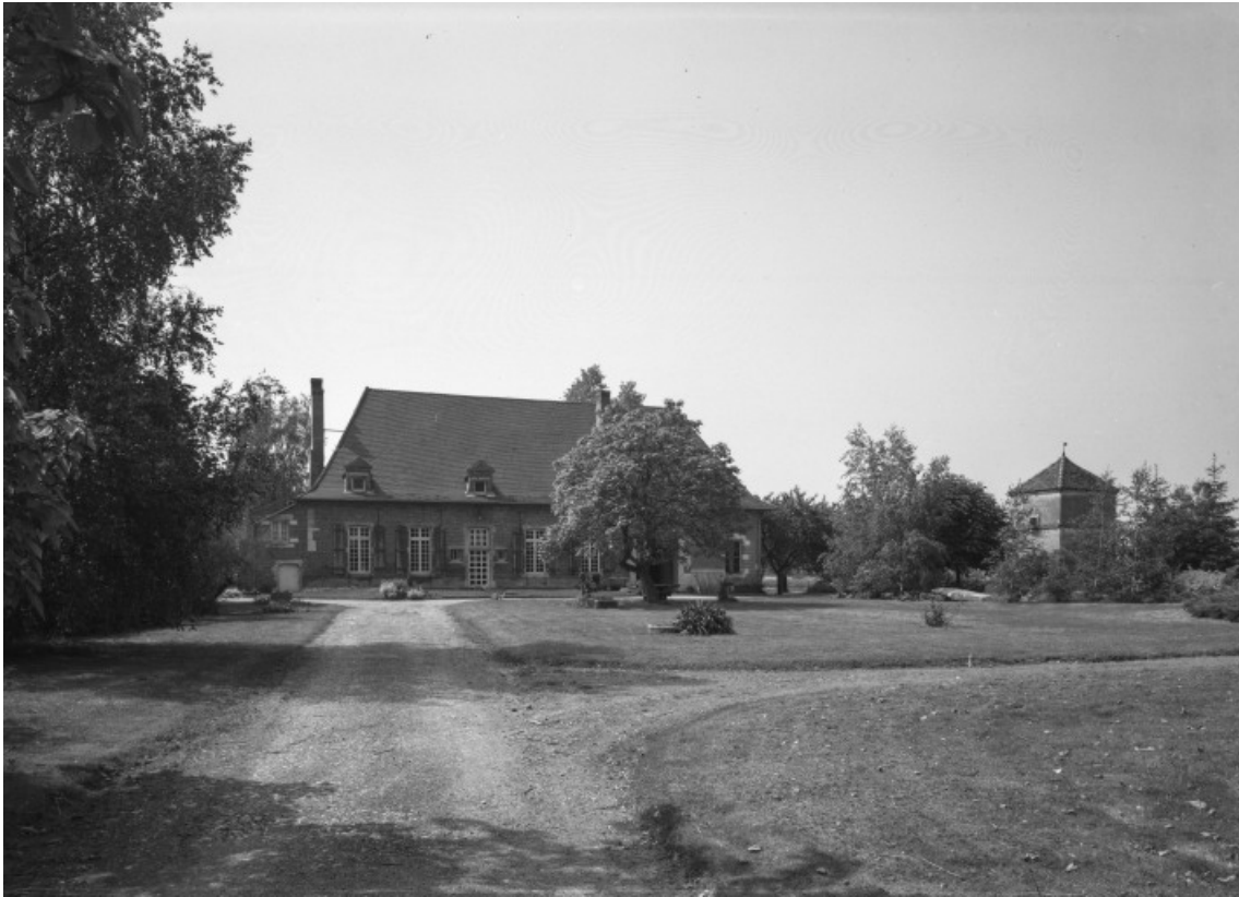
Vue d'ensemble prise du nord.