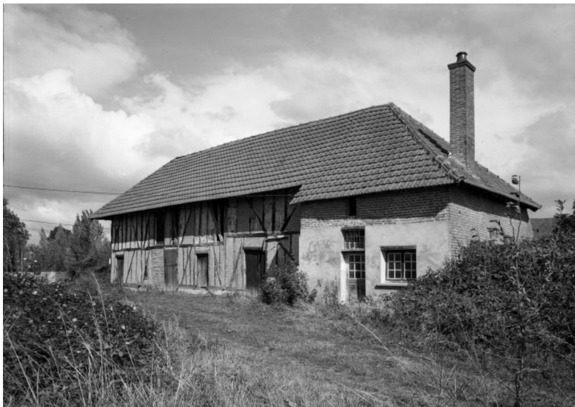
Vue d'ensemble de trois-quarts gauche.

21, Labergement-lès-Seurre C.V. 3 2e ferme