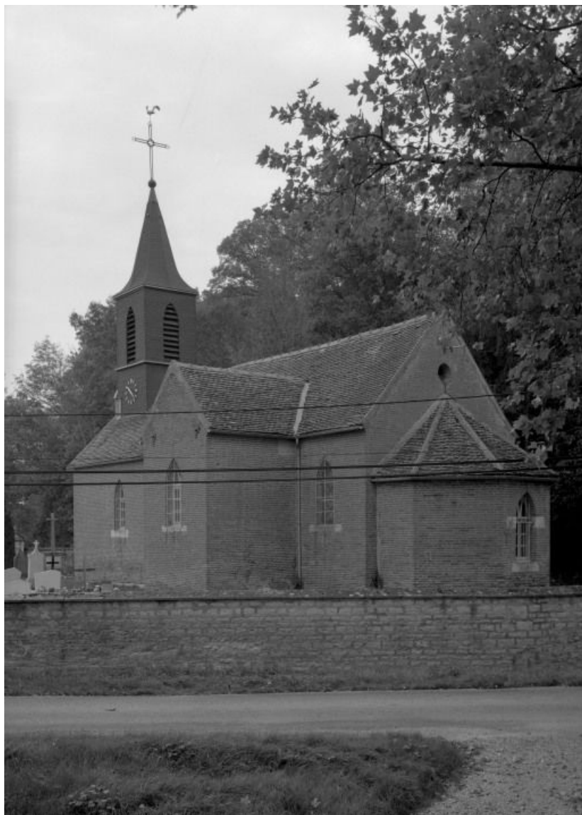
Élévation droite et chevet