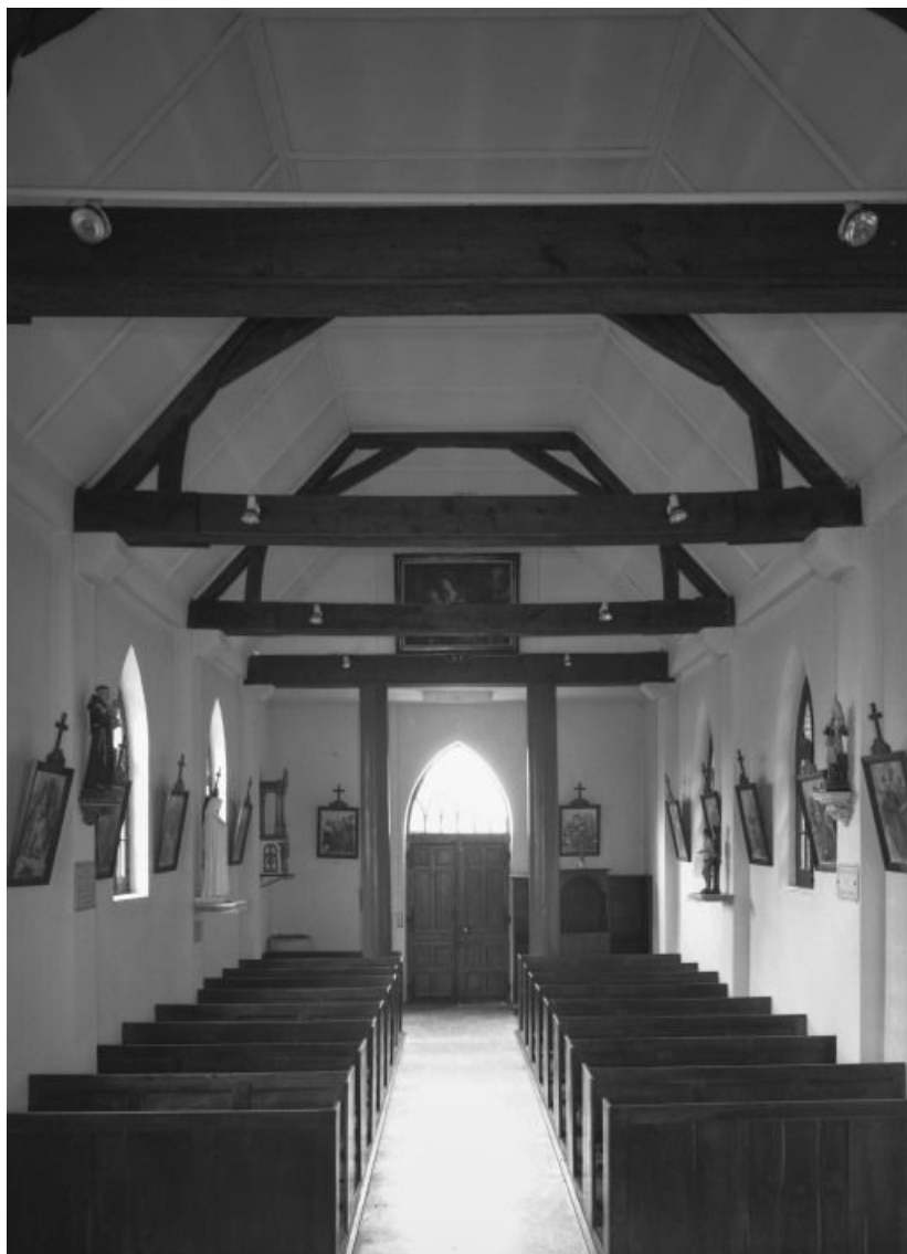
Vue intérieure prise du chœur