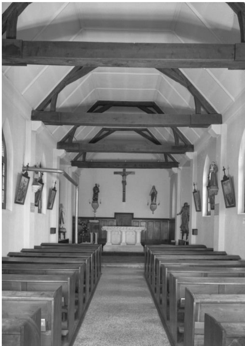
Vue intérieure prise depuis l'entrée