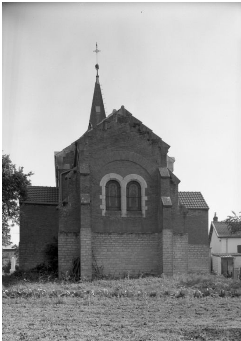
Chevet 21, Glanon