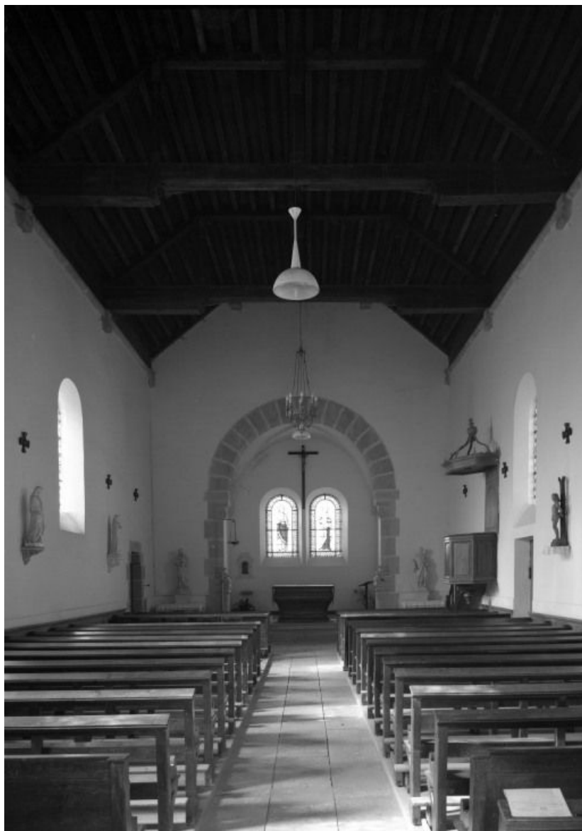
Vue intérieure prise de l'entrée