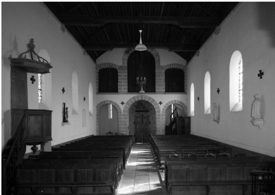
Vue intérieure prise depuis le chœur 21, Glanon