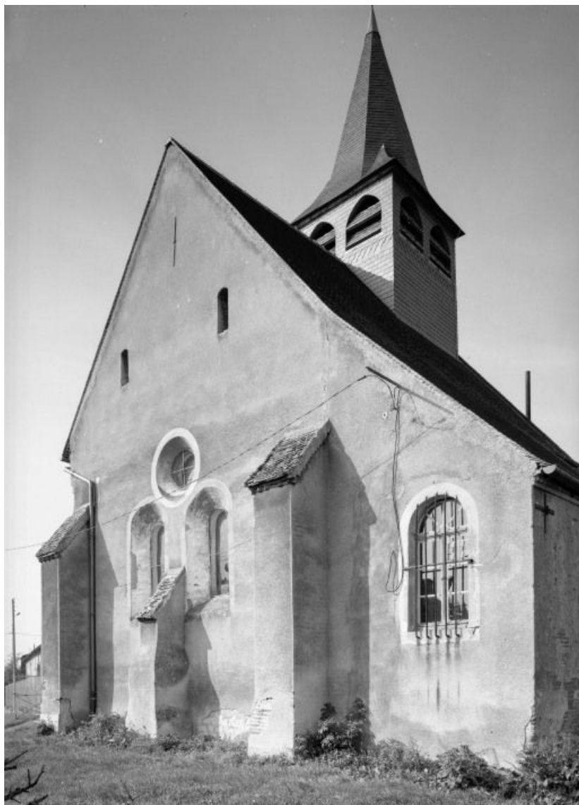
Chevet 21, Bagnot