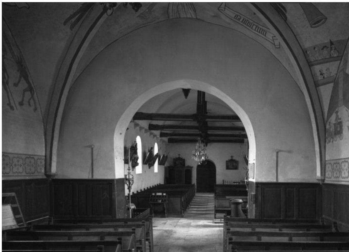
Vue intérieure prise du chœur