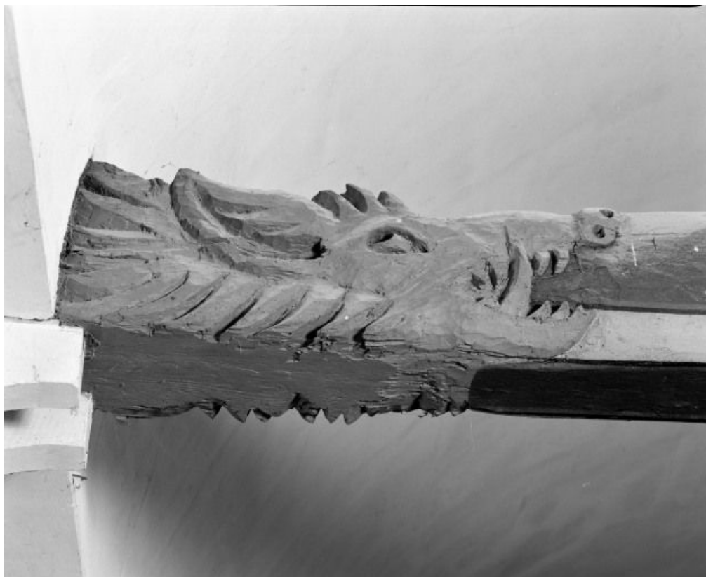
Charpente de la nef, détail du 3e entrain, avers 21, Bagnot