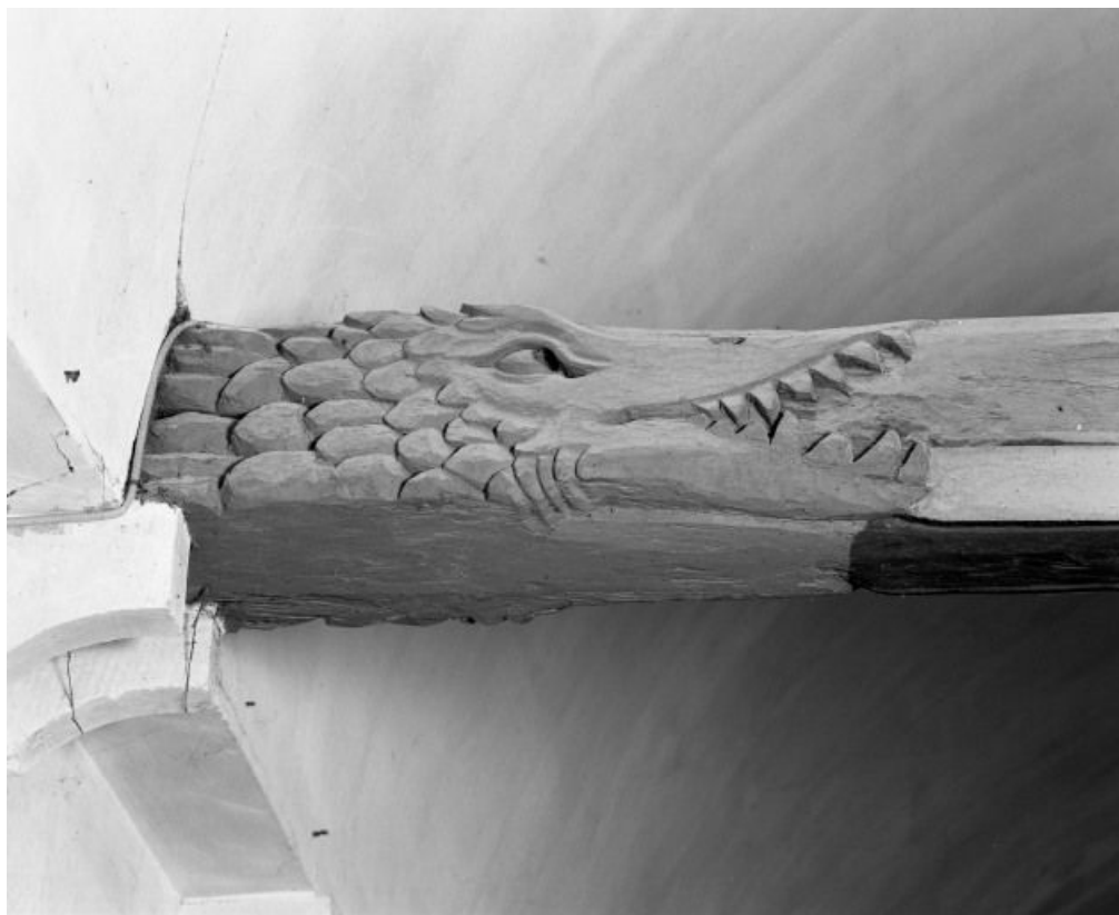
Charpente de la nef, détail du 2e entrain, avers 21, Bagnot