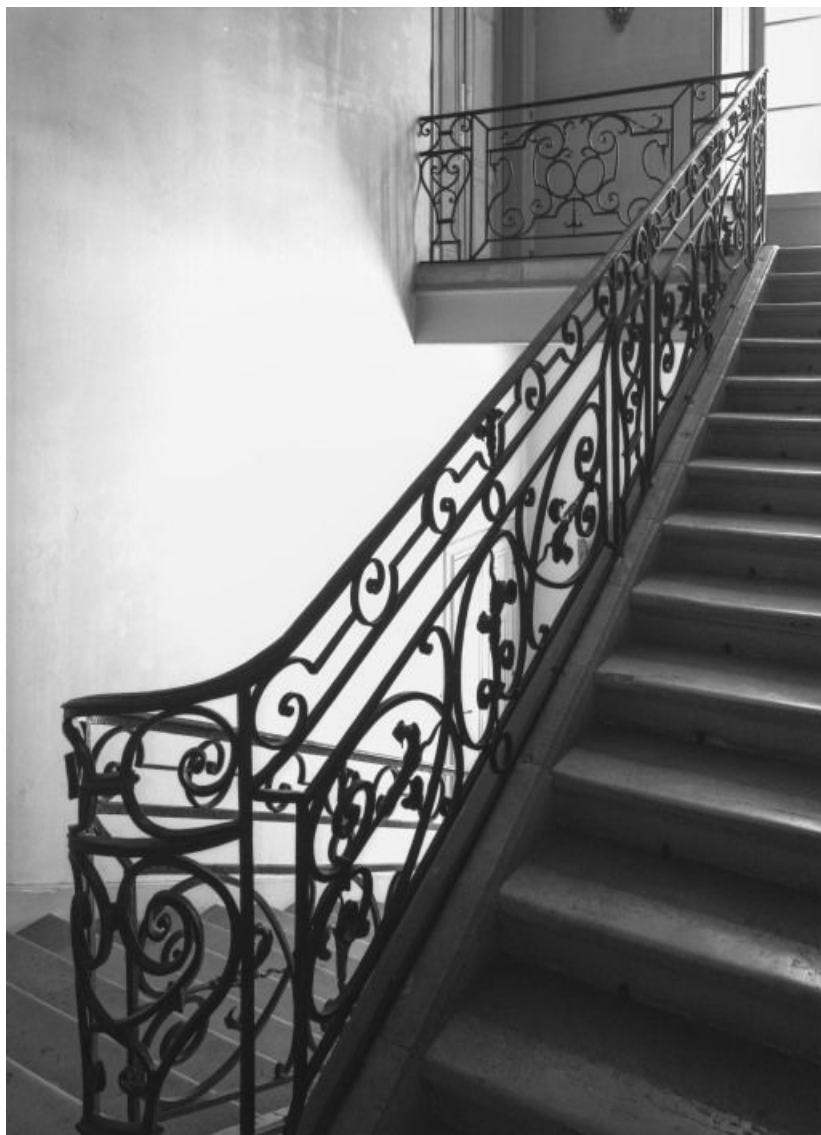
Escalier du corps principal. 21, Auvillars-sur-Saône Eglise