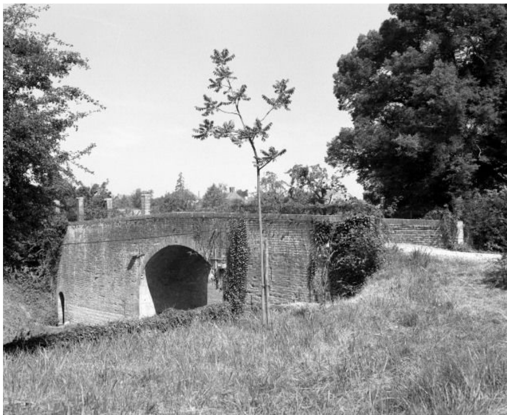
Pont reliant la cour au potager.