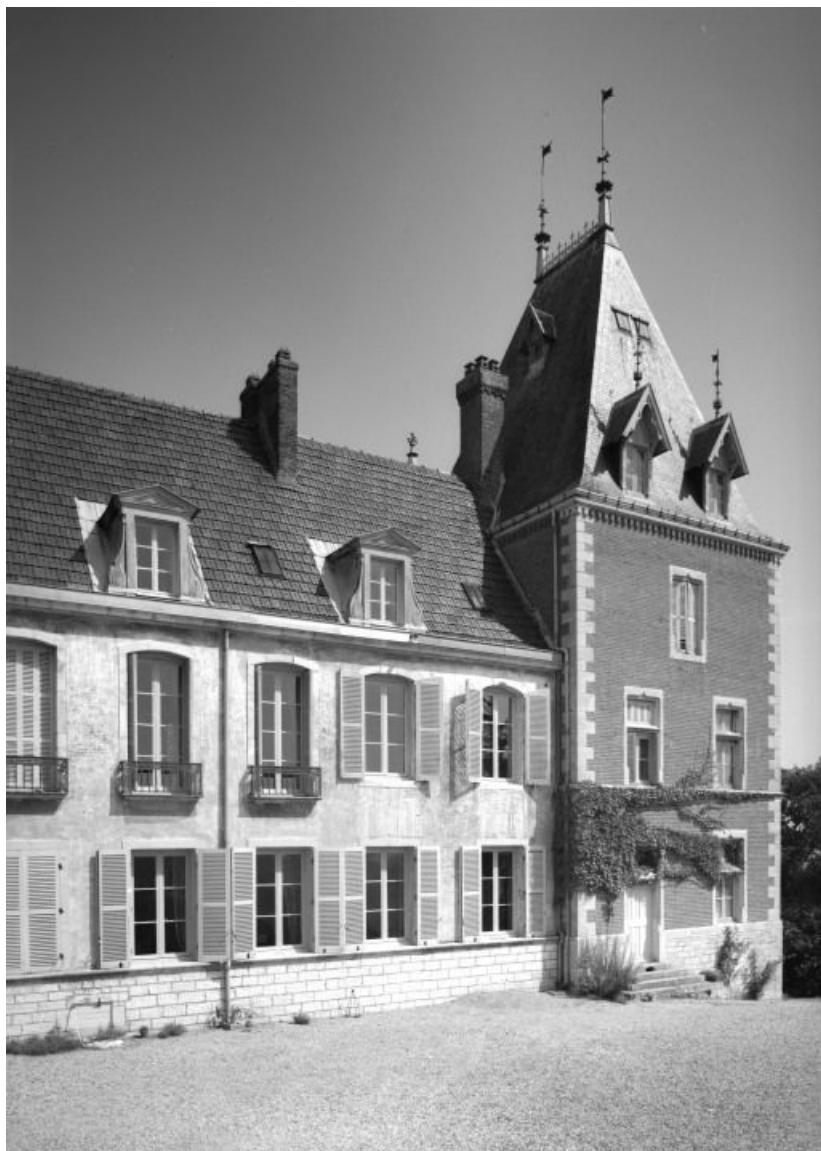
Partie gauche de la façade.