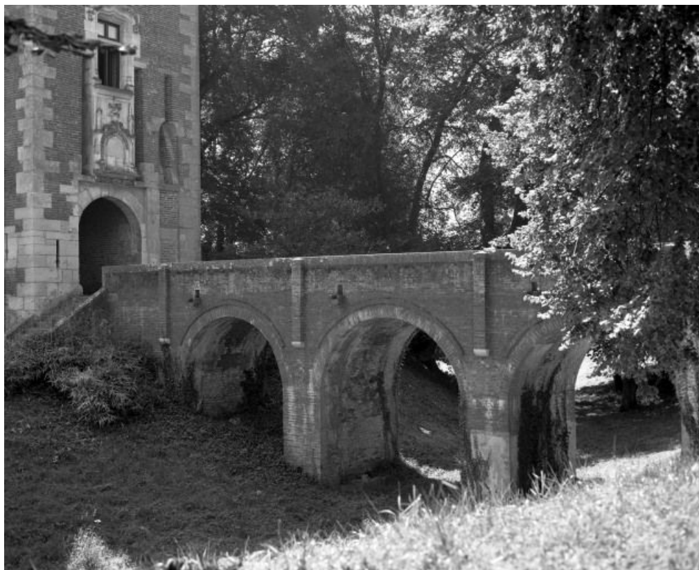
Pont dormant remplaçant l'ancien pont-levis.