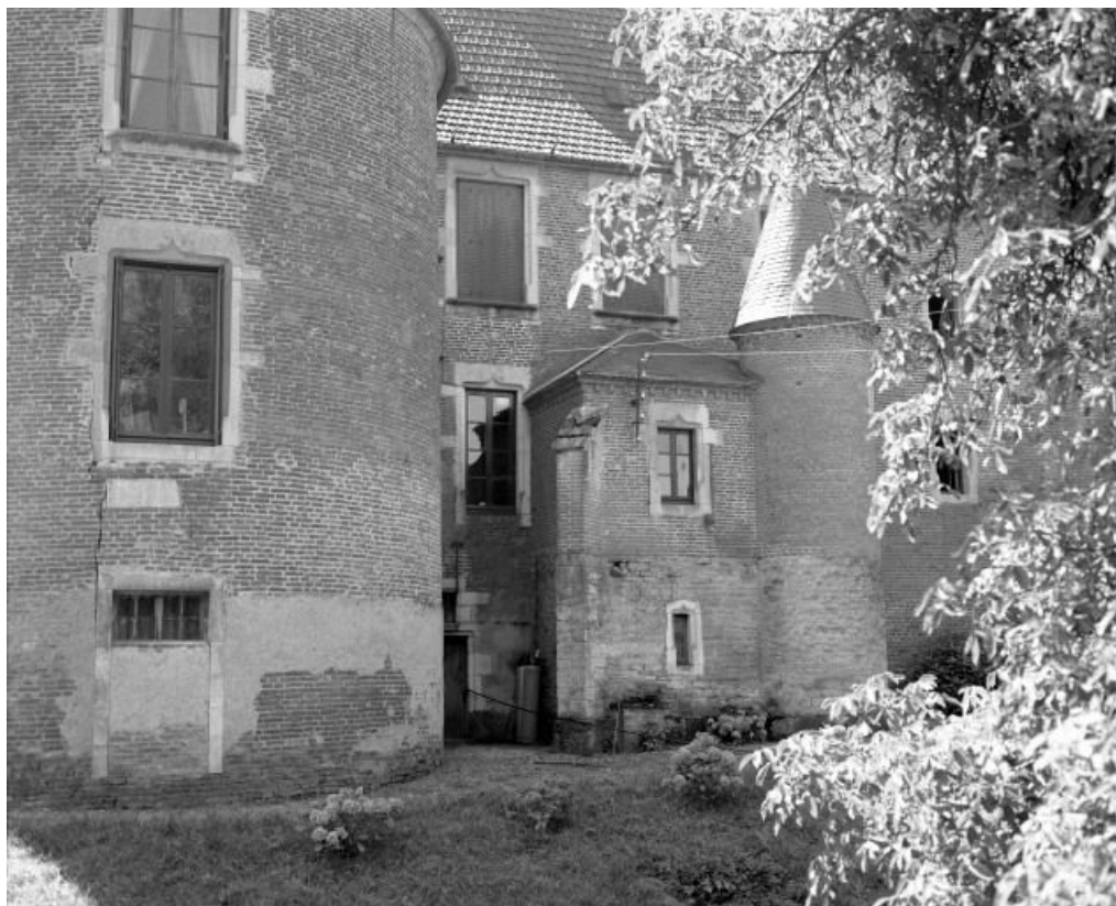
Élévation postérieure, détail.