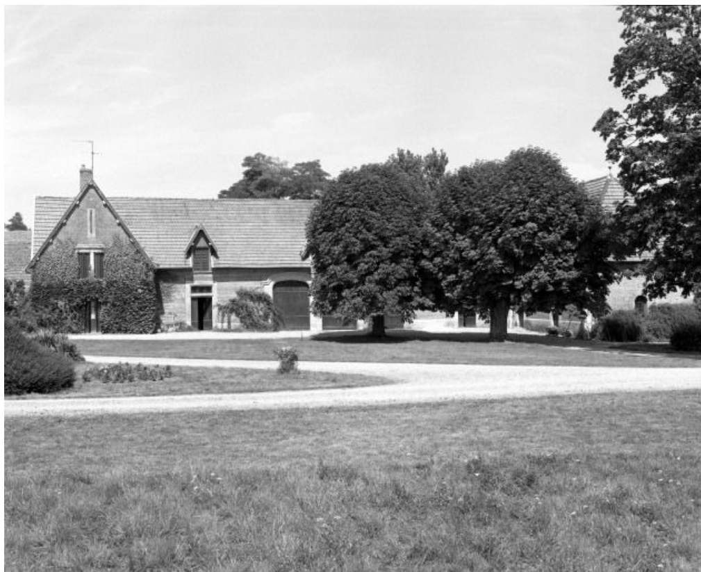
Communs et dépendances, façade antérieure.