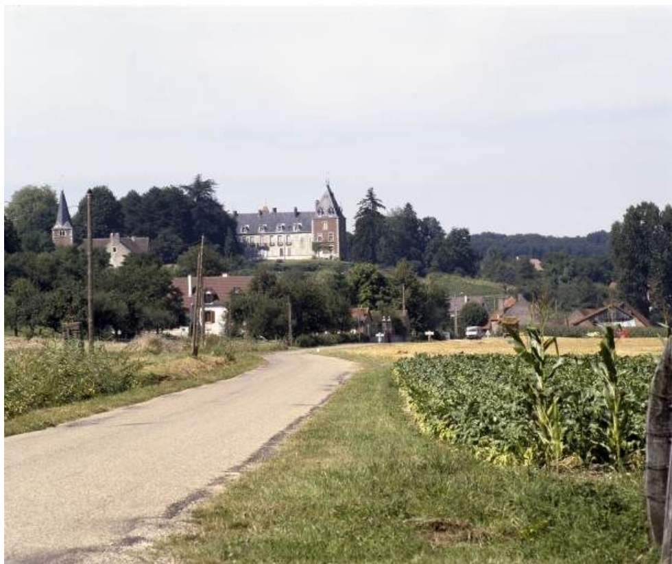
Vue panoramique prise du sud du village.