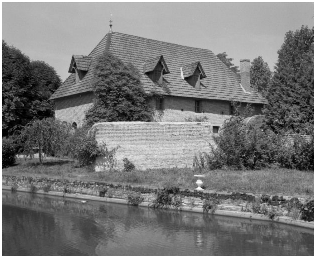
Communs et dépendances, façade postérieure du corps de bâtiment est. 21, Auvillars-sur-Saône Eglise