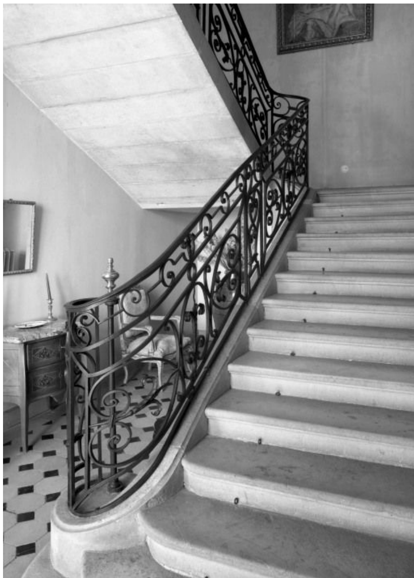
Escalier du corps principal, vue prise du rez-de-chaussée. 21, Auvillars-sur-Saône Eglise