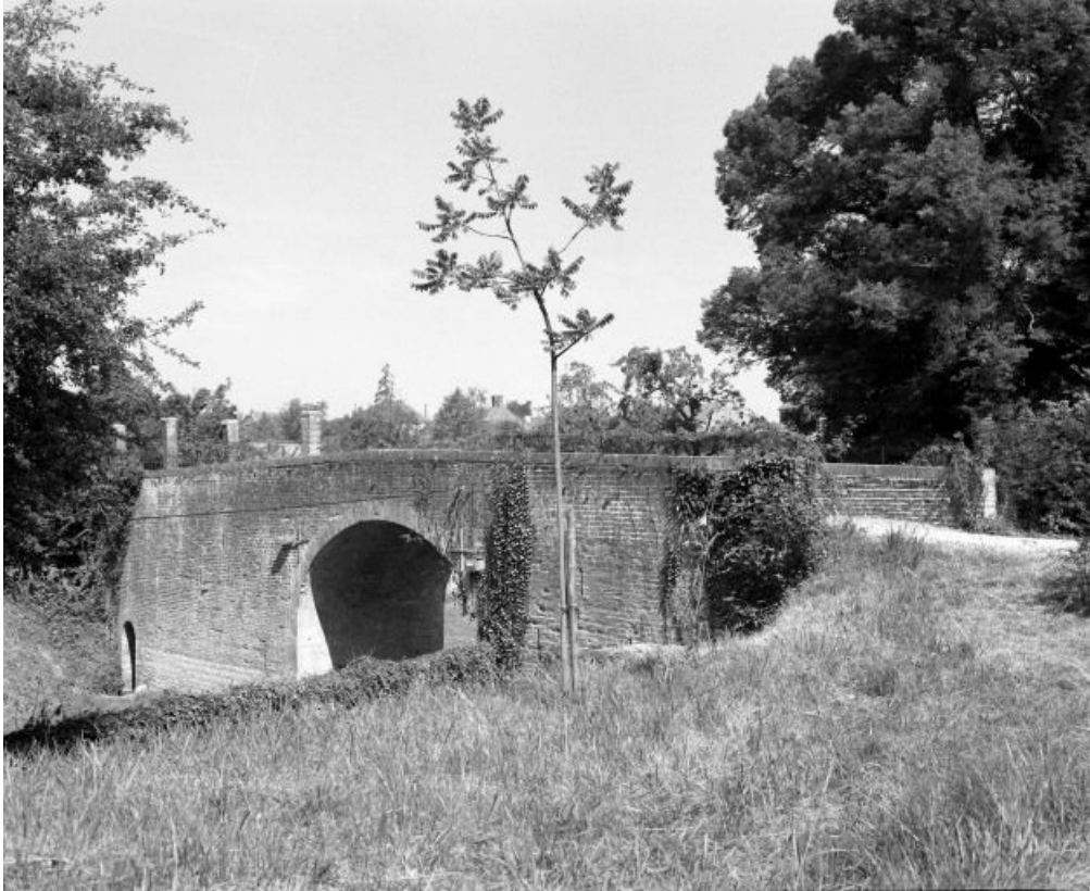
Pont reliant la cour au potager.