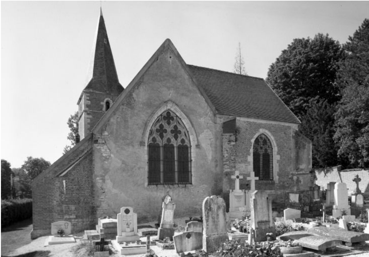
Chevet et élévation postérieure de la chapelle seigneuriale