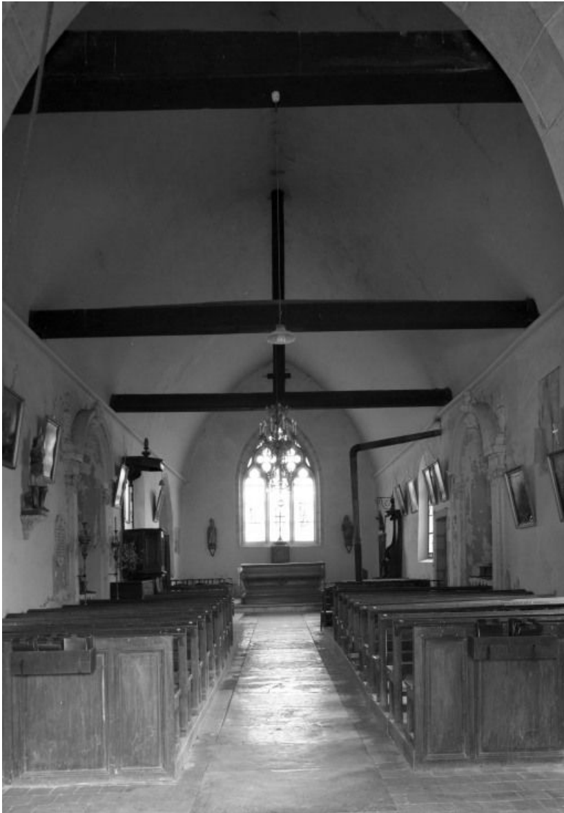
Vue intérieure prise depuis l'entrée