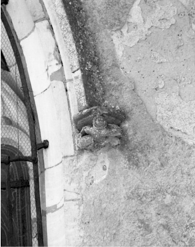
Chevet, culot droit de l'archivolte de la baie