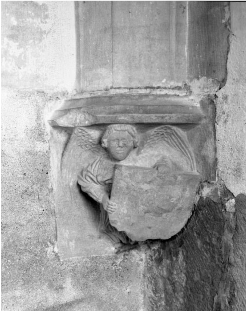
Chapelle seigneuriale, culot antérieur gauche