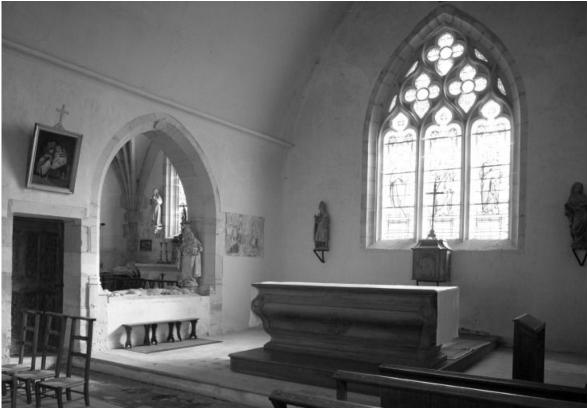
Vue intérieure du choeur et de la chapelle seigneuriale