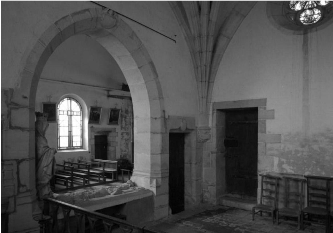
Vue intérieure de la chapelle seigneuriale