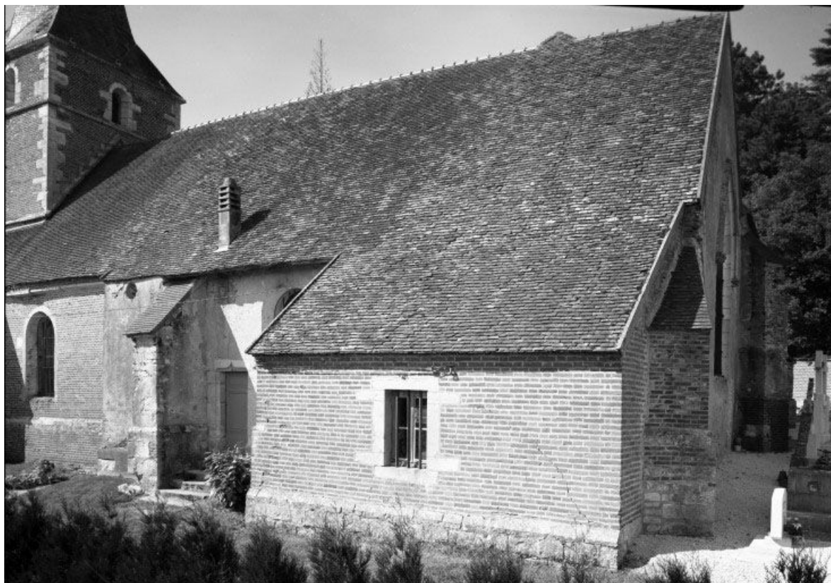
Elévation droite et sacristie