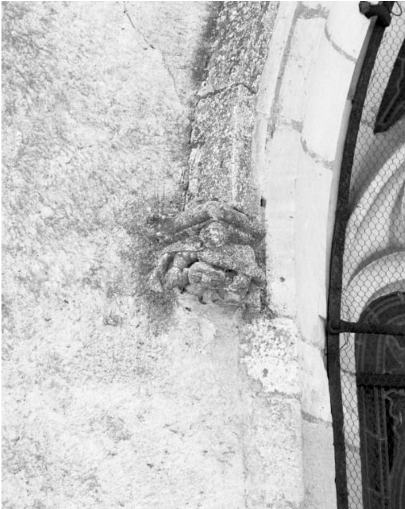
Chevet, culot gauche de l'archivolte de la baie