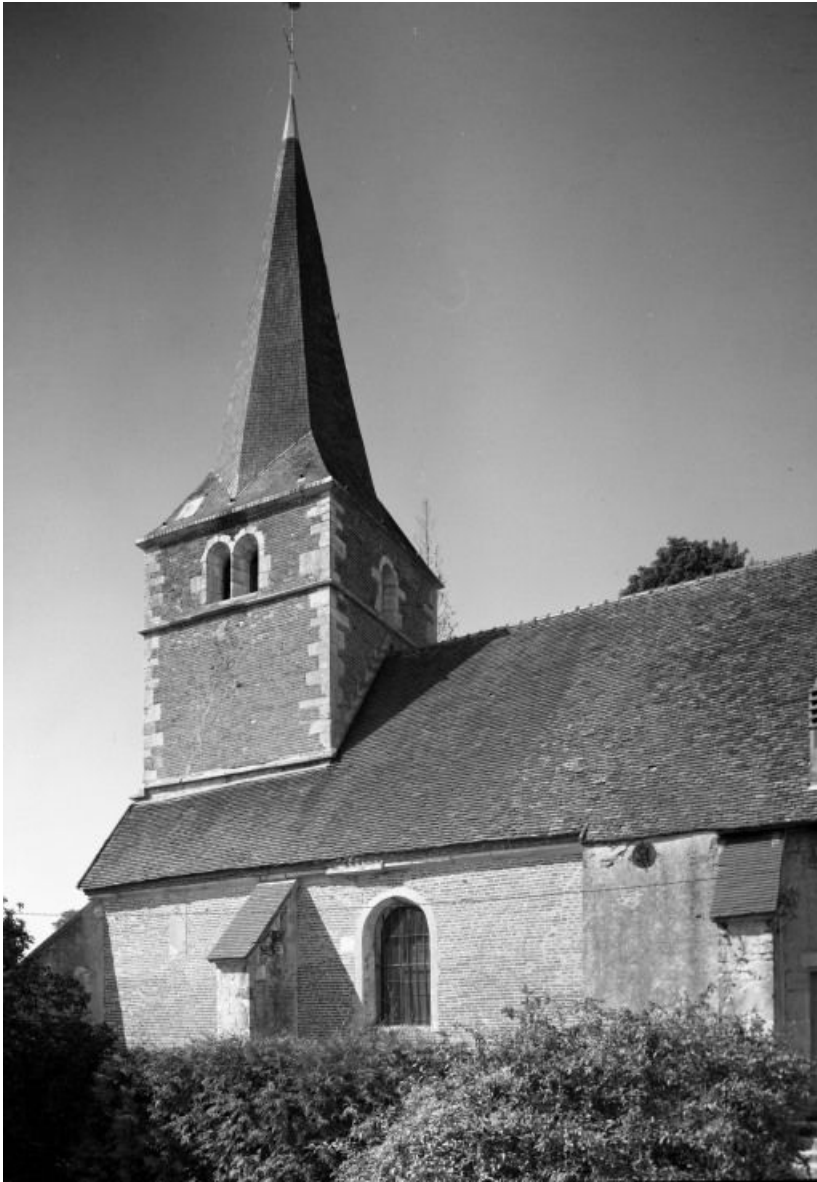
Clocher et élévation droite