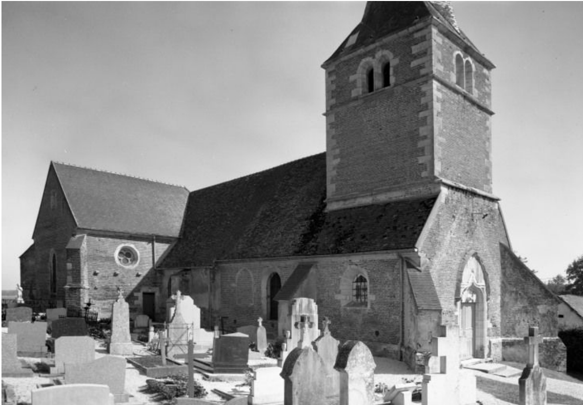
Elévations antérieure et gauche