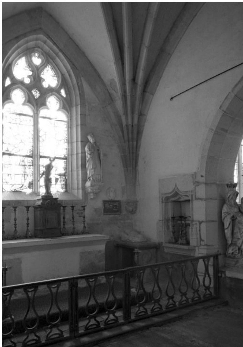
Vue intérieure de la chapelle seigneuriale