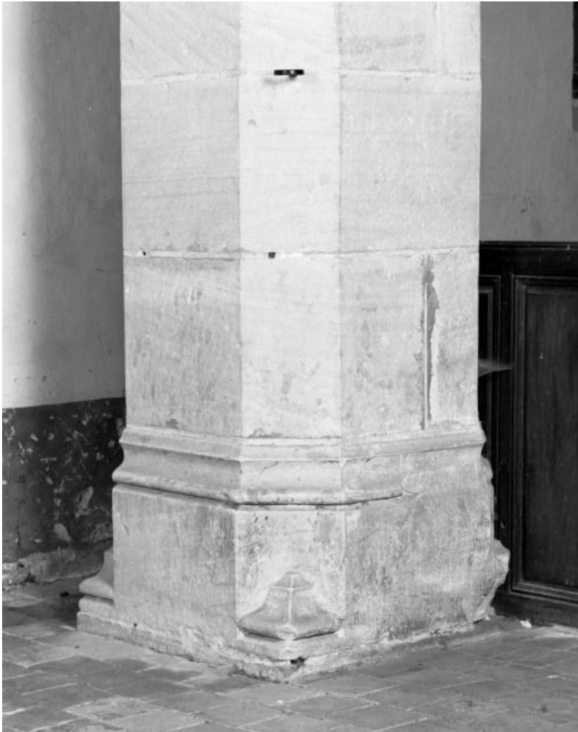
Travée sous clocher, base du pilier postérieur gauche