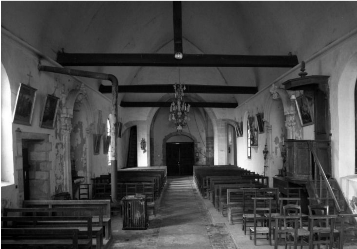
Vue intérieure prise depuis le chœur