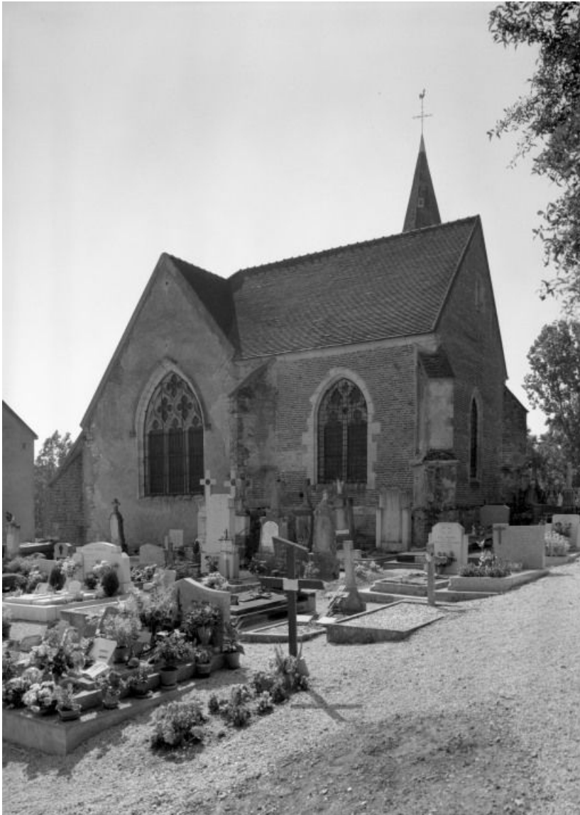
Chevet et chapelle seigneuriale