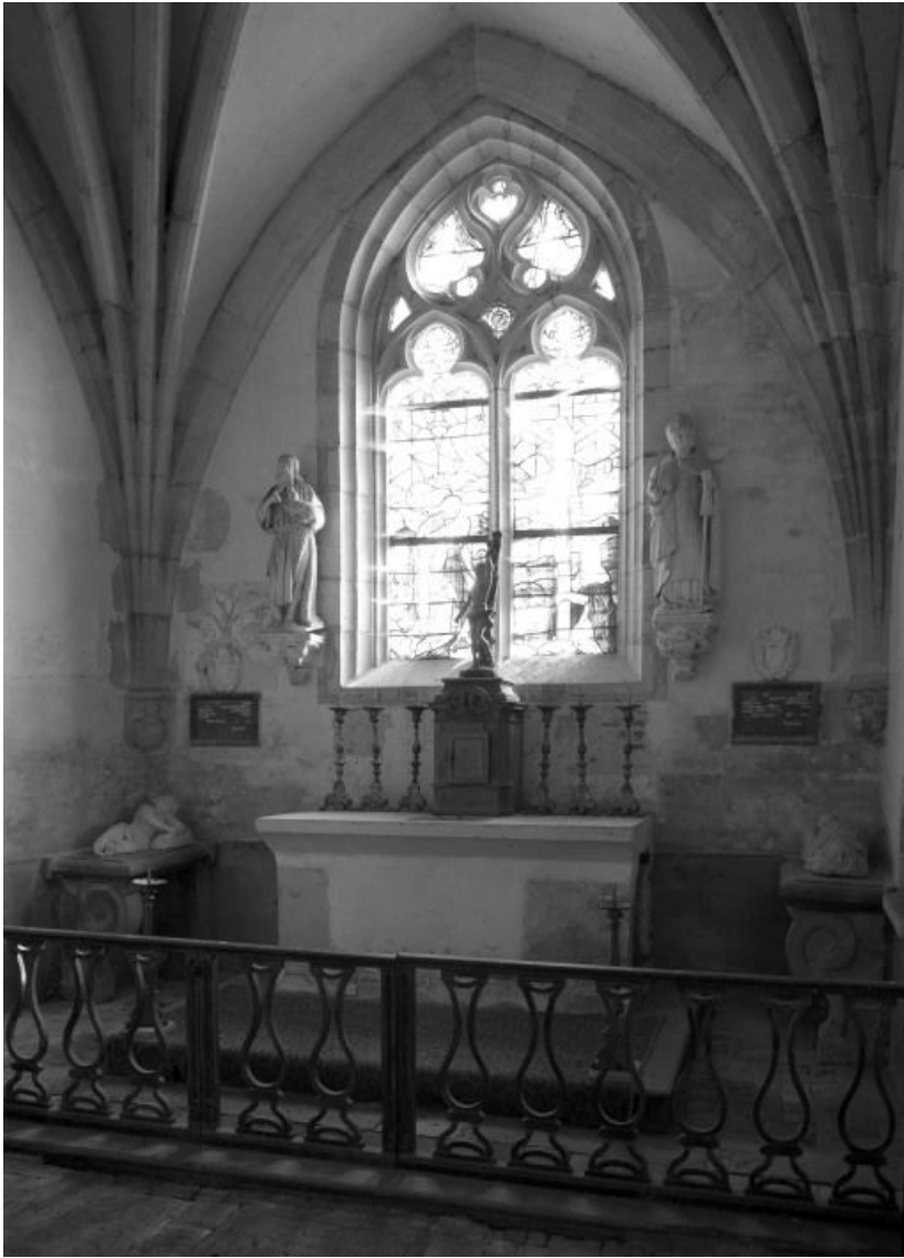
Vue intérieure de la chapelle seigneuriale