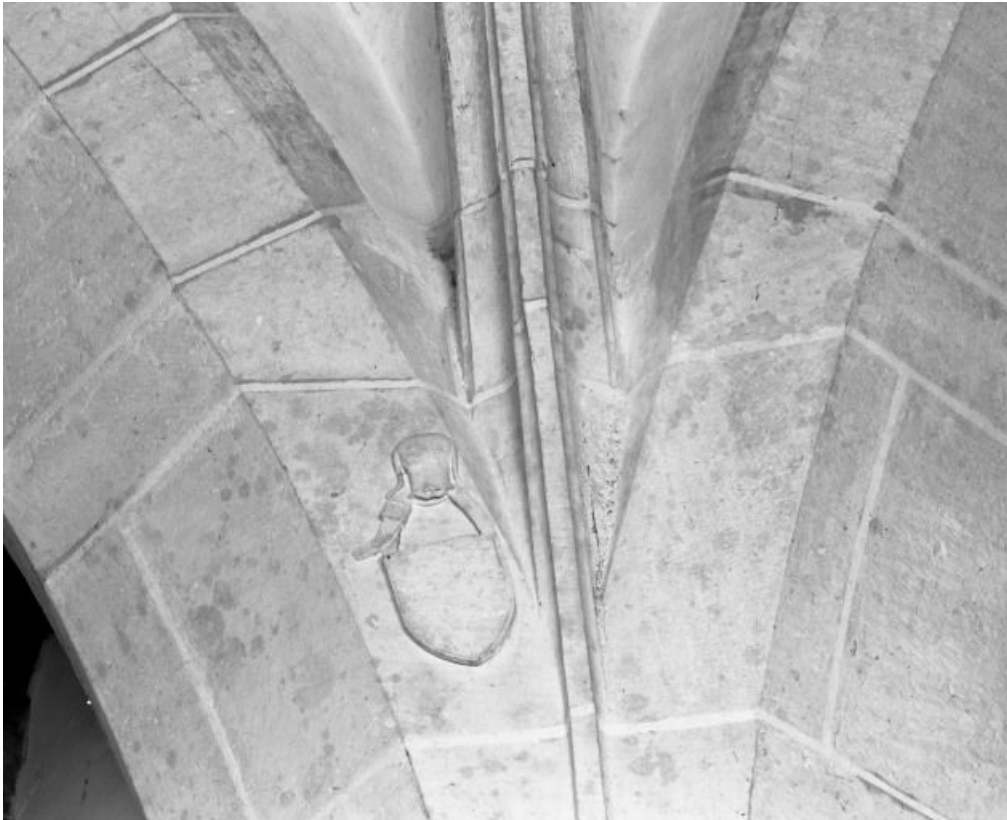
Travée sous clocher, angle postérieur gauche de la voûte 21, Auvillars-sur-Saône Eglise