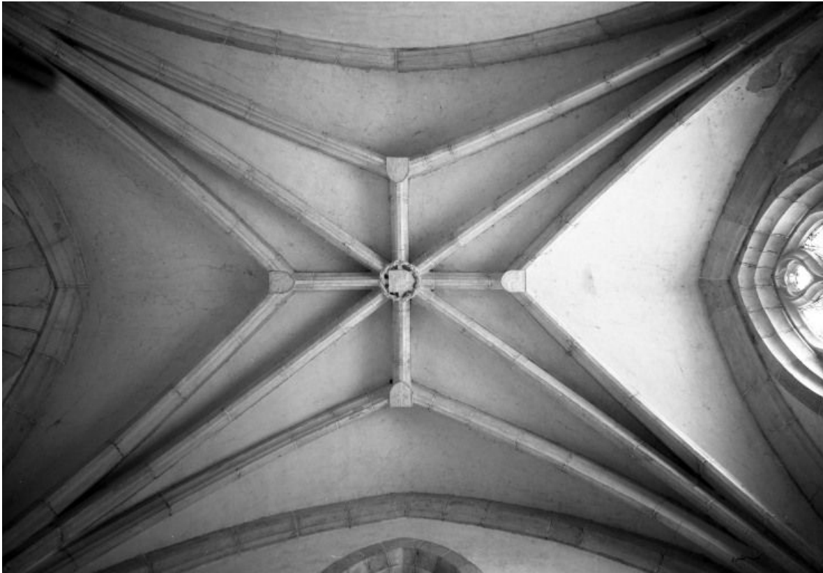
Voûte de la chapelle seigneuriale