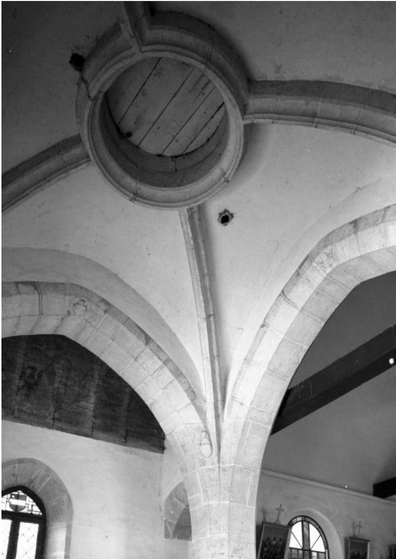
Voûte de la travée sous clocher