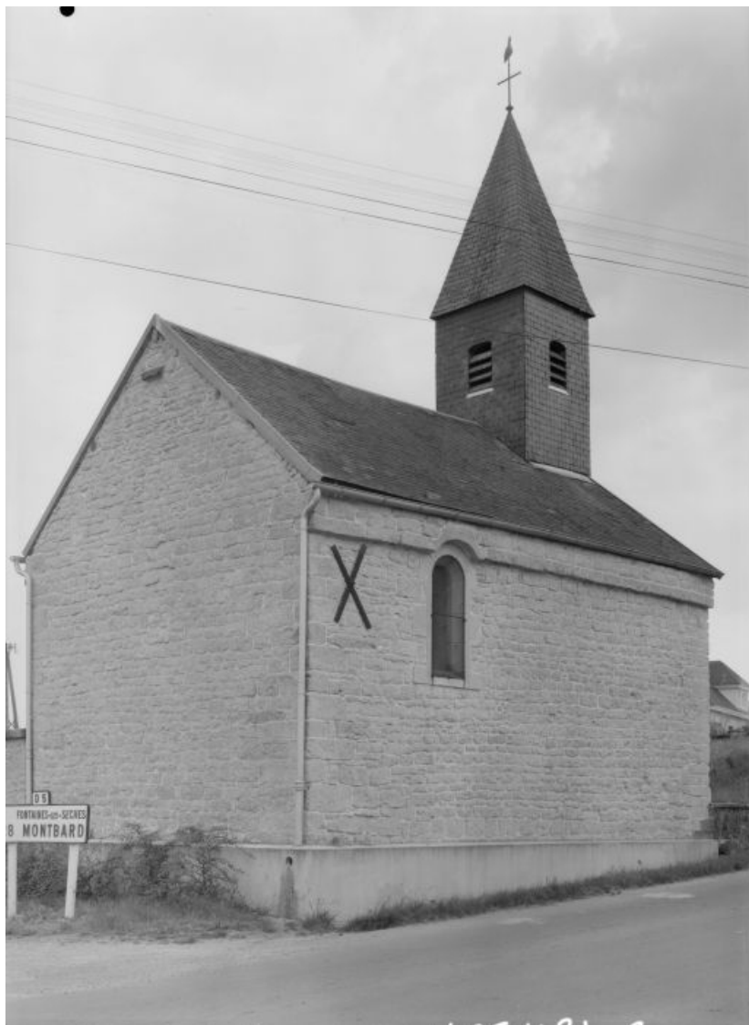
Chevet et élévation gauche.