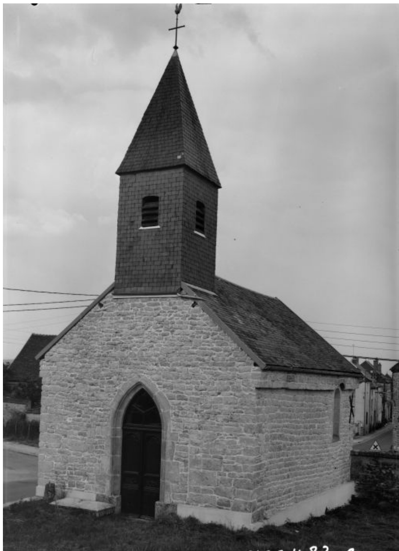
Façade et élévation droite.