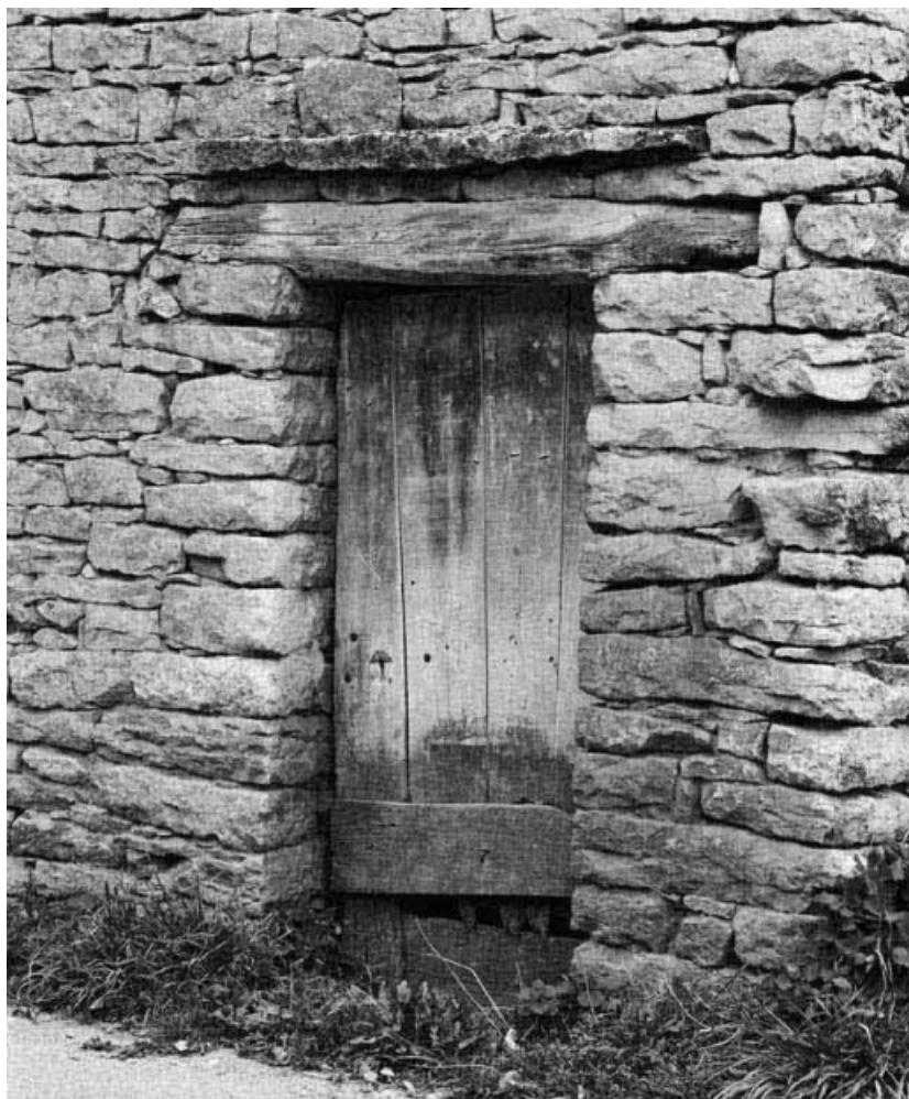
Détail de la petite porte de la grange sise parcelle 620, section C2 sur le cadastre de 1948. 21, Vauchignon