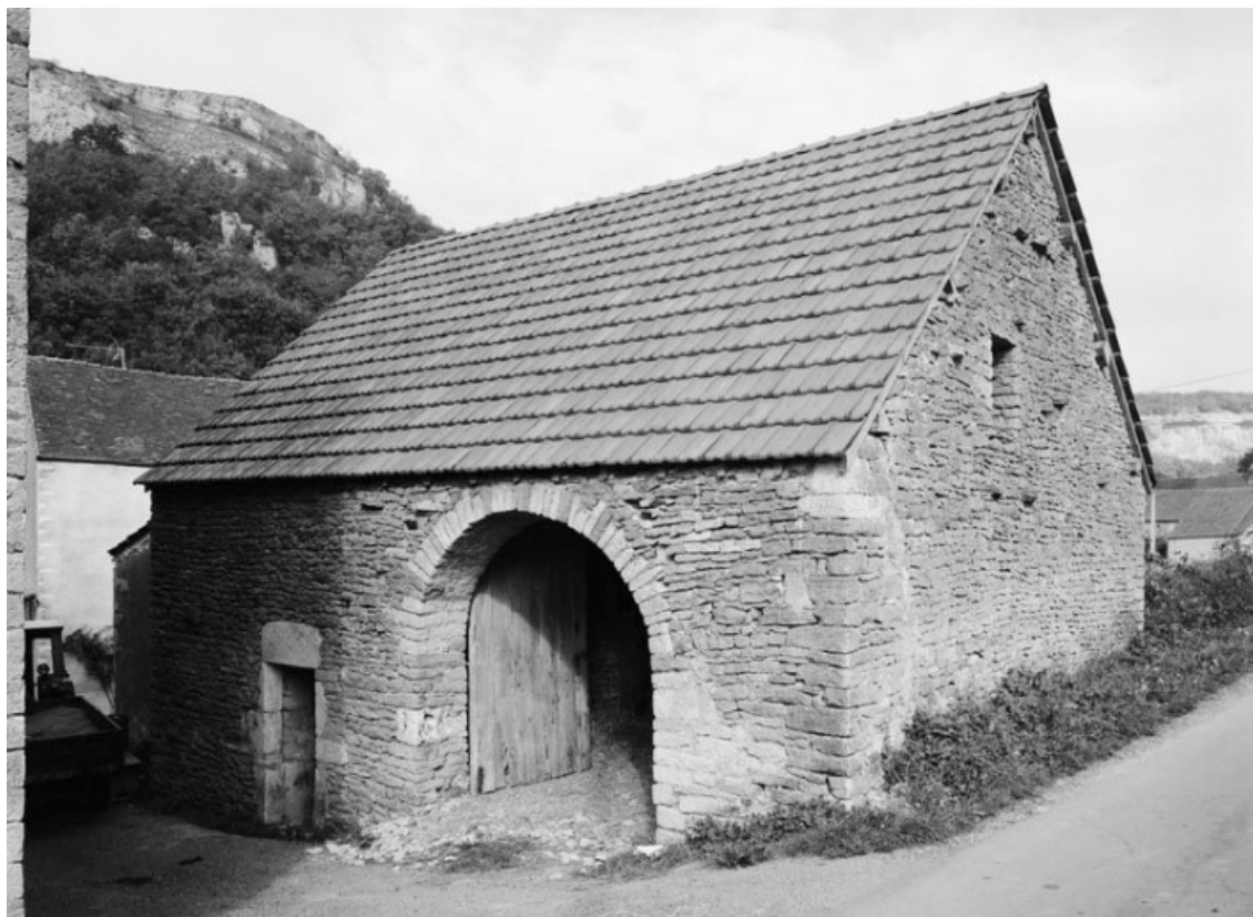
Vue d'ensemble de la grange et de la bergerie, parcelle 521, section C2 sur le cadastre de 1948. 21, Vauchignon