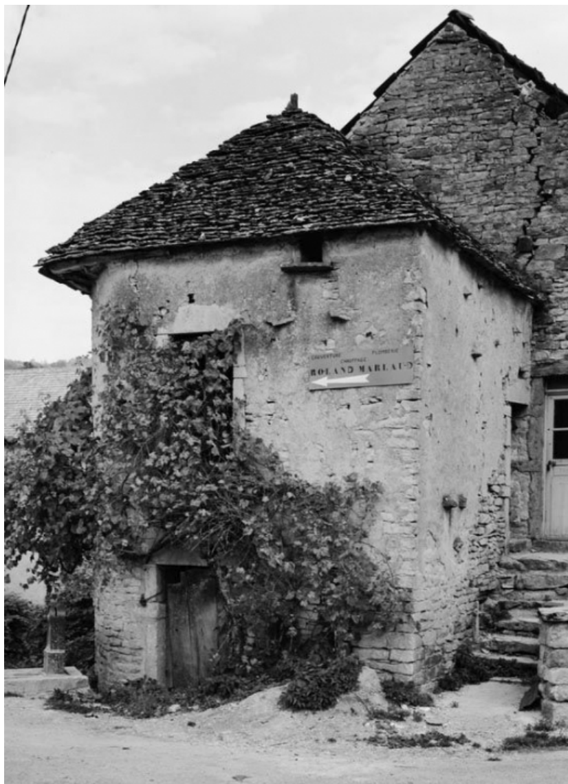
Vue d'ensemble de la maison, parcelle 570, section C2 sur le cadastre de 1948. 21, Vauchignon