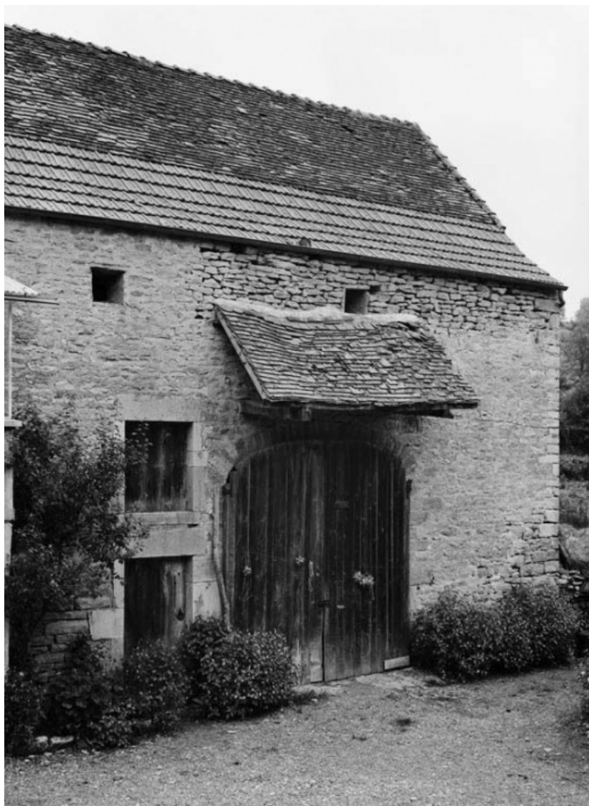
Dépendances, parcelle 652, section C2 sur le cadastre de 1948. 21, Vauchignon