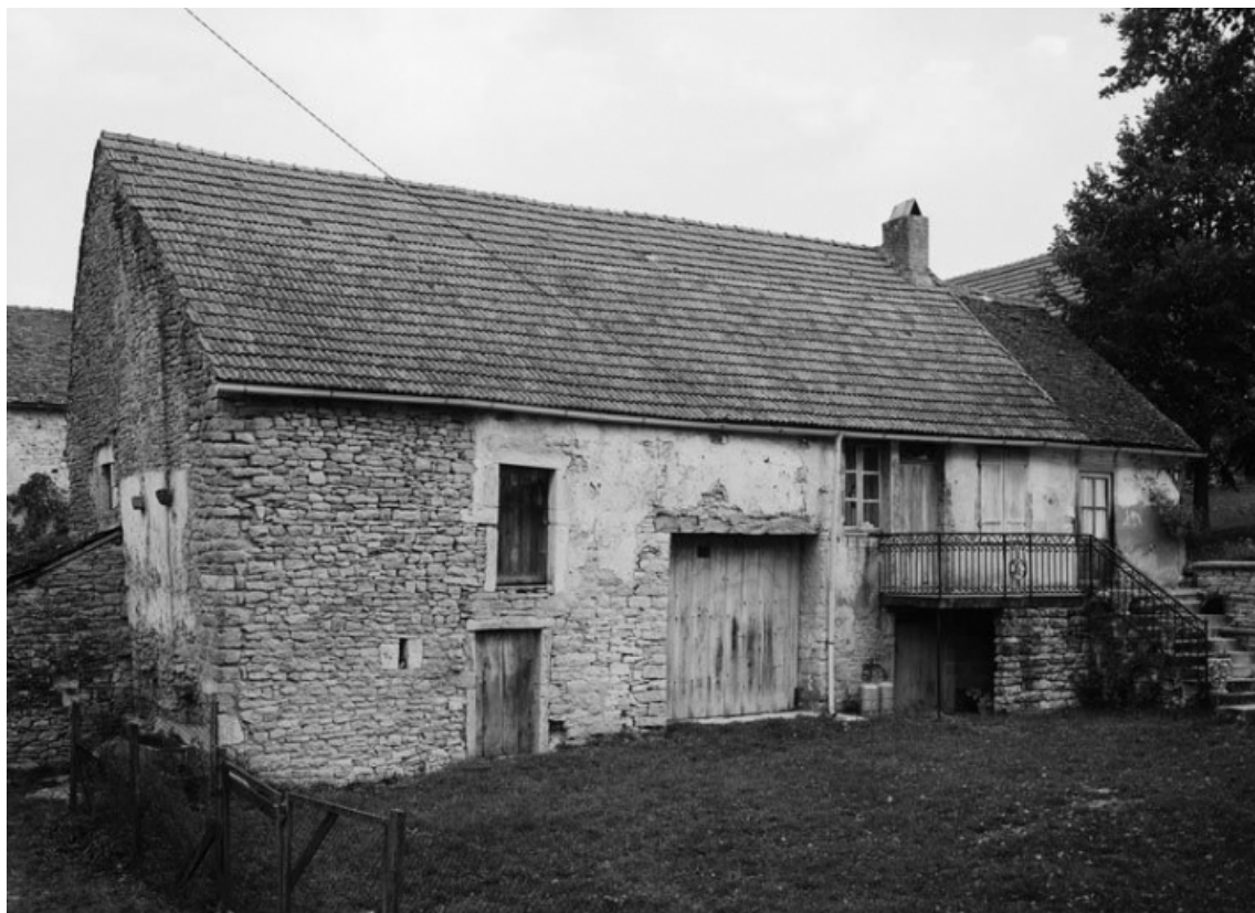
Vue de la maison sise parcelle 641, section C2 sur le cadastre de 1948. 21, Vauchignon