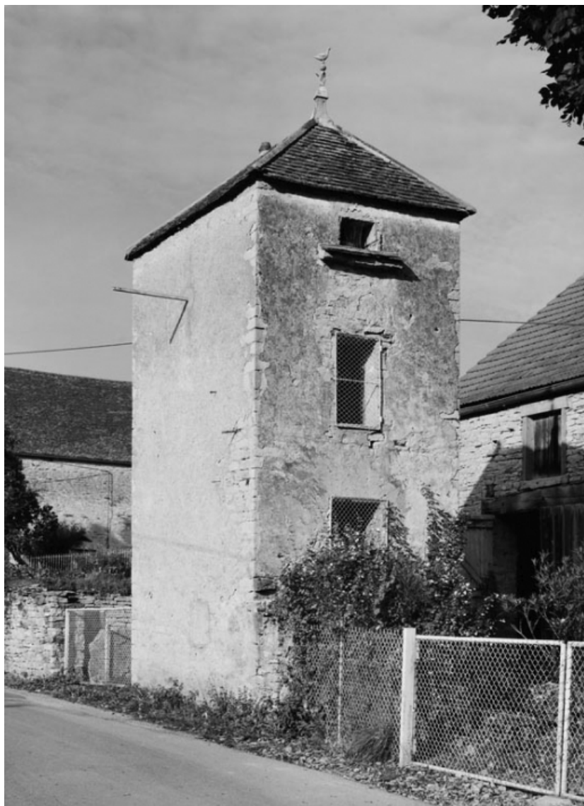
Colombier, parcelle 647, section C2 sur le cadastre de 1948. 21, Vauchignon