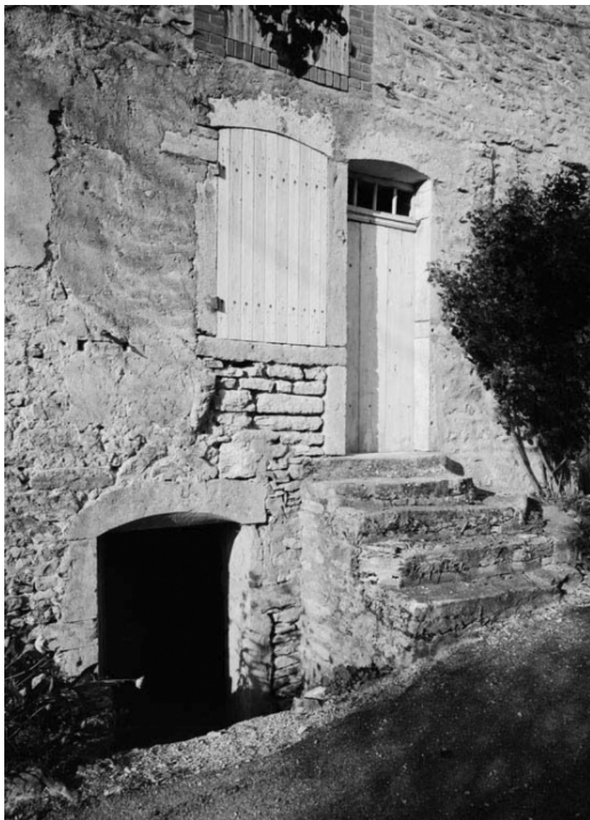
Vue de la maison sise parcelle 643 (a), section C2 sur le cadastre de 1948. 21, Vauchignon