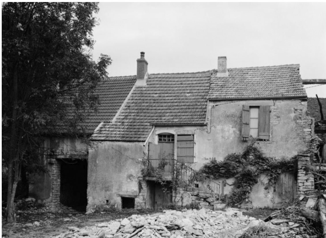
Vue d'ensemble de la maison sise parcelle 504, section C2 sur le cadastre de 1948. 21, Vauchignon