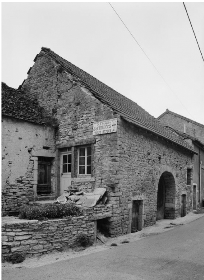
Vue d'ensemble de la maison, datée de 1788 et sise parcelle 571, section C2 sur le cadastre de 1948. 21, Vauchignon