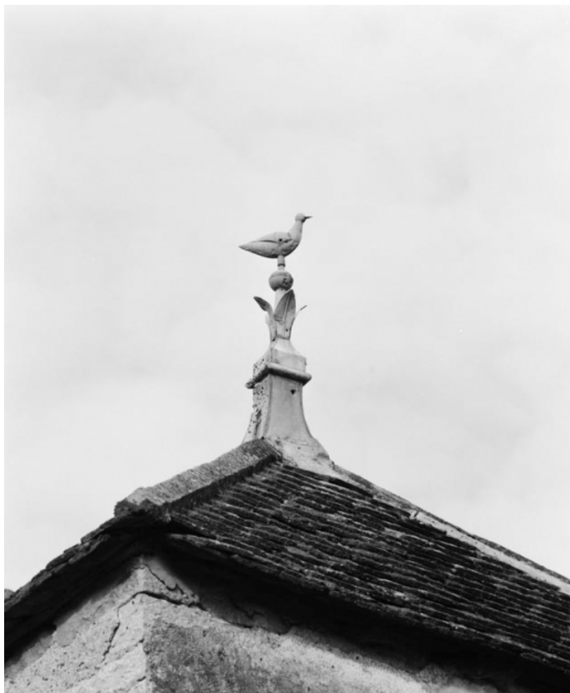
Détail de l'épi de faitage du colombier, parcelle 647, section C2 sur le cadastre de 1948. 21, Vauchignon