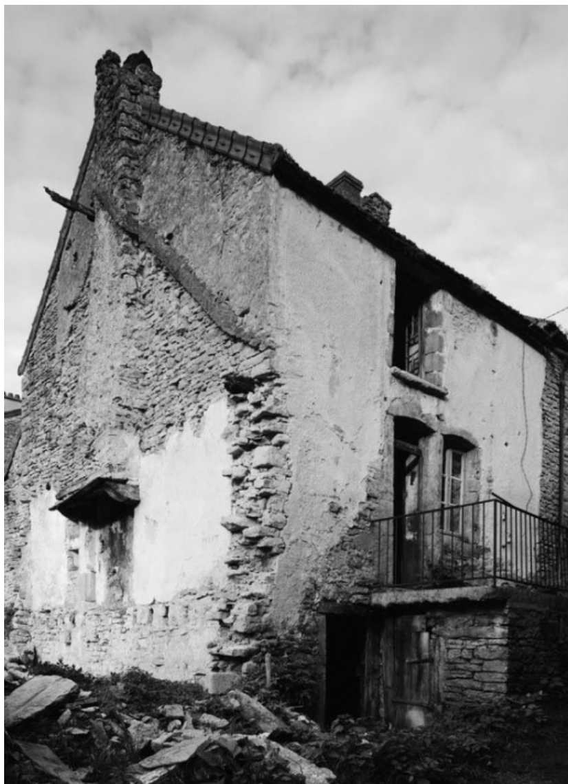
Vue d'ensemble de la maison sise parcelle 491, section C2 sur le cadastre de 1948. 21, Vauchignon