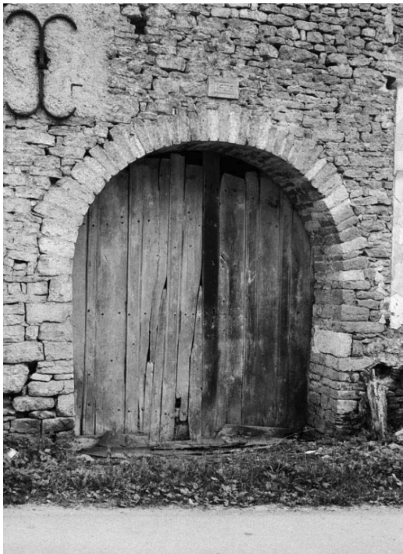
Porte charretière, datée 1626 et sise parcelle 585, section C2 sur le cadastre de 1948. 21, Vauchignon