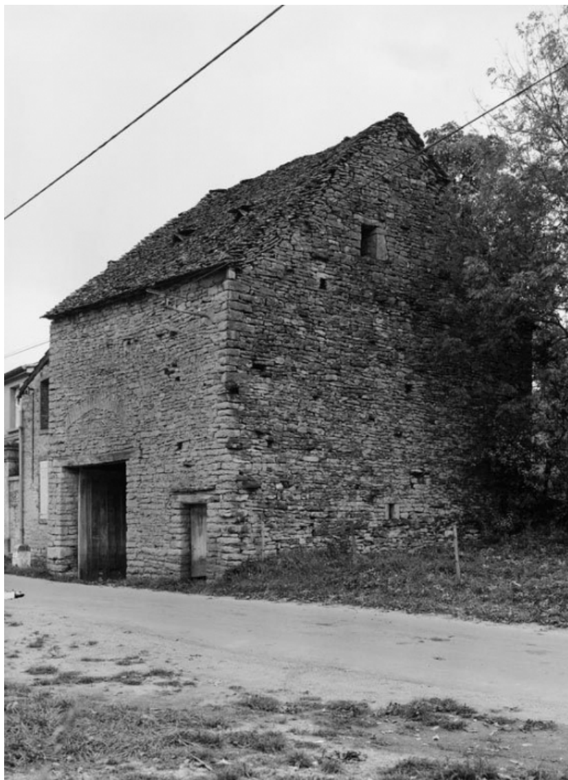
Vue d'ensemble de la grange sise parcelle 620, section C2 sur le cadastre de 1948. 21, Vauchignon