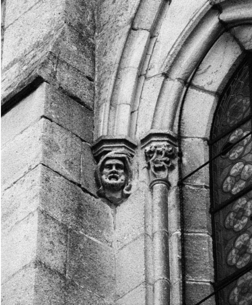
Façade antérieure : détail d'un culot.