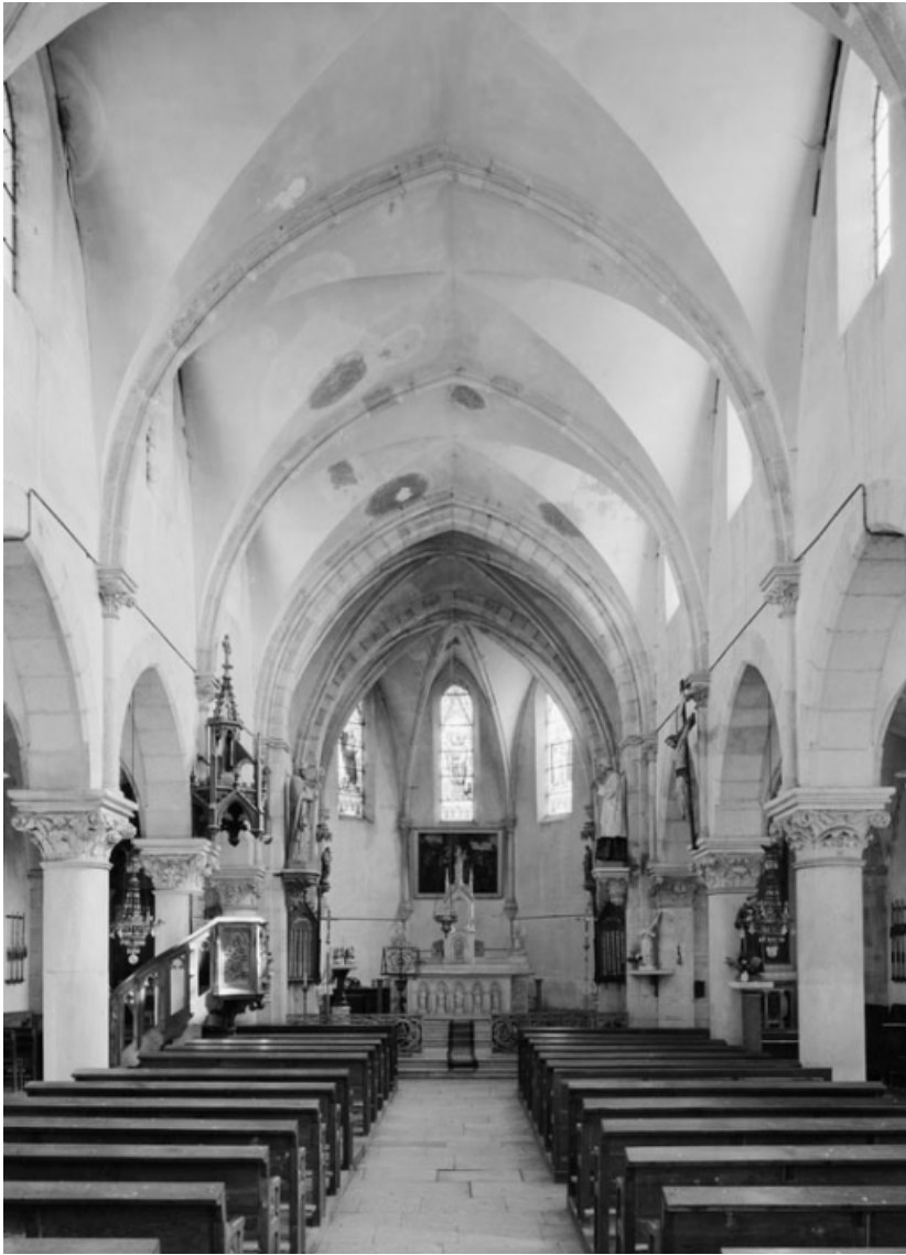
Vue d'ensemble depuis l'entrée.