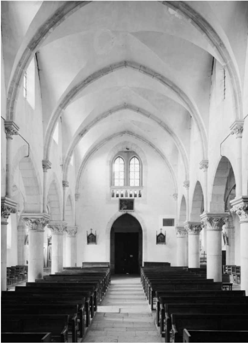
Vue d'ensemble depuis le chœur.