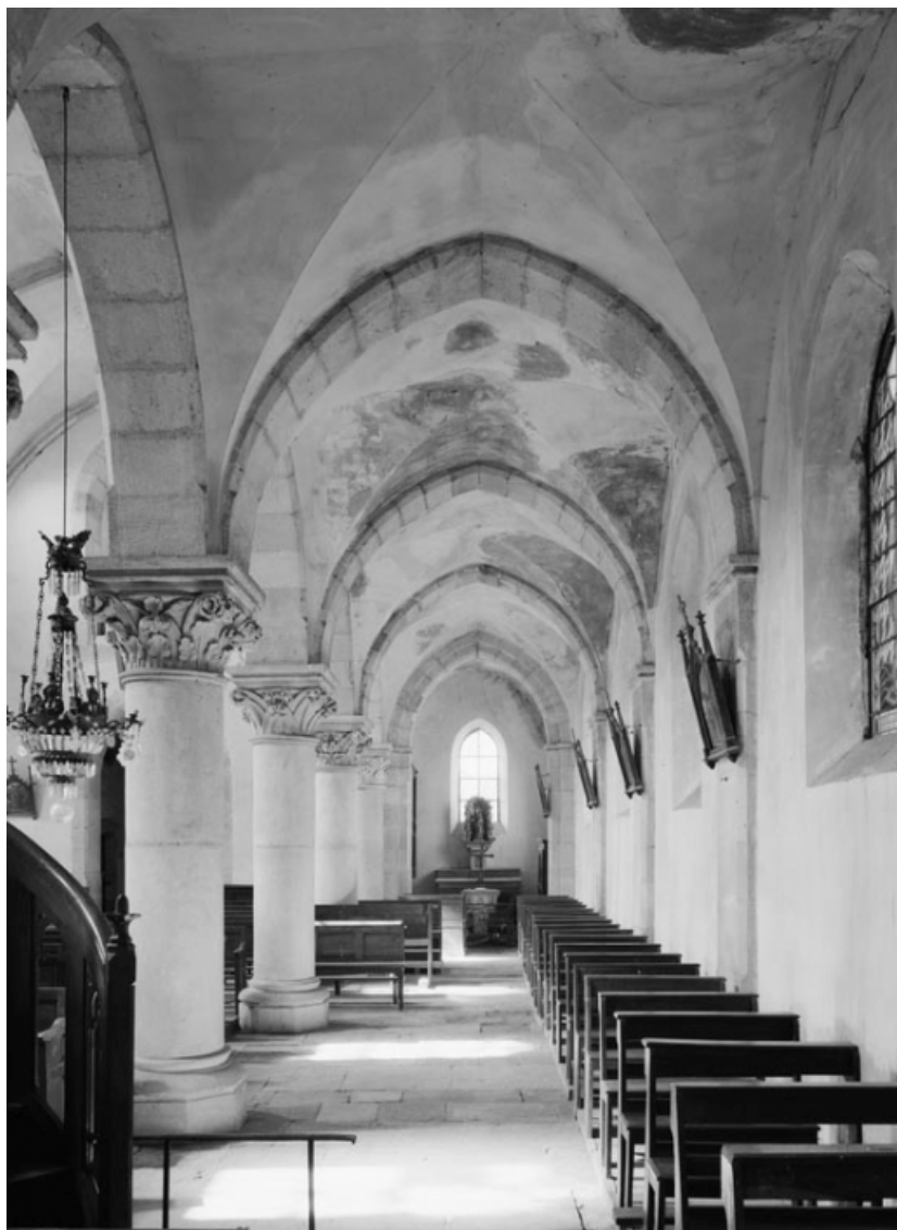
Bas-côté droit. 21, Thury