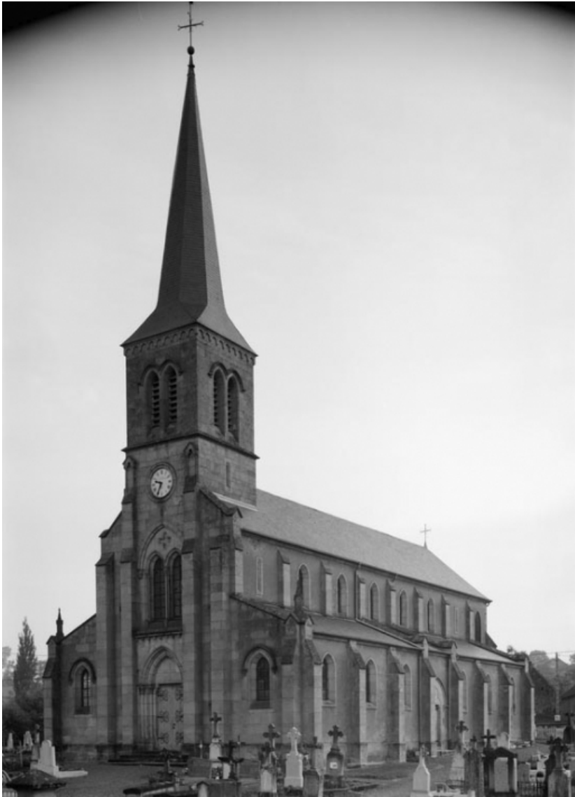
Vue d'ensemble de 3/4 droit.