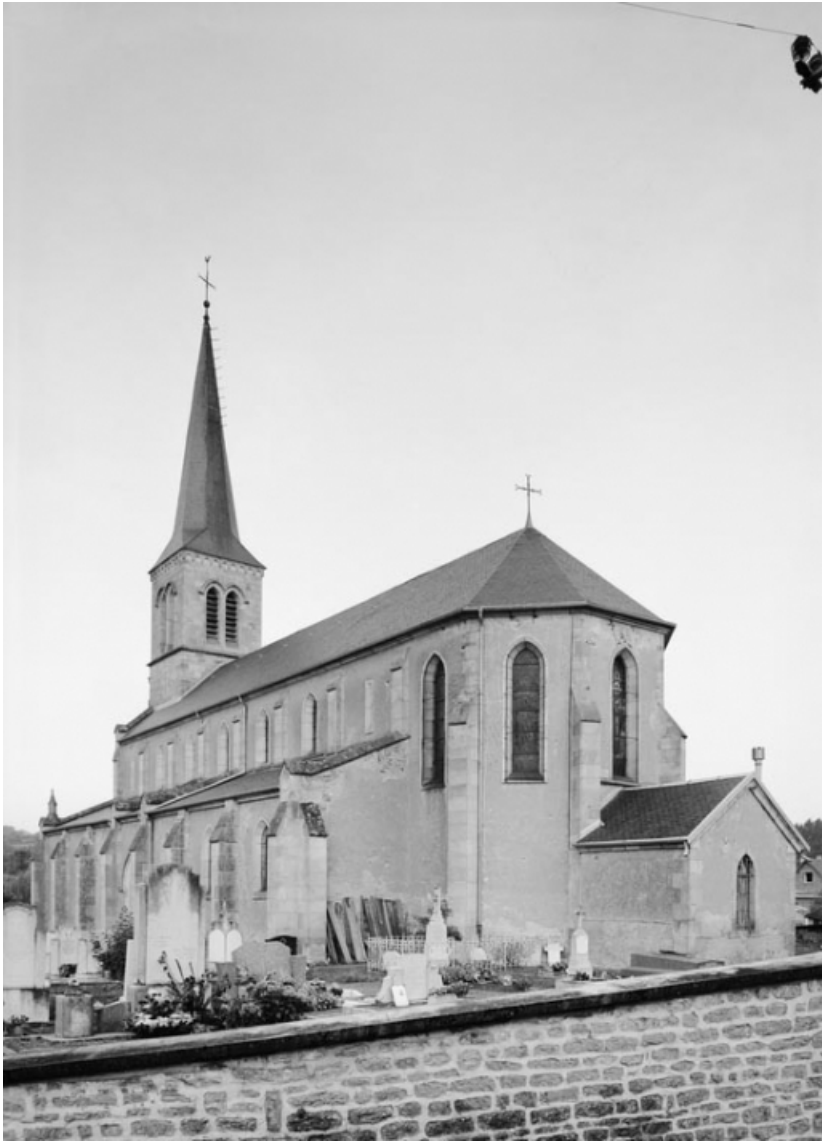
Chevet et élévation droite.