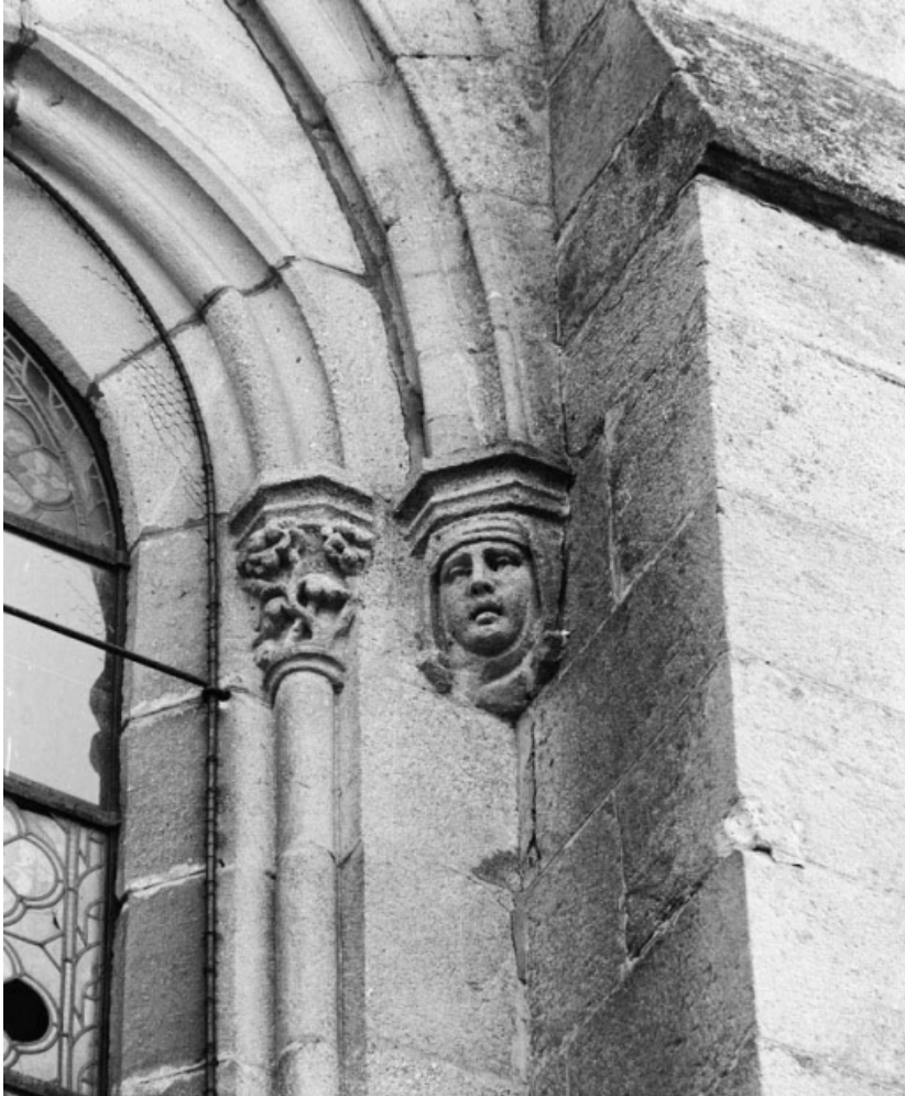
Façade antérieure : détail d'un culot.