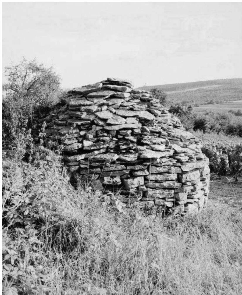
Vue de l'élévation postérieure avec jour axial.