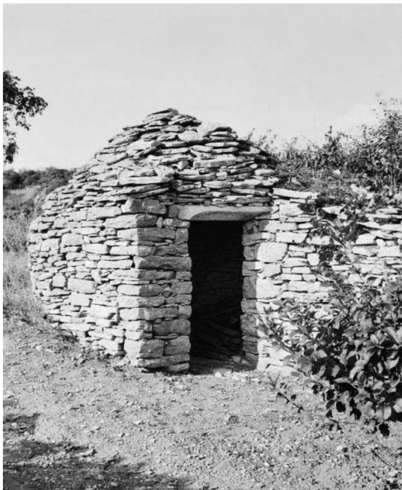
Vue d'ensemble de la cabane et mur de soutènement.