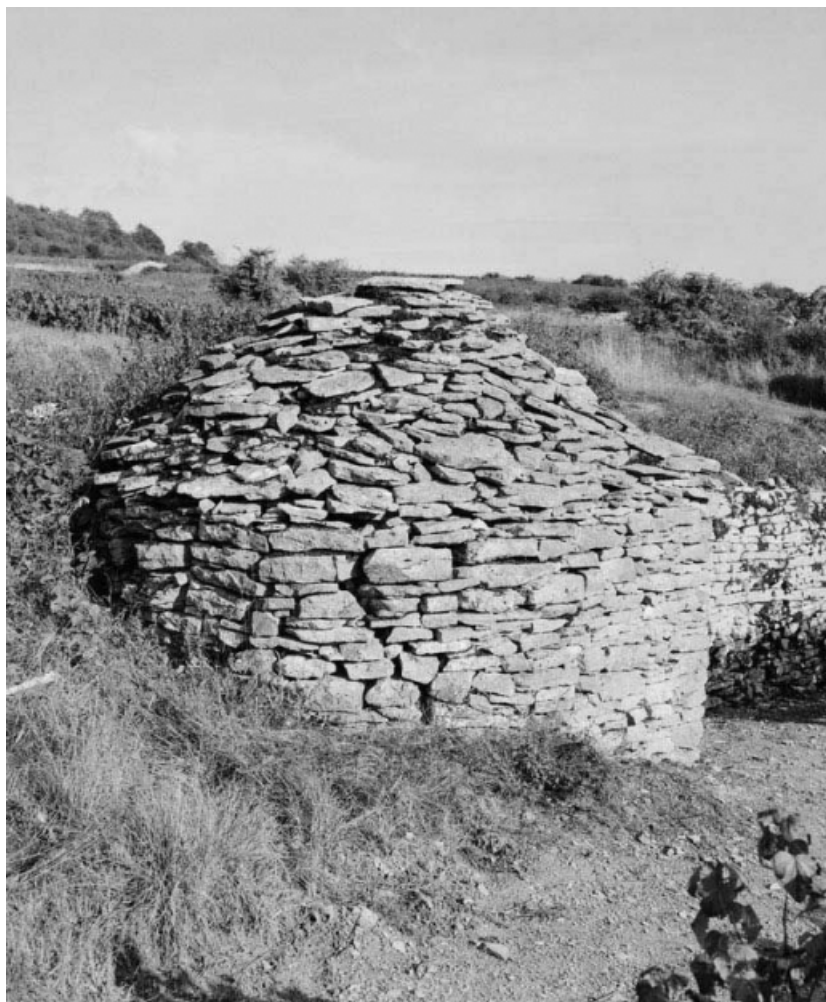
Vue de l'élévation postérieure.