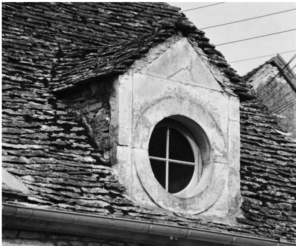
Détail de la lucarne droite, de trois quarts.