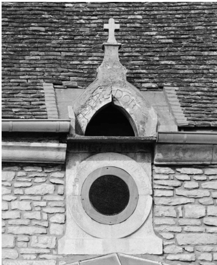
Détail de l'oeil-de-boeuf situé à l'aplomb de la porte.