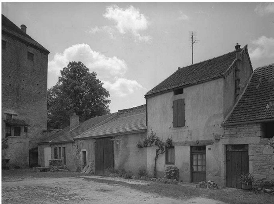
Corps de bâtiment bordant la cour à droite.