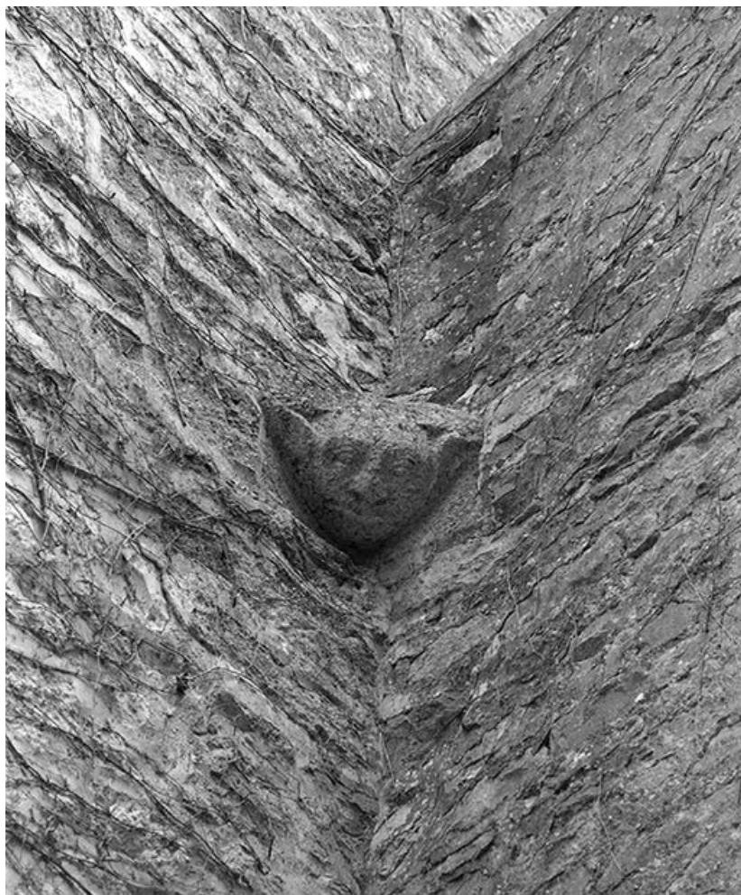
Tête sculptée dans l'angle du corps de logis et de l'aile en retour.