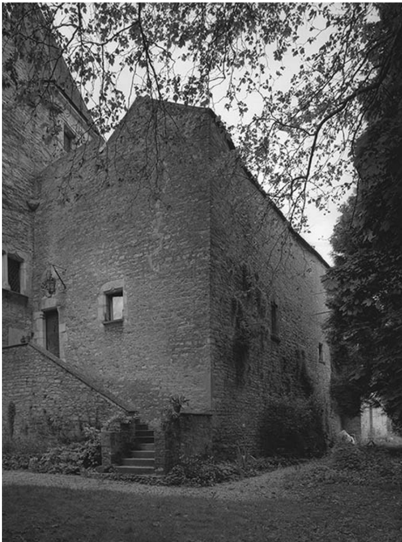
Élévations droite et postérieure de l'aile.