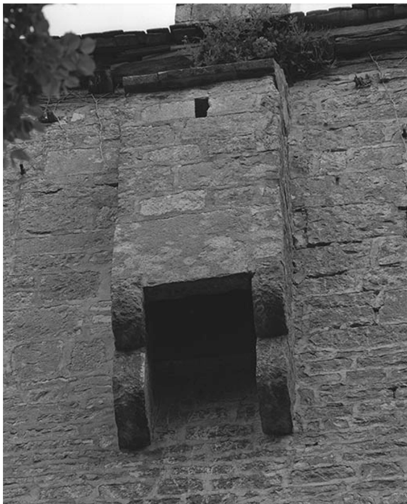
Face droite de la tour : bretèche.