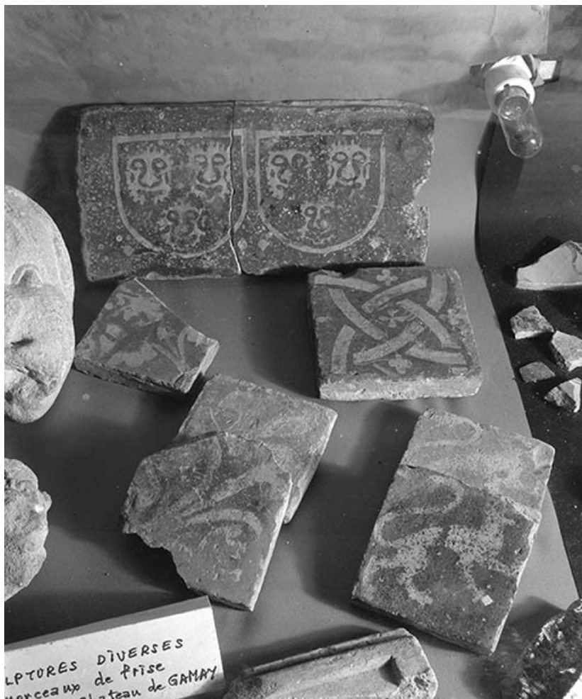
Fragments de carreaux de terre cuite vernissée.