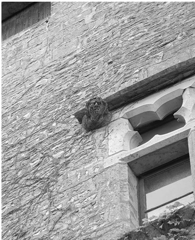
Buste sculpté sur la fenêtre du 2 e étage de la tour.