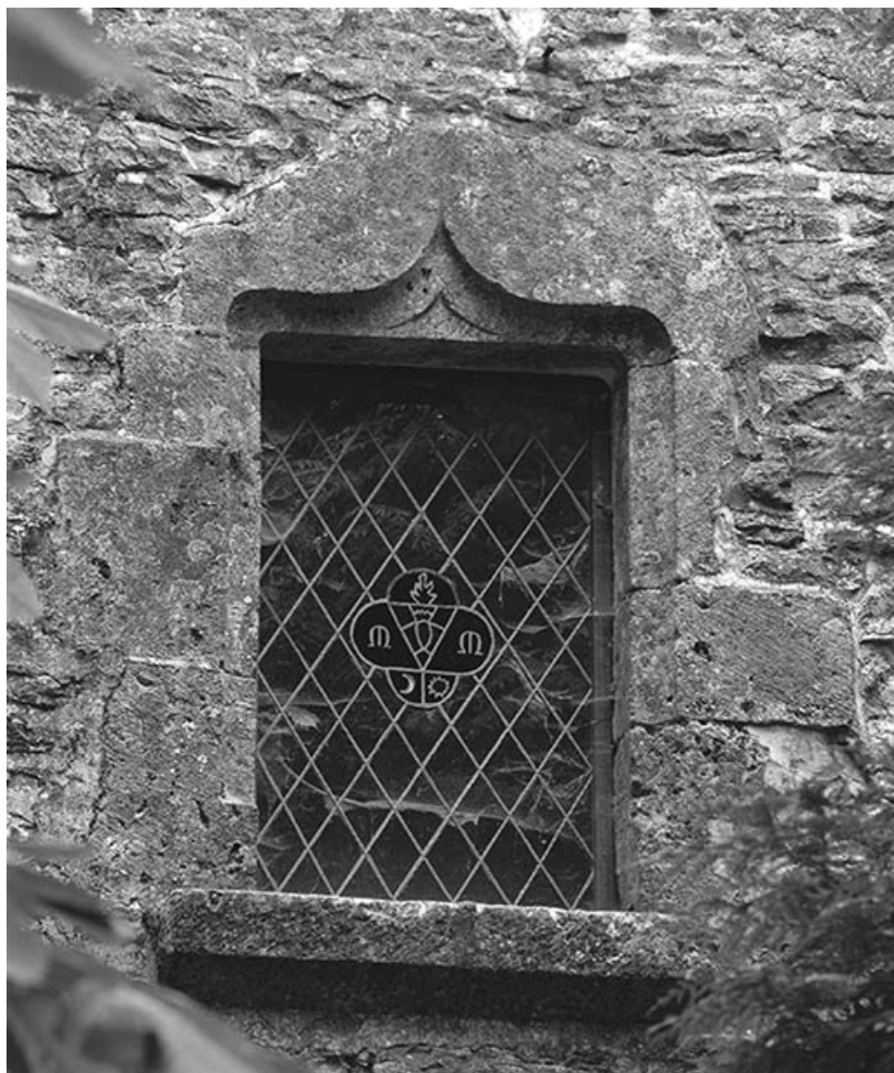
Fenêtre de l'élévation postérieure de l'aile.