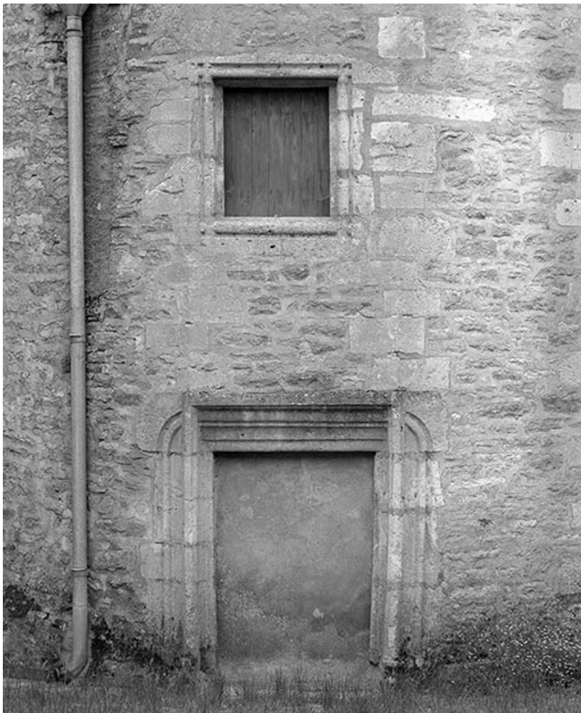
Porte et fenêtre de la tourelle d'escalier.