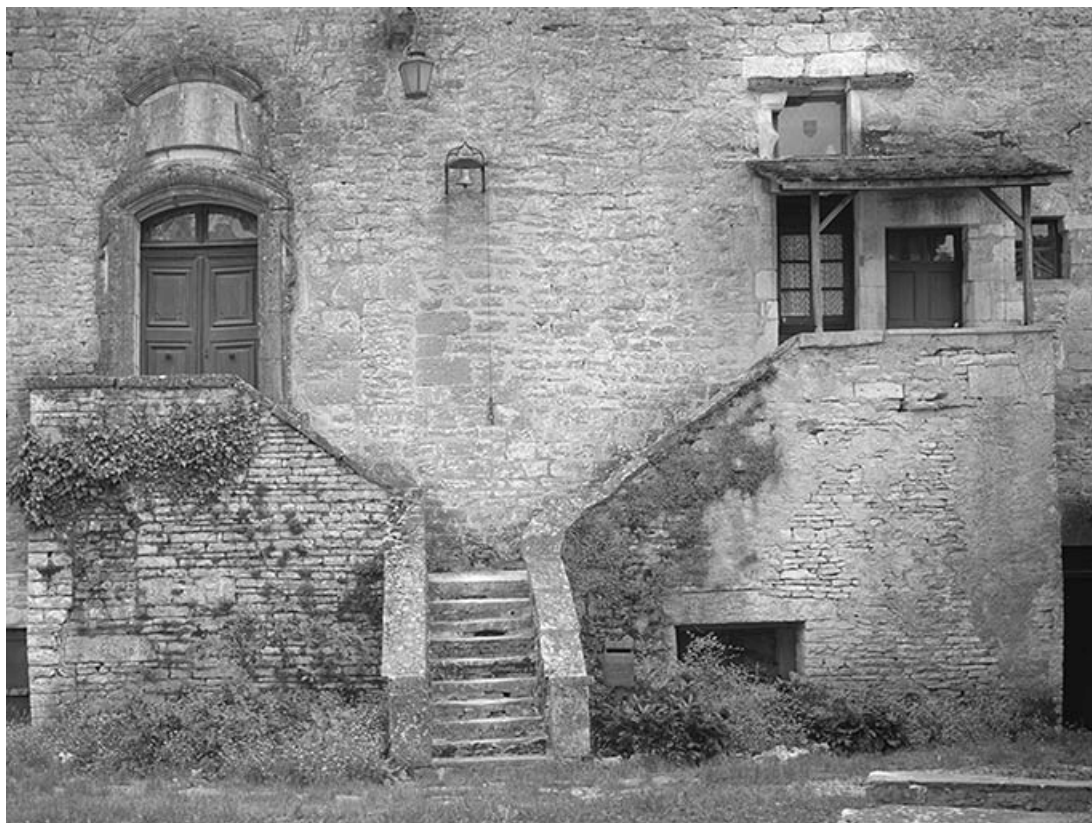
Façade antérieure : escalier desservant l'étage d'habitation.