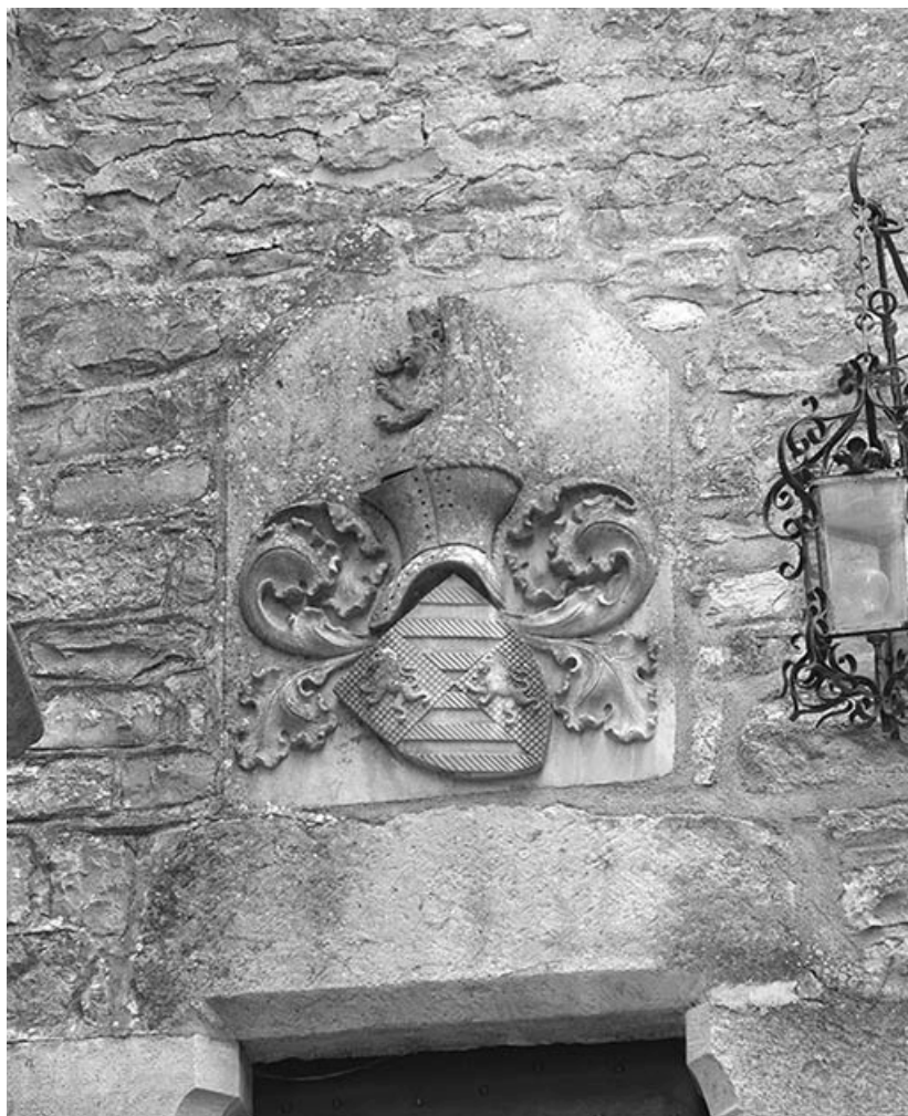
Blason surmontant la porte sur l'élévation droite de l'aile.