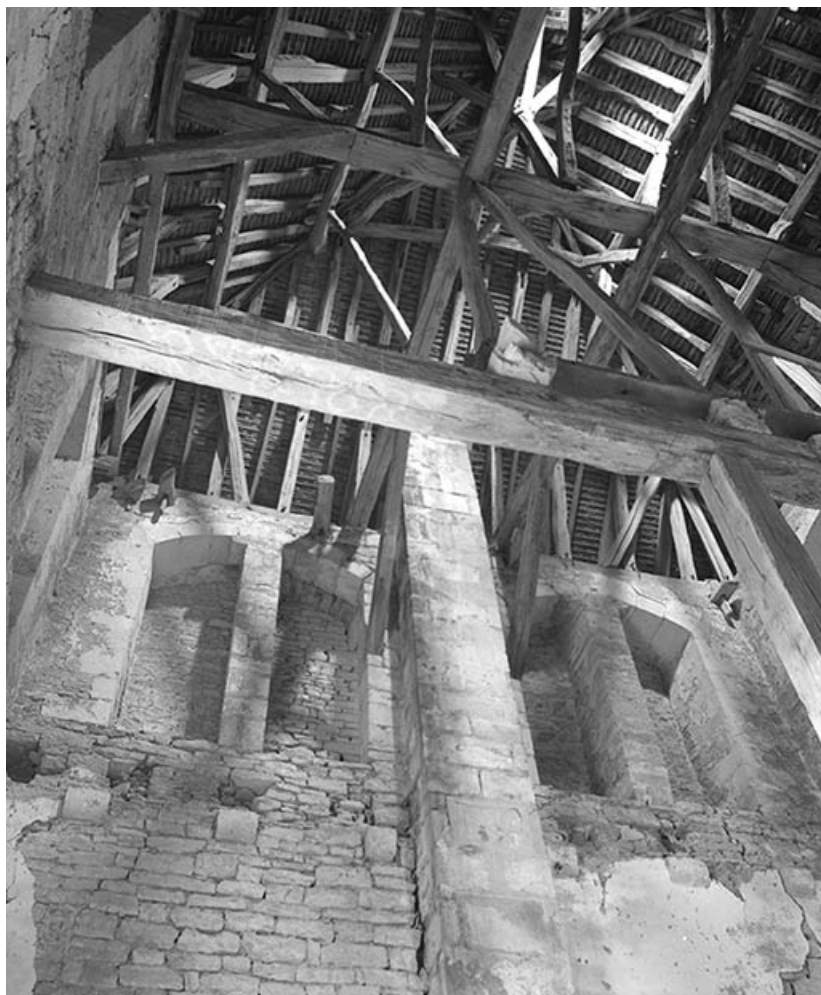
Baies murées de l'étage supérieur et charpente de la tour.