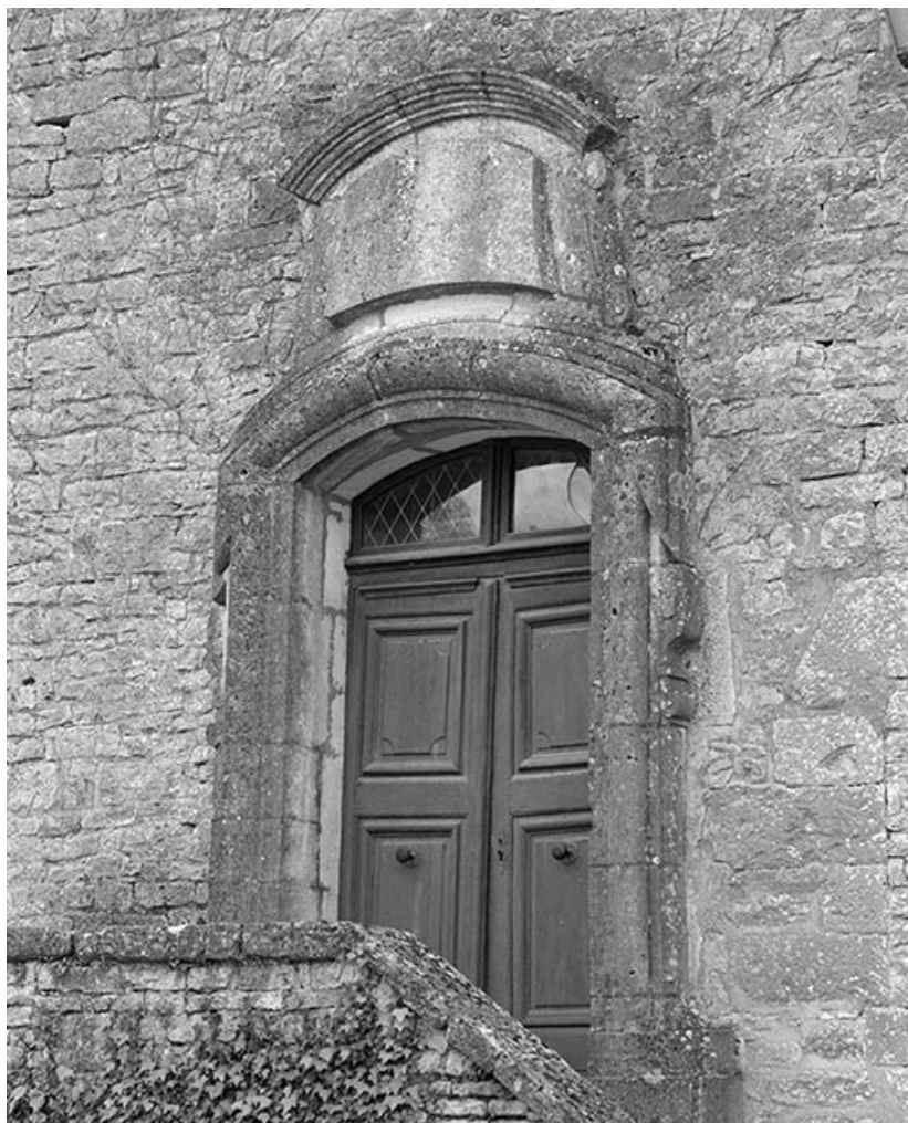
Portail de la façade antérieure du corps de logis.