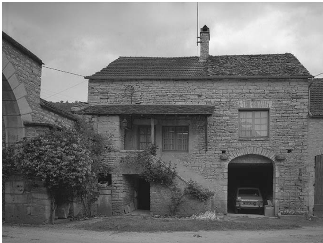
Portail et maison bordant la cour à gauche.