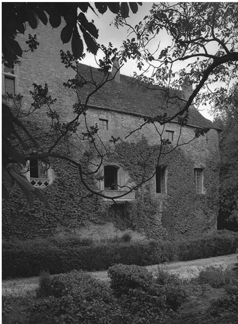
Façade postérieure du corps de logis.