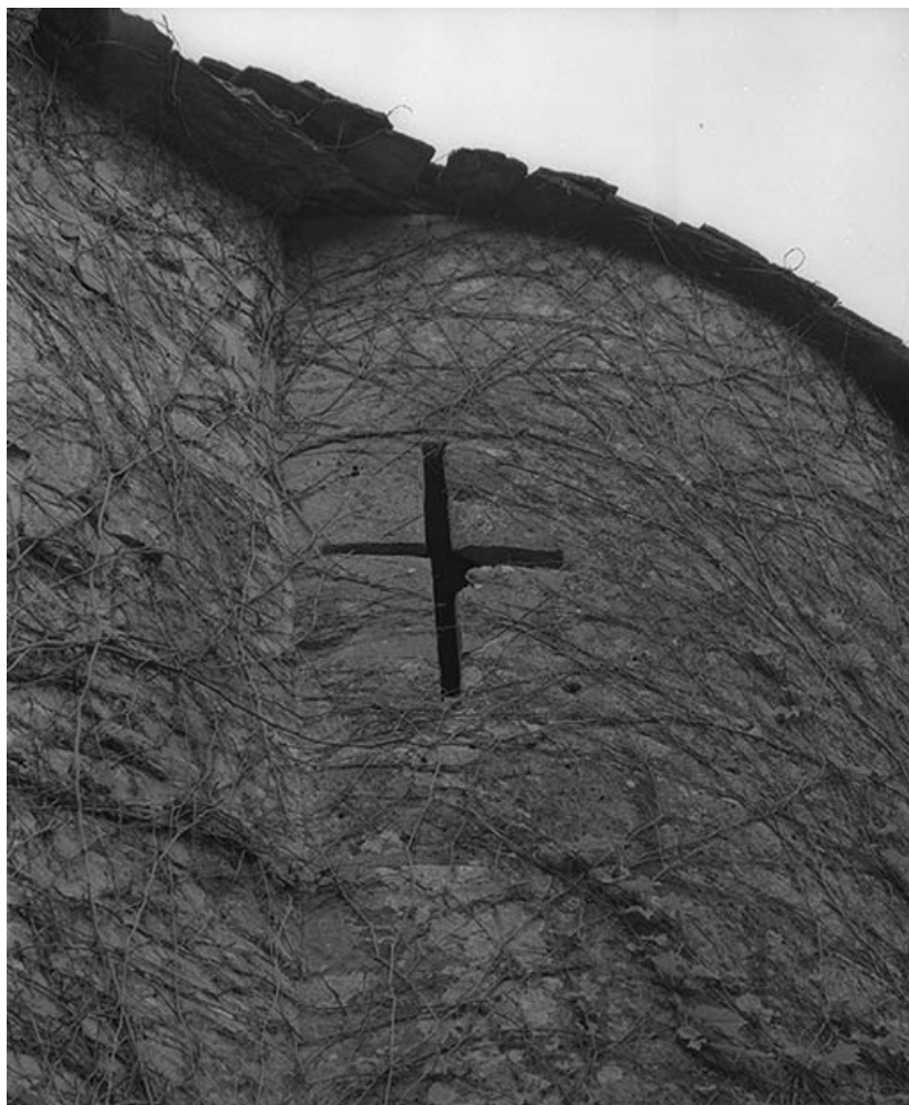
Archère de l'échauguette du corps de logis.