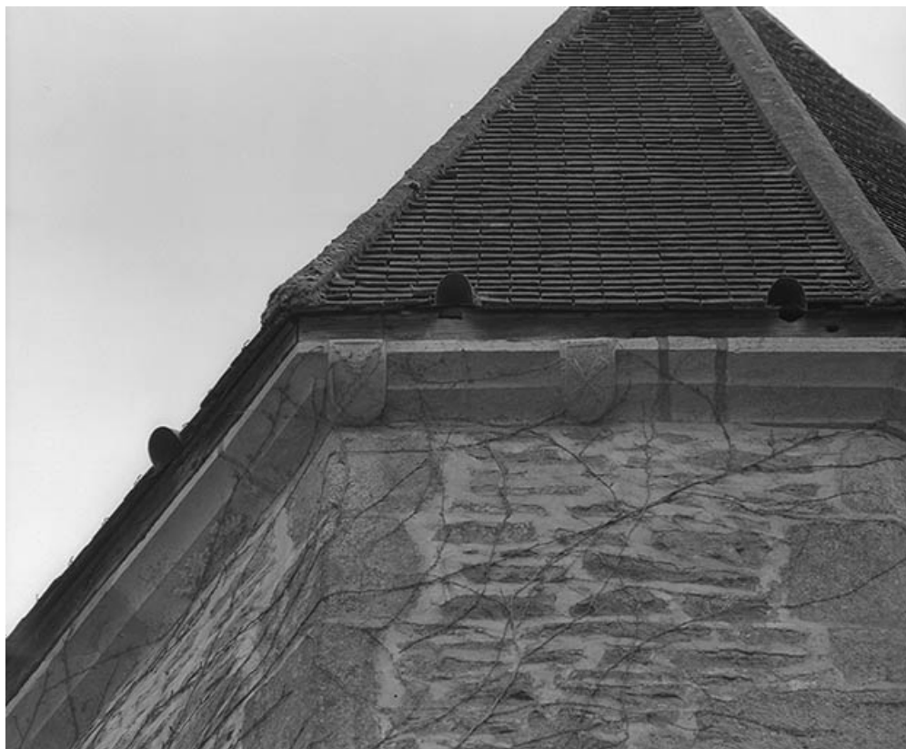
Corniche ornée de blasons sur la tourelle d'escalier.