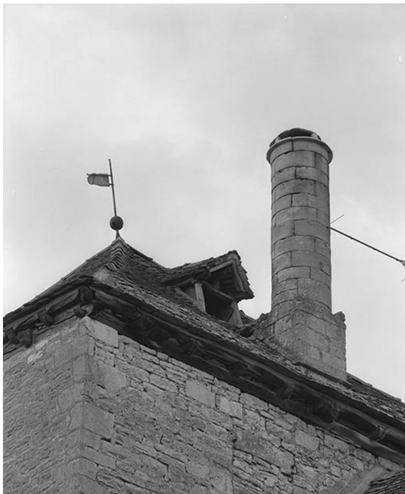
Souche de cheminée sur la tour (versant gauche).