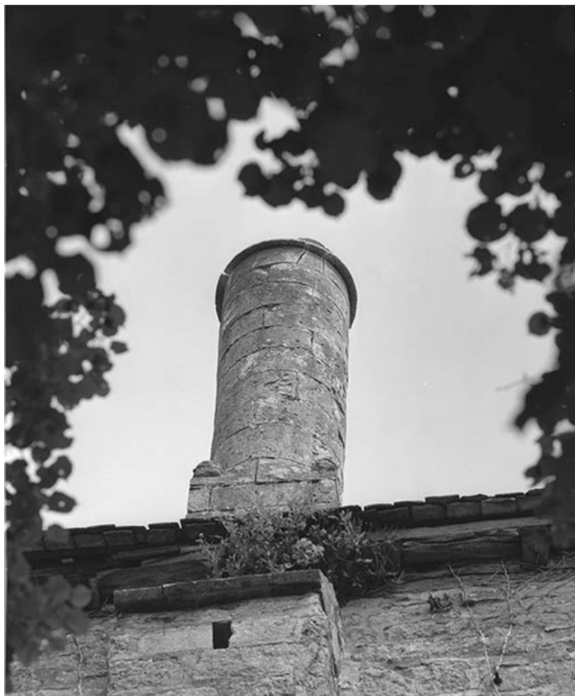
Souche de cheminée sur la tour (versant droit).