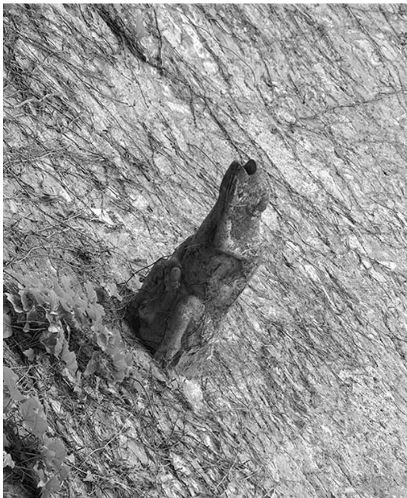
Ancienne gargouille de la façade postérieure du corps de logis.