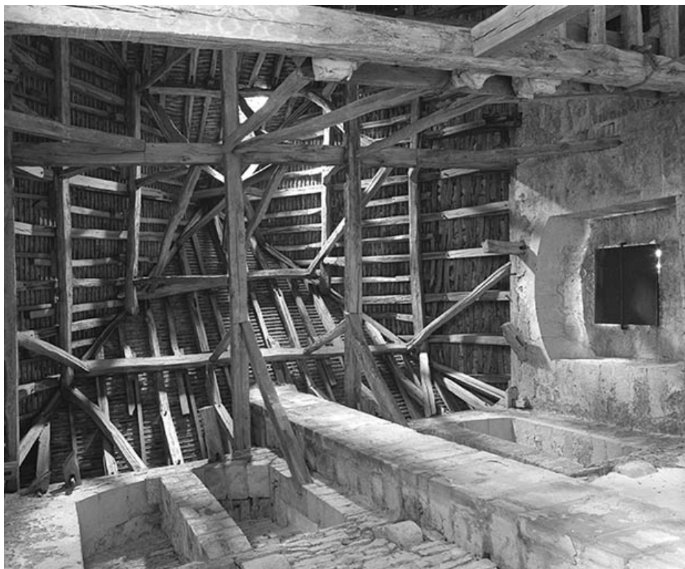
Baies de l'étage supérieur et charpente de la tour.