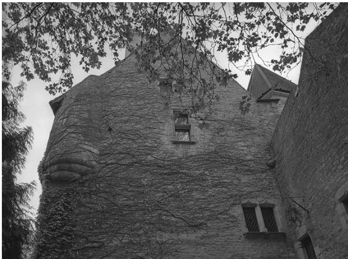
Partie supérieure de l'élévation gauche du corps de logis.