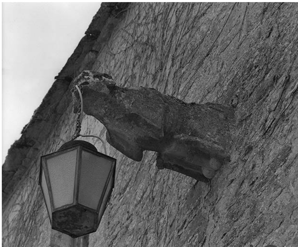
Ancienne gargouille de la façade antérieure du corps de logis.