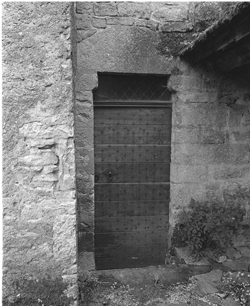
Face antérieure de la tour : porte d'entrée de la salle basse.