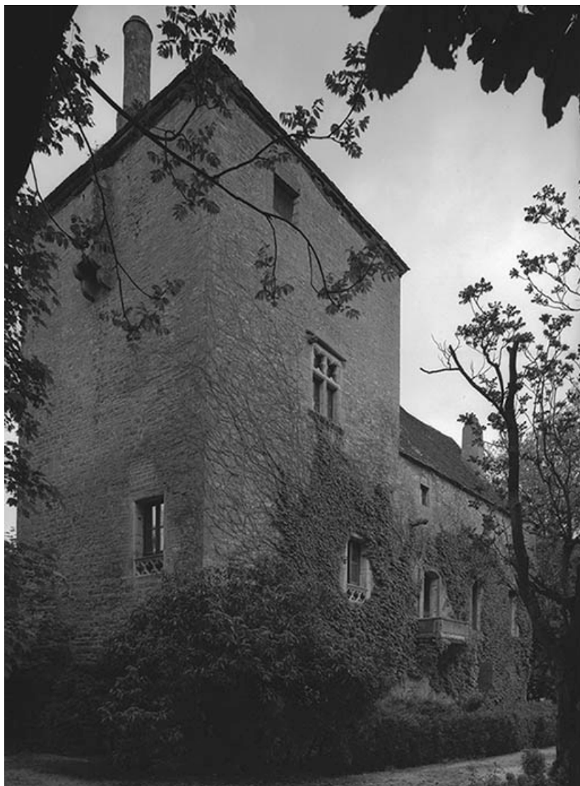
Tour : faces droite et postérieure.