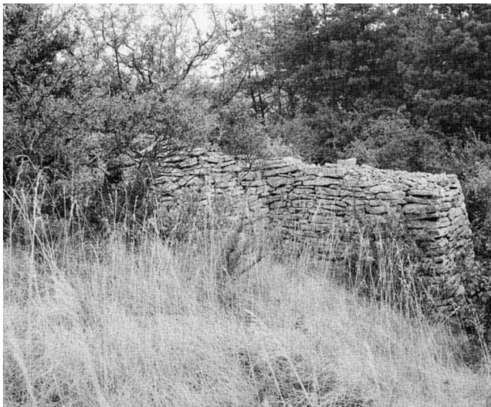
Cabane et mur de clôture.