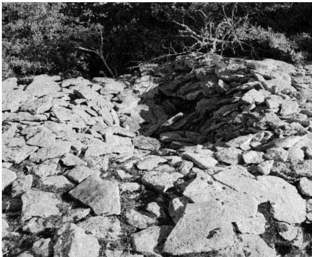
Couverture et partie supérieure du murger.