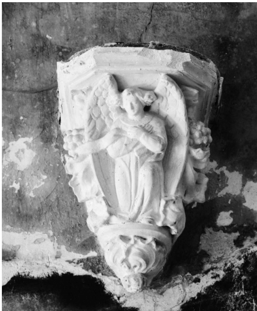
Console. 21, Nolay