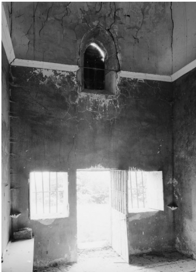
Vue depuis l'autel.