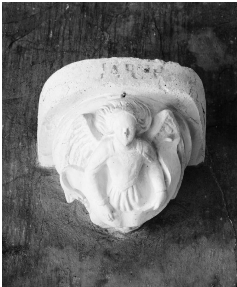
Console. 21, Nolay