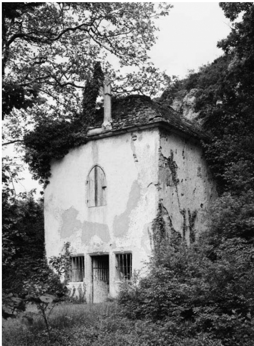
Vue de 3/4 droit.