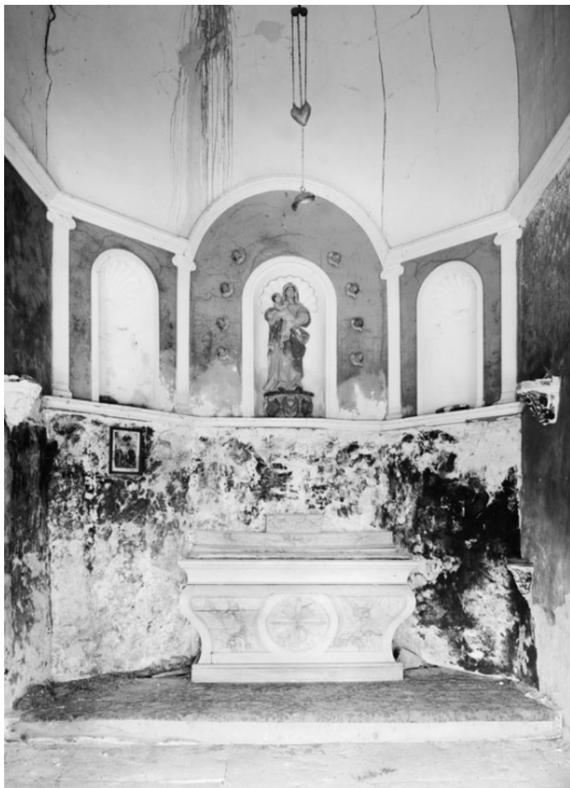
Vue depuis l'intérieur.