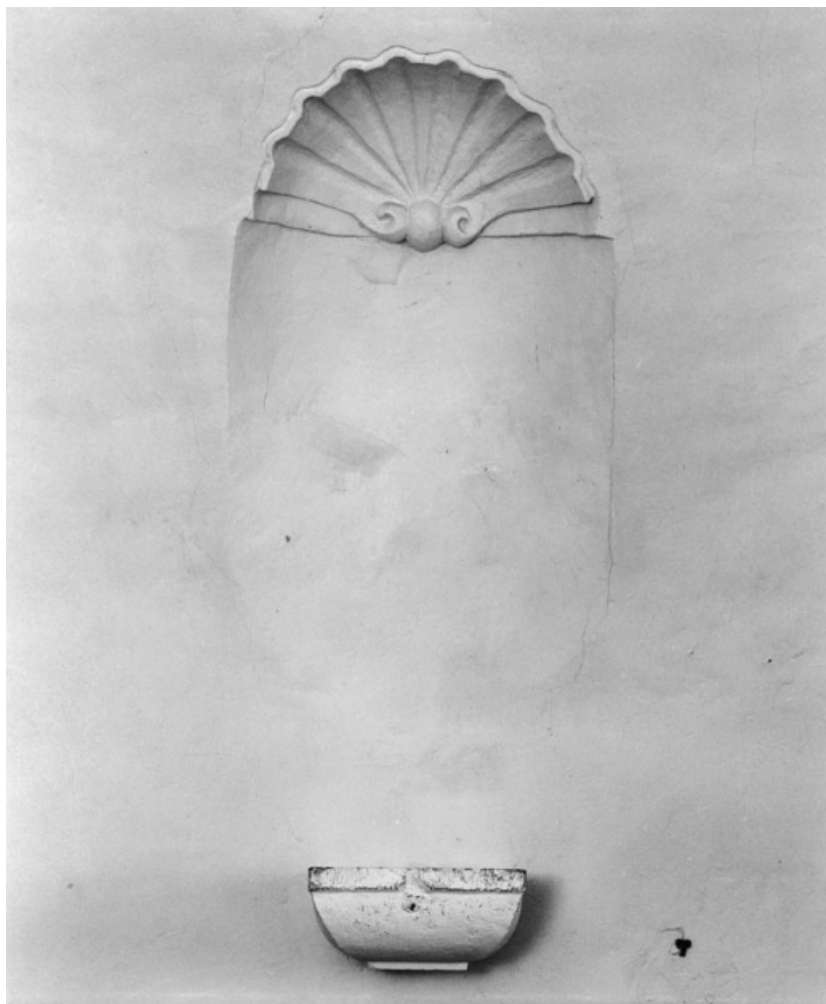
Niche droite du mur postérieur.