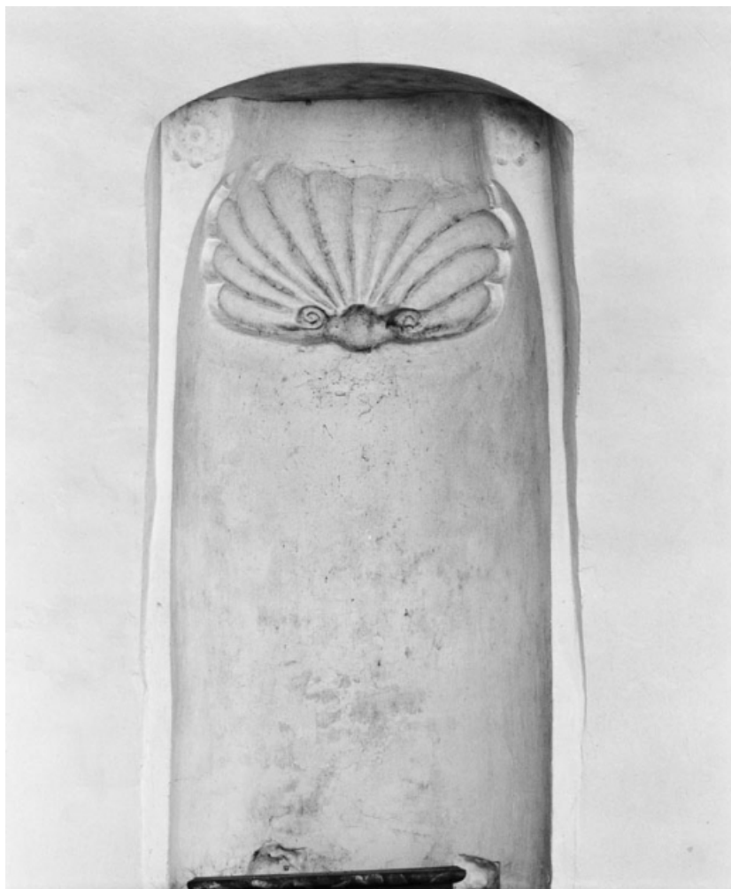
Niche centrale du mur postérieur.