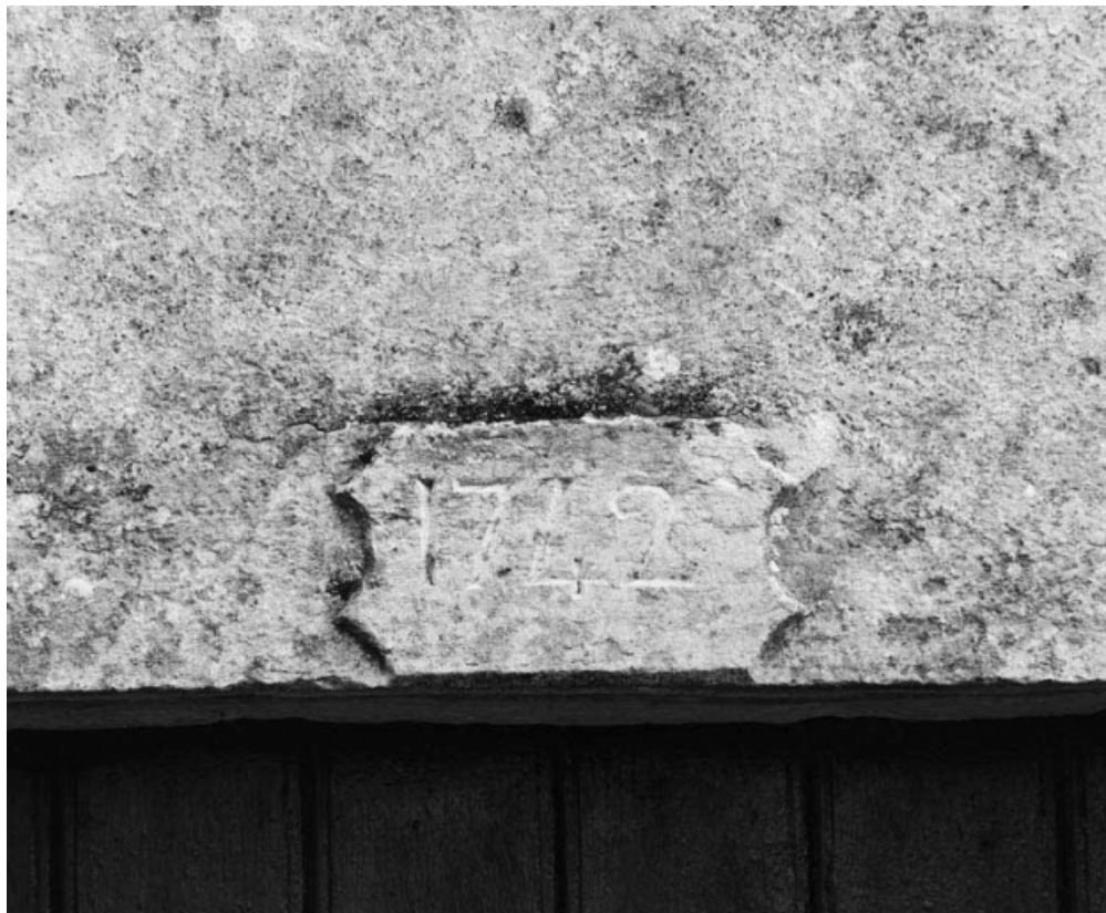
Détail du linteau de la porte d'entrée portant la date de 1742.