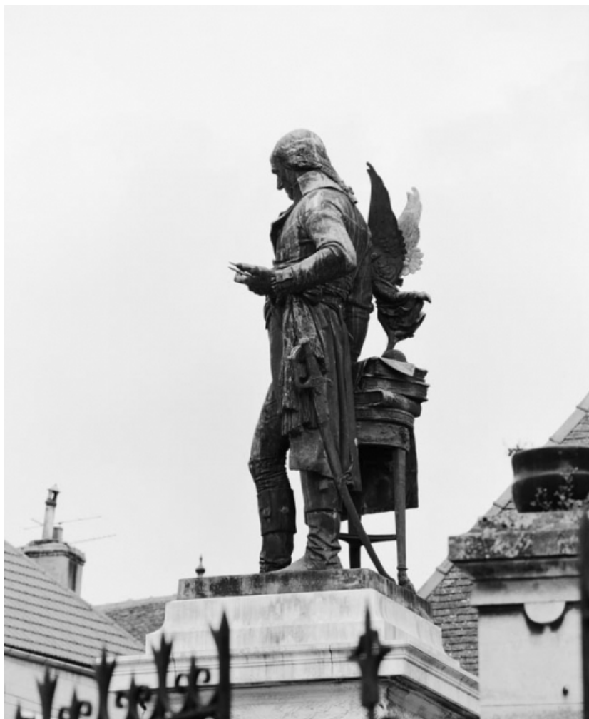
Vue de 3/4 dos de la statue.