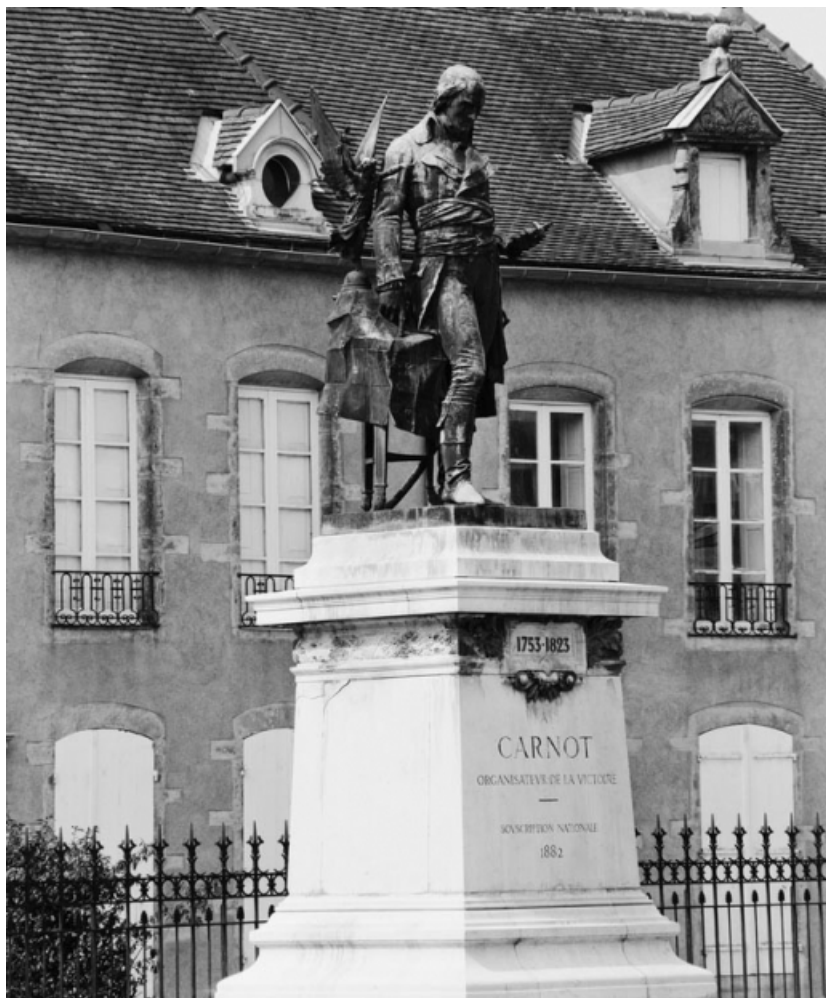
Vue générale. 21, Nolay Carnot