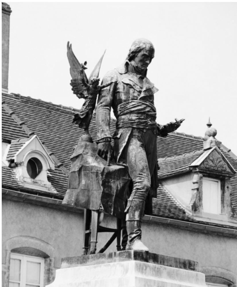
Vue de 3/4 droit. 21, Nolay Carnot