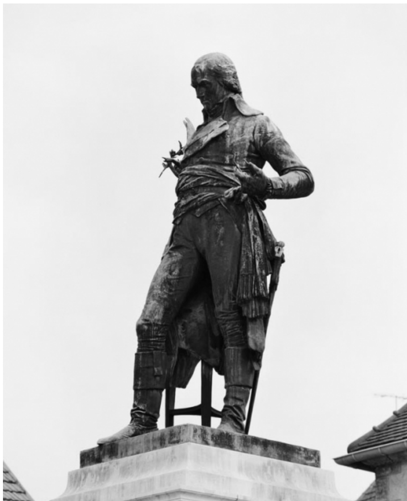
Vue de 3/4 gauche de la statue.