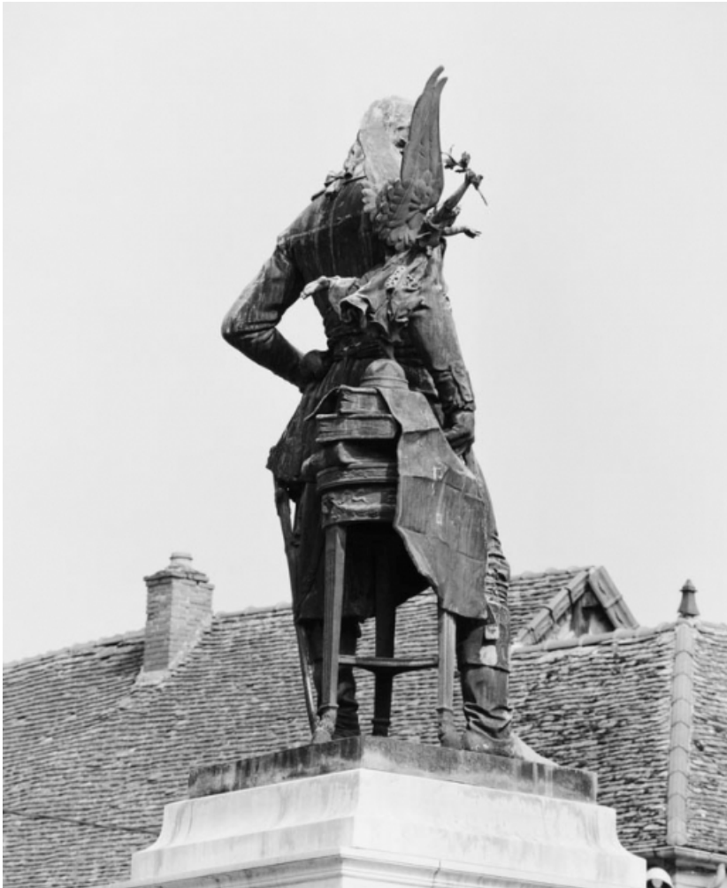
La statue : revers.