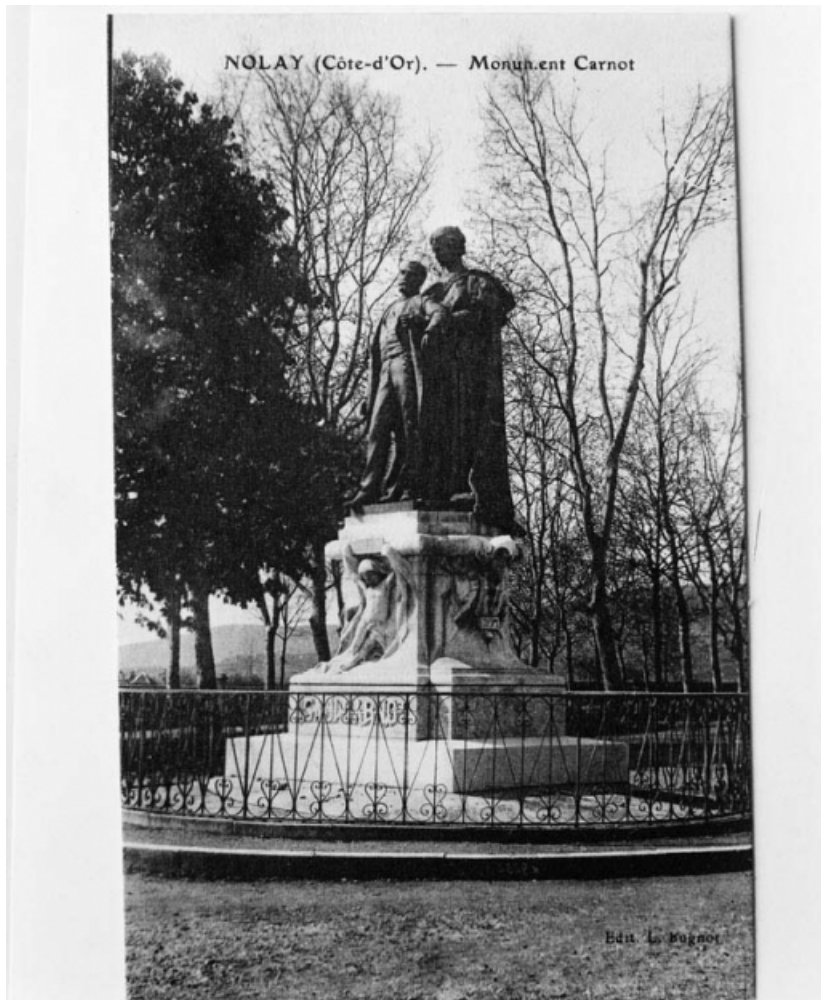
Monument Carnot", aujourd'hui détruit. Carte postale ancienne. 21, Nolay Hôtel de Ville