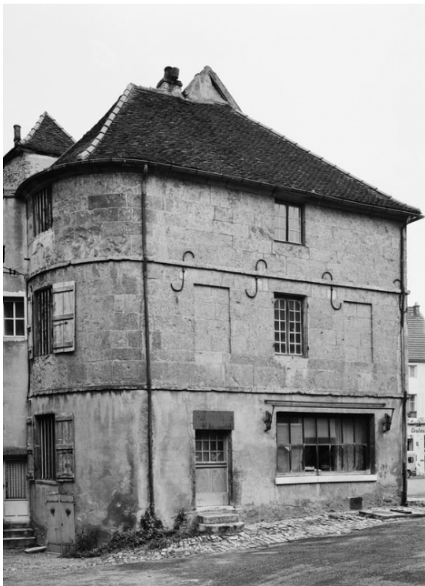
Façade principale, 3/4 gauche.