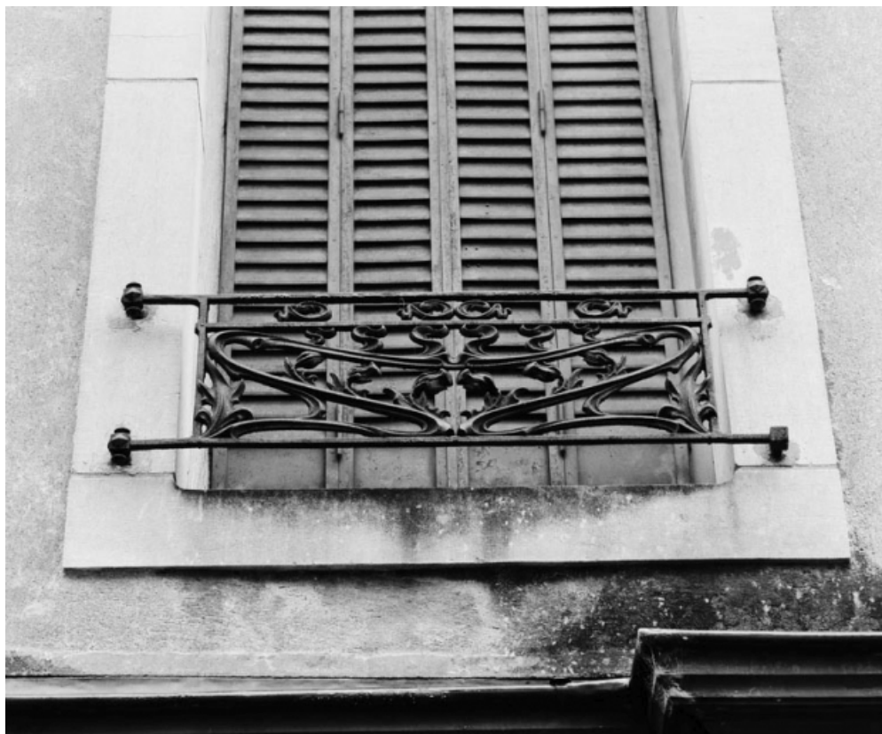
Détail du garde-corps d'une fenêtre.