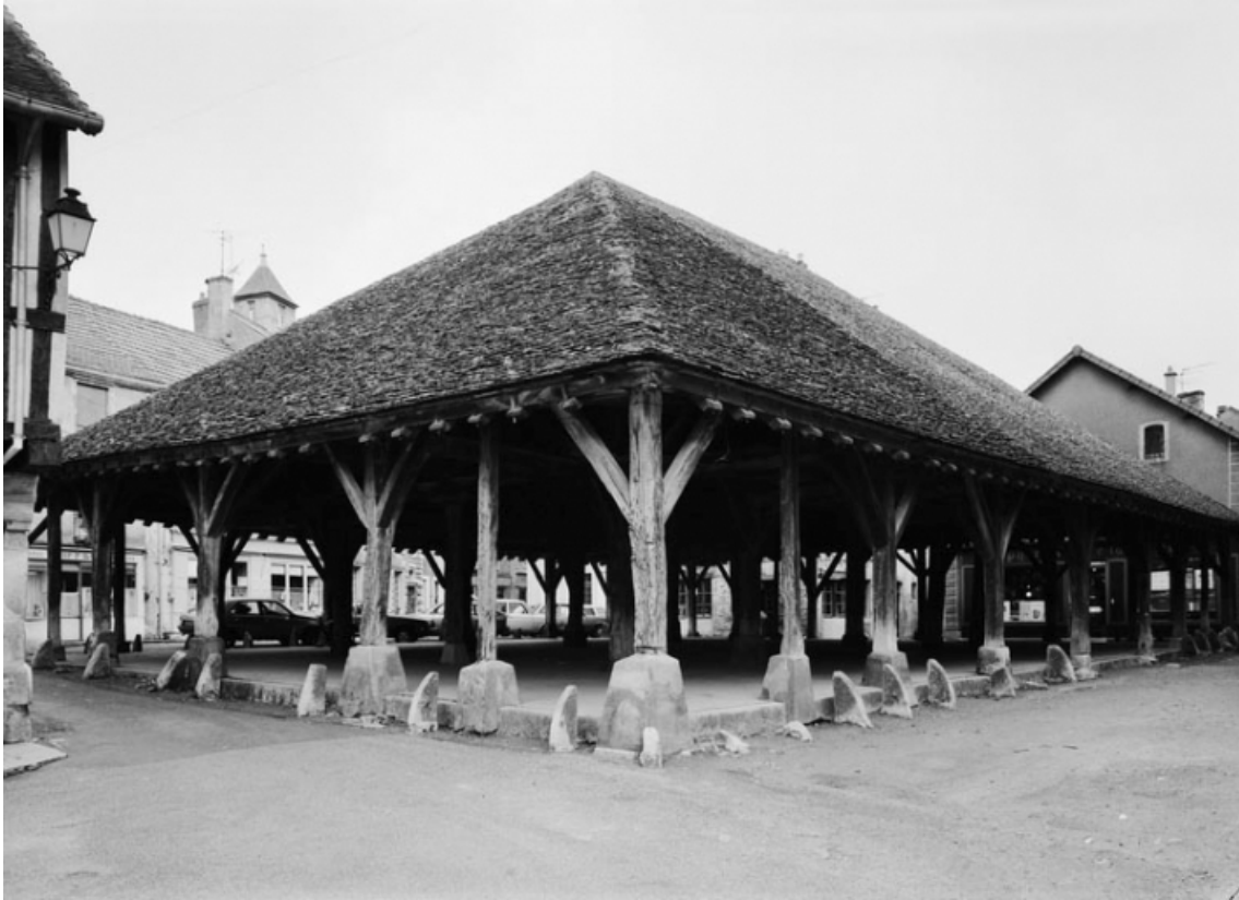
Elévations ouest et sud.