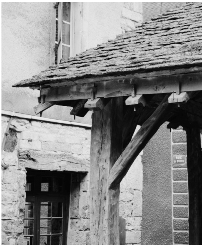
Détail : chevrons et sablière (angle nord-est). 21, Nolay Halles