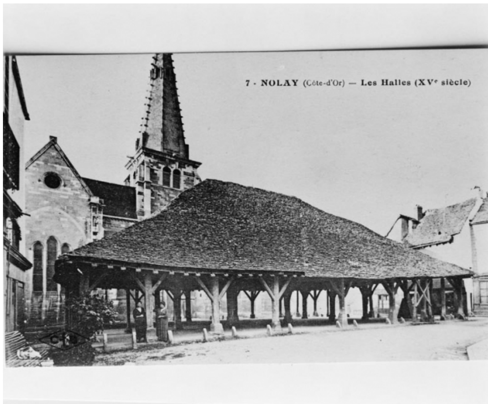
Les Halles de Nolay. Carte postale ancienne.