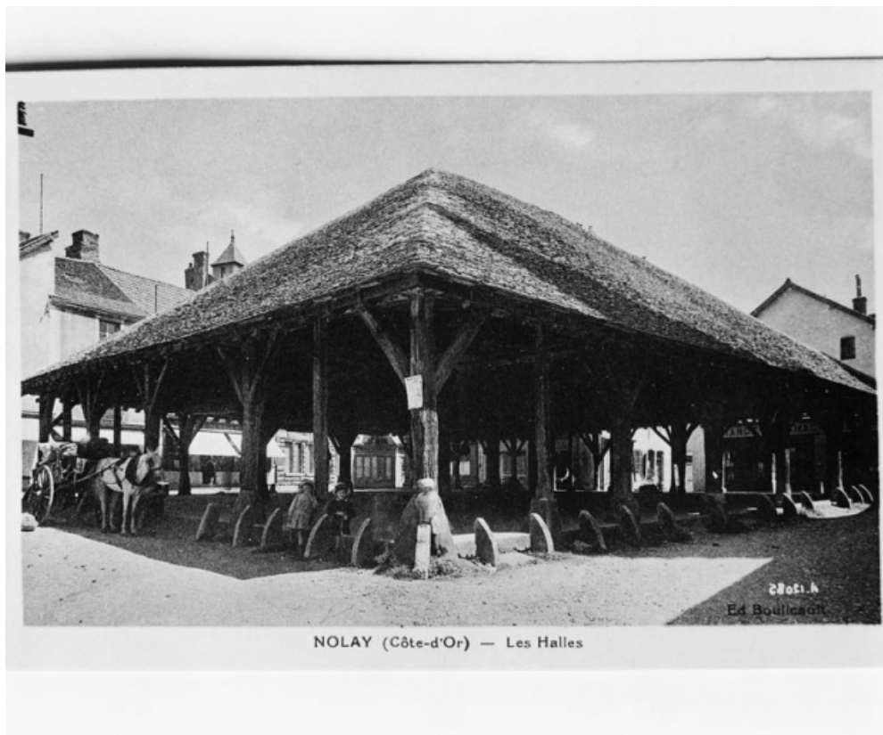
Les Halles de Nolay. Carte postale ancienne.