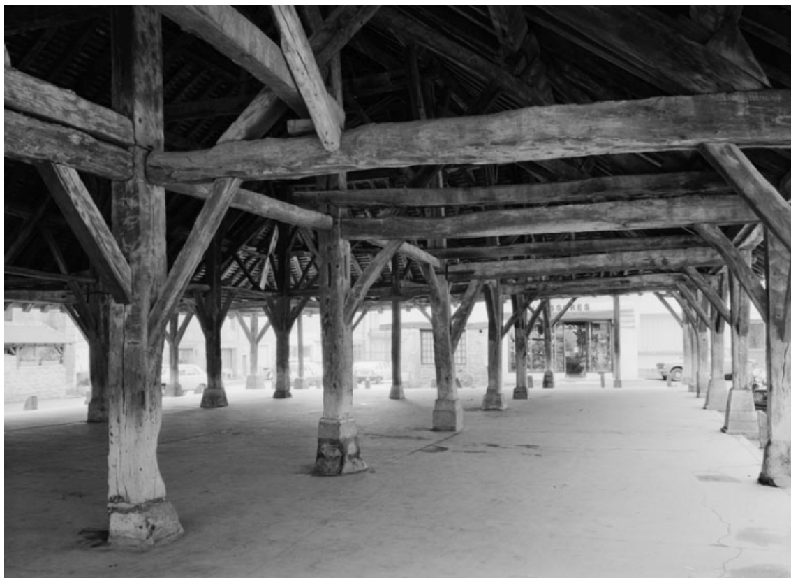
Vue intérieure (partie nord).