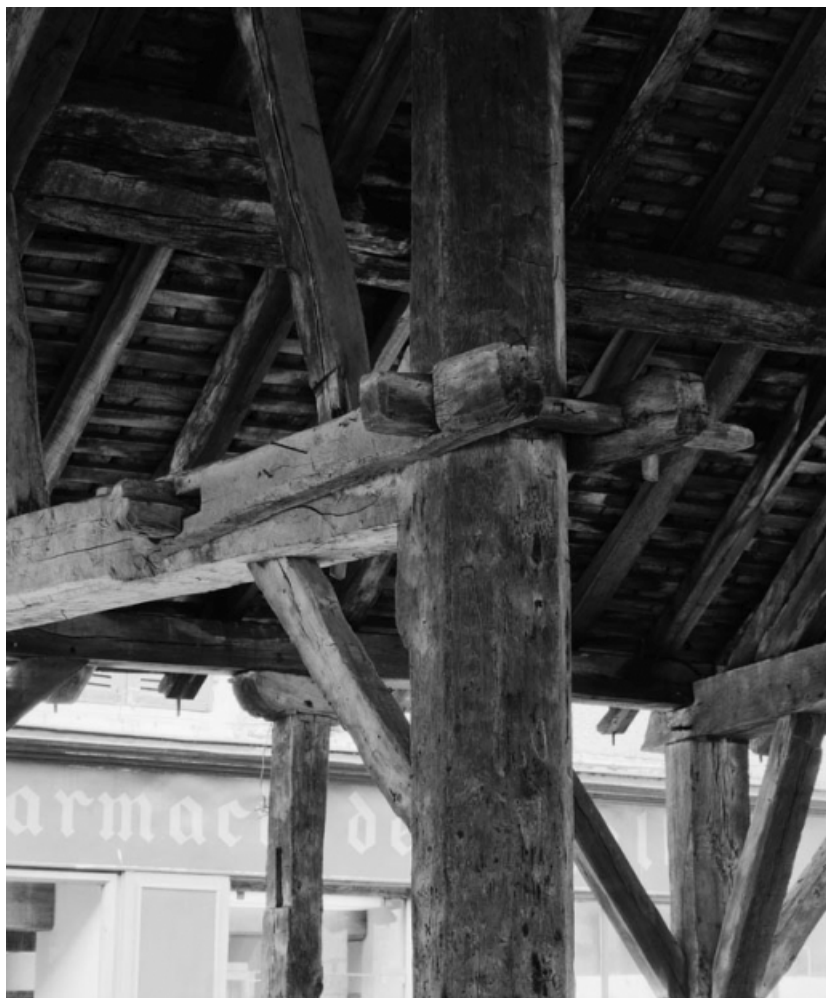
Détail d'assemblage : entrait de la demi-ferme centrale de la partie orientale. 21, Nolay Halles