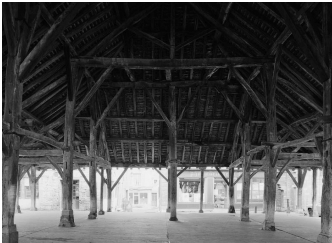
Vue intérieure transversale.