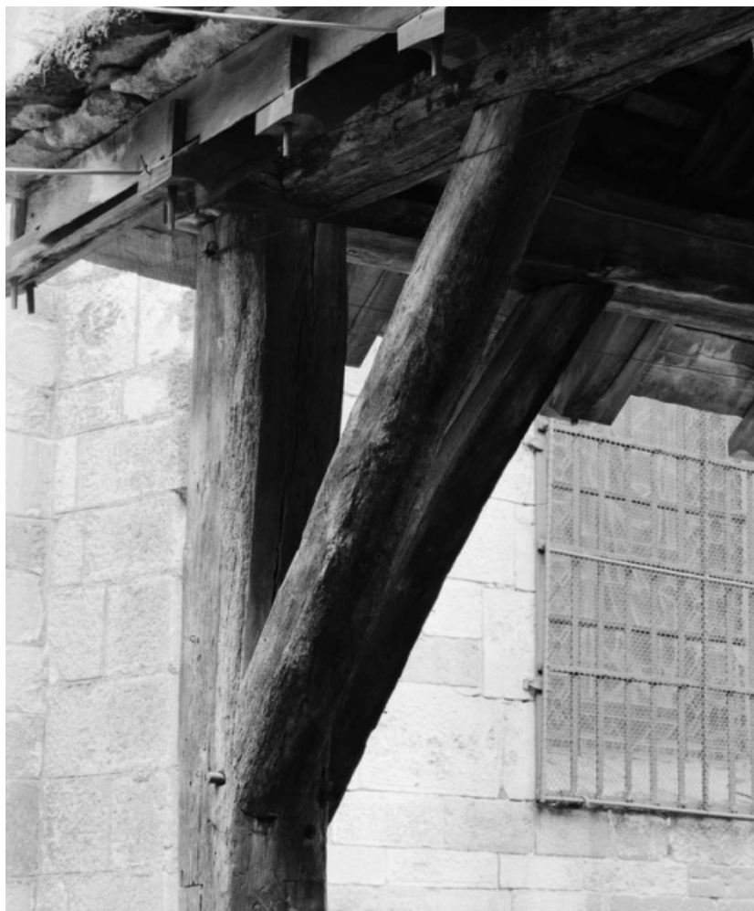
Détail : poteau cornier de l'angle sud-est.