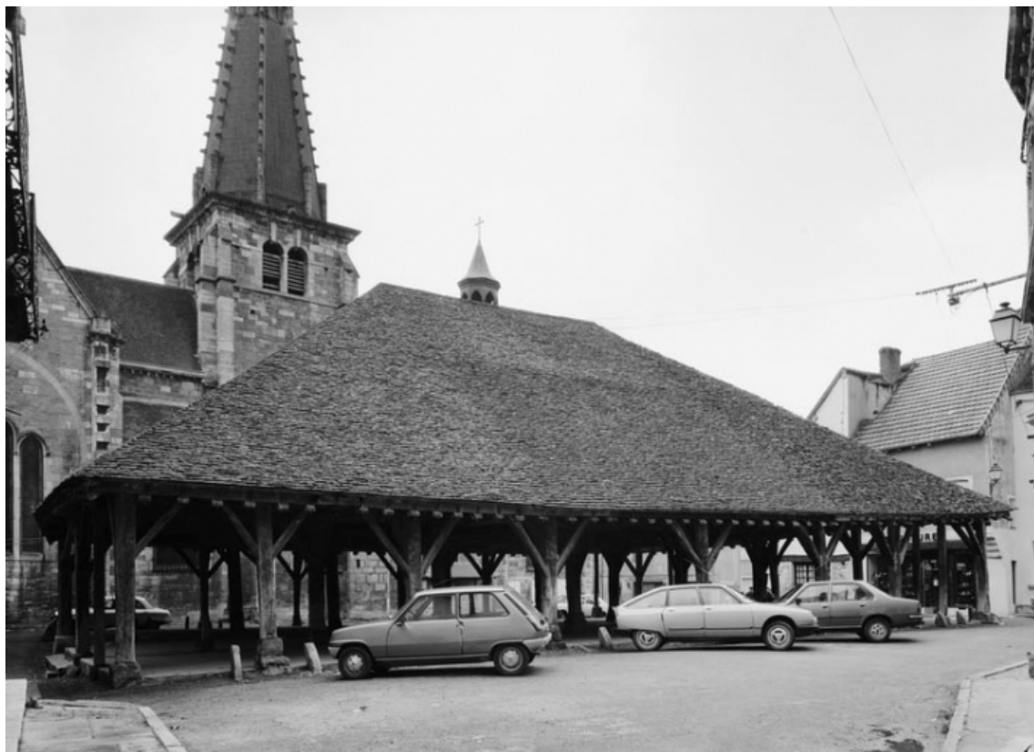
Élévation nord. 21, Nolay Halles