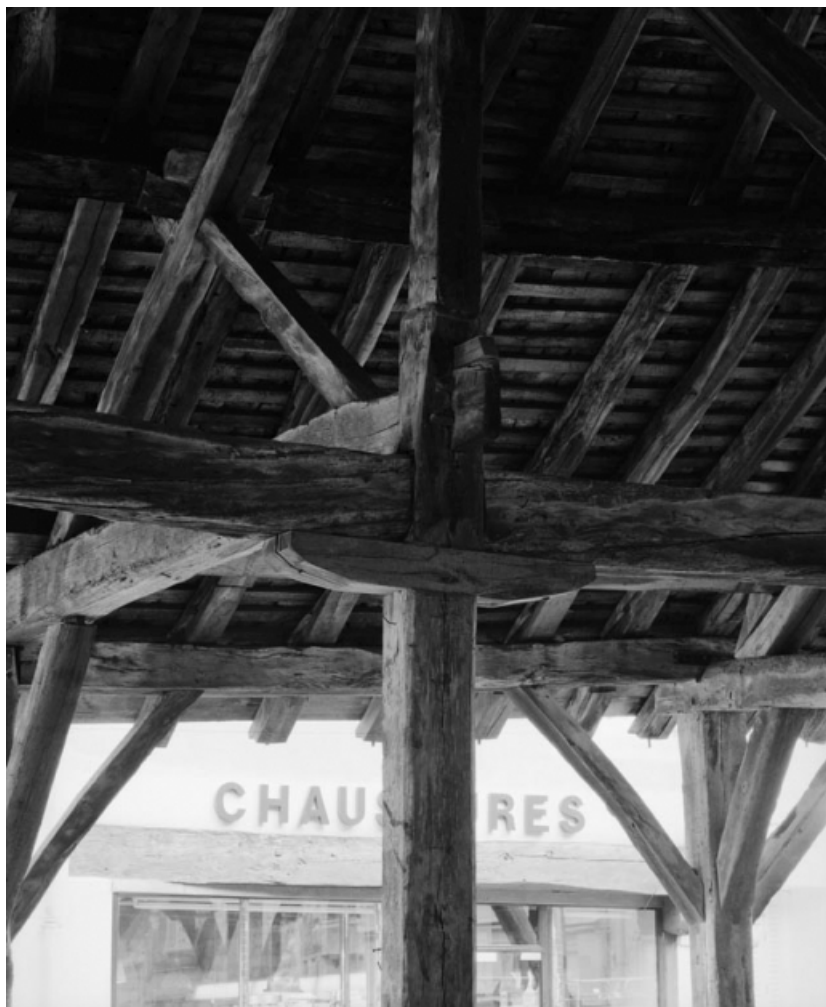
Détail d'assemblage : (demi-ferme centrale de la partie occidentale). 21, Nolay Halles