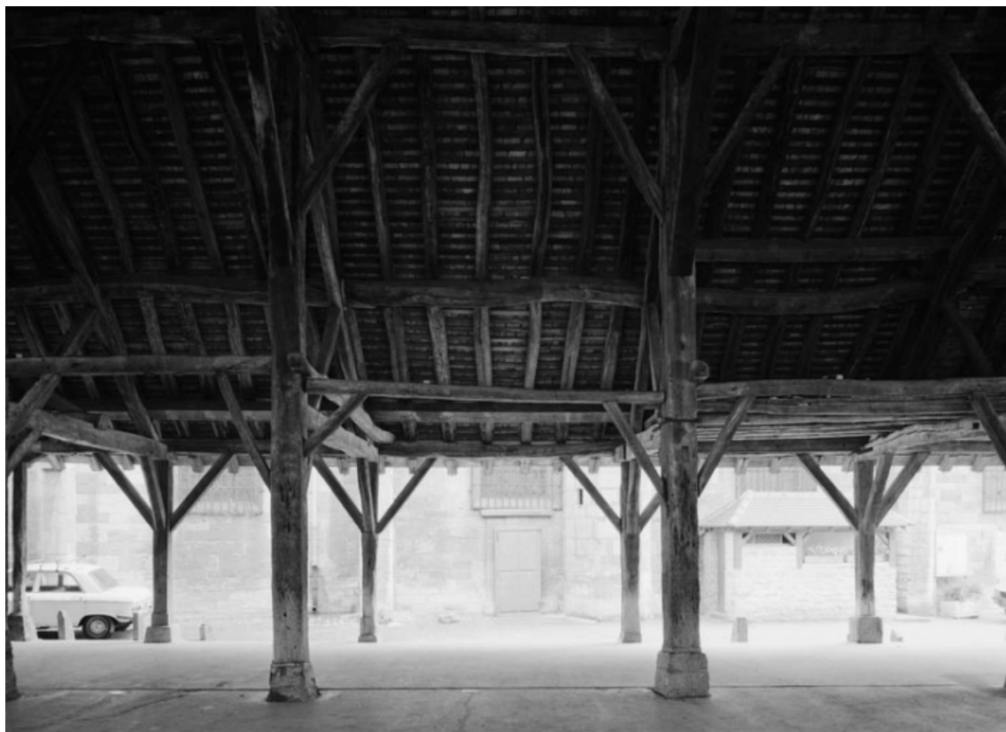
Vue intérieure longitudinale.