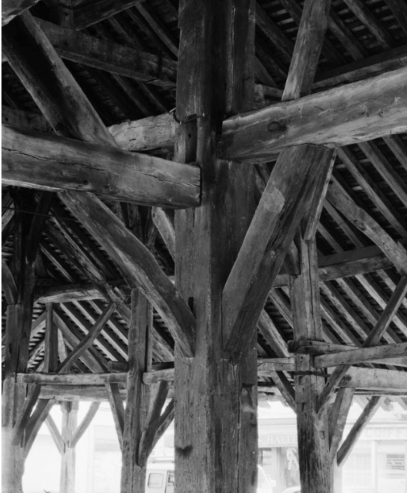
Détail d'un poteau central.