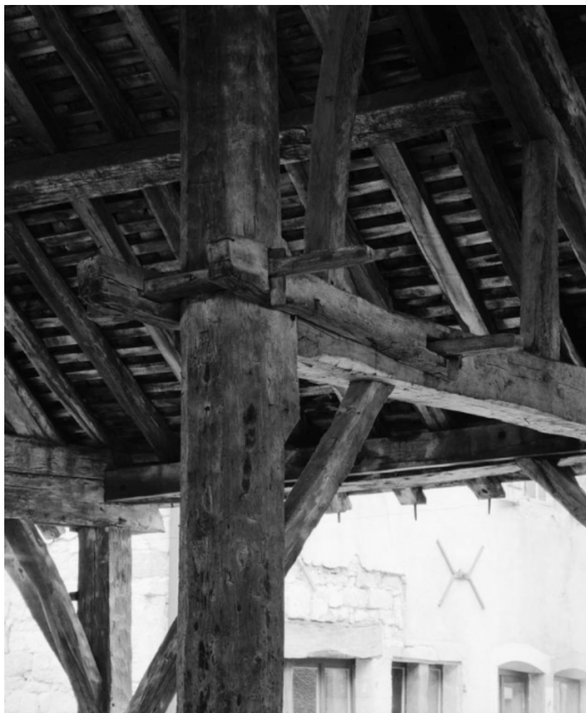
Détail d'assemblage : entrait de la demi-ferme centrale de la partie orientale. 21, Nolay Halles