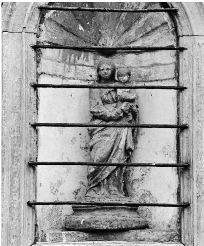
Détail de la statue représentant la Vierge à l'Enfant dans la niche de la maison sise parcelle 73 bis, section AC sur le cadastre de 1965.