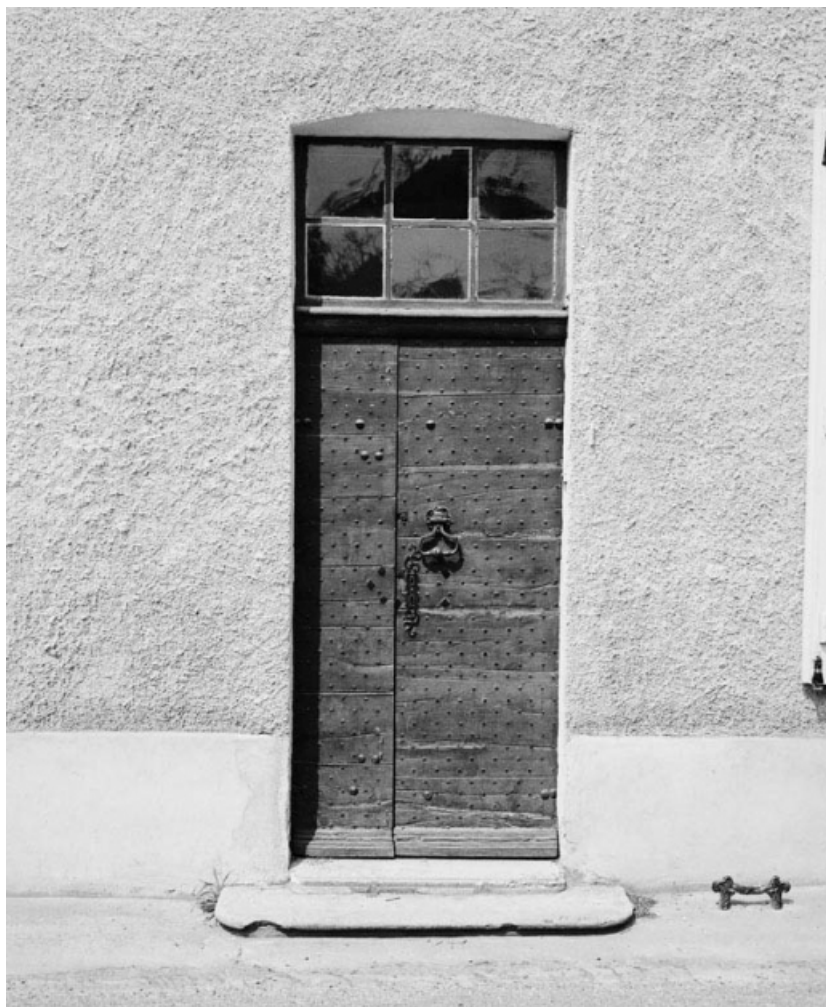
Détail de la porte de la maison sise parcelle 138, section AC sur le cadastre de 1965. 21, Nolay