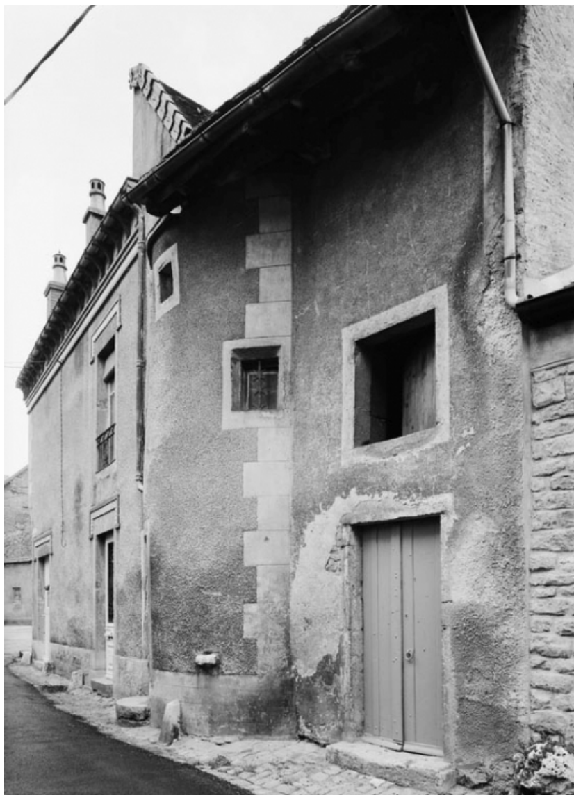
Vue de la maison sise parcelle 425, section AB sur le cadastre de 1965. 21, Nolay