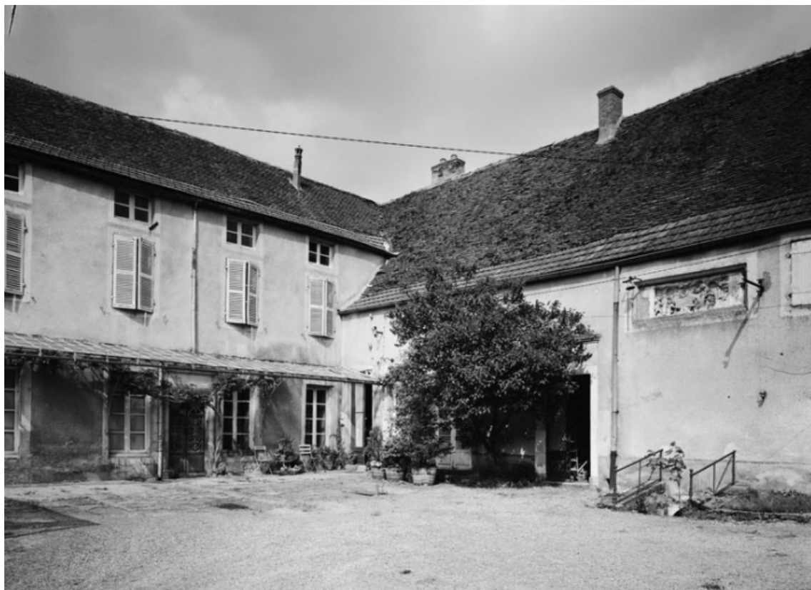
Vue d'ensemble de la maison sise parcelle 428 (a) section AC sur le cadastre de 1965. 21, Nolay