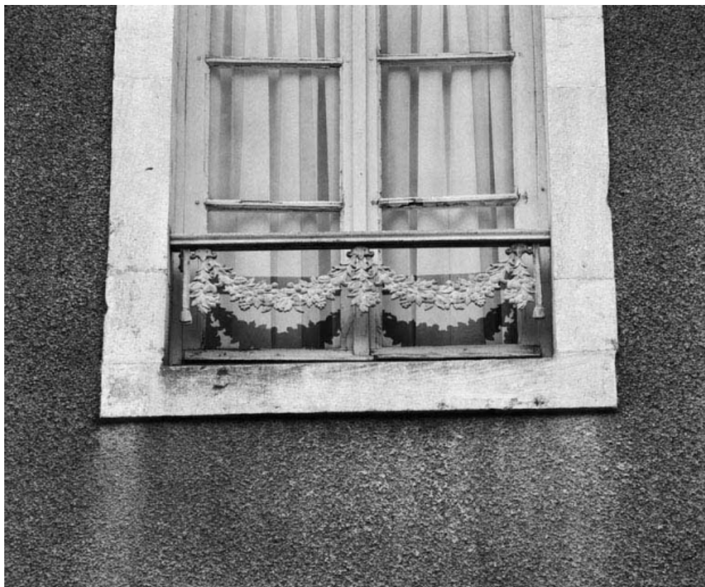
Garde-corps d'une fenêtre de la maison sise parcelle 367, section AB sur le cadastre de 1965. 21, Nolay