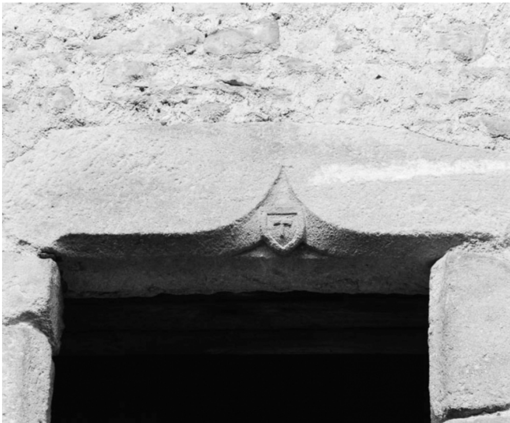
Détail du linteau de la fenêtre gauche, ferme sise parcelle 87, section AC sur le cadastre de 1965. 21, Nolay