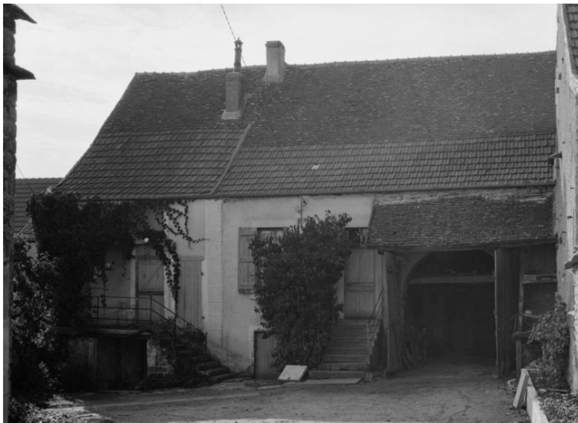
Vue d'ensemble de la maison sise parcelle 688, section 174 A4 sur le cadastre de 1947. 21, Nolay