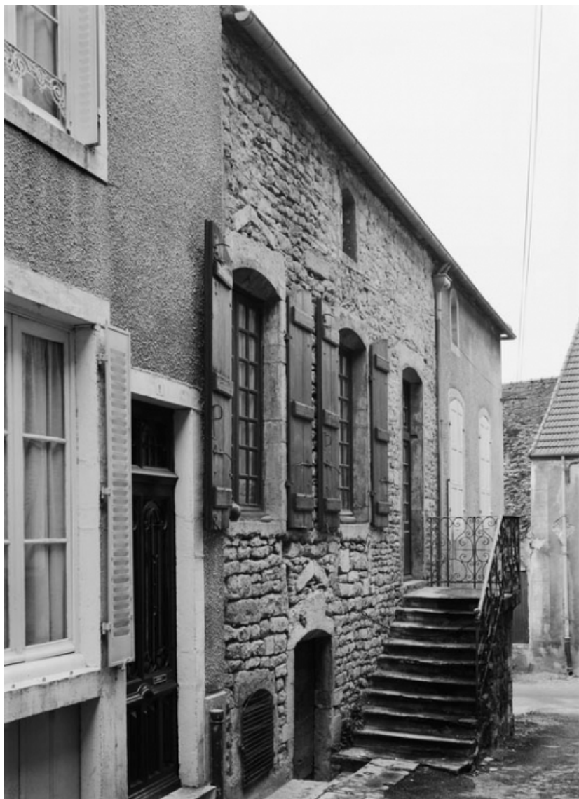
Vue de la maison sise parcelle 415, section AB sur le cadastre de 1965. 21, Nolay