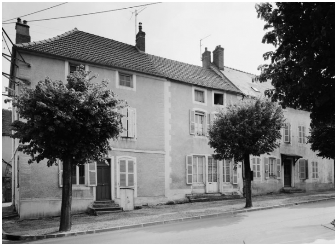
Vue d'ensemble des maisons sises parcelles 322, 316 et 315 section AC sur le cadastre de 1965. 21, Nolay