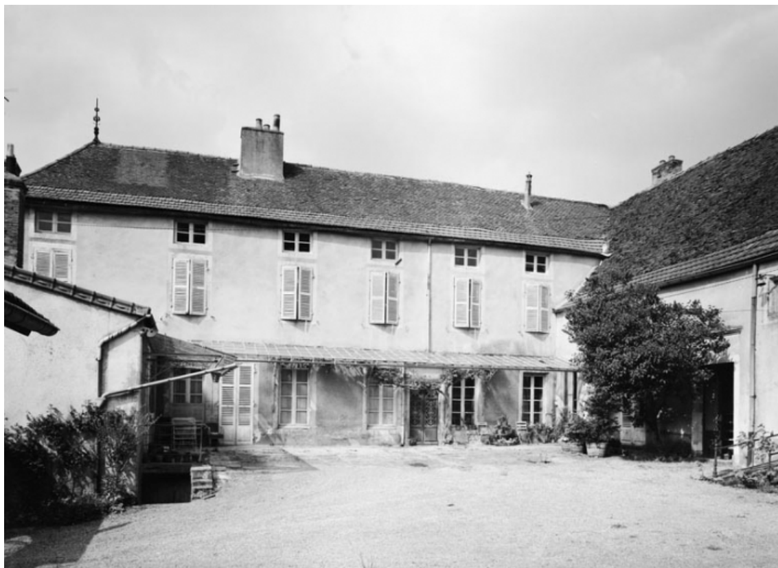
Vue d'ensemble de la maison sise parcelle 428 (a) section AC sur le cadastre de 1965. 21, Nolay