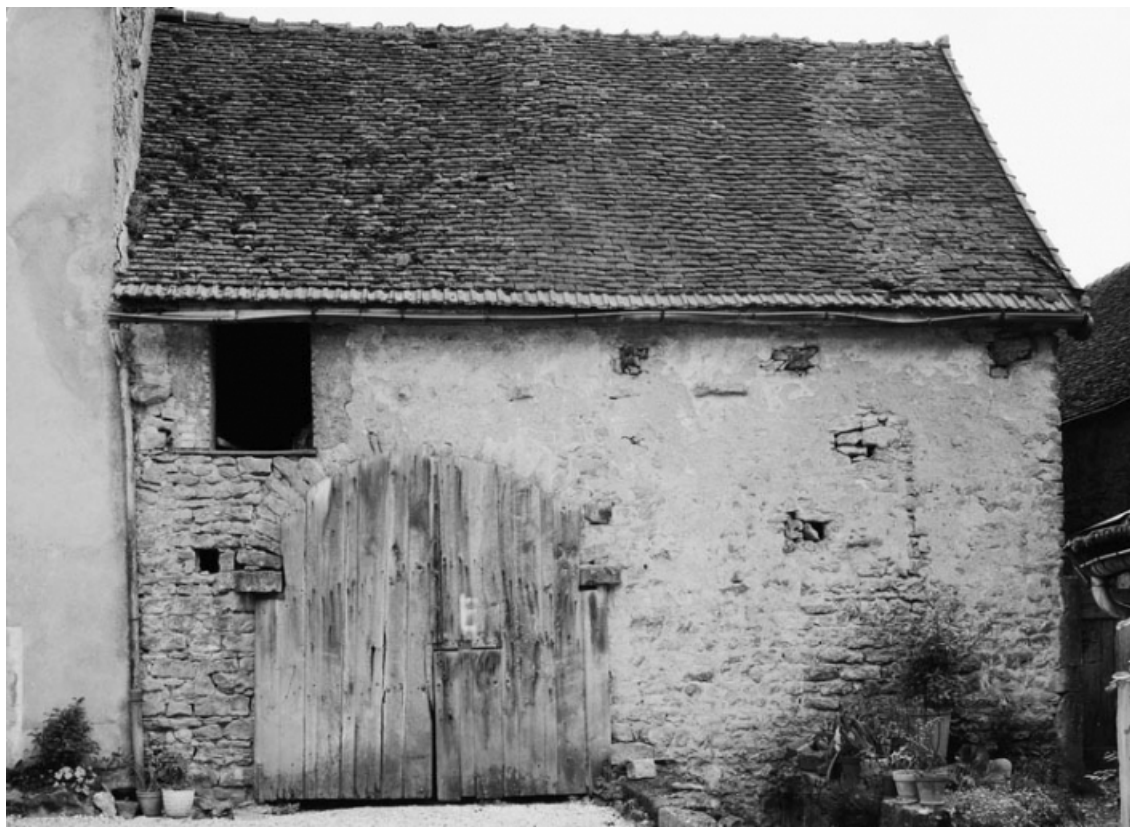
Vue des dépendances, sises parcelles 47, section AC sur le cadastre de 1965. 21, Nolay