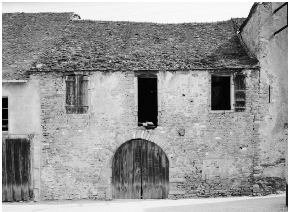
Dépendances, parcelle 99, section AC sur le cadastre de 1965. 21, Nolay