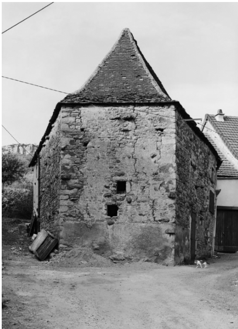
Vue de l'étable de la ferme sise parcelle 528, section 174 A4 sur le cadastre de 1947. 21, Nolay