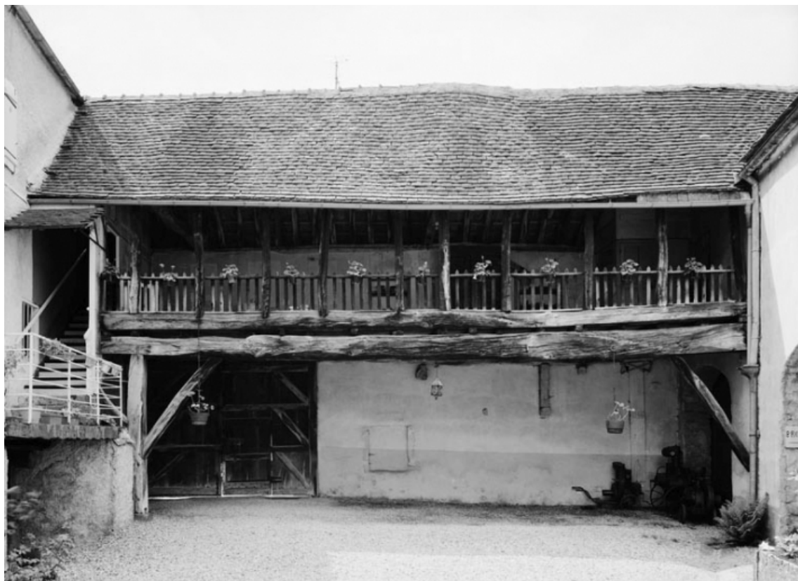
Galerie à l'intérieur de la cour de la maison sise parcelle 138, section AC sur le cadastre de 1965. 21, Nolay