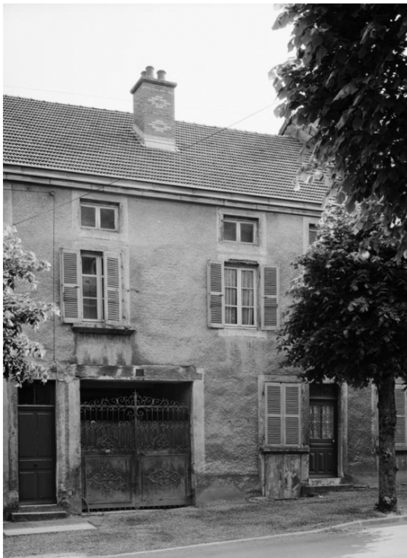
Vue d'ensemble de la maison sise parcelle 304, section AC sur le cadastre de 1965. 21, Nolay