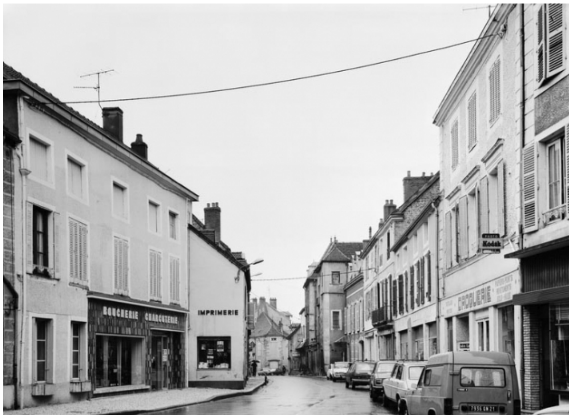
Rue de la République.