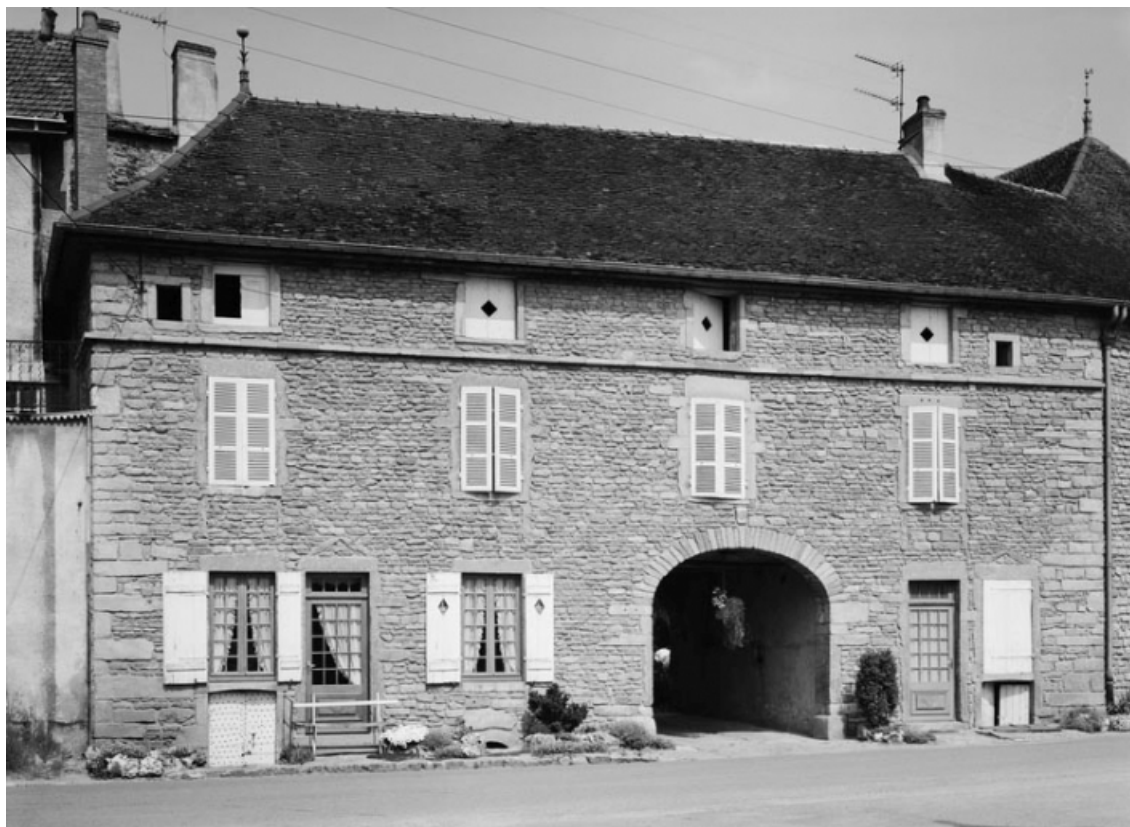
Vue de la maison sise parcelle 298, section AB sur le cadastre de 1965. 21, Nolay