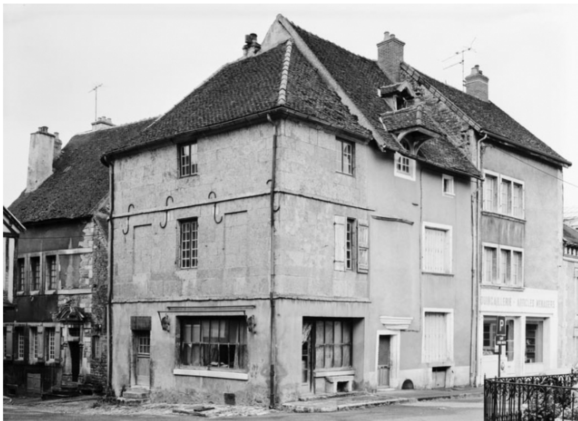
Vue des maisons sises parcelles 426, 427 et 428, section AB sur le cadastre de 1965. 21, Nolay