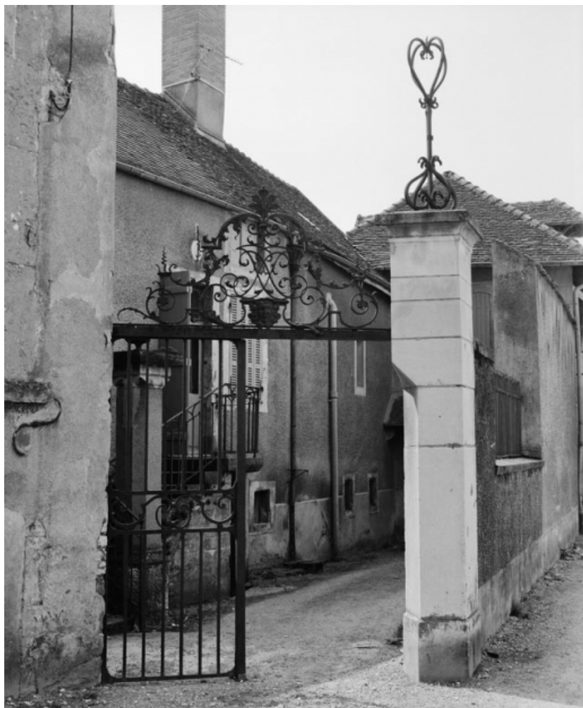
Portail de la maison sise parcelle 147, section AC sur le cadastre de 1965. 21, Nolay