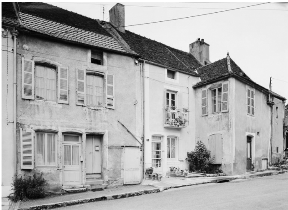
Vue d'ensemble des maisons sises parcelles 329, 330 et 331 section AC sur le cadastre de 1965. 21, Nolay