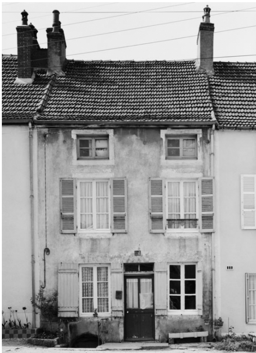
Vue d'ensemble de la maison sise parcelle 417 section AC sur le cadastre de 1965. 21, Nolay