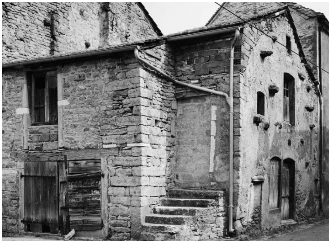
Vue de la maison sise parcelle 81, section AC sur le cadastre de 1965. 21, Nolay