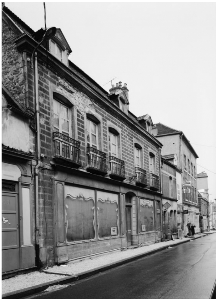
Vue de la maison sise parcelle 444, section AB sur le cadastre de 1965. 21, Nolay