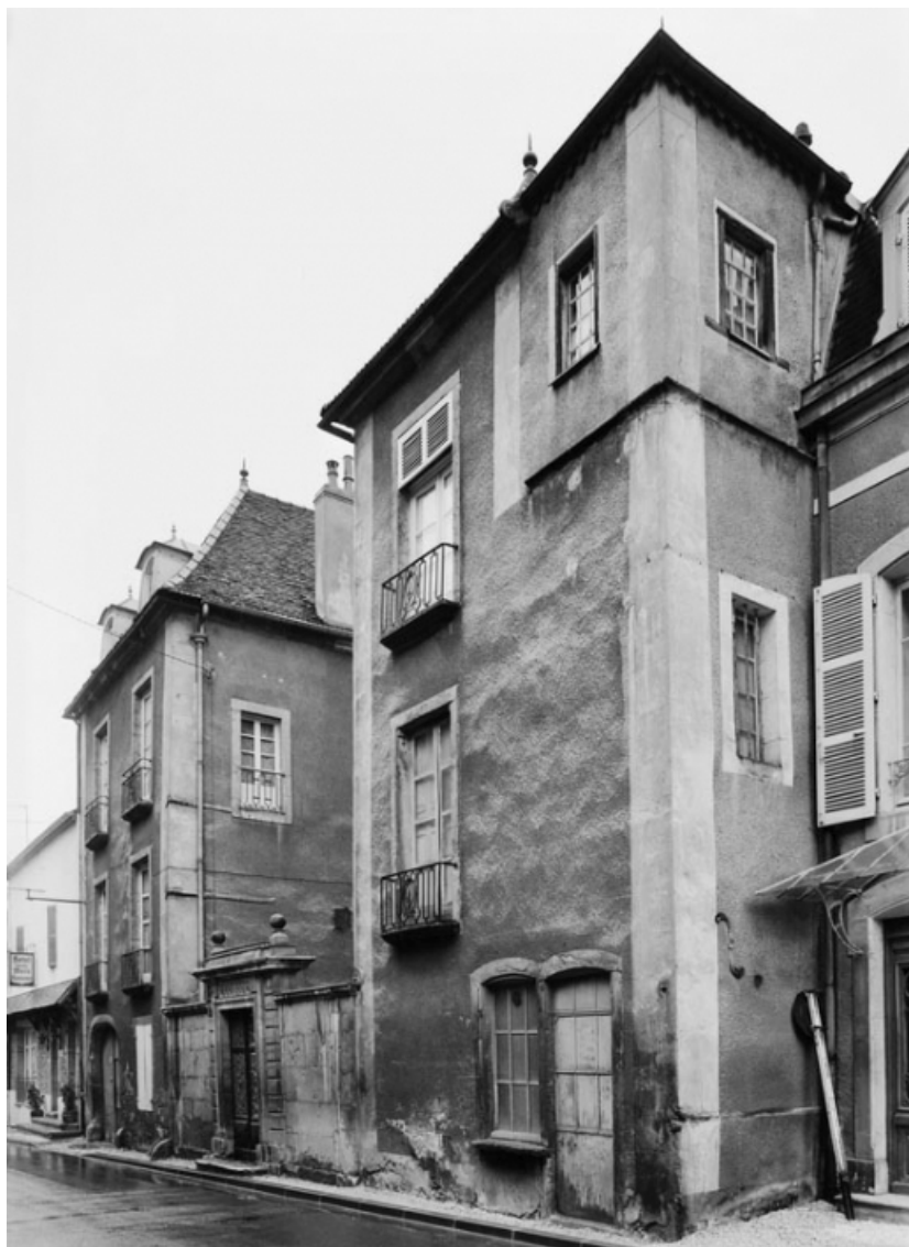
Vue de trois quarts de la maison sise parcelle 153, section AB sur le cadastre de 1965. 21, Nolay