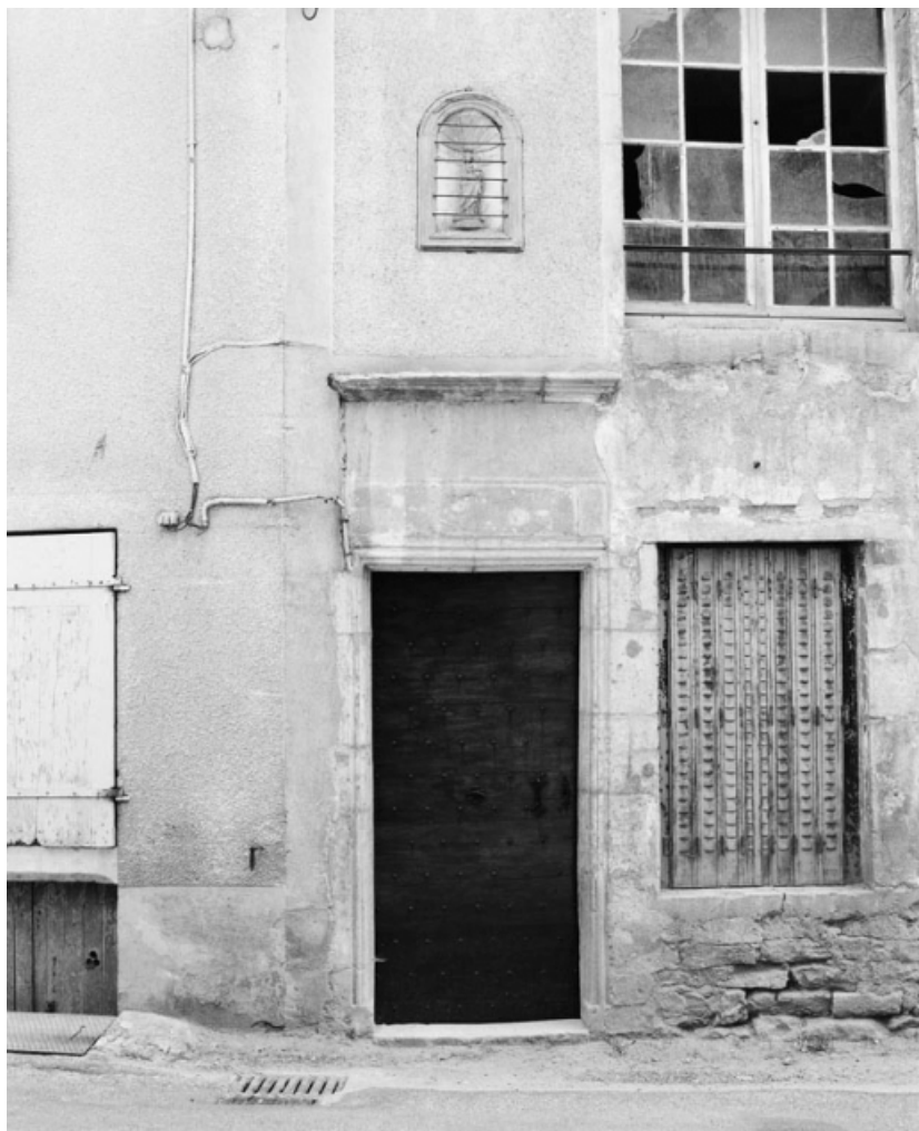
Porte de la maison sise parcelle 73 bis, section AC sur le cadastre de 1965. 21, Nolay