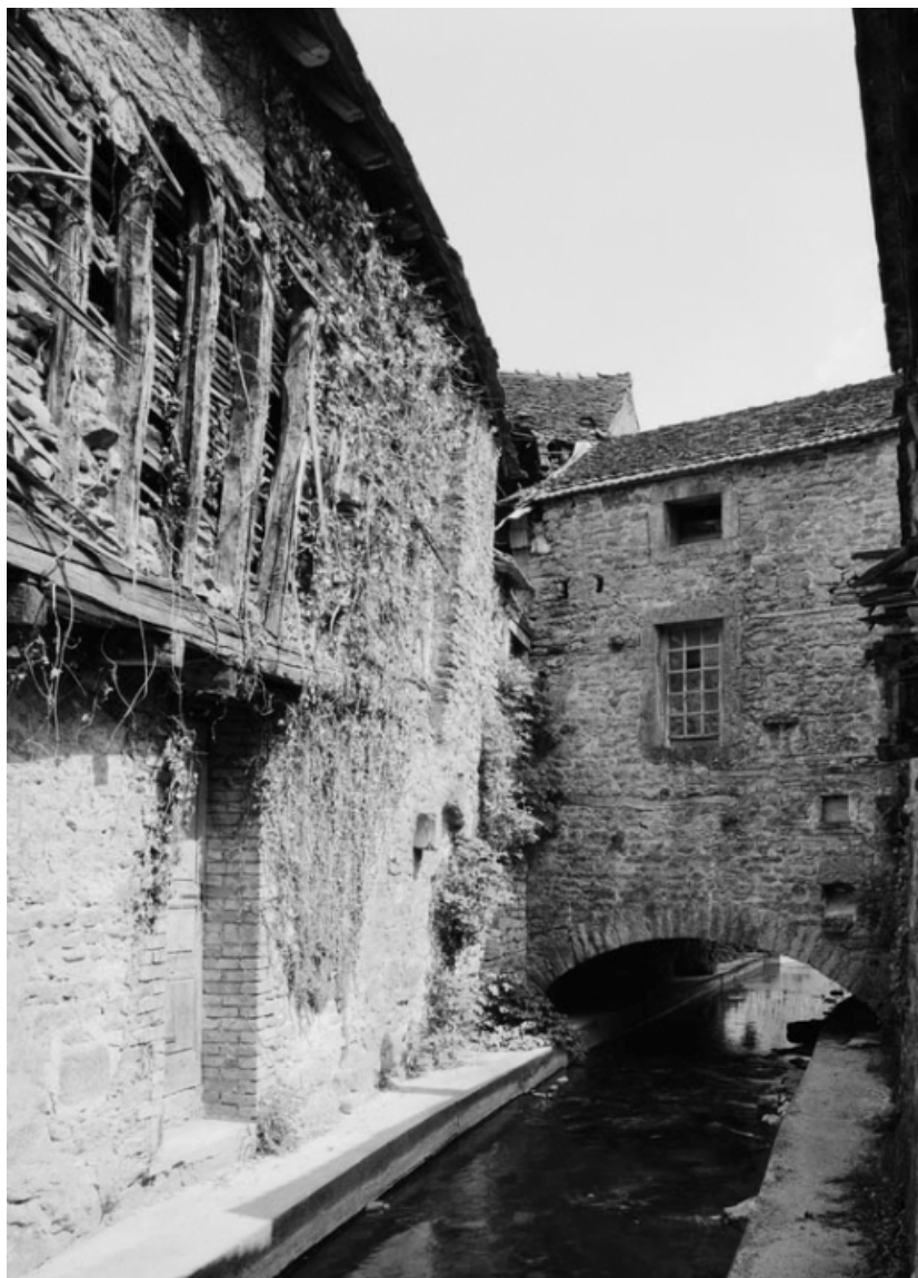
Vue de la maison sise parcelle 73 ter, section AC sur le cadastre de 1965. 21, Nolay