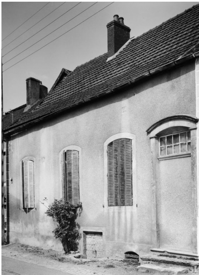
Vue de la maison sise parcelle 343b, section AB sur le cadastre de 1965. 21, Nolay