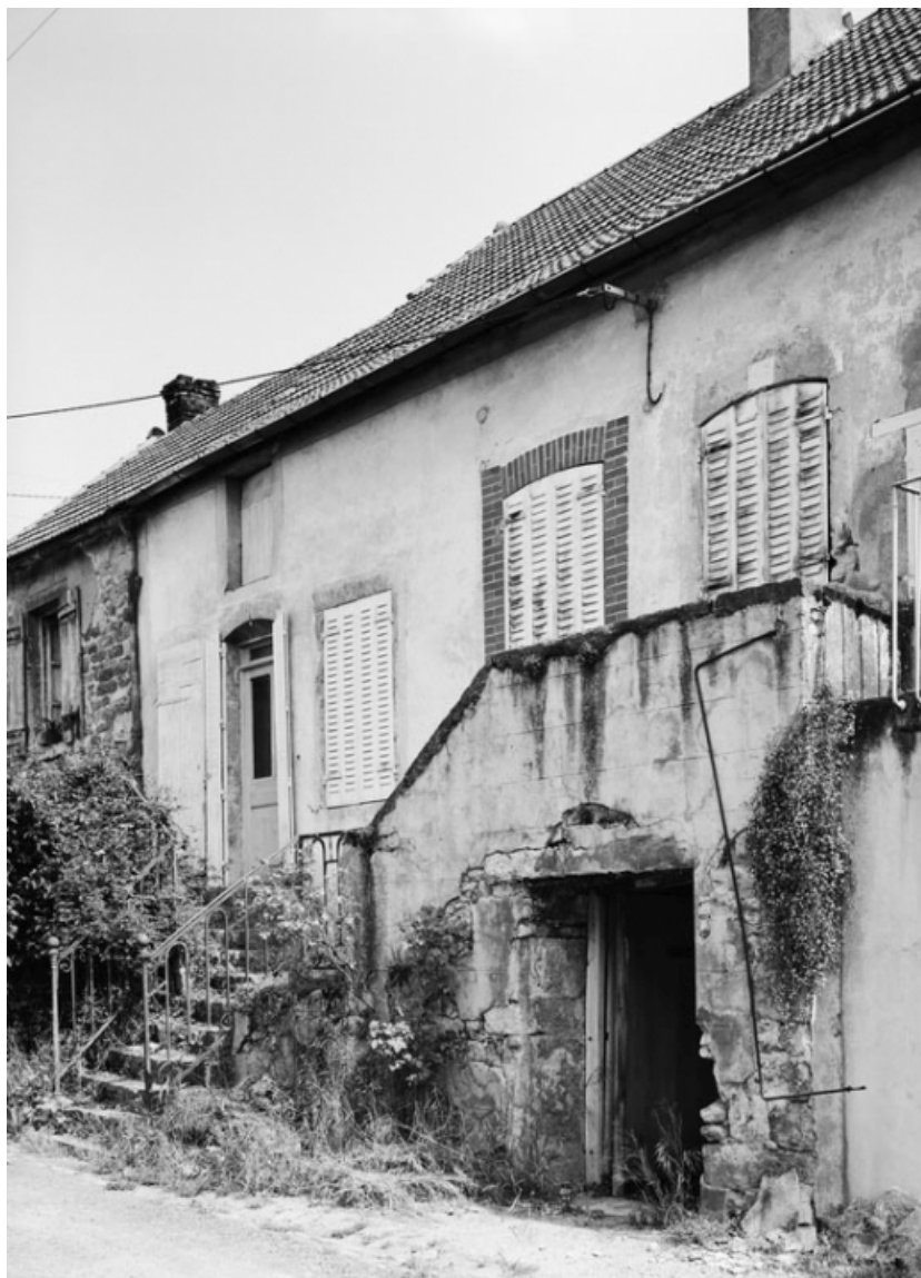
Vue de la maison sise parcelle 334, section AB sur le cadastre de 1965. 21, Nolay