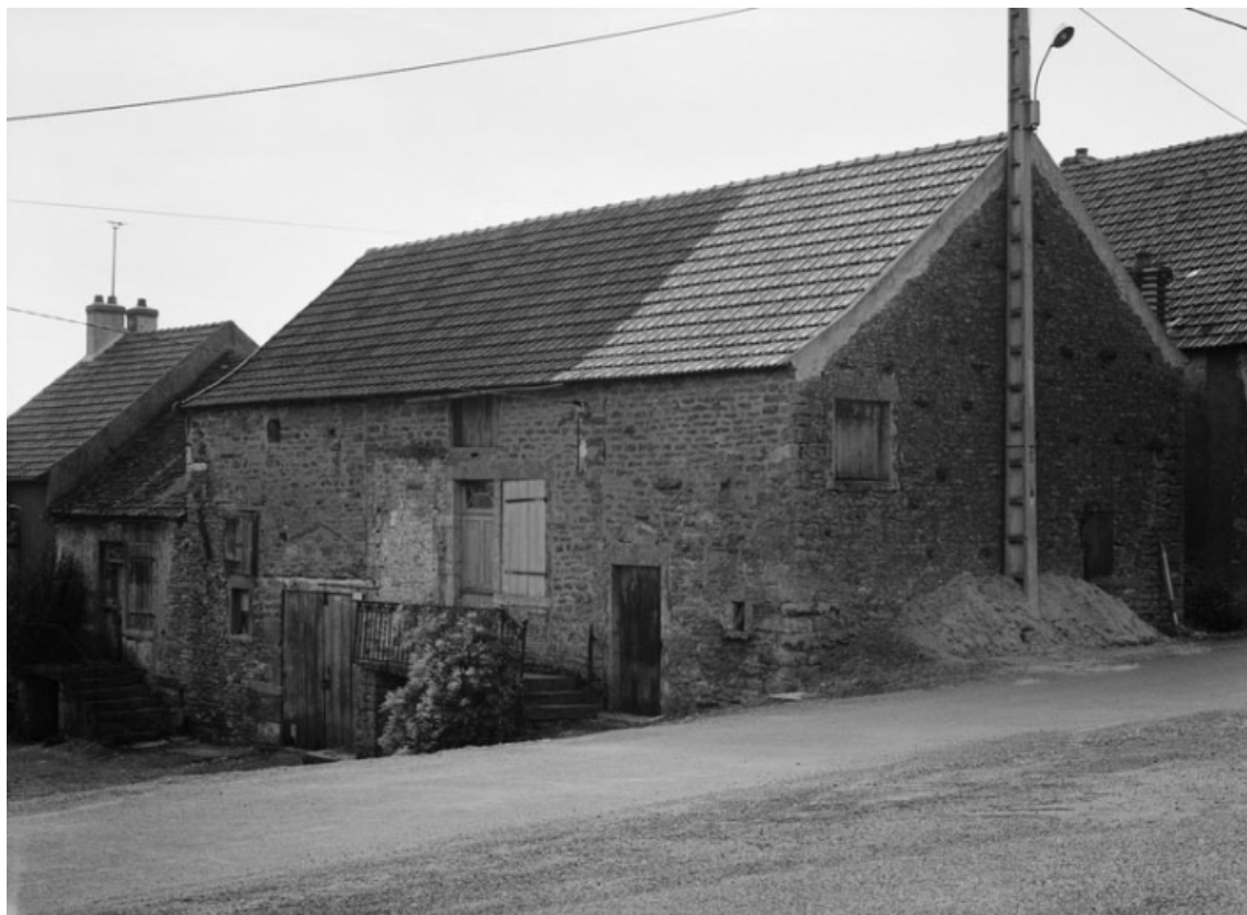
Vue d'ensemble de la maison sise parcelle 987, section 174 A5 sur le cadastre de 1947. 21, Nolay