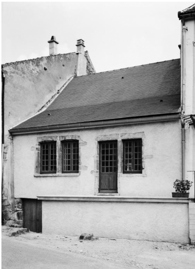
Vue de la maison sise parcelle 234a, section AB sur le cadastre de 1965. 21, Nolay