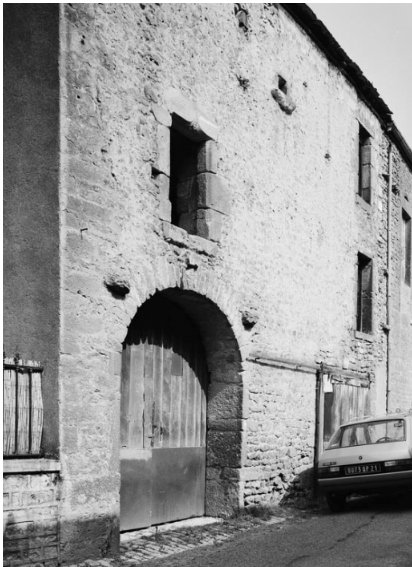
Vue de la ferme sise parcelle 87, section AC sur le cadastre de 1965. 21, Nolay