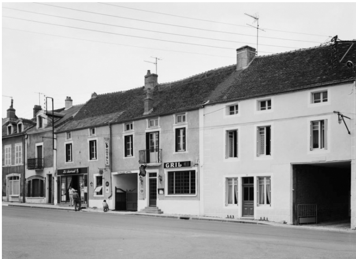
Vue d'ensemble des maisons sises parcelles 47 à 55, section AB sur le cadastre de 1965. 21, Nolay