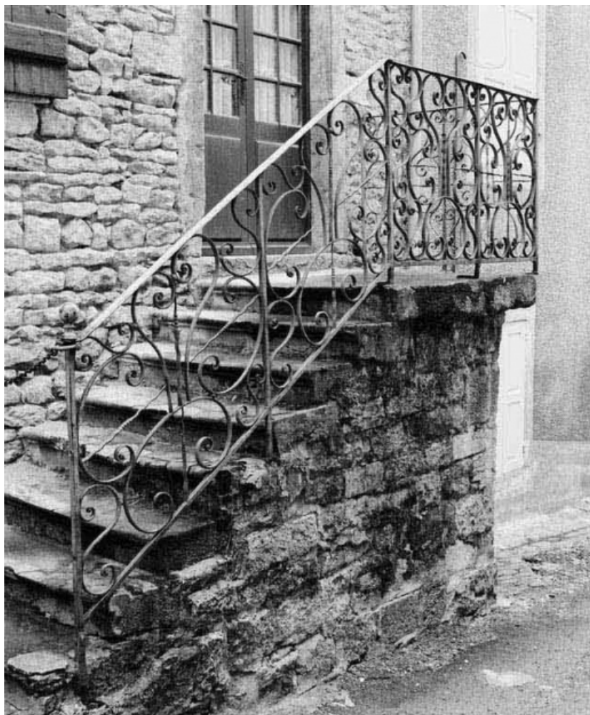
Détail de la grille de la maison sise parcelle 415, section AB sur le cadastre de 1965. 21, Nolay