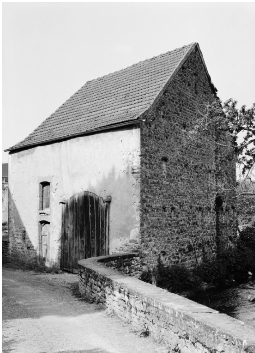
Vue d'ensemble de la ferme sise parcelle 233, section AC sur le cadastre de 1965. 21, Nolay