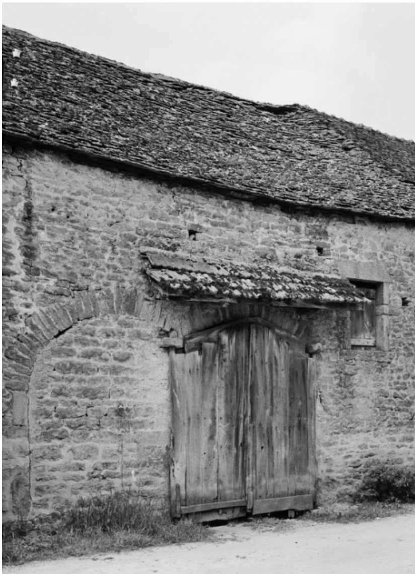
Vue de la grange sise parcelle 274, section AB sur le cadastre de 1965. 21, Nolay