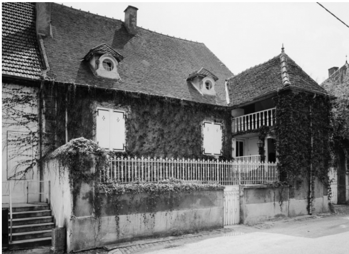
Vue de la maison sise parcelle 39, section AC sur le cadastre de 1965. 21, Nolay