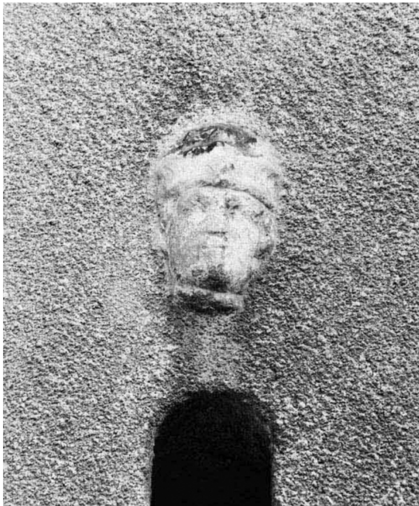
Détail d'une tête sculptée, maison sise parcelle 428 (a) section AC sur le cadastre de 1965. 21, Nolay