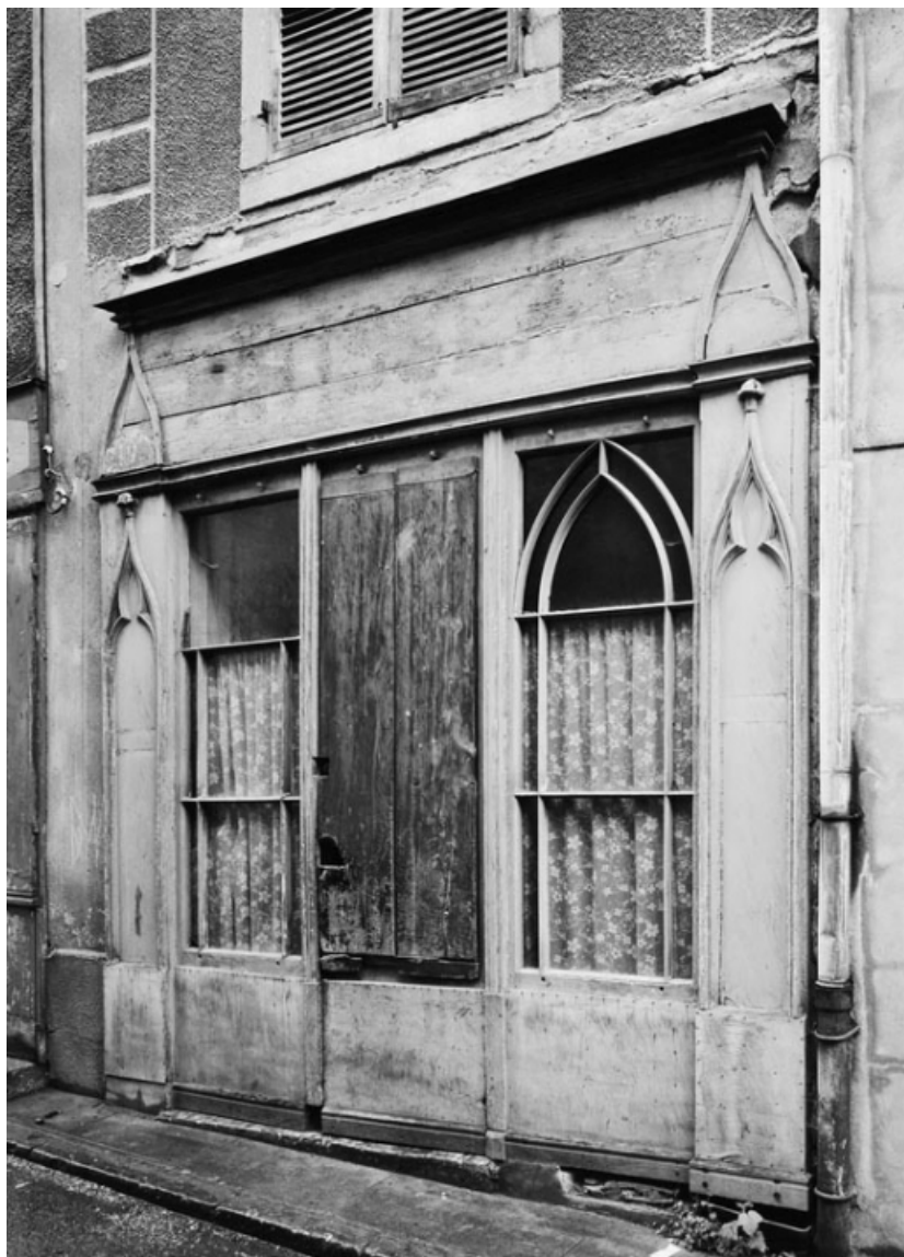
Vue de la façade du magasin, parcelle 433, section AB sur le cadastre de 1965. 21, Nolay