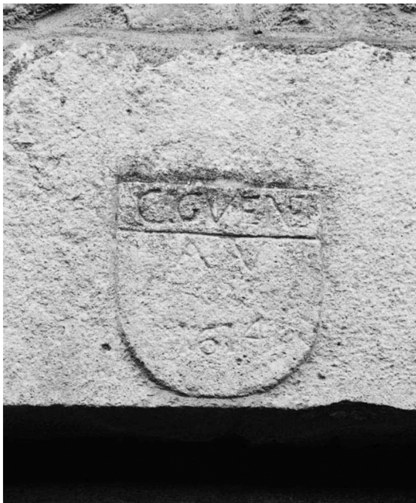
Blason du linteau de la porte de la maison sise parcelle 408 bis, section AB sur le cadastre de 1965. 21, Nolay