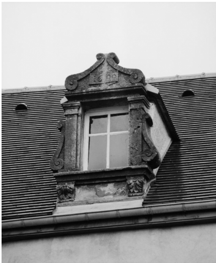
Lucarne de la maison sise parcelle 390, section AB sur le cadastre de 1965. 21, Nolay