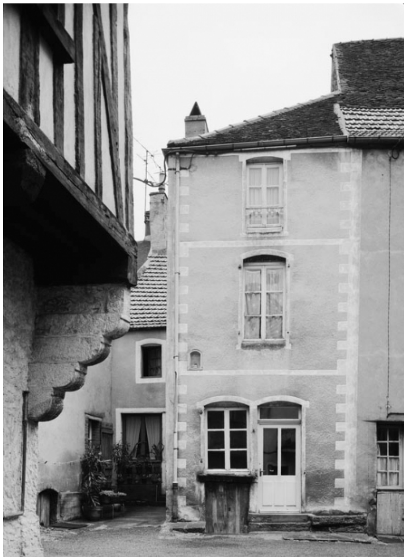
Vue de la maison sise parcelle 395, section AB sur le cadastre de 1965. 21, Nolay