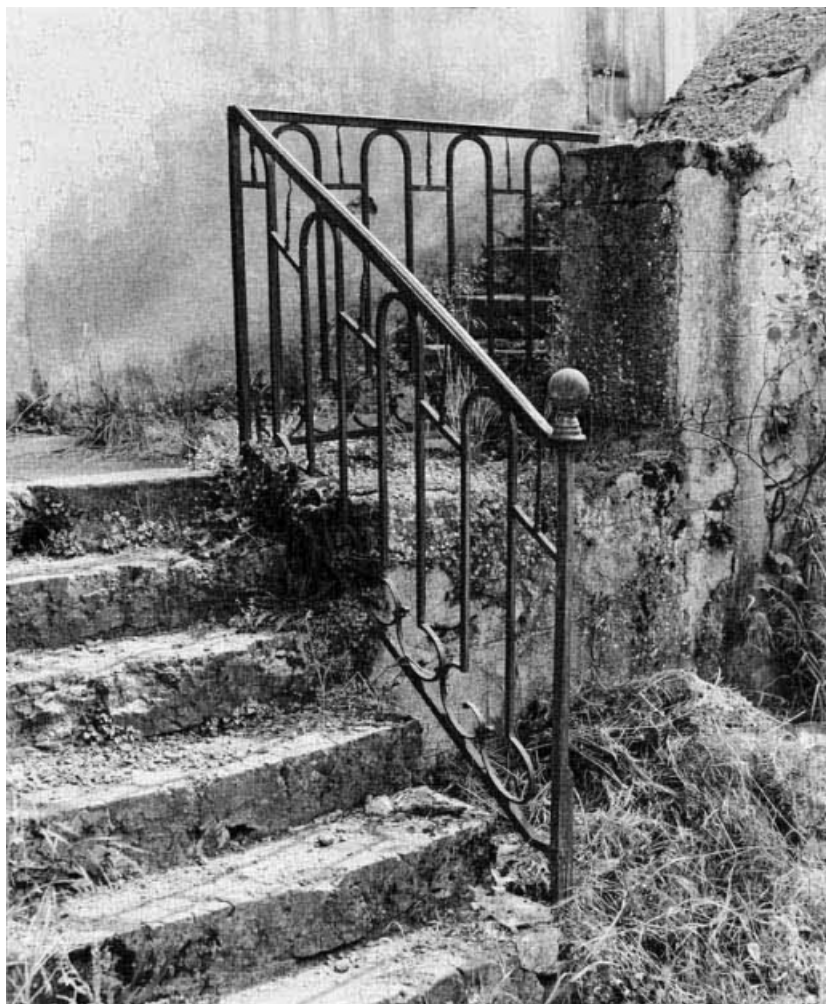
Détail de la rampe droite de l'escalier de la maison sise parcelle 334, section AB sur le cadastre de 1965. 21, Nolay