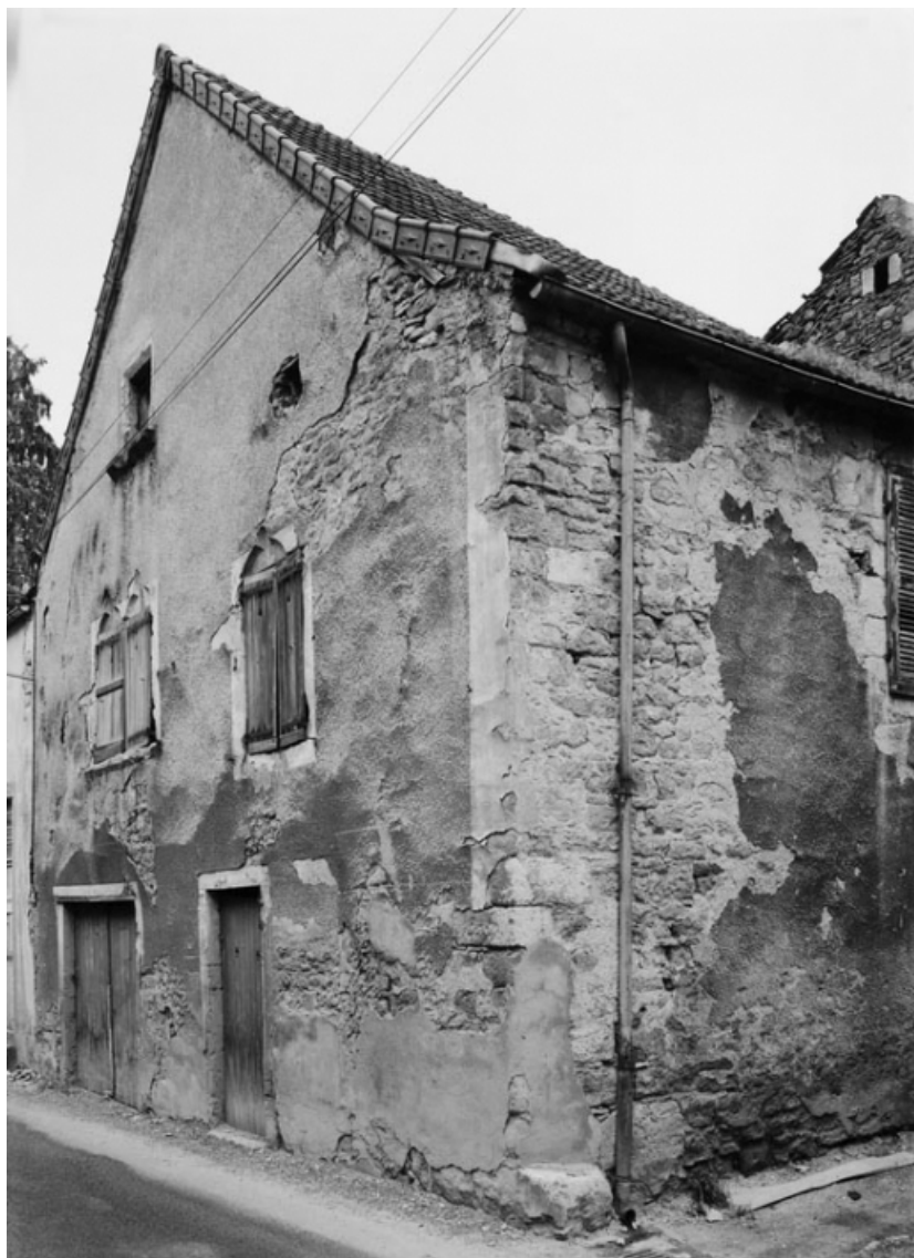
Vue de la maison sise parcelle 422a, section AB sur le cadastre de 1965. 21, Nolay