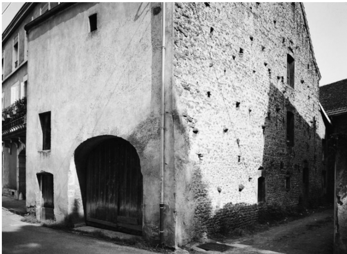
Ferme sise parcelle 206, section AC sur le cadastre de 1965. 21, Nolay