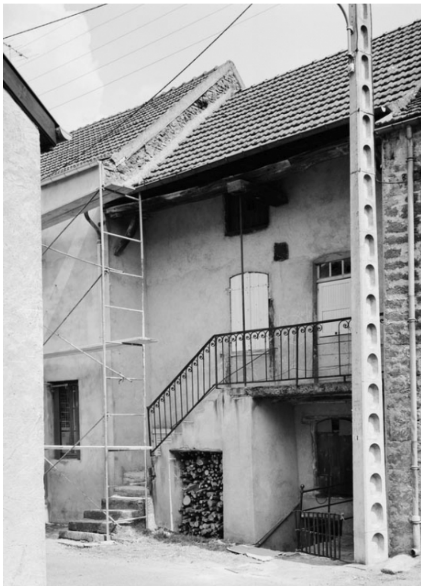
Vue d'ensemble de la maison sise parcelle 348 bis section AC sur le cadastre de 1965. 21, Nolay