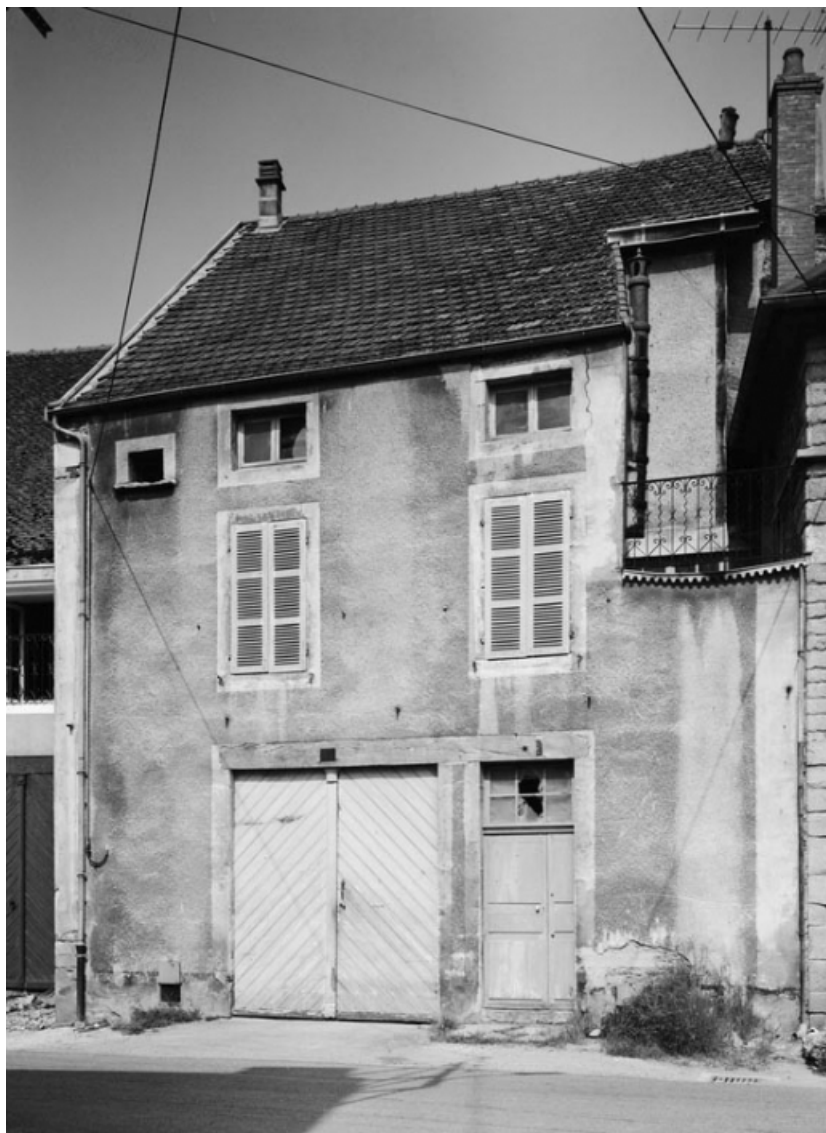
Vue de la maison sise parcelle 289, section AB sur le cadastre de 1965. 21, Nolay