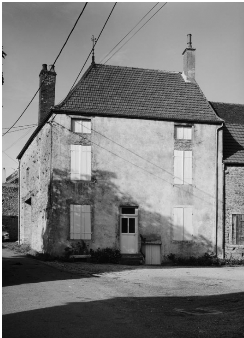
Vue d'ensemble de la maison sise parcelle 1287, section 174 A4 sur le cadastre de 1947. 21, Nolay