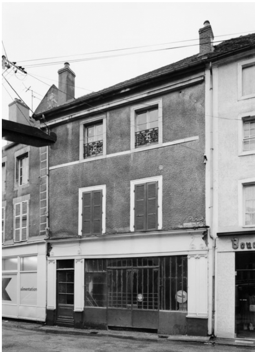
Vue de la maison sise parcelle 402, section AB sur le cadastre de 1965. 21, Nolay