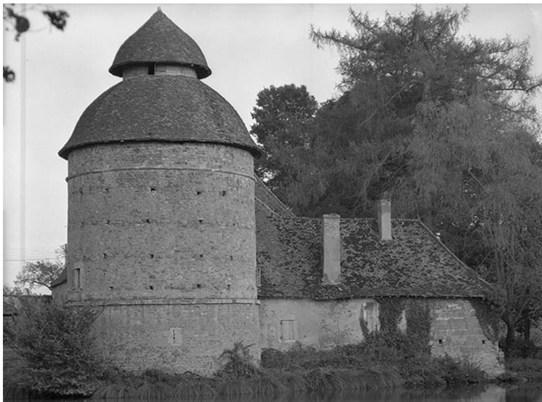
Tour d'angle, vue de l'ouest. 21, Molinot