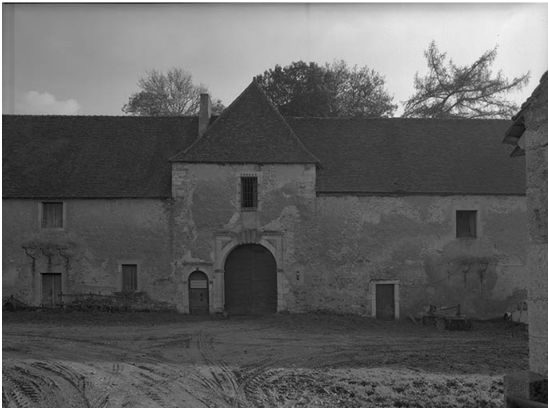
Communs : partie centrale. 21, Molinot