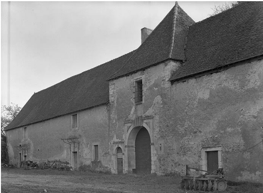
Communs : corps de passage et partie gauche. 21, Molinot