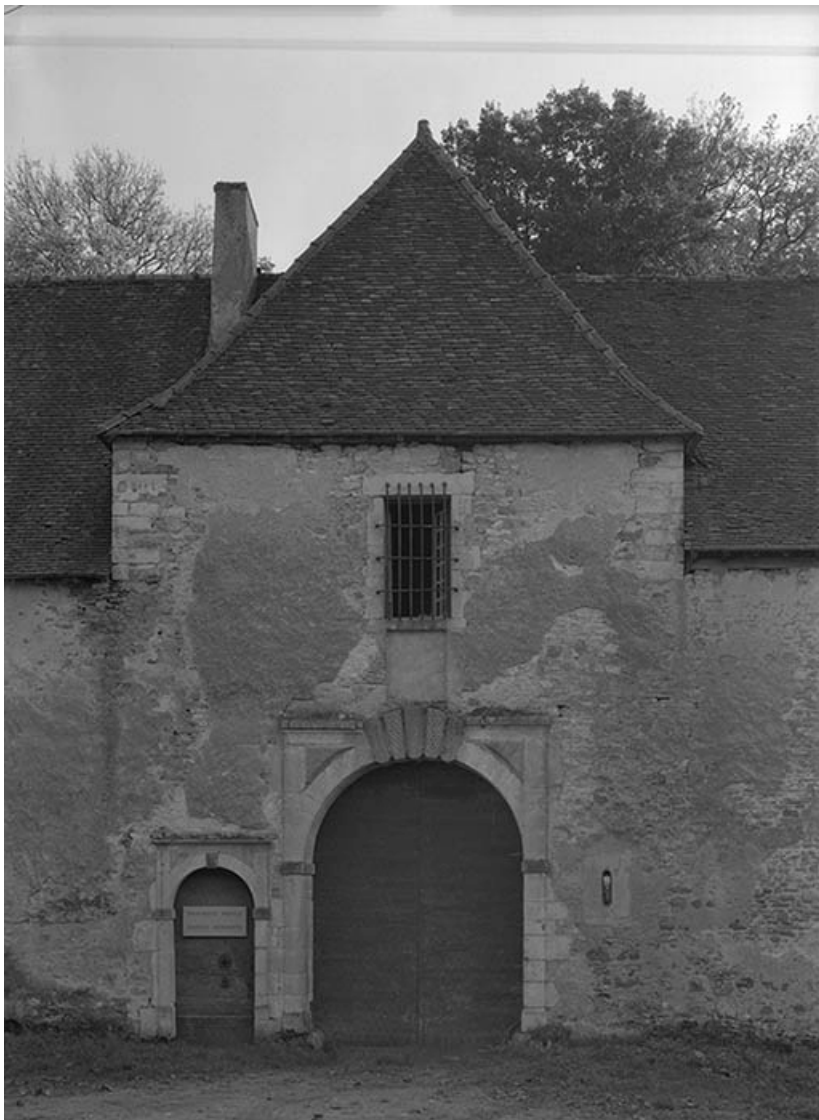
Communs : corps de passage.