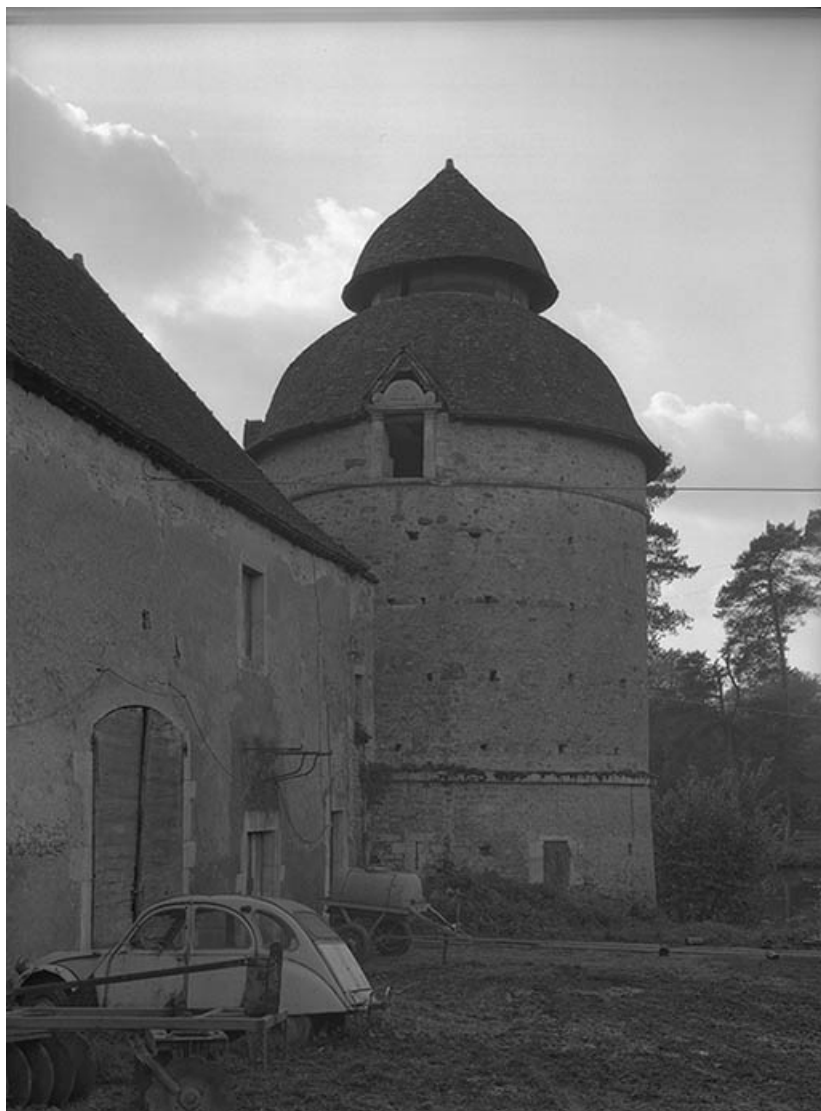
Tour d'angle (vue de l'Est). 21, Molinot