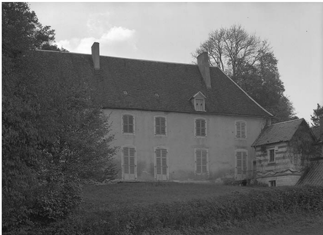
Corps de logis : façade postérieure. 21, Molinot