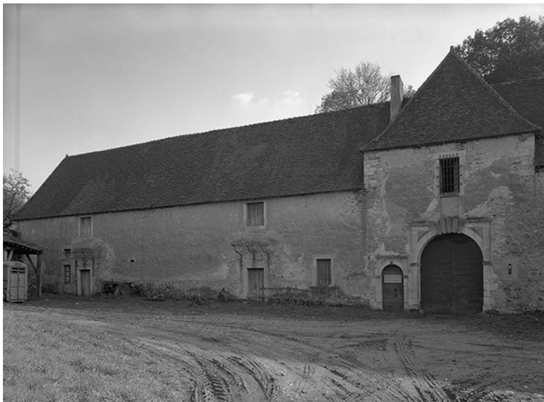
Communs : corps de passage et partie gauche. 21, Molinot