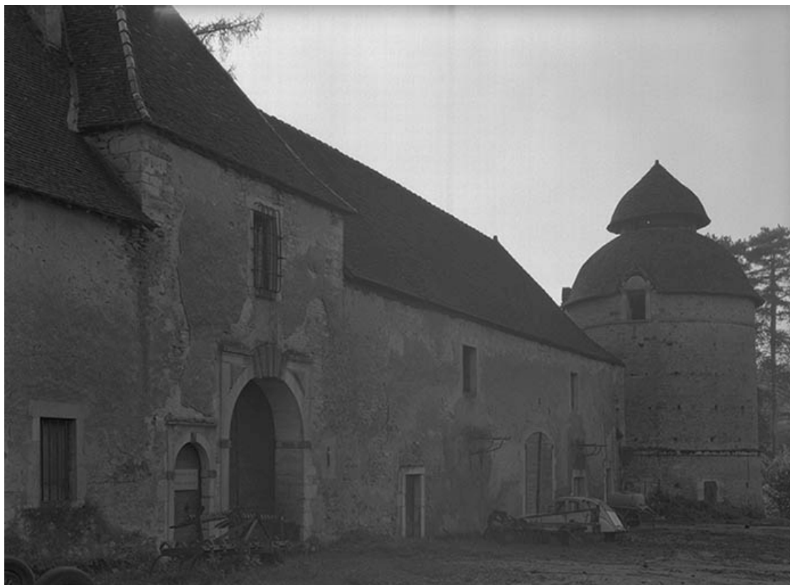
Communs (partie droite) et tour d'angle. 21, Molinot