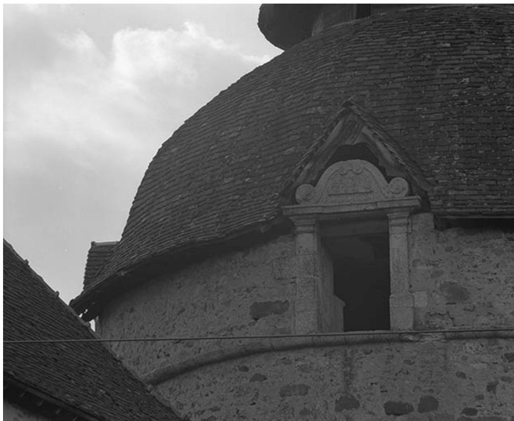
Tour d'angle, détail d'une lucarne.