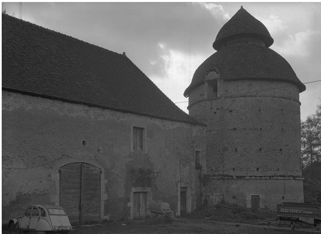
Tour d'angle et partie droite des communs. 21, Molinot