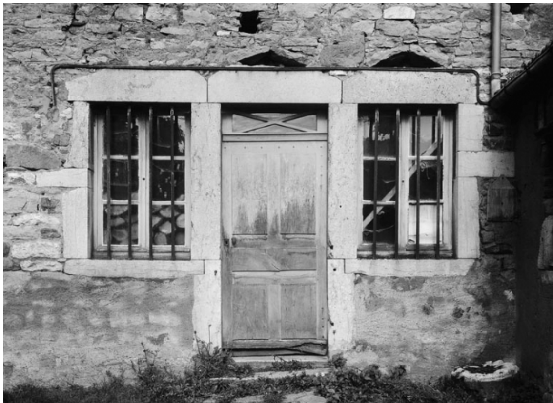
Détail de la porte et des fenêtres de la façade postérieure de la maison sise parcelle 237, section AB du cadastre de 1958. 21, Molinot