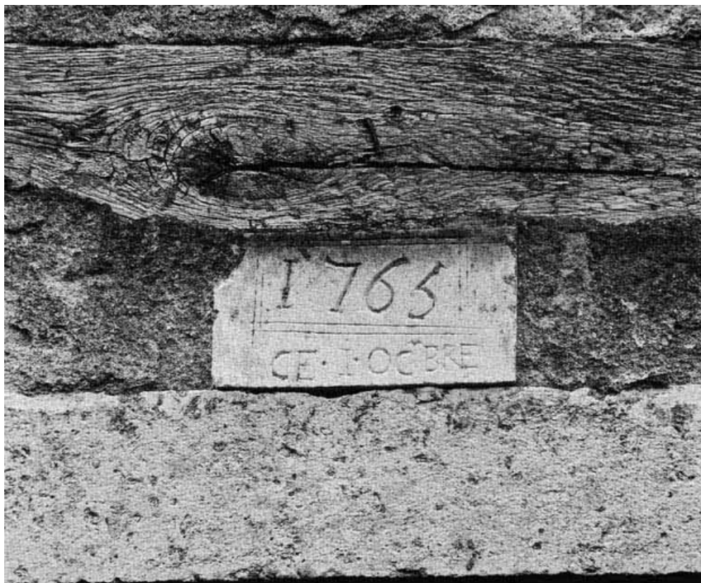
Détail de l'inscription gravée au-dessus de l'entrée de la maison sise parcelle 205(a), section AB du cadastre de 1958. 21, Molinot