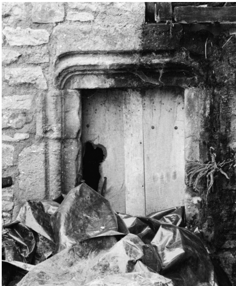
Détail d'une porte moulurée sur la maison sise parcelle 90, section AB du cadastre de 1958. 21, Molinot