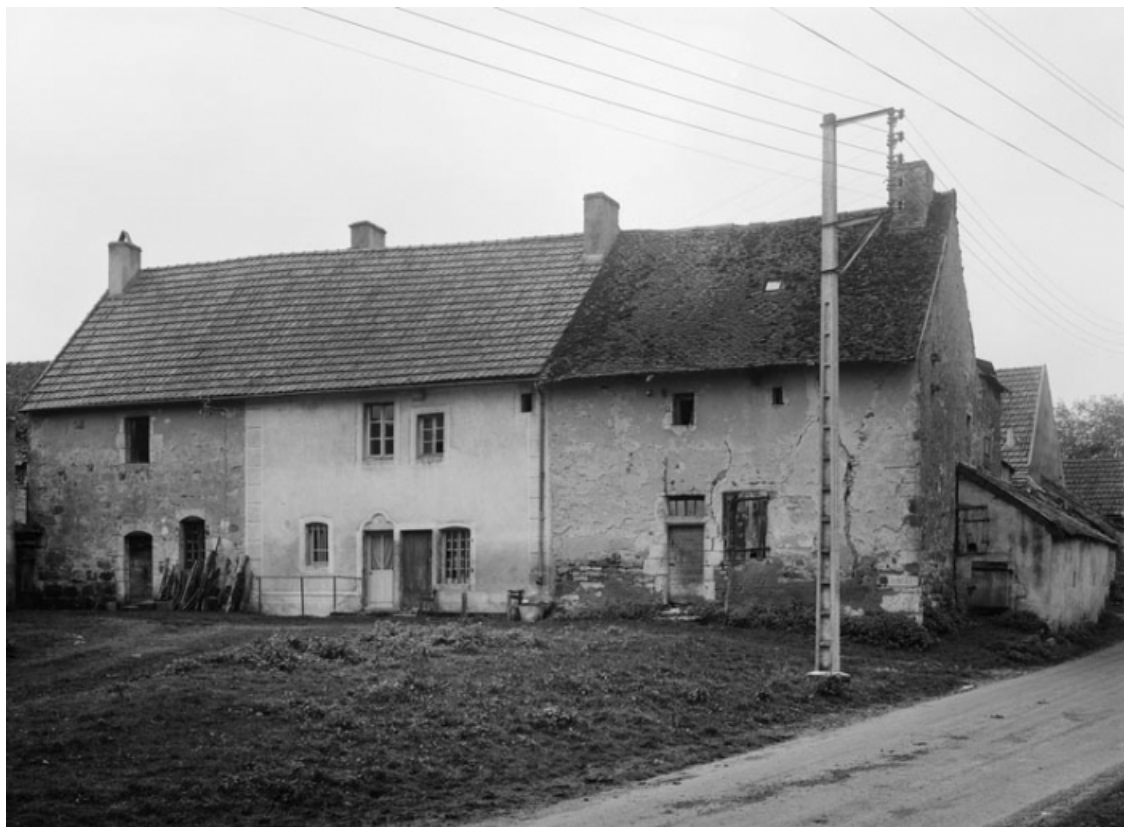
Vue générale de la maison sise parcelles 277 (a) et (b) et 278, section AB du cadastre de 1958. 21, Molinot