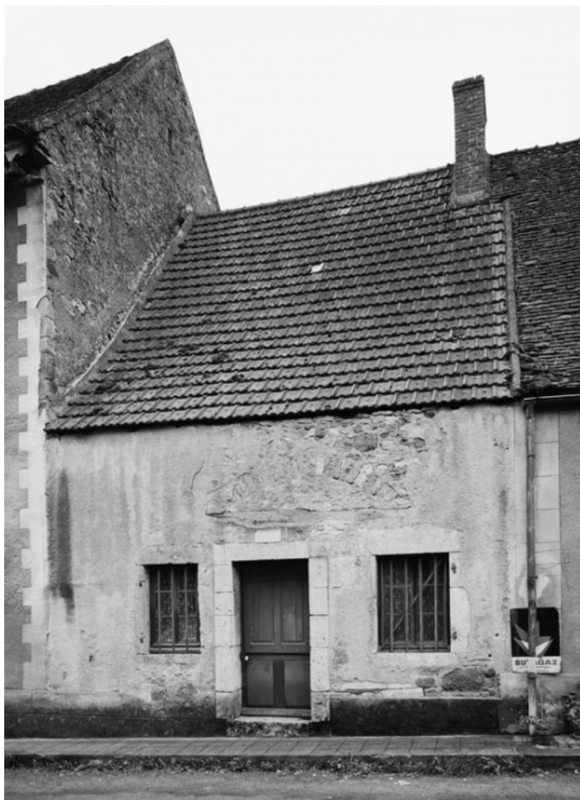
Vue d'ensemble de la maison sise parcelle 205(a), section AB du cadastre de 1958. 21, Molinot