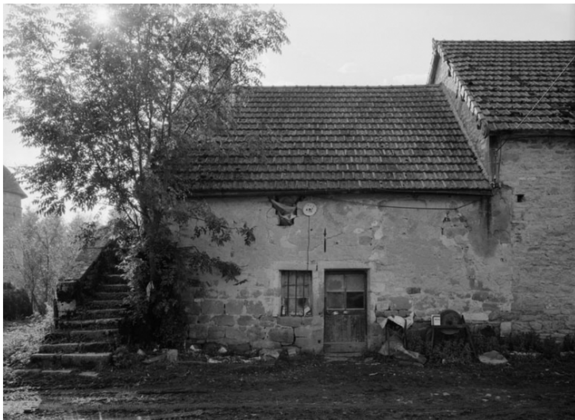
Vue générale de la maison sise parcelle 4 (a), section AC du cadastre de 1958. 21, Molinot