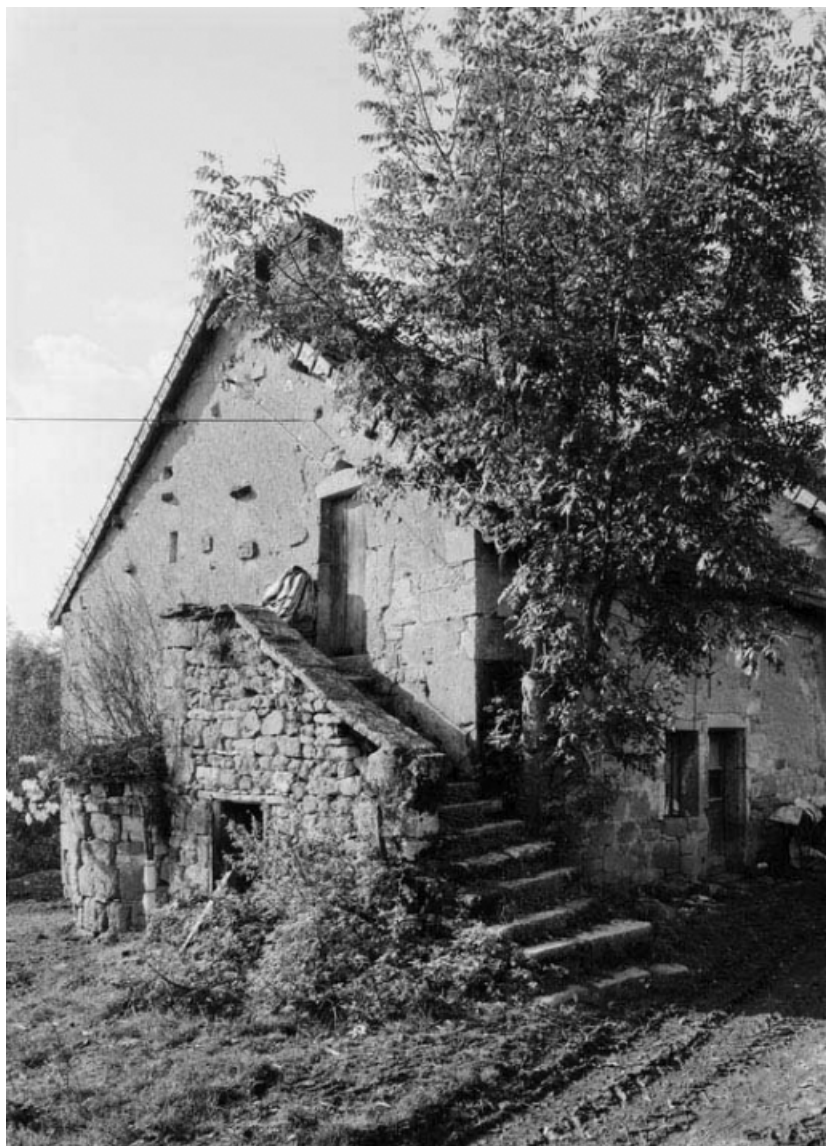
Vue générale de la maison sise parcelle 4 (a), section AC du cadastre de 1958. 21, Molinot