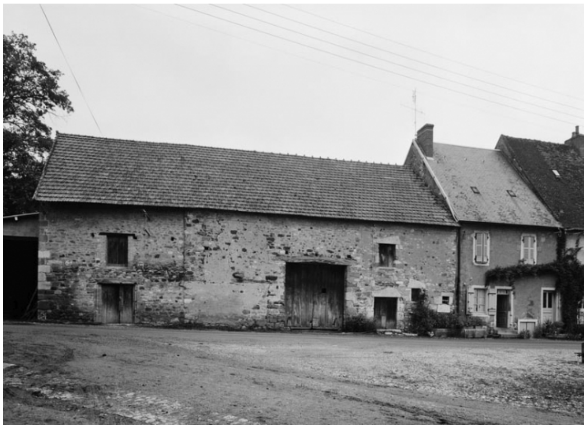
Ferme et ses dépendances sises parcelle 191, section AB du cadastre de 1958. 21, Molinot