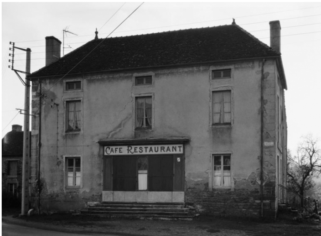
Vue générale de la maison sise parcelle 78, section AC du cadastre de 1958. 21, Molinot