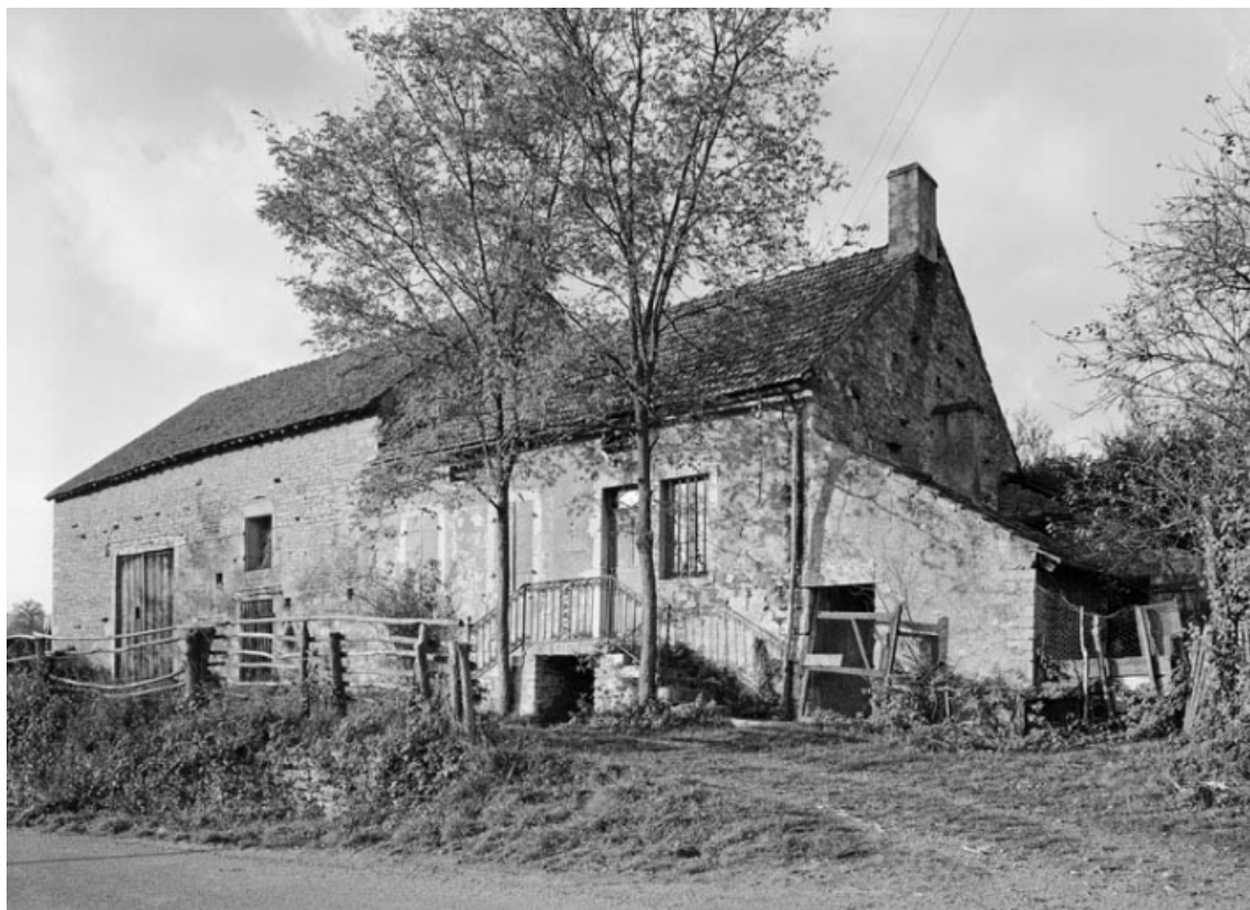
Vue générale de la ferme sise parcelle 1, section AC du cadastre de 1958. 21, Molinot