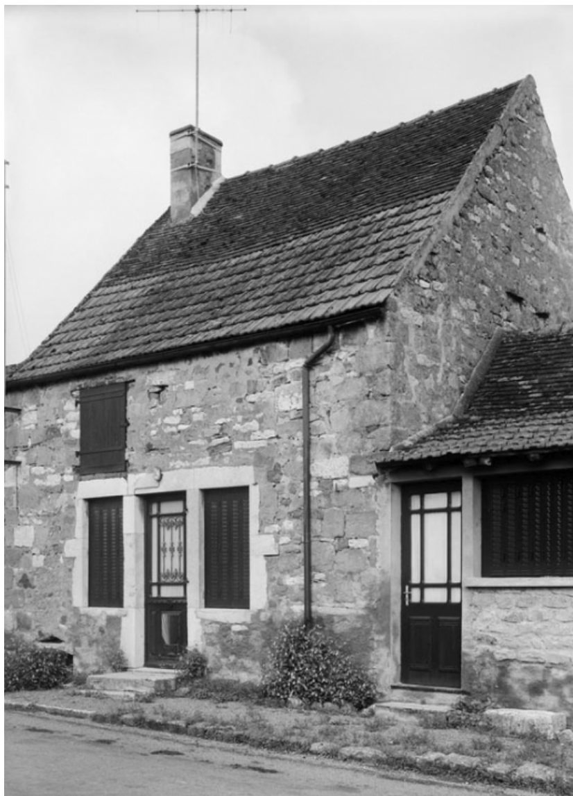
Vue d'ensemble de la maison sise parcelle 228, section AB du cadastre de 1958. 21, Molinot