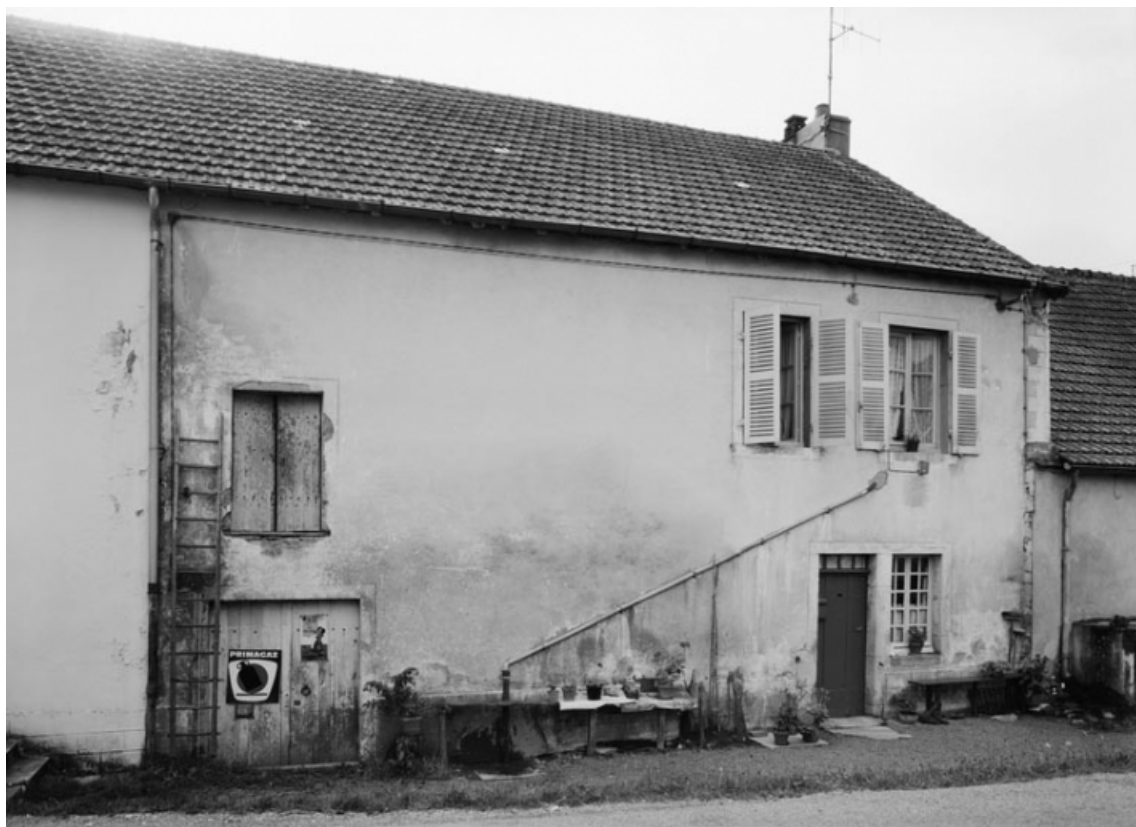
Vue d'ensemble de la maison sise parcelle 237, section AB du cadastre de 1958. 21, Molinot