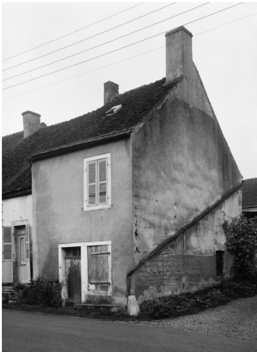
Vue d'ensemble de la maison sise parcelle 73, section AB du cadastre de 1958. 21, Molinot