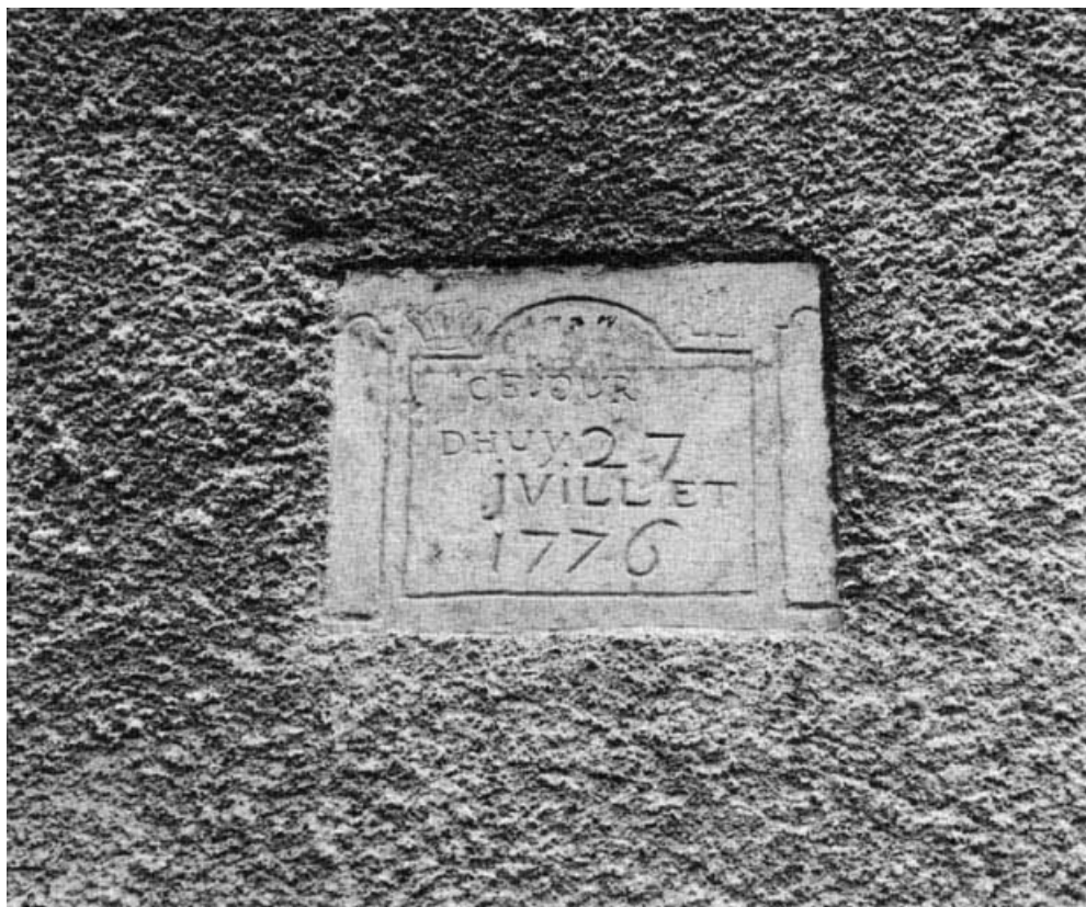
Détail de l'inscription sur la maison sise parcelle 217, section AB du cadastre de 1958. 21, Molinot