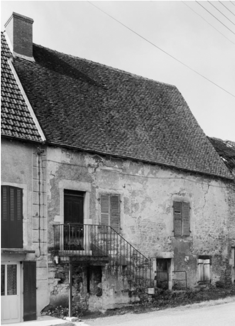
Vue générale de la maison sise parcelle 246, section AB du cadastre de 1958. 21, Molinot