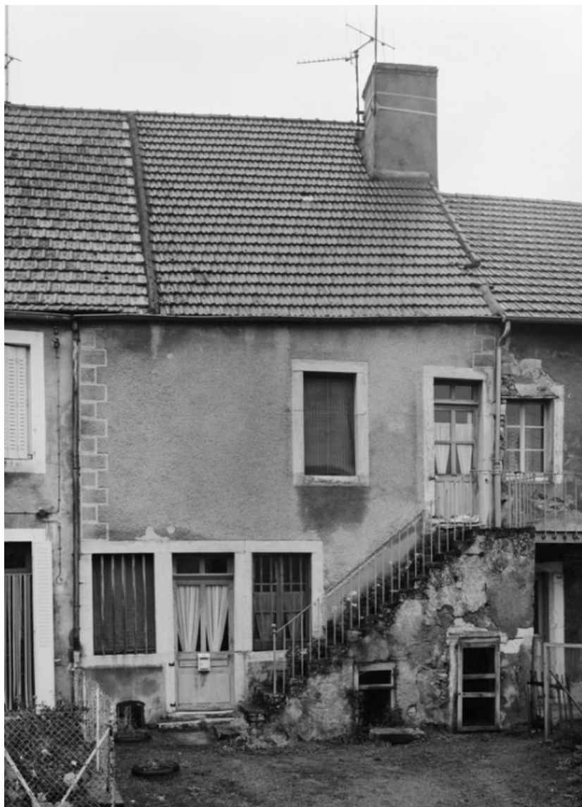
Vue d'ensemble de la maison sise parcelle 219, section AB du cadastre de 1958. 21, Molinot