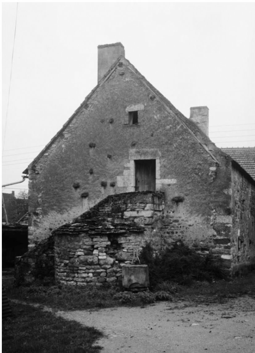
Vue d'ensemble de la maison sise parcelle 77, section AB du cadastre de 1958. 21, Molinot