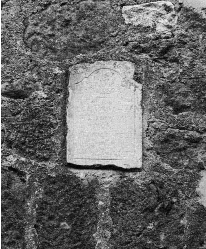
Détail de l'inscription sur la maison sise parcelle 216, section AB du cadastre de 1958. 21, Molinot