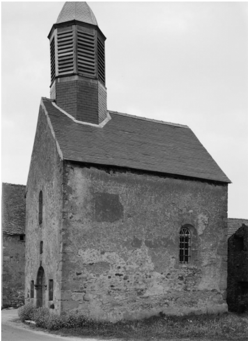
Vue d'ensemble de 3/4 droit.

21, Jours-en-Vaux, lieudit : la Chapelle