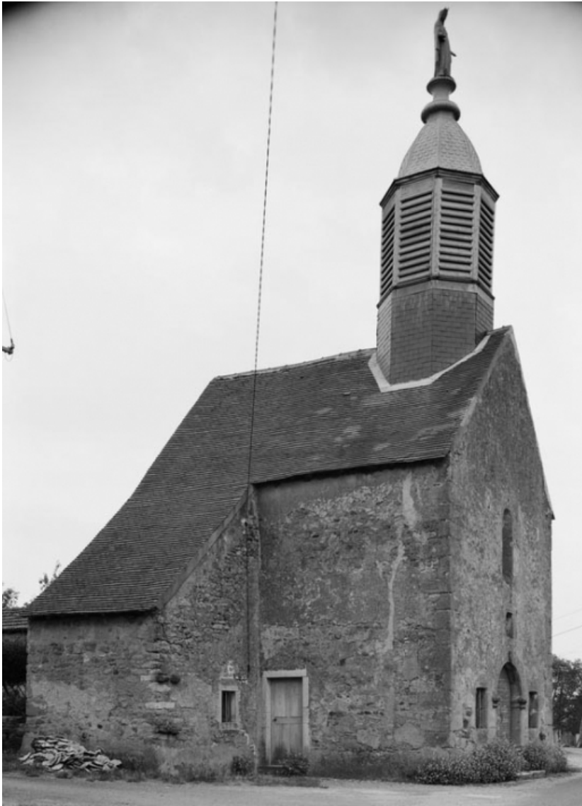
Vue d'ensemble de 3/4 gauche.

21, Jours-en-Vaux, lieudit : la Chapelle