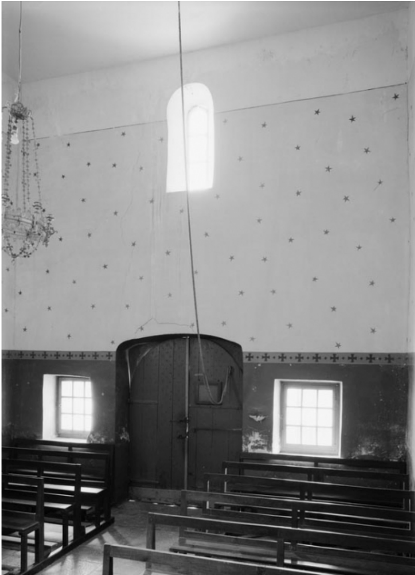
Vue de l'intérieur, depuis le chœur. 21, Jours-en-Vaux, lieudit : la Chapelle