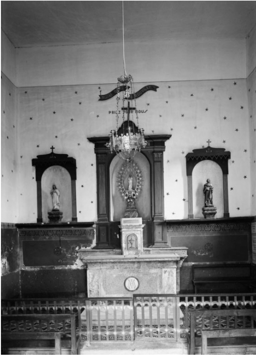
Vue de l'intérieur, depuis l'entrée.

21, Jours-en-Vaux, lieudit : la Chapelle