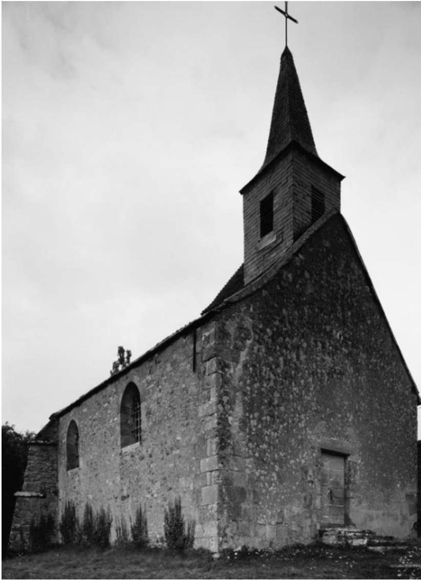
Vue d'ensemble de 3/4 droit (photo prise en 1978).