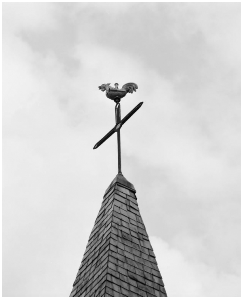
Girouette (photo prise en 1978).