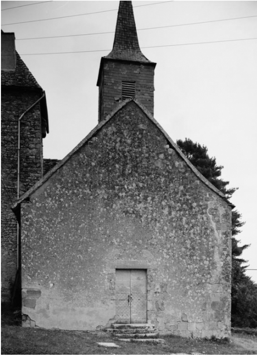
Façade antérieure (photo prise en 1978).