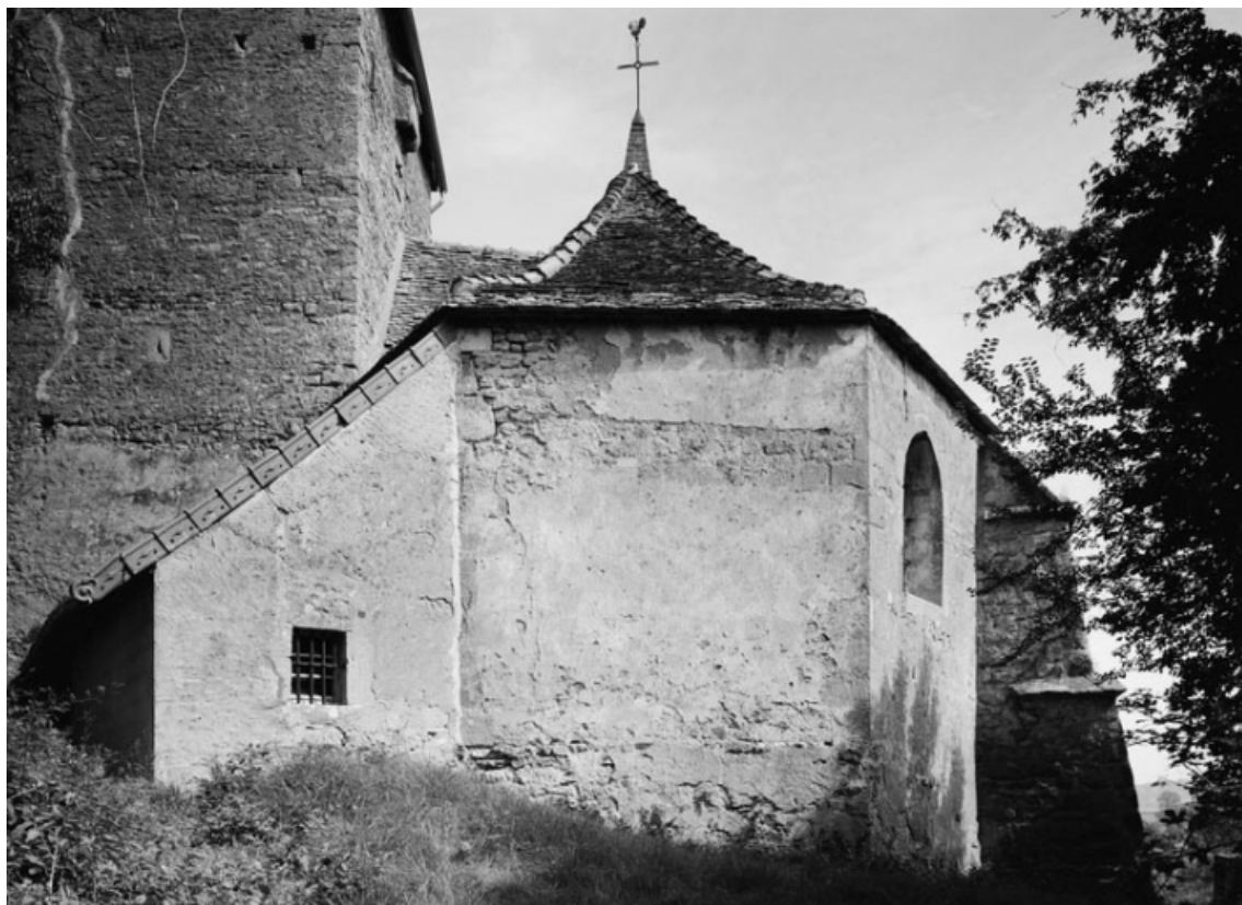
Chevet (photo prise en 1978).