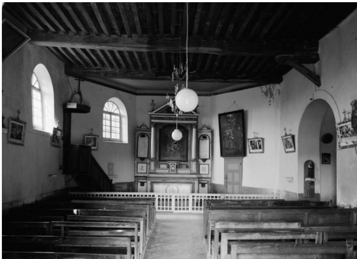
Vue d'ensemble prise de l'entrée (photo prise en 1978).