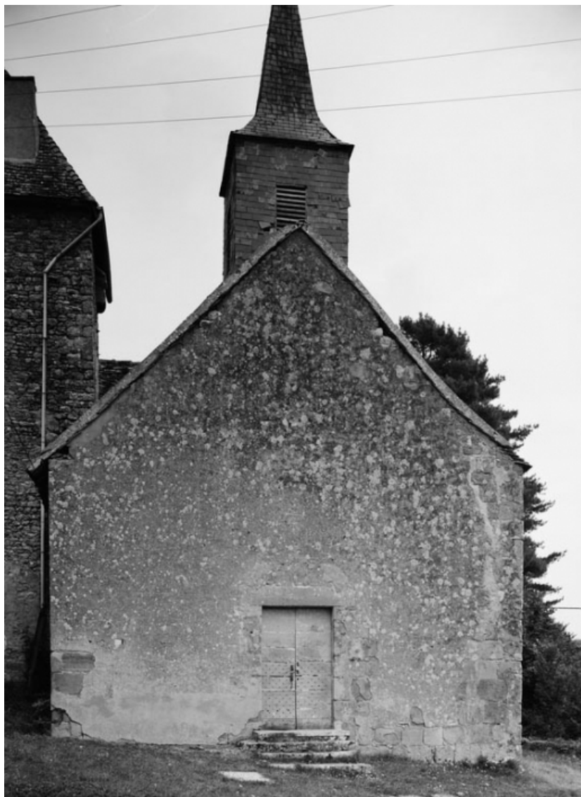
Façade antérieure (photo prise en 1978). 21, Jours-en-Vaux