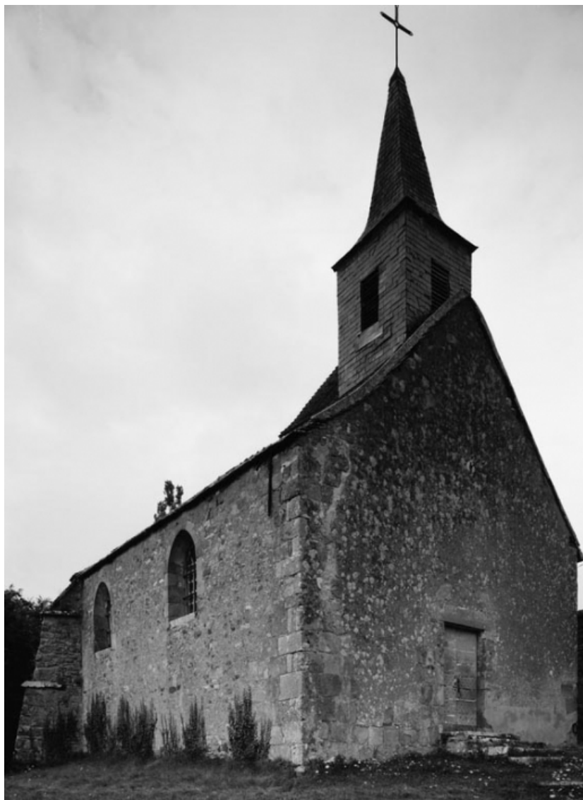
Vue d'ensemble de 3/4 droit (photo prise en 1978). 21, Jours-en-Vaux