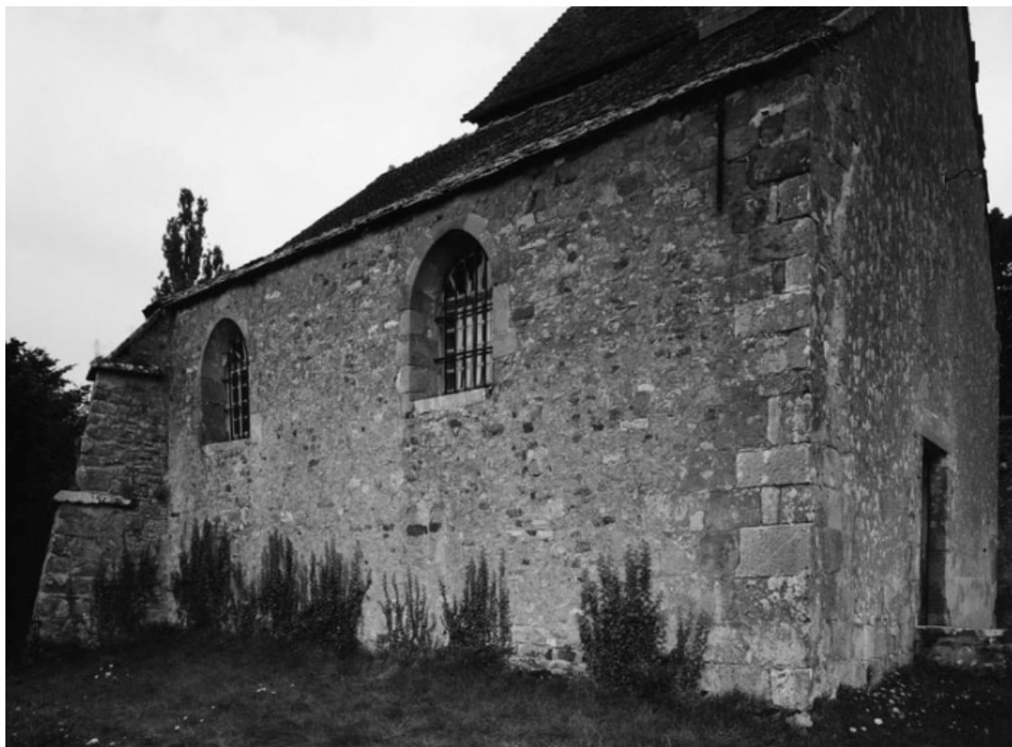
Élévation droite (photo prise en 1978). 21, Jours-en-Vaux