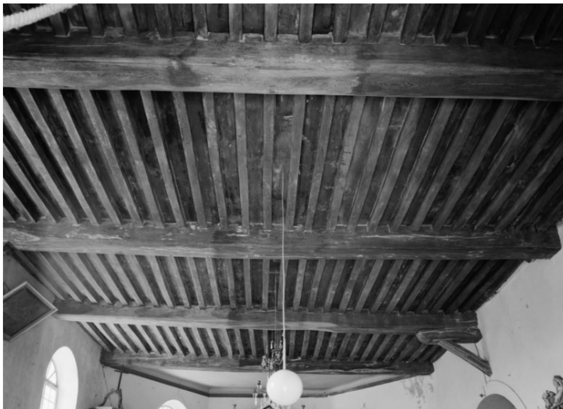
Le plafond (photo prise en 1978).