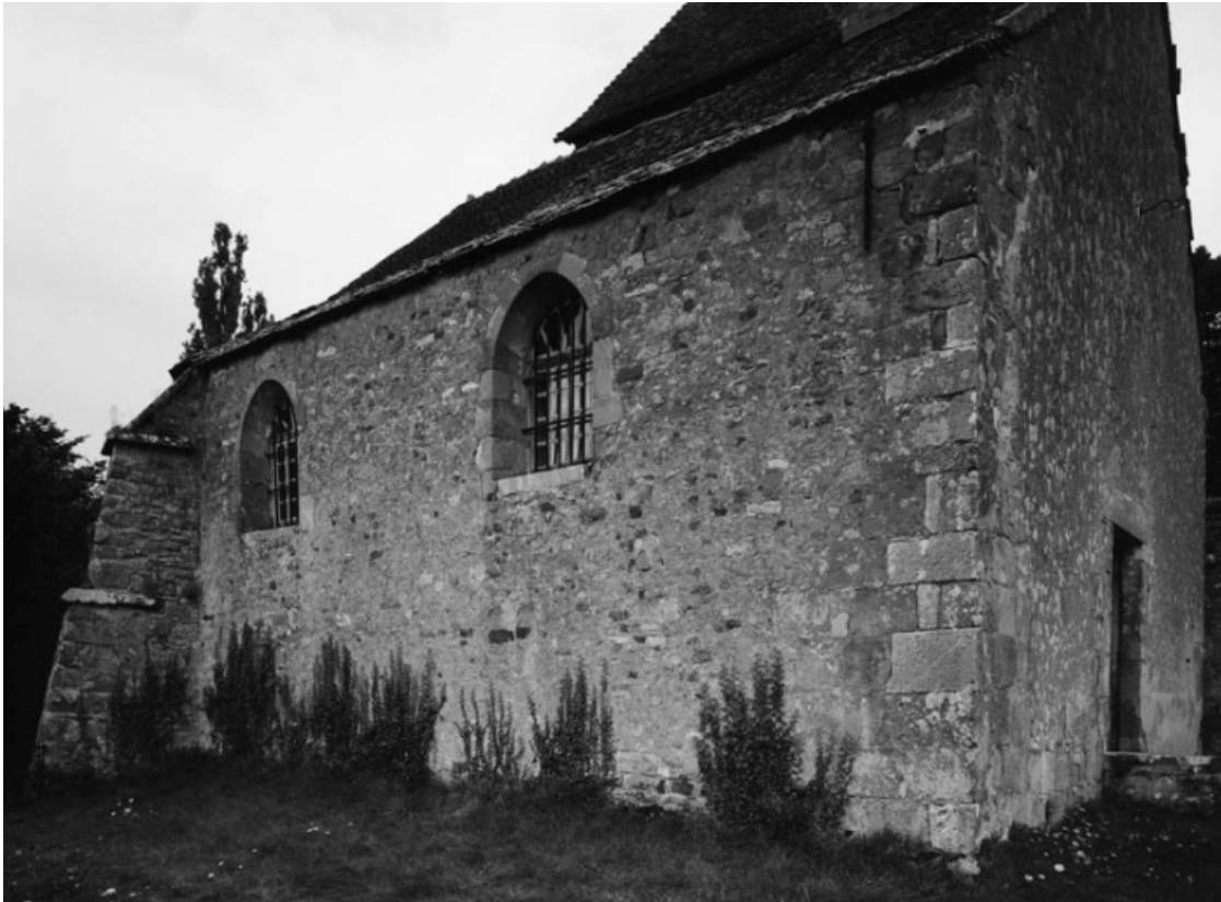
Elévation droite (photo prise en 1978).