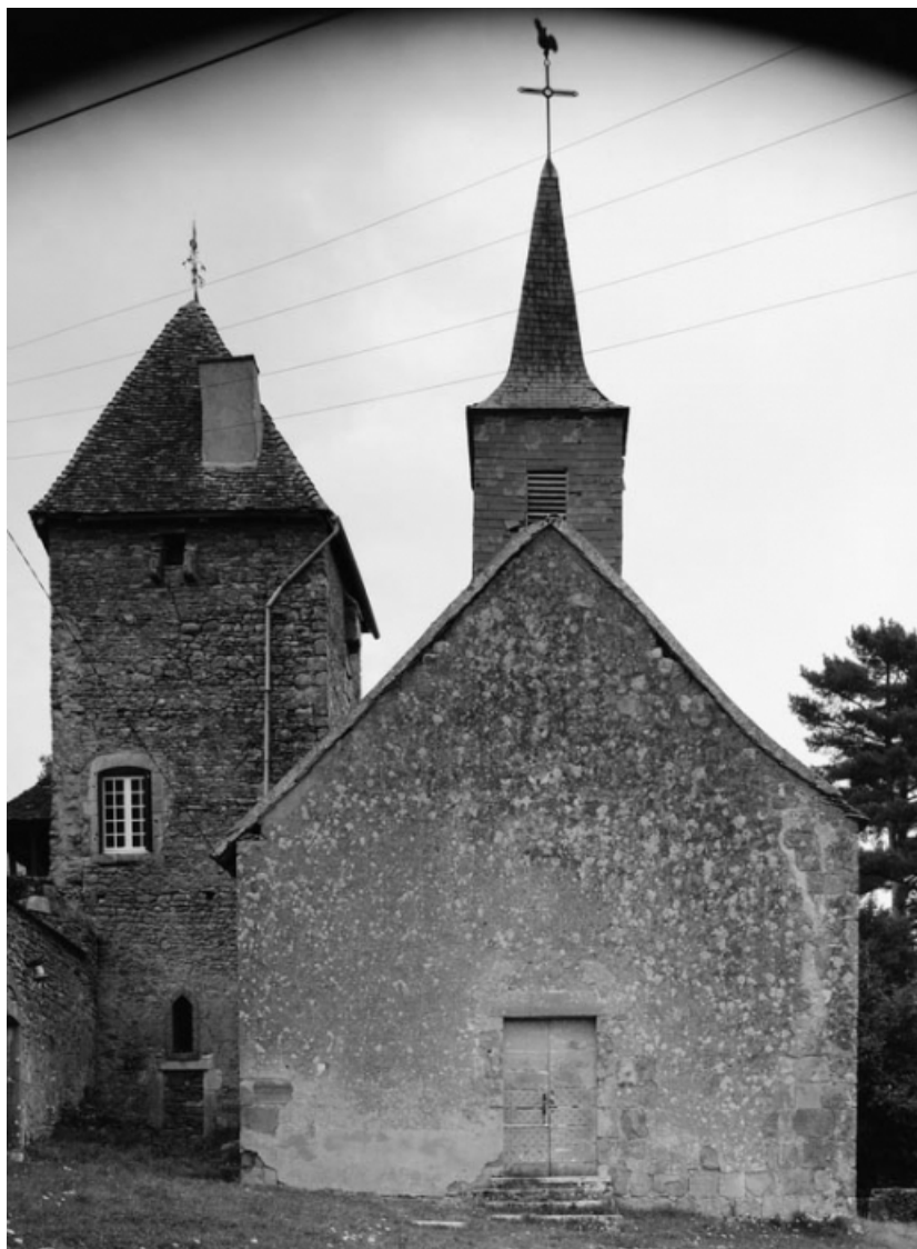
Façade antérieure (photo prise en 1978).