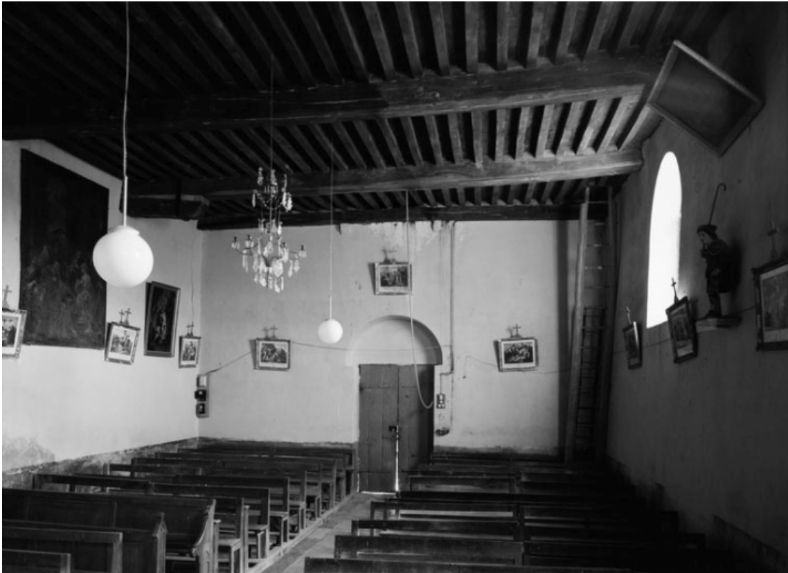
La nef, depuis le chœur (photo prise en 1978).