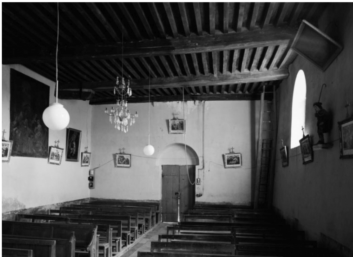
La nef, depuis le chœur (photo prise en 1978).