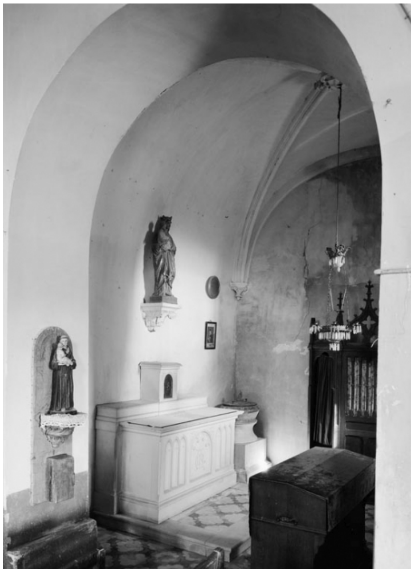
La chapelle (photo prise en 1978).