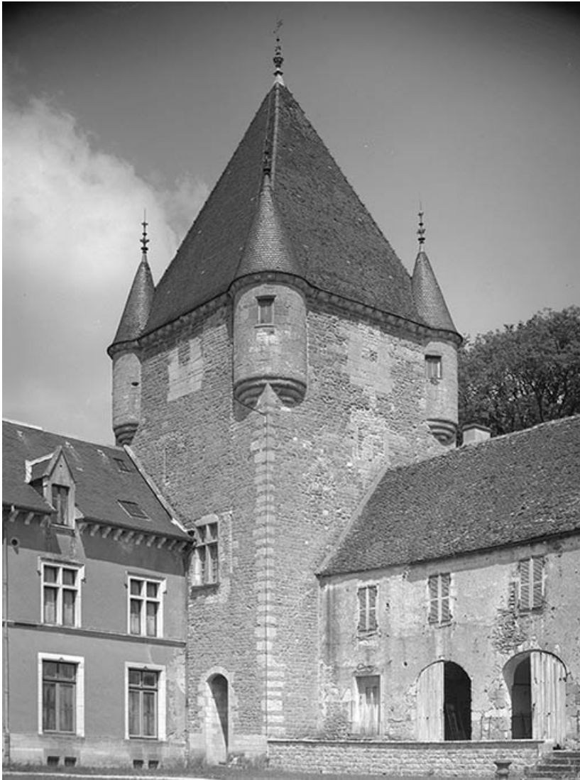
Donjon, vue depuis la cour.

21, Ivry-en-Montagne R.D. 17 d, lieudit : Coraboeuf