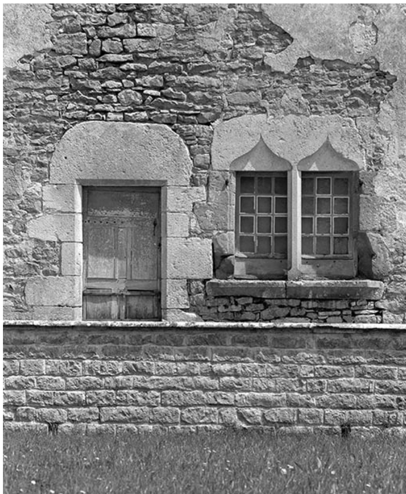
Détail de la porte et des 2 fenêtres situées au centre de la façade antérieure de l'aile est. 21, Ivry-en-Montagne R.D. 17 d, lieudit : Coraboeuf