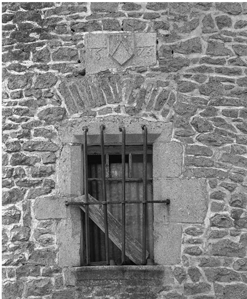
Détail d'une fenêtre et du blason daté 1576, tour sud-est.

21, Ivry-en-Montagne R.D. 17 d, lieudit : Coraboeuf