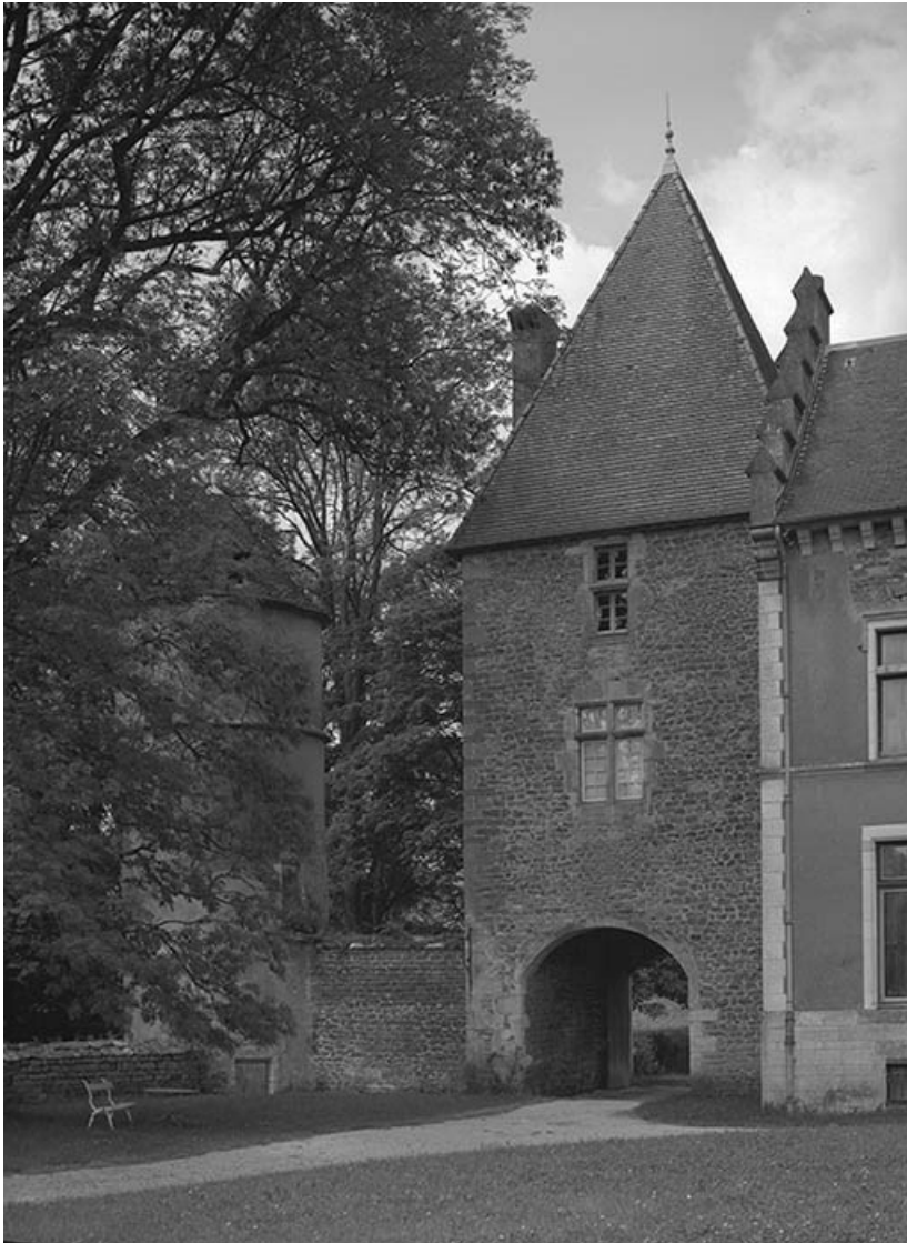
Tour-porche : façade sur cour.

21, Ivry-en-Montagne R.D. 17 d, lieudit : Coraboeuf