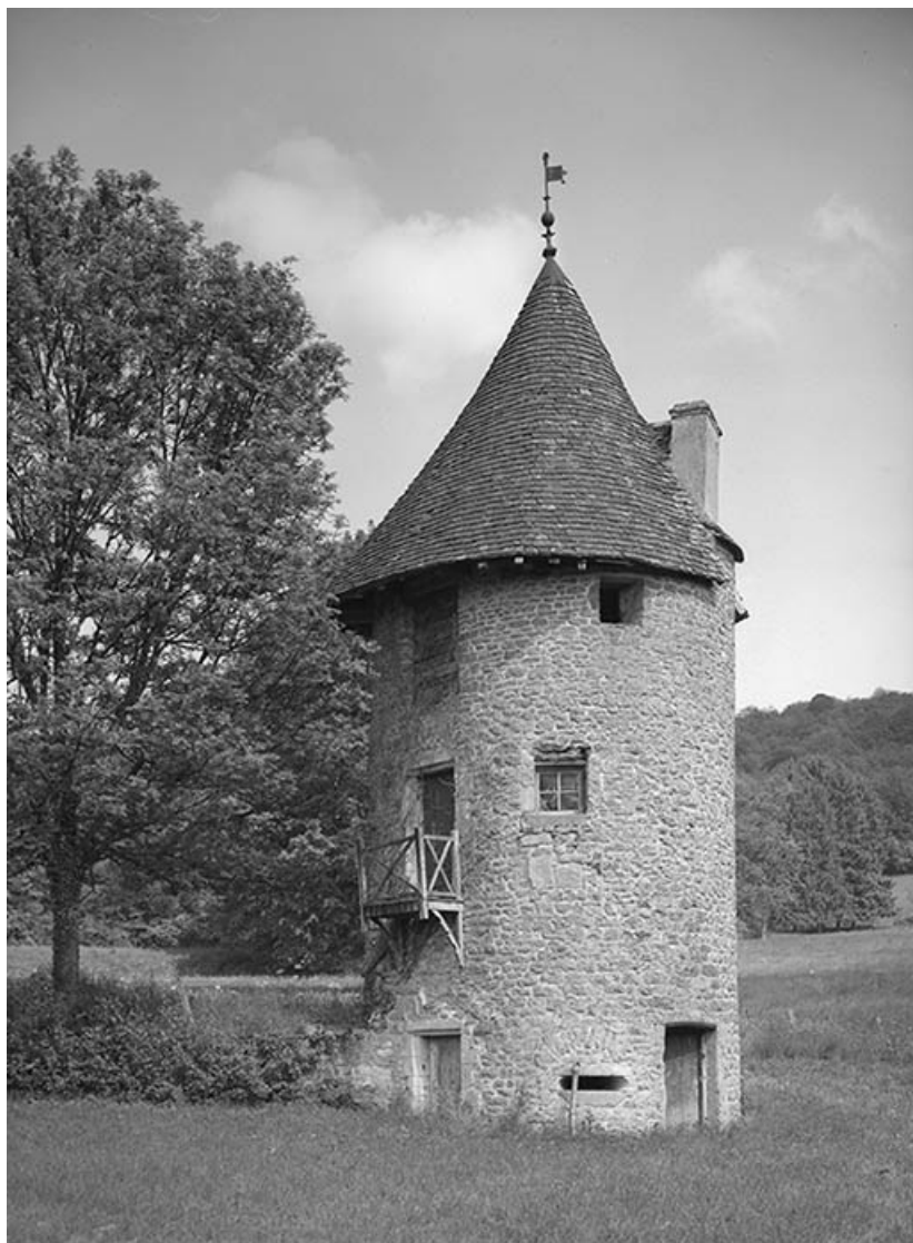
Tour sud-est, vue depuis la cour.

21, Ivry-en-Montagne R.D. 17 d, lieudit : Coraboeuf