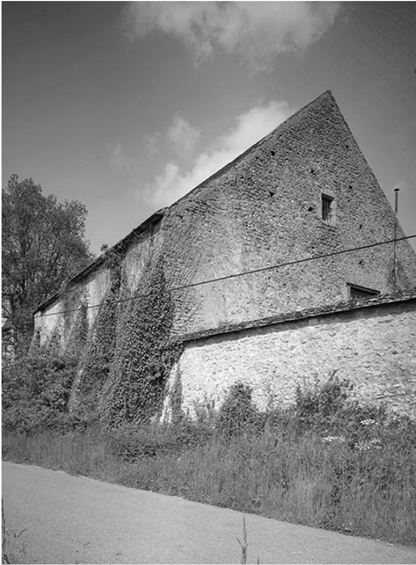
Grange : faces postérieures et droite.

21, Ivry-en-Montagne R.D. 17 d, lieudit : Coraboeuf