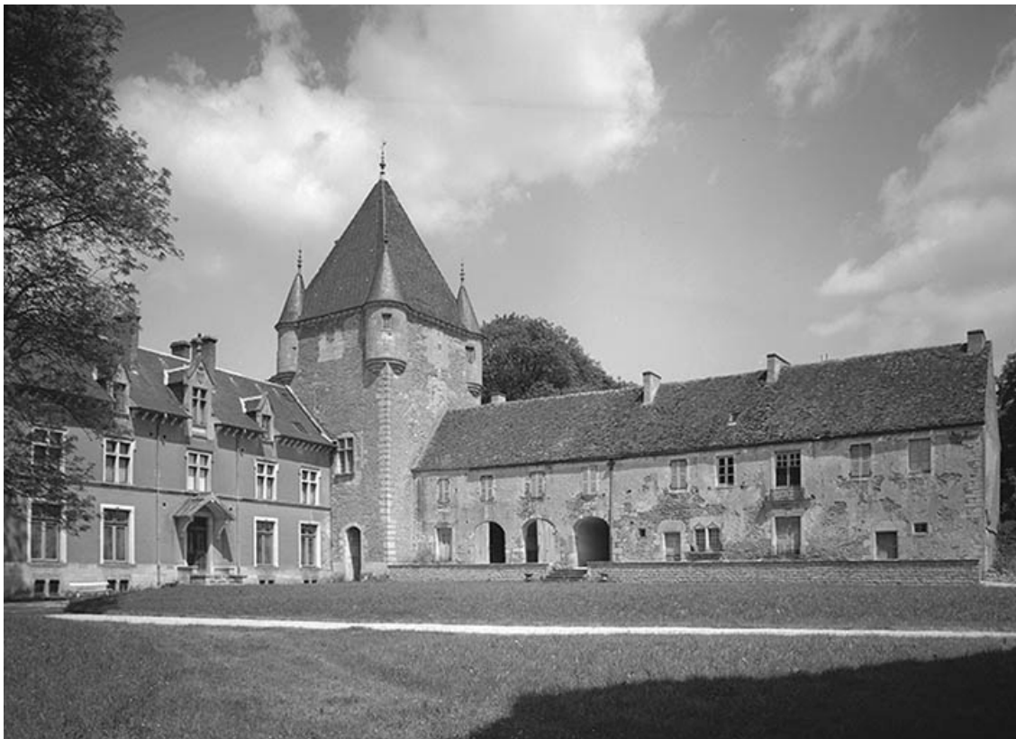
Vue d'ensemble du logis, du donjon et de l'aile Est.

21, Ivry-en-Montagne R.D. 17 d, lieudit : Coraboeuf