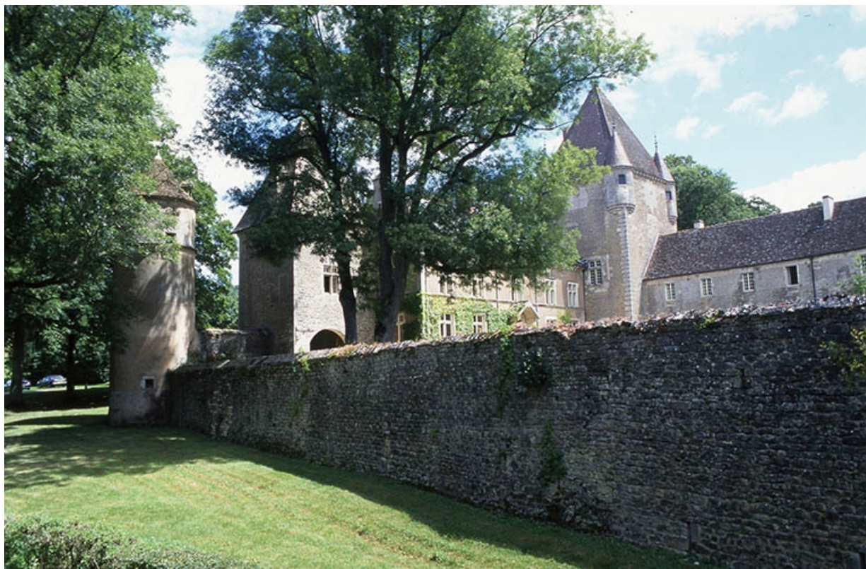
Vue d'ensemble (photo prise en 1999).

21, Ivry-en-Montagne R.D. 17 d, lieudit : Coraboeuf