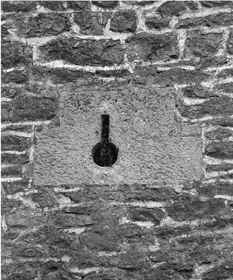
Détail d'une archère-canonnière sur la tour nord-est.

21, Ivry-en-Montagne R.D. 17 d, lieudit : Coraboeuf