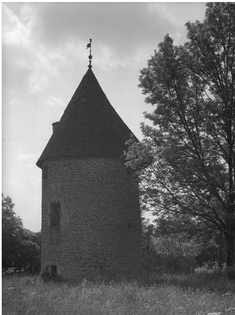
Tour sud-est, vue depuis le jardin.

21, Ivry-en-Montagne R.D. 17 d, lieudit : Coraboeuf