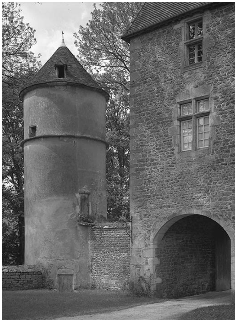
Tour nord-ouest et tour-porche, vue depuis la cour.

21, Ivry-en-Montagne R.D. 17 d, lieudit : Coraboeuf