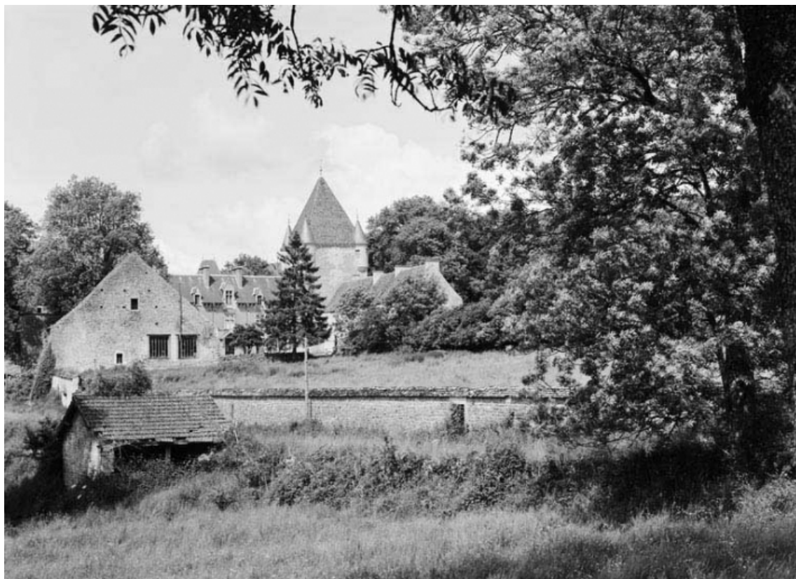
Vue d'ensemble du château, depuis le sud-ouest.

21, Ivry-en-Montagne R.D. 17 d, lieudit : Coraboeuf