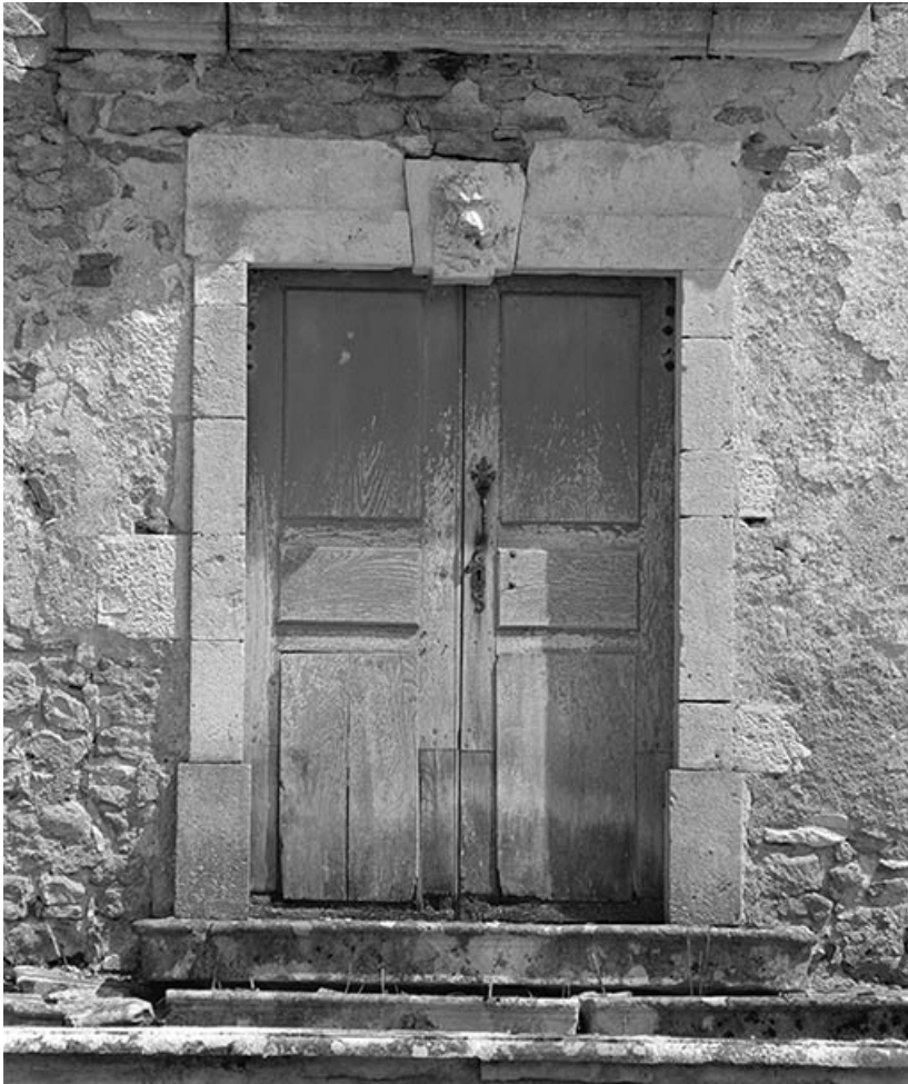
Détail de la porte principale de l'aile est.

21, Ivry-en-Montagne R.D. 17 d, lieudit : Coraboeuf