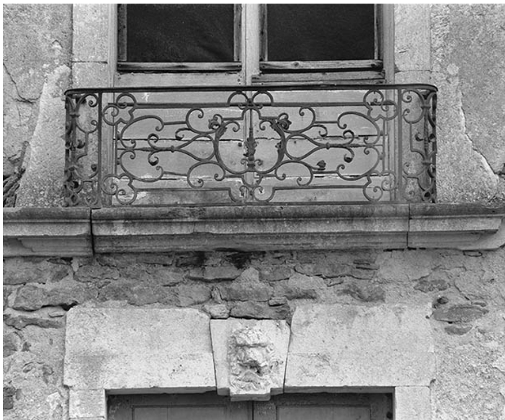
Détail de la grille de la porte-fenêtre, aile est.

21, Ivry-en-Montagne R.D. 17 d, lieudit : Coraboeuf