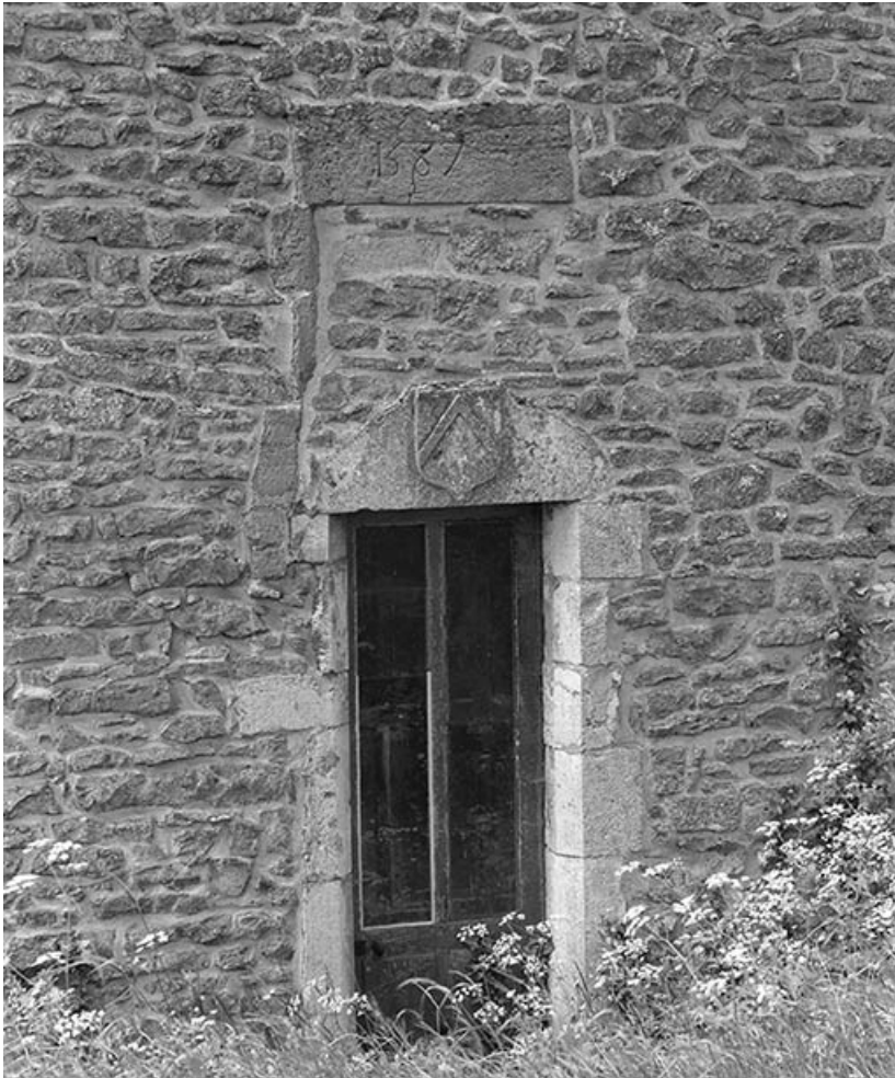
Détail de la porte avec blason et date de 1587, sur la tour nord-est, façade sur jardin. 21, Ivry-en-Montagne R.D. 17 d, lieudit : Coraboeuf