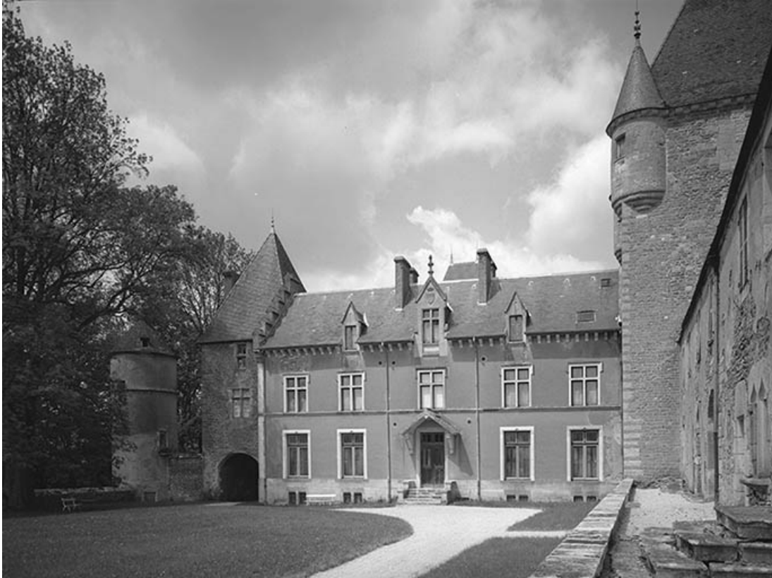
Façade antérieure du corps de logis.

21, Ivry-en-Montagne R.D. 17 d, lieudit : Coraboeuf