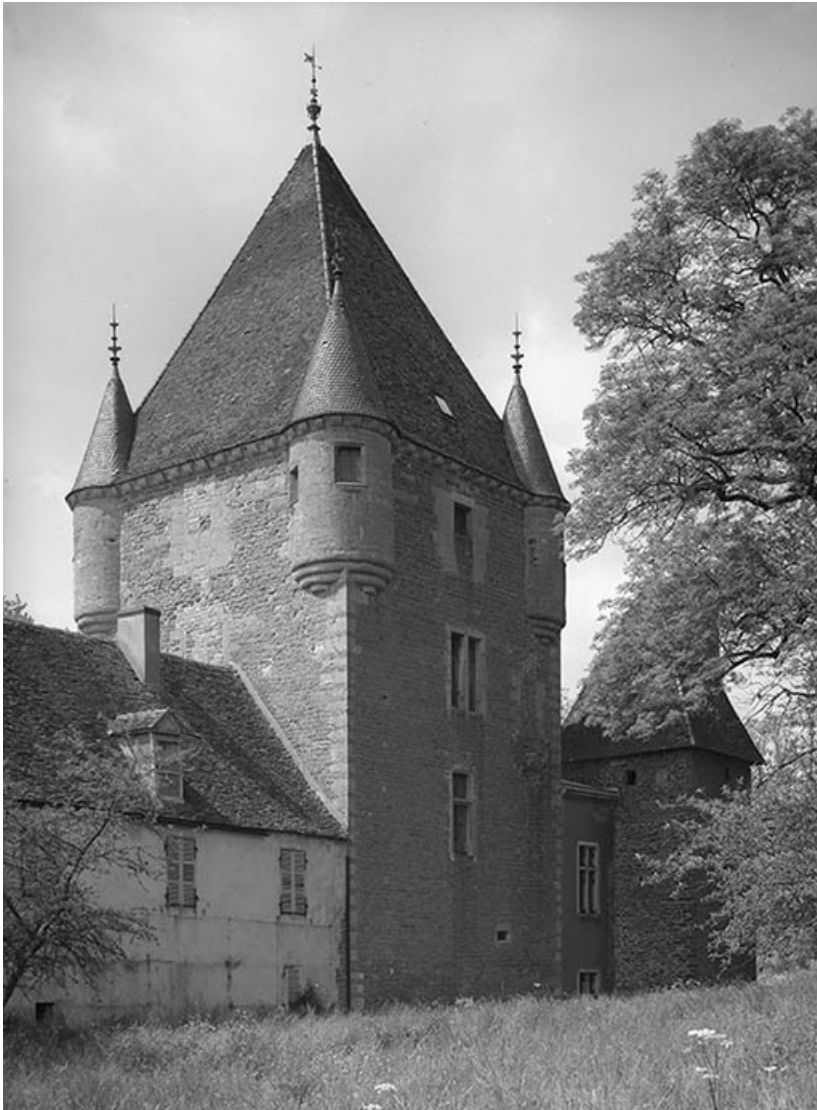
Donjon, vue depuis le jardin.

21, Ivry-en-Montagne R.D. 17 d, lieudit : Coraboeuf