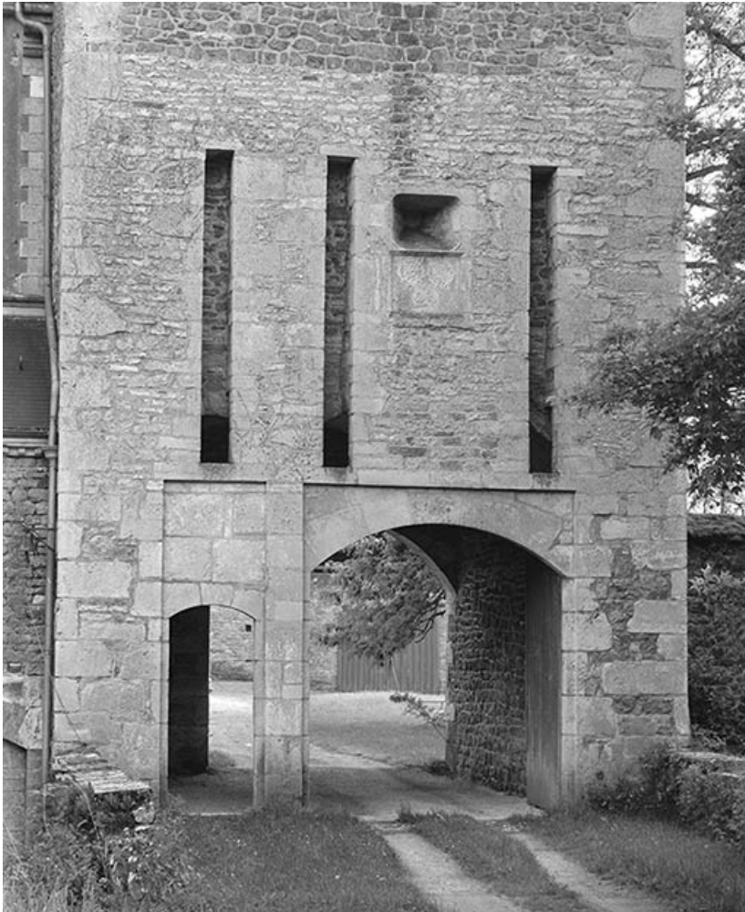
Façade de la tour-porche : détail des portes et des rainures des ponts-levis. 21, Ivry-en-Montagne R.D. 17 d, lieudit : Coraboeuf