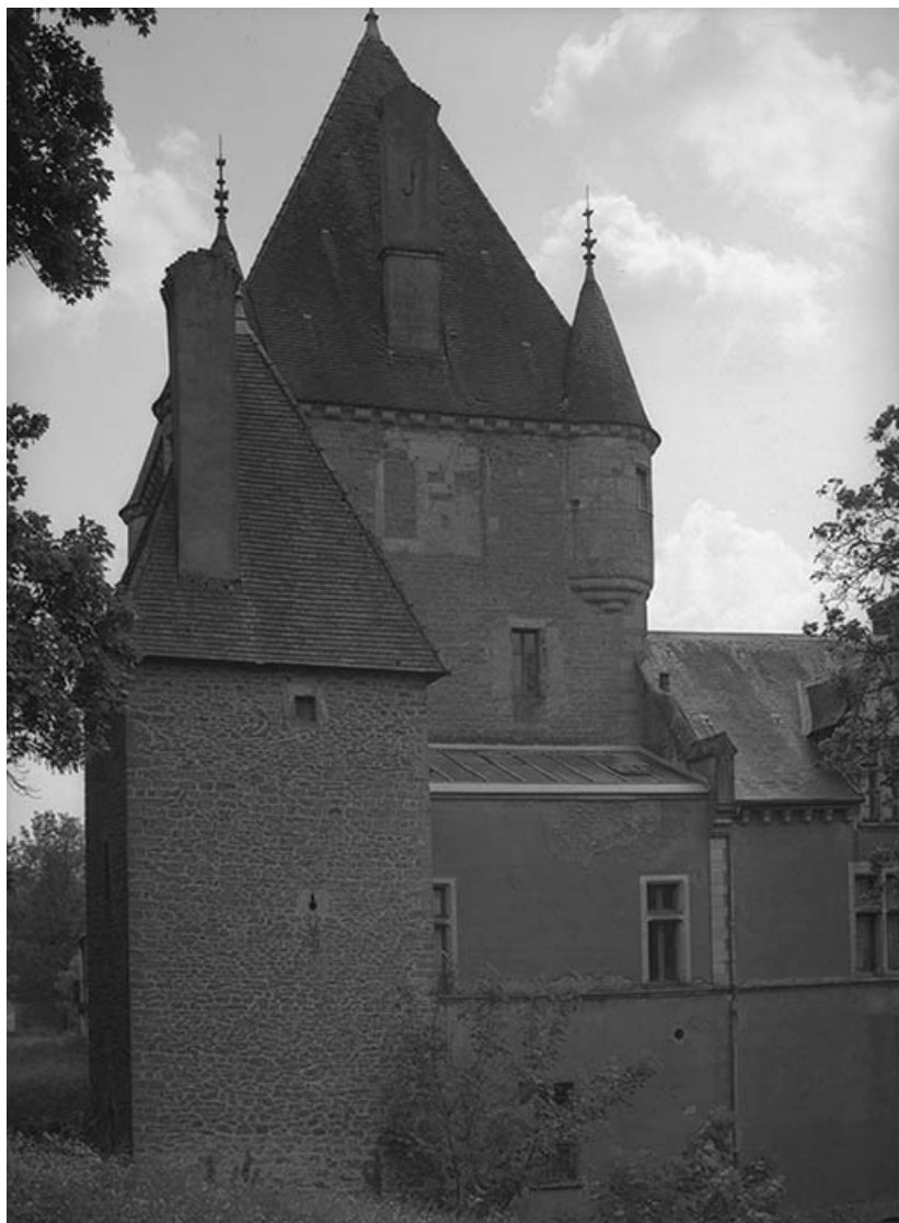
Tour nord-est et donjon, vus depuis le nord.

21, Ivry-en-Montagne R.D. 17 d, lieudit : Coraboeuf