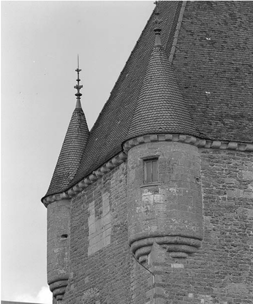
Détail des tourelles en surplomb du donjon.

21, Ivry-en-Montagne R.D. 17 d, lieudit : Coraboeuf