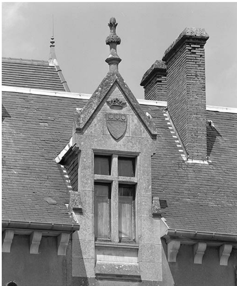
Détail de la lucarne centrale du corps de logis.

21, Ivry-en-Montagne R.D. 17 d, lieudit : Coraboeuf