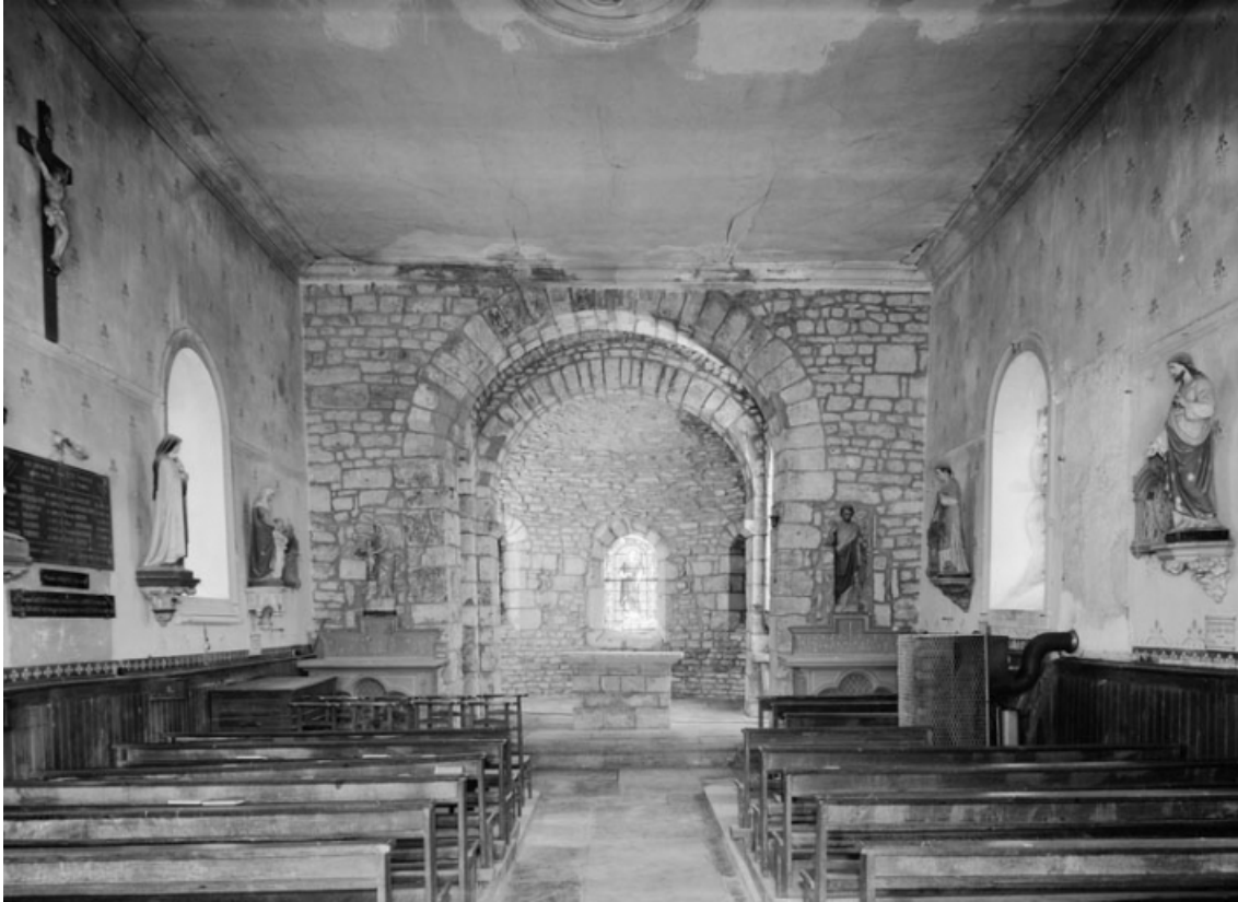
Vue d'ensemble depuis l'entrée.