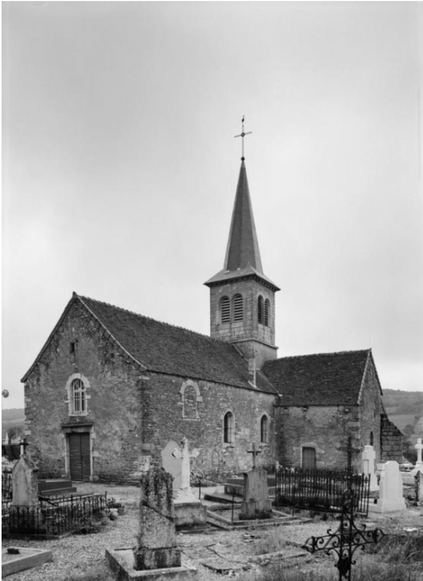
Vue d'ensemble de 3/4 droit.