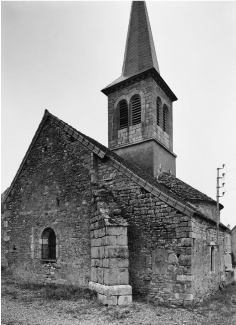
Chapelle vue de 3/4 droit.