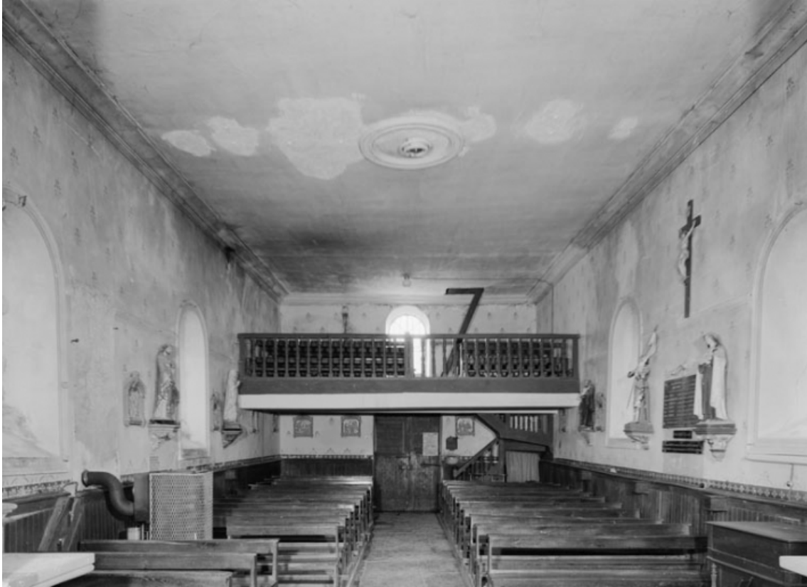
La nef, depuis le chœur.