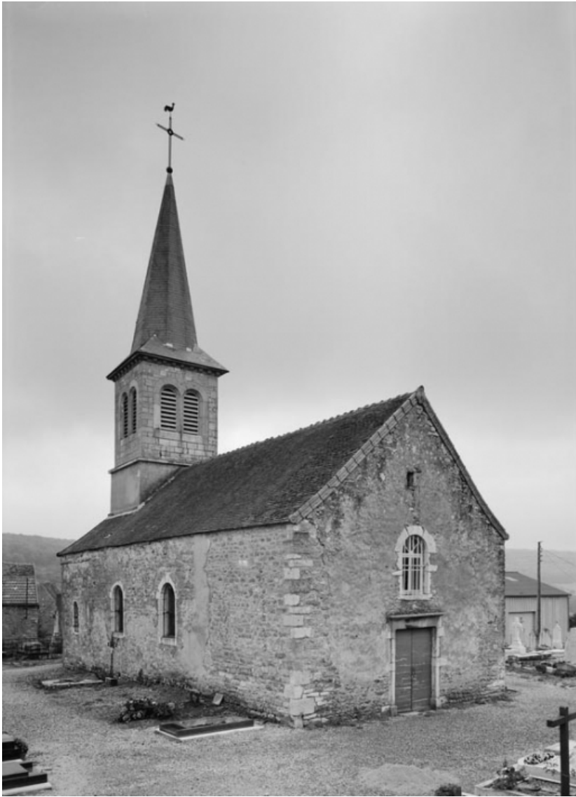
Vue d'ensemble de 3/4 gauche.