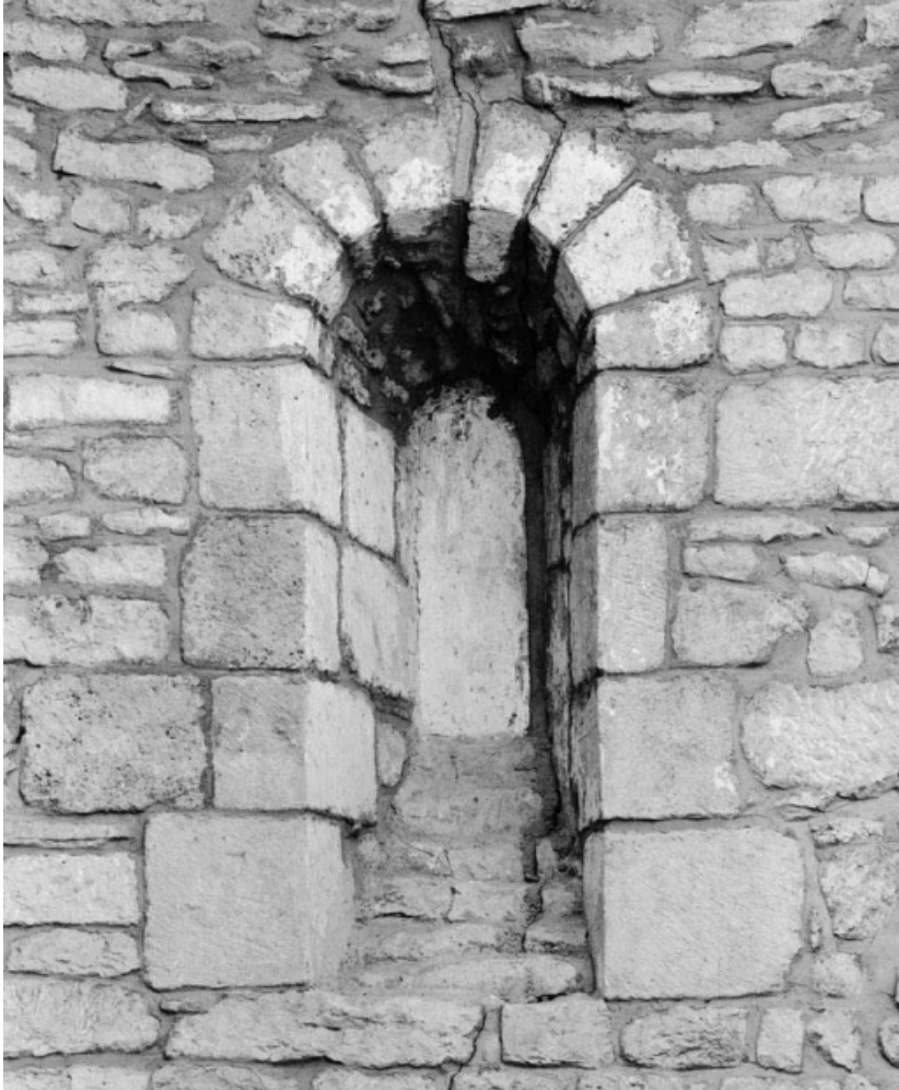
Détail d'une petite baie murée du chœur. 21, Ivry-en-Montagne