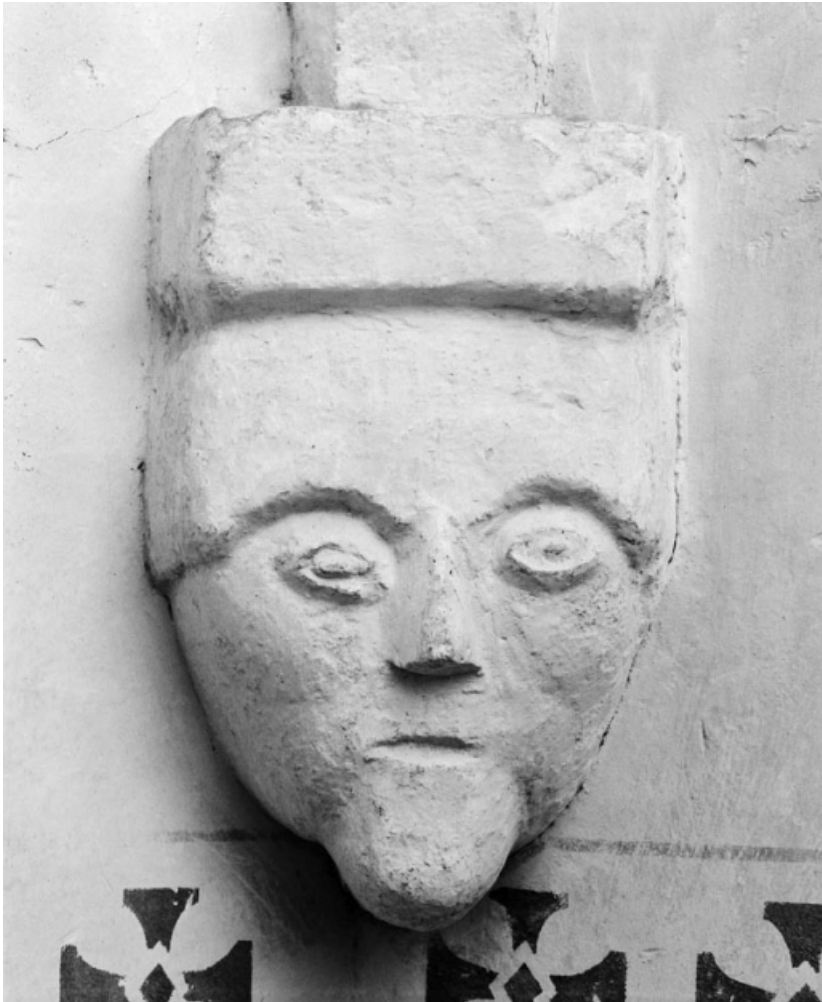
Culot postérieur gauche de la chapelle.