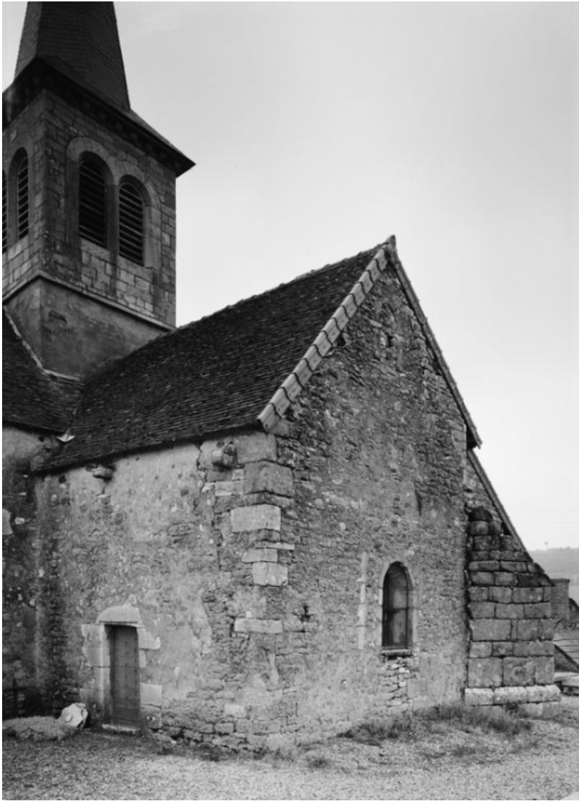
Chapelle vue de 3/4 gauche.