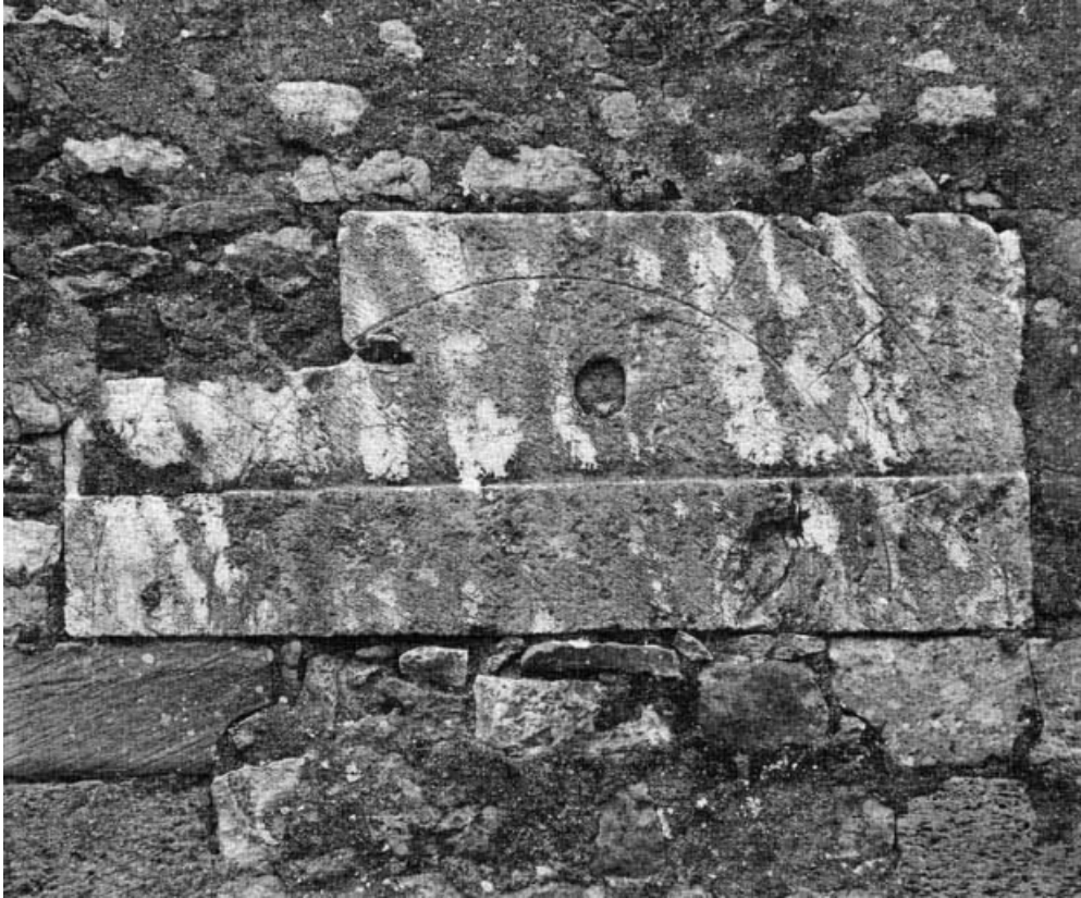
Linteau de la porte murée du mur droit.