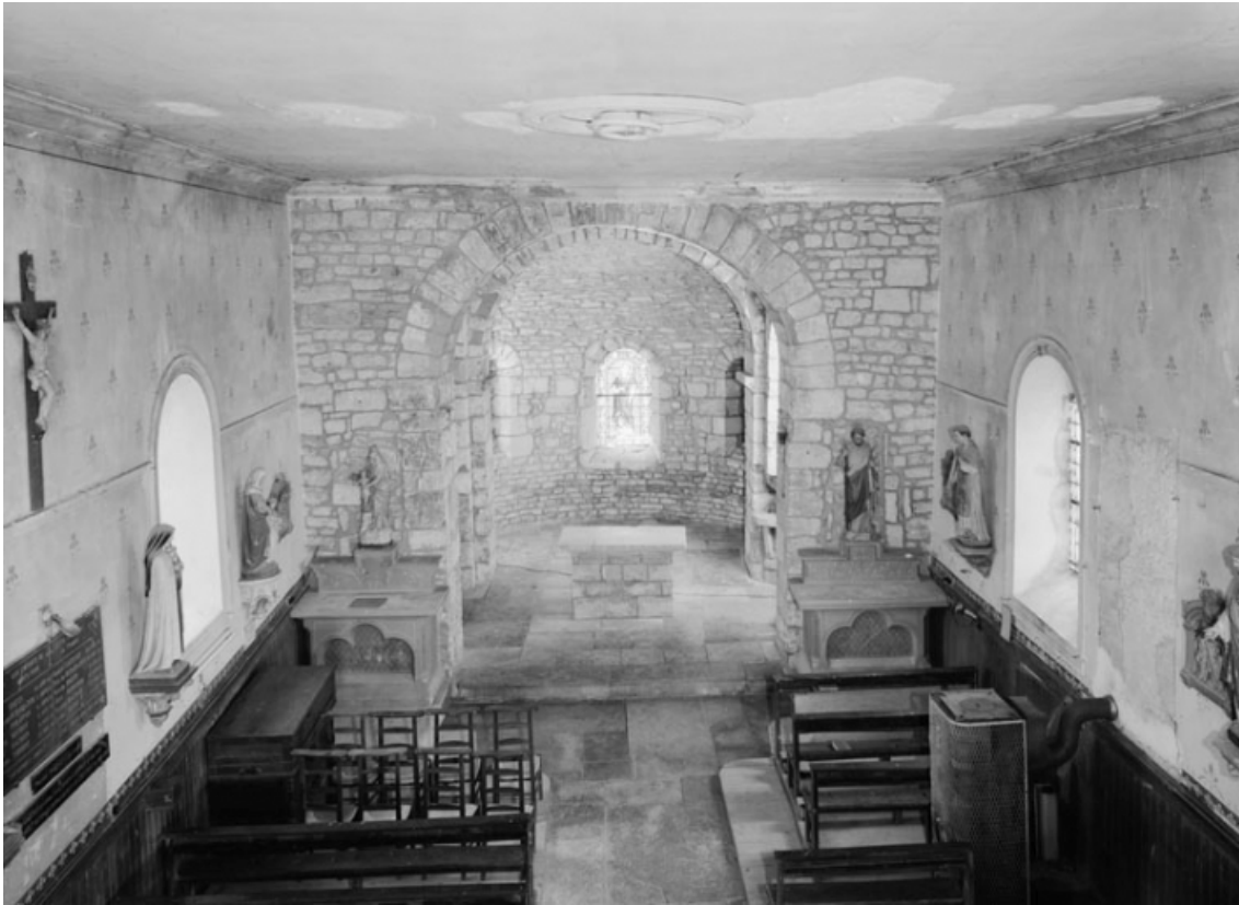
Vue d'ensemble depuis la tribune.