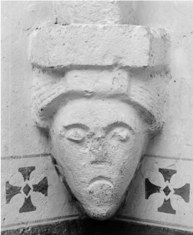
Culot postérieur droit de la chapelle. 21, Ivry-en-Montagne