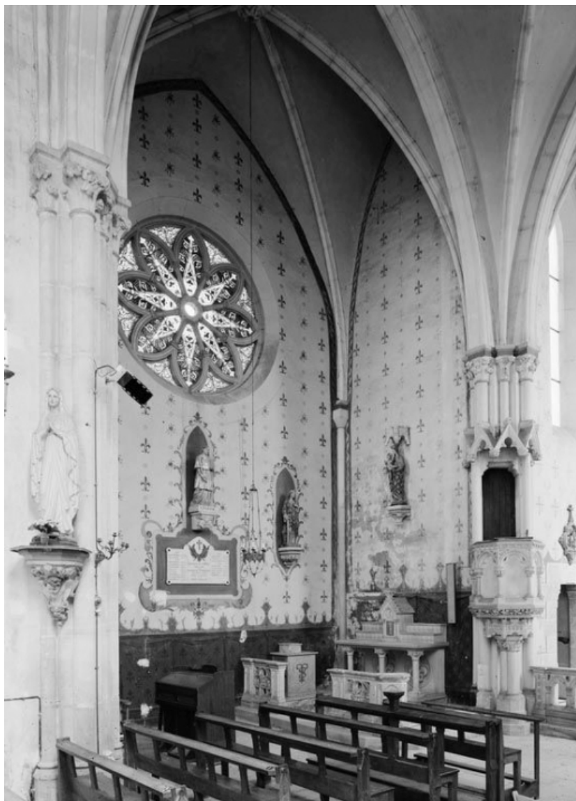
Vue du bras gauche du transept. 21, Corpeau