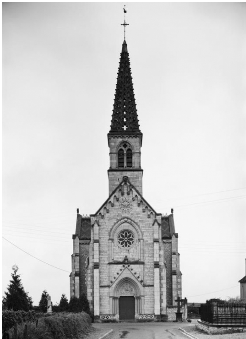
Vue d'ensemble de la façade.