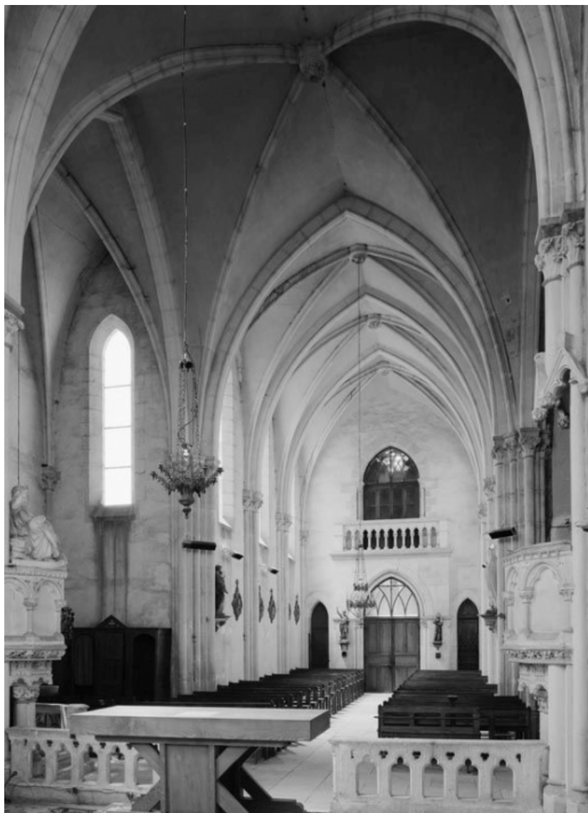
Vue d'ensemble depuis le chœur.